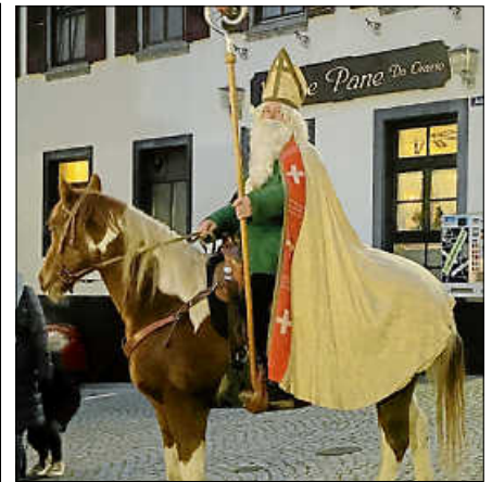
St. Nikolaus reitet durch die Altstadt.

Für einen schönen Rahmen sorgen die Stadtkapelle mit Weihnachtsmelodien sowie Kinder der Grundschule Scheuern, die Weihnachtslieder singen. Des Weiteren erzählt Pfarrer Markus Moser eine Adventsgeschichte. Die Stadtkapelle versorgt Groß und Klein mit Punsch und Glühwein. ■