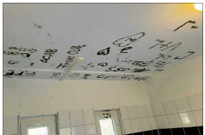
Farbschmierereien an der Decke der WC-Anlage bei der Murginsel.

Sehr bedauerlich ist auch ein Vorfall beim Denkmal am Rumpelstein. Die dort zum Volkstrauertag von der Stadt Gernsbach zur Erinnerung an die Opfer von Kriegen, Gewalt und Terror niedergelegte Blumenschale wurde samt Blumenkranz und Pflanzen zerstört. Auch wenn der materielle Schaden in diesem Fall mit 150 Euro nicht ganz so hoch ist wie in dem Vorfall bei der Murginsel, so ist der immaterielle Schaden für alle Angehörigen und Betroffenen hier besonders hoch