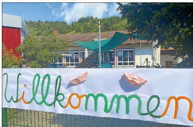
Gute Kinderbetreuung in Staufenberg.

Um das vorhandene Personal möglichst schnell ideal einsetzen und in Teilen entlasten zu können, wird im Falle des Beschlusses eine Umsetzung der ersten Maßnahmenschritte zum Jahreswechsel angestrebt. Der Stadt Gernsbach ist es wichtig, bereits jetzt das Erziehungspersonal, den Elternbeirat und die Eltern der Krippenkinder zu informieren und einzubeziehen. ■