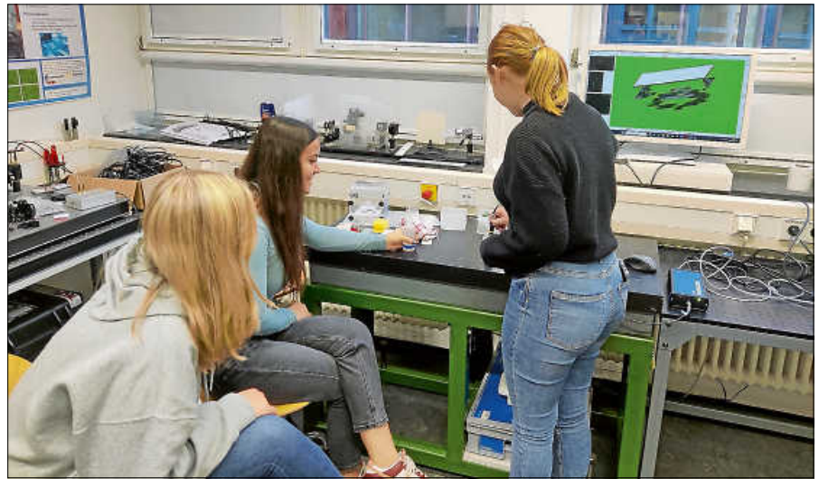
Drei Schülerinnen erproben Experimente zu den Grundlagen der Ultraschalluntersuchung.

Das Leistungsfach Physik des Gymnasiums besuchte gemeinsam mit Lehrer Georg Thome hierfür die Karlsruher Universität. Im KIT-Schülerlabor hatten die Teilnehmer die Möglichkeit, in faszinierende Untersuchungsfelder einzutauchen. Ein besonderes Highlight dieses Tages waren die hautnah erlebbaren Experimente, insbesondere die Grundlagen der Ultraschalluntersuchung, einer Technik, die in verschiedenen medizinischen Anwendungen eine bedeutende Rolle spielt. Neben den Ultraschall-Experimenten konnten Neugierige auch die sogenannte Optische Kohärenztomographie begutachten, wie sie beispielsweise beim Augenarzt zur Bildgebung verwendet wird. Darüber hinaus