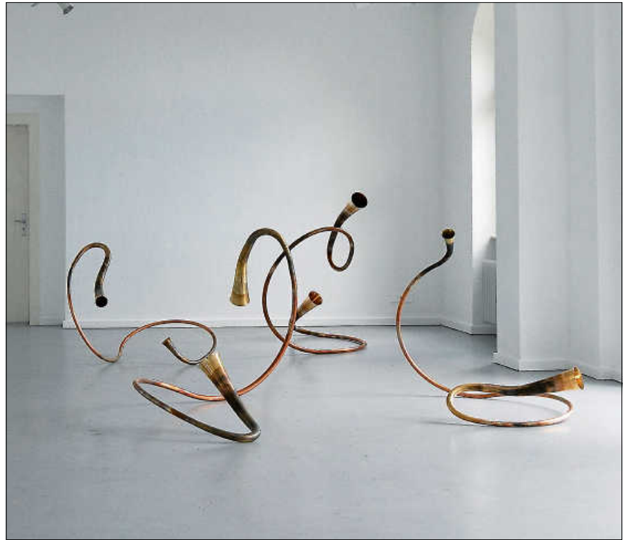
Aus Elementen ausrangierter Klaviere und Teilen von Blasinstrumenten zusammengesetztes Kunstobjekt.

Passend zum ENSEMBLE 4.1 – PIANO WINDTET, einem Quintett aus Klavier und vier Blasinstrumenten, stellt die Baden-Badener Künstlerin ANJA MICHAELA KRETZ Skulpturen und Wandarbeiten aus. Die Werke tragen bedeutungsvolle Namen wie „Der Gesang der Najaden“ oder „Nacht der Delphonien“, „Toccata“ oder „Choral Floral“, die direkt an Musik denken lassen. Aus Elementen ausrangierter Klaviere und Teilen von Blasinstrumenten zusammengesetzt, scheinen sich die raumgreifenden Arbeiten zu einer Melodie zu bewegen, die vielleicht noch in ihrem Inneren gespeichert ist. Sie sind damit ein perfektes visuelles Gegenstück zu dem am Sonntag auftretenden Piano-Windtet. Die Ausstellung ist am Samstag, 9. Dezember, von 14 bis 18 Uhr und Sonntag, den 10. Dezember, von 16 bis 20 Uhr im Foyer der Stadthalle zu besichtigen. Der Eintritt ist frei. ■