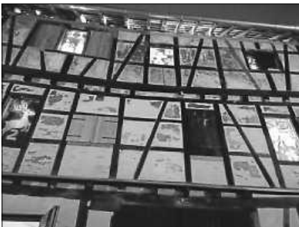
Zehntscheuer zur Amtsstraße mit erleuchteten Adventskalenderfenstern.

Auch in diesem Advent wird sich das prominente Fachwerkgebäude in der Gernsbacher Altstadt in einen großen Adventskalender verwandeln. Diesmal gibt es tatkräftige Unterstützung bei der Gestaltung der bunten Fenster. Viele Gernsbacher*innen, eine Schulklasse und Kindergartenkinder hatten Lust, die bunten Fenster mitzugestalten. Ab Freitag, den 1. Dezember, öffnet sich jeden Tag um 18 Uhr ein Fenster der Zehntscheuer und gibt ein hinterleuchtetes Fensterbild preis. An manchen Tagen wird sich zusätzlich das große Tor öffnen und eine kleine Aktion den besonderen Tag feiern und das Publikum verzaubern. Die Besucher dürfen sich dann über ein Musikstück, ein Gedicht, ein Lied oder eine Geschichte freuen. Das Forum Zehntscheuern lädt herzlich ein, dem Öffnen der Fenster beizuwohnen.