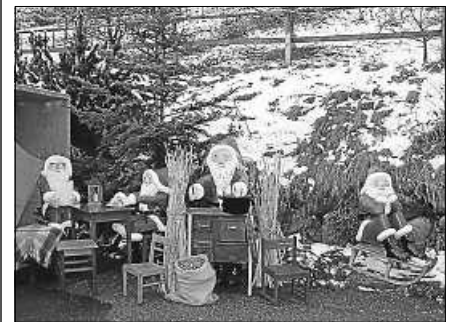
Am Wochenende ist Nikolausmarkt in Staufenberg.

Am ersten Adventswochenende stehen wieder das Himmelstor und die herrlich dekorierten Buden auf dem Parkplatz bei der Staufenberghalle für Besucherinnen und Besucher bereit. Ein Plakat, das von den Kindern des Kinderhauses Staufenberg entworfen wurde, weist schon seit einigen Tagen in einigen Geschäften in und um Gernsbach auf den 27. Nikolausmarkt hin.