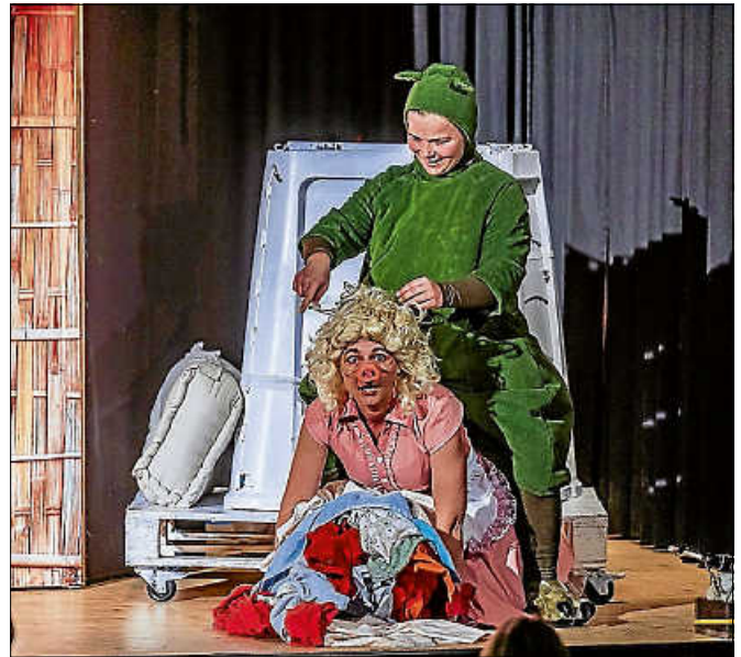
Urmel aus dem Eis.

Karten sind erhältlich im Vorverkauf zu 6 Euro auf allen Plätzen im Kulturamt Gernsbach. Eintrittskarten zum Weihnachts-