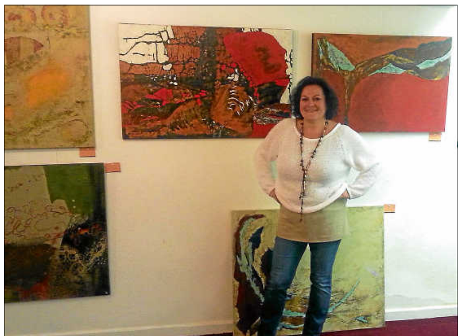
Pop-Up-Kunstausstellungen in den ehemaligen Räumen des Sonnenstudios.

Die Ausstellung und der Pop-Up-Store in der Hauptstraße 12 sind für alle Interessierten vom 8. bis zum 10. Dezember geöffnet: Freitag 15 bis 19 Uhr, Samstag 14 bis 19 Uhr und Sonntag 11 bis 19 Uhr. Der Eintritt ist frei. ■