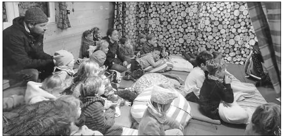
Gespannt lauschen die Kinder den Geschichten

Der Obst- und Gartenbauverein Staufenberg nimmt erstmals am Staufenberger Nikolausmarkt am kommen-