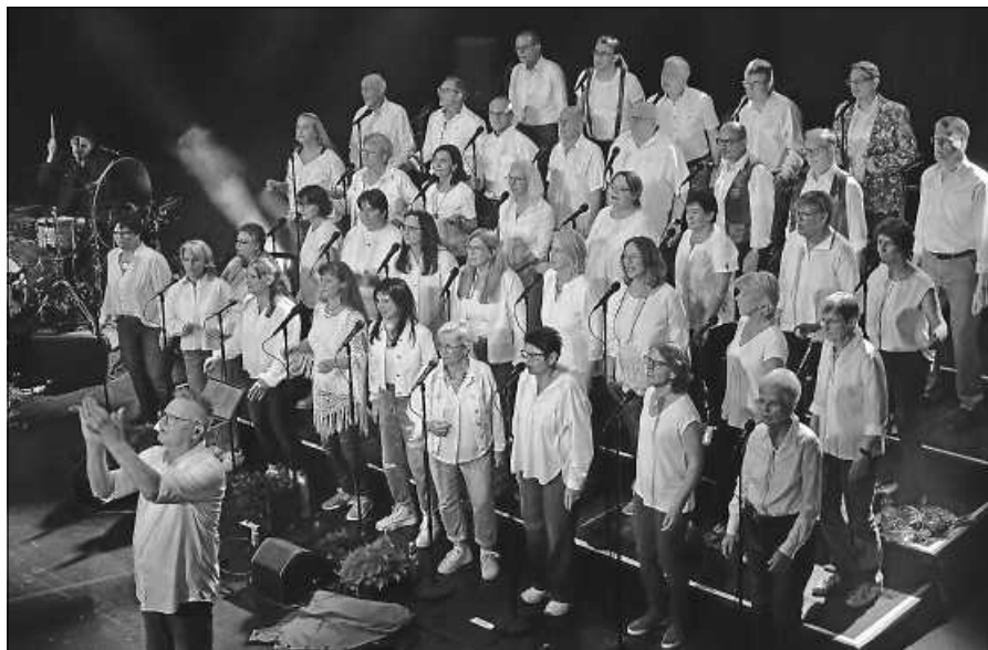
Salt o vocale.

Wer die Zeit des Advents und der Vorweihnachtszeit liebt, darf sich dieses Konzert am zweiten Adventssonntag nicht entgehen lassen. Hören, genießen, mitsingen. Eine gute Stunde Chormusik mit Texten und Melodien, die etwas zu sagen haben. Salt o vocale, wie man den Chor kennt, mit Stimmkraft, Emotionen, in verschiedenen Sprachen und in einem besonderen Ambiente. Die katholische Liebfrauenkirche in Gernsbach bietet den Rahmen für das Weihnachts-Mitsingkonzert des modernen gemischten Chores am Sonntag, 10. Dezember, um 18 Uhr. Der Eintritt ist frei, Spenden sind willkommen. Zudem gibt es am Donnerstag, 14. Dezember, ab 19.30 Uhr ein weiteres Mal die Gelegenheit, Salt o vocale unter der Leitung von Achim Rheinschmidt auf der Himmelsbühne des Baden-Badener Christkindelsmarktes zu genießen. Weitere Informationen findet man auf der Internetseite www.salt-o-vocale.de