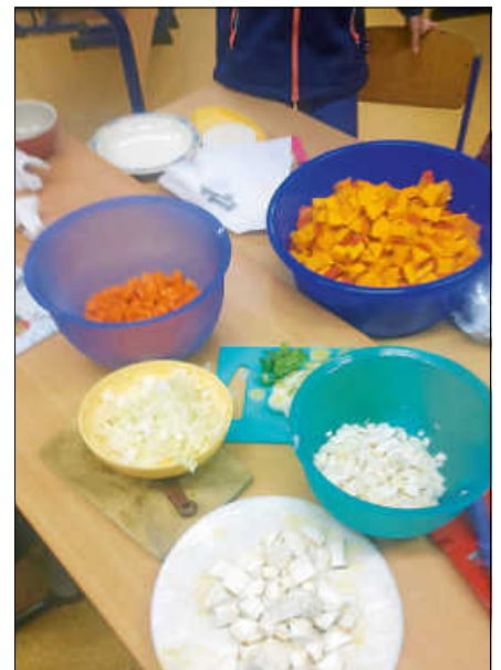
Selbst angebaute und bearbeitete Zutaten.

Aus einer Fläche von knapp einem Quadratmeter haben die Kinder fast 2,5 Kilo Kartoffeln geerntet. Auch Kürbisse waren angepflanzt worden, haben aber keinen großen Ertrag gebracht, deshalb wurden zusätzlich Hokkaido-Kürbisse gekauft, die dann ebenfalls zu einer leckeren Kürbissuppe zubereitet wurden. Ein Vergleichessen ergab dabei einen leichten Vorsprung für die Kürbissuppe. Da alle Arbeitsschritte von den Schülerinnen und Schülern selbst durchgeführt worden sind, war der Appetit entsprechend und auch der Stolz über das selbst gekochte Essen riesen groß. ■