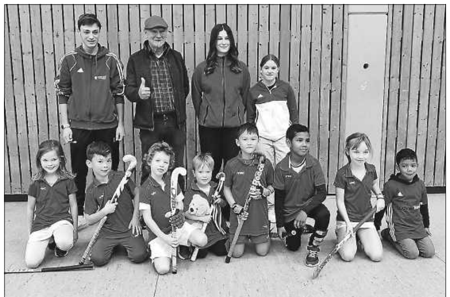
MU 8 des Hockey-Clubs Gernsbach.

jeweils um 9.45 Uhr auf dem Wohnmobilstellplatz in Obertsrot (Freibad Obertsrot). Die Bautermine gehen bis