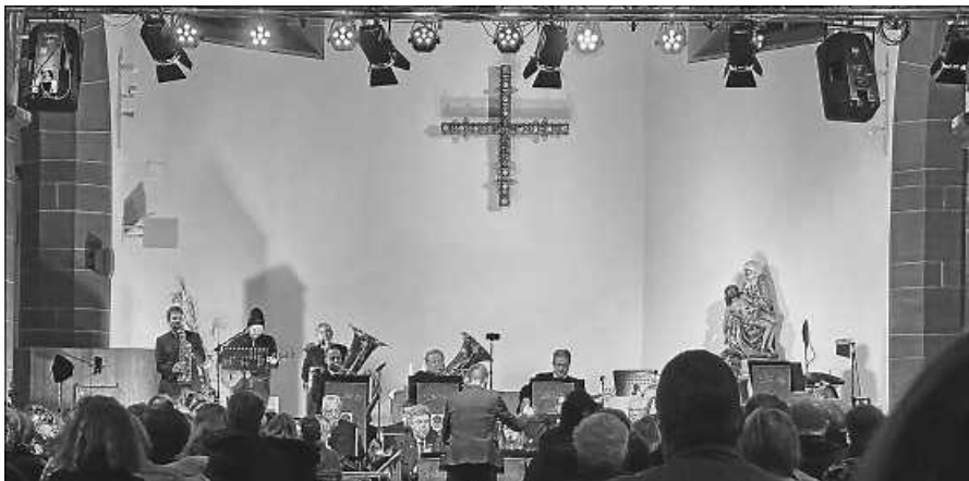
Ein gelungenes Jubiläumskonzert.