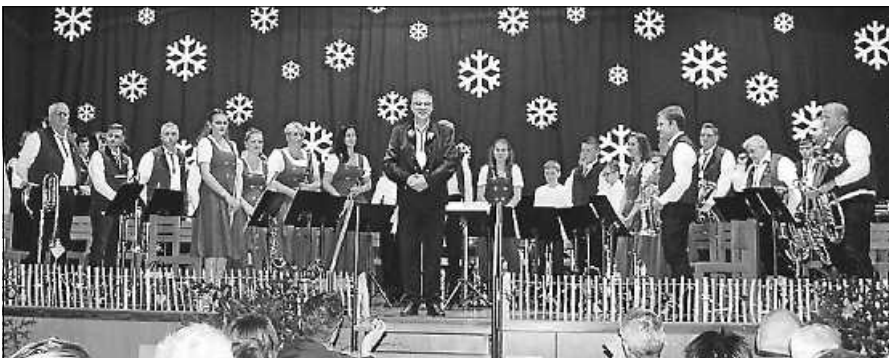
Die Lautenbacher Musikanten beim letztjährigen Adventskonzert.

Am Sonntag, 3. Dezember, öffnen sich die Pforten des Bürgerhauses um 15 Uhr zum Einlass für das diesjährige Adventskonzert. Konzertbeginn ist um 16 Uhr. Die Gäste erwartet auch dieses Mal ein sehr abwechslungsreiches musikalisches Programm. Die Jungmusikerinnen und -musiker eröffnen den Nachmittag mit einem Weihnachtsduett und drei Musikstücken