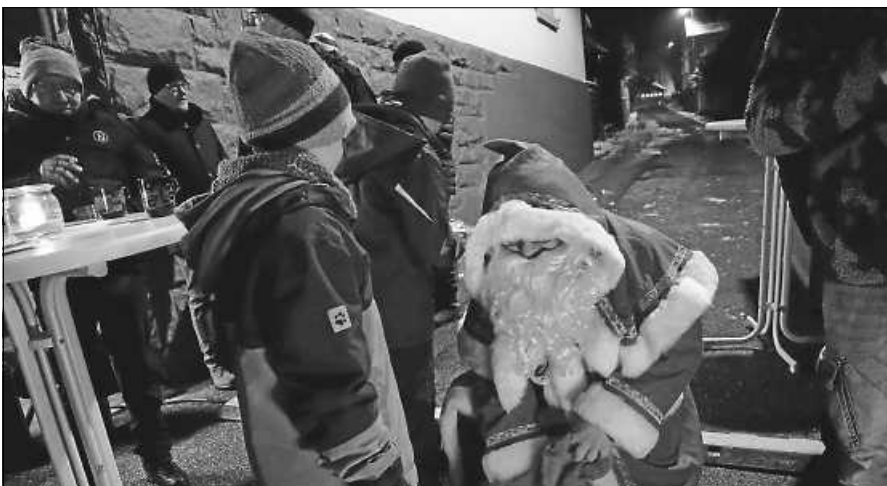
Weihnachten am Sternen.

Der Scheuerner Fasnachtsclub möchte die Bevölkerung schon jetzt auf „Weihnachten am Sternen“ aufmerksam machen.