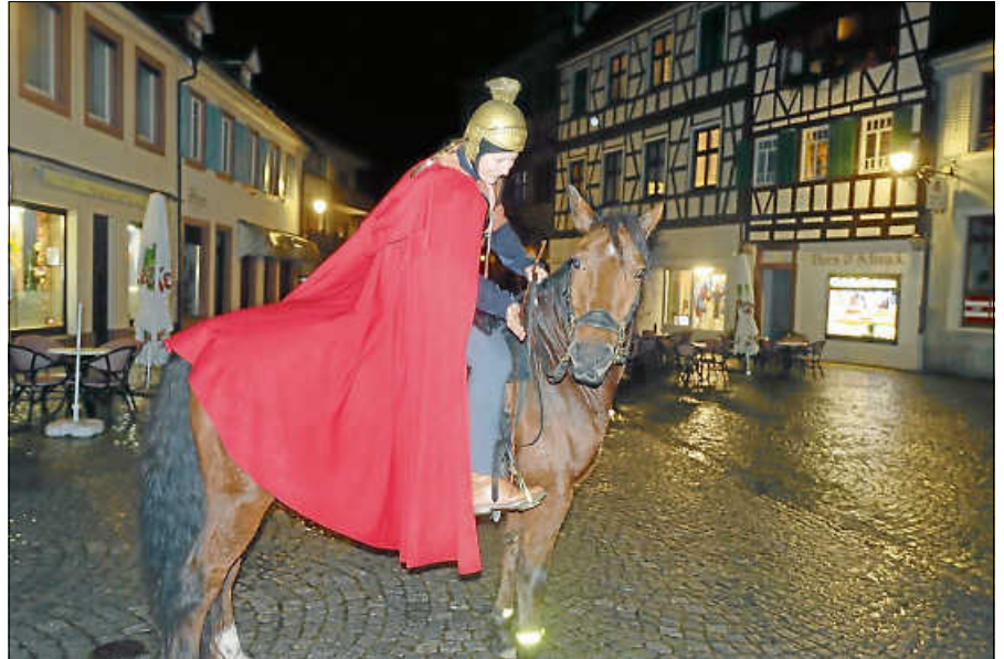
Hoch zu Pferde führte „St. Martin“ den Umzug durch die Altstadt an.

Nun folgte das Vorspiel der Martinslegende durch die diesjährigen Vorschulkinder. Dabei gingen alle Kinder in ihren Rollen auf und begeisterten die Gottesdienstteilnehmenden mit ihrem Auftritt und dem anschließenden traditionellen Sankt Martinslied. Claudia Mnich begleitete den Gottesdienst musikalisch.