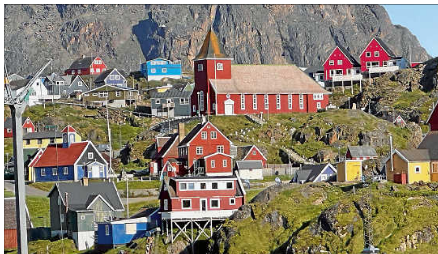
Die Siedlung Appilattoq im Süden Grönlands.

Das Durchfahren des Prins-Christian-Sunds und der Disko-Bucht gehören sicherlich zu den herausragenden Naturerlebnissen. Bunte, kleine Häuser an der Küste begrüßen die Ankommenden von Weitem, wenn man sich vom Meer aus den Städten nähert. In