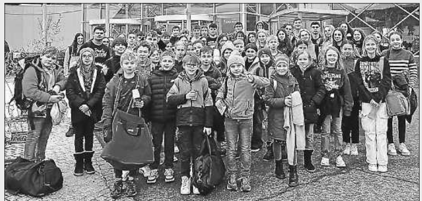
Viel Spaß hatten die „Minis“ im Badeparadies Schwarzwald.

So ging ein toller und erlebnisreicher Tag zu Ende. Alle Beteiligten hatten viel Spaß und freuen sich schon auf die nächste gemeinsame Aktion.