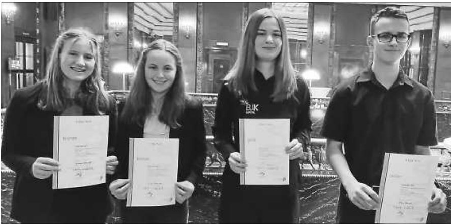
Motivierte Musiker:innen erhielten das JMLA Bronze, Silber und Gold.