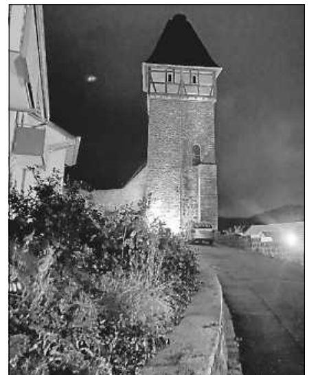
In Orange getaucht kündigte der Storchenturm den Beginn der Orange Days, die Aktion „Nein zur Gewalt gegen Frauen“ an.

Der in orange getauchte Storchenturm kündigte am vergangenen Freitag den Beginn der Orange Days an, die vom 25.11. bis 10.12. dauern und in diesem 16-tägigen Aktionszeitraum auf die Anzeichen sowie Erkennung einer toxischen und missbräuchlichen Beziehung aufmerksam machen wollen. Ziel ist es, die Menschen zu ermutigen, sich über dieses Thema zu informieren oder sich professionelle Hilfe zu suchen. Jeden dritten Tag stirbt in Deutschland eine Frau, ein Mädchen, einen gewaltsamen Tod. Weltweit geschieht dies alle elf Minuten. Hilfsorganisationen für eine persönliche Beratung: www.feuevogel-rastatt.de , 07222 788838, Frauen- und Kinderschutzhause Baden-Baden und Landkreis Rastatt, info@frauenhaus-baden-baden-rastatt.de , 07222/774140.