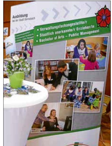
Die Stadt Gernsbach stellt ihre Ausbildungsmöglichkeiten am Messestand vor.

Stadthalle beträgt ca. fünf Minuten. Bei Anreise mit dem Auto kann der Parkplatz am Färbertorplatz genutzt werden. ■