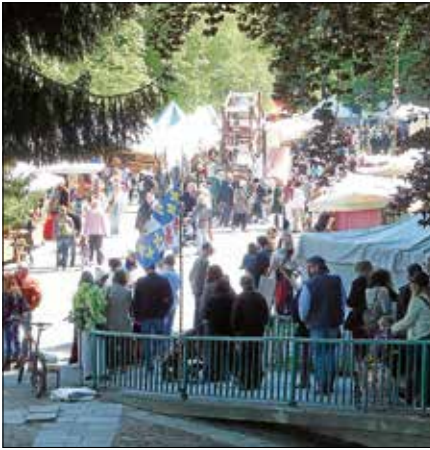
Das Mittelalterfest auf der Murginsel - immer ein Publikumsmagnet.