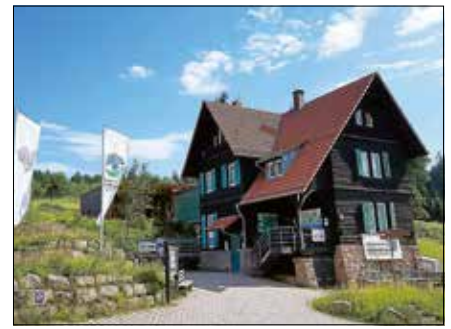
Das Infozentrum gibt die Utensilien für die Müllsammelaktion aus und entsorgt den gesammelten Müll.

plätze von unliebsamem Müll befreit. Jede helfende Hand ist willkommen. Handschuhe, Sammelsäcke und Zangen werden vom Infozentrum Kaltenbronn ausgegeben. Der gesammelte Müll kann am Infozentrum abgegeben werden und wird von dort aus entsorgt. ■