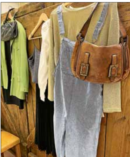
Die Kleidertauschparty in Gernsbach entwickelt sich zum Geheimtipp.