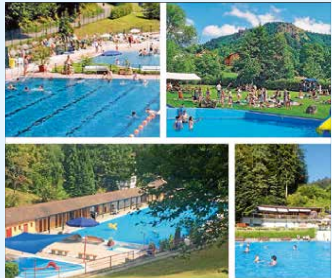
Die Gernsbacher Freibäder v. l. o. im Uhrzeigersinn: Gernsbach, Lautenbach, Reichental, Obertsrot.