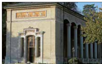
Die Trinkhalle in Baden-Baden.

Weiterer Termin: Mittwoch, 9. Oktober. ■