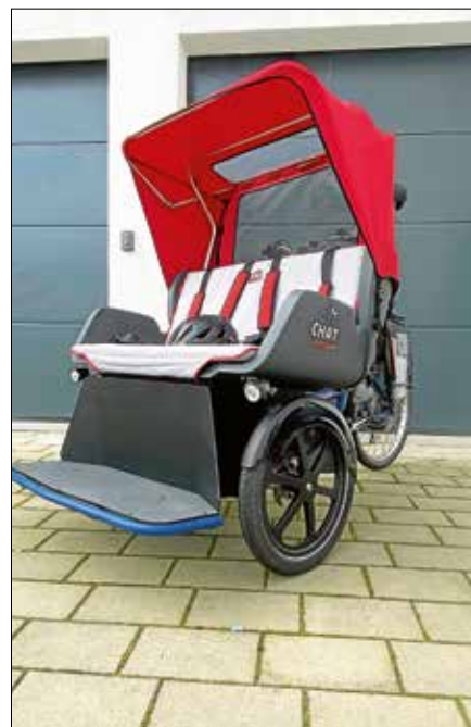
Die Seniorenrikscha für mehr Mobilität.