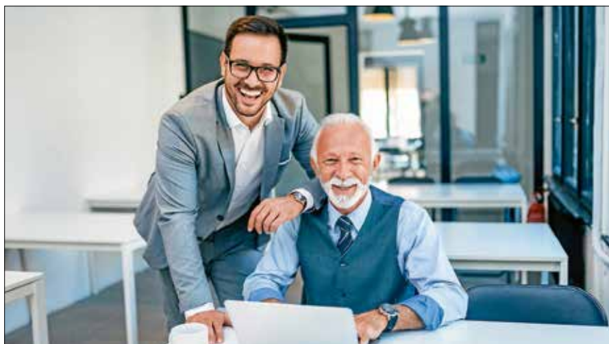
Generationswechsel in Familienunternehmen.

Interessierte werden gebeten, sich bis zum 19. April 2024 unter wirtschaftsfoerderung@gernsbach.de anzumelden. ■