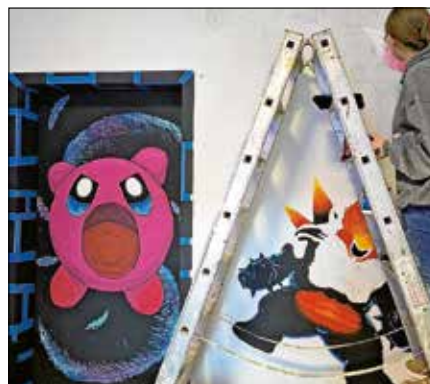
Wandgemälde in der Zockerecke.

unter @jugendhaus_gernsbach und auf der Facebook-Seite. ■