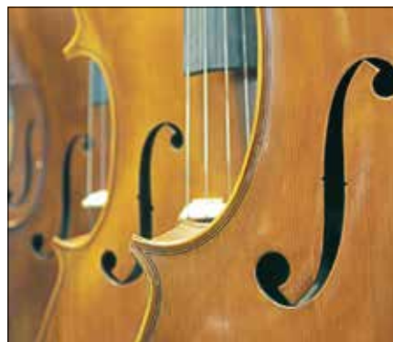
Kammermusik für Streicher.

Eintrittskarten sind im Vorverkauf zu 18 Euro (Mitglieder 14 Euro) im Kulturamt/Touristinfo der Stadt (Tel. 07224 644-446) erhältlich, außerdem bei eventim.de und den Eventim-Vorverkaufsstellen. An der Abendkasse beträgt der Eintrittspreis 20 Euro (Mitglieder 16 Euro). Schülerinnen, Schüler und Studierende haben freien Eintritt. ■