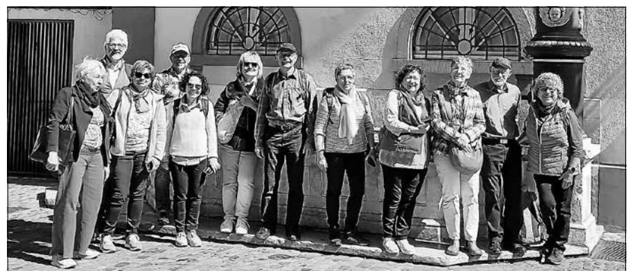
Bei sonnigem Wetter war die Begeisterung der Basel-Besucher groß.

Die Naturfreunde Gaggenau-Gernsbach unternahmen am Donnerstag, dem