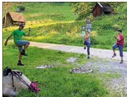
Die Fitnesswanderung führt entlang des Reichenbachs.

Eine Anmeldung bei der Touristinfo Gernsbach unter 07224 644446 ist erforderlich. ■