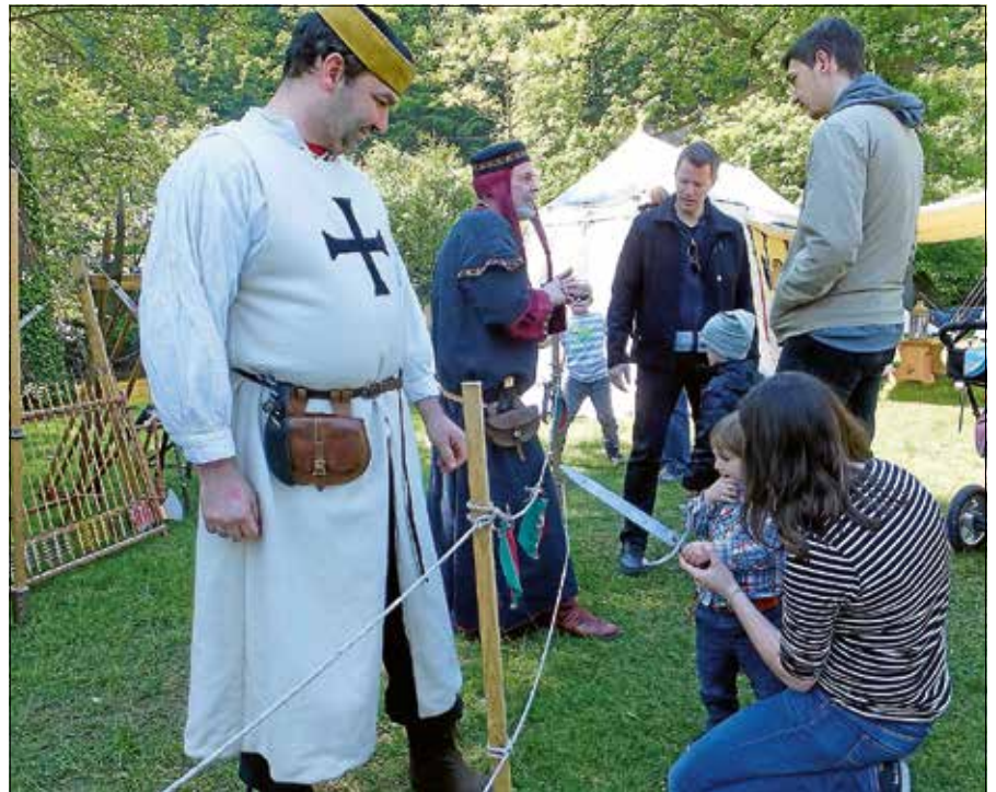
Das Fest bietet Einblicke in mittelalterliche Lebensweisen.