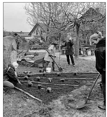
Frauenpower an der Sonnenuhr