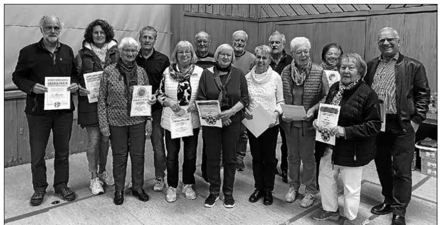
Gehrte Mitglieder des TVL.

Am 15.6. ist ein Ausflug nach Freudenstadt mit Einkehr und Stadtführung geplant. In Schwarzenberg erfolgt der Abschluss.