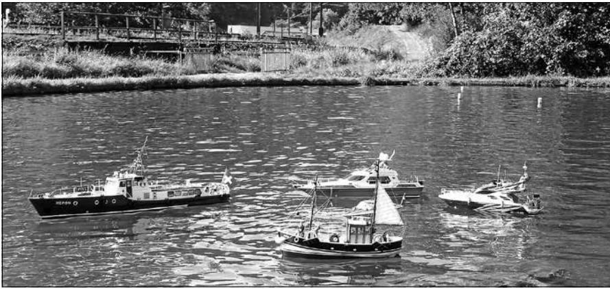
Schiffsmodelle in Aktion.