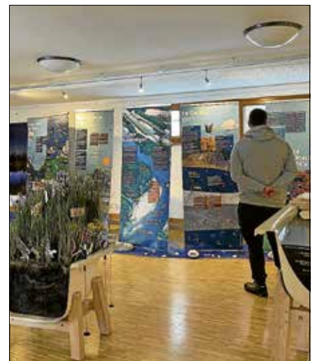
Sonderausstellung „Wasser, Moor & Klima“.

Die Veranstaltung ist für die ganze Familie geeignet und kostet 15 €/Familie mit Kindern ab 5 Jahren. Tickets unter www.infozentrum-kaltenbronn.de/kalender ■