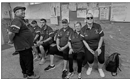
Die Baccarater Boulefreunde.

14 Mitglieder fuhren anlässlich des 60. Jubiläums der Städtepartnerschaft mit zum Partnerschaftsbesuch nach Baccarat. Nach dem gemeinsamen Mittagessen und der offiziellen Veranstaltung fuhren die Boulespieler zu ihren Freunden auf den Bouleplatz. Dort wurde mit gemischt zusammengestellten Mannschaften eifrig um den Sieg gespielt. Ein weiterer Besuch des Gernsbacher Vereins in Baccarat wurde für den 22.06. vereinbart.