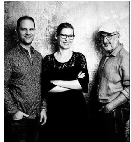
Das Trio „Fülle nach acht“.

Vorschau: am Samstag, 27. April 2024, 20.00 Uhr ist dann das Clown-Duo Dodde und Madde zu Gast im Kirchl. ■