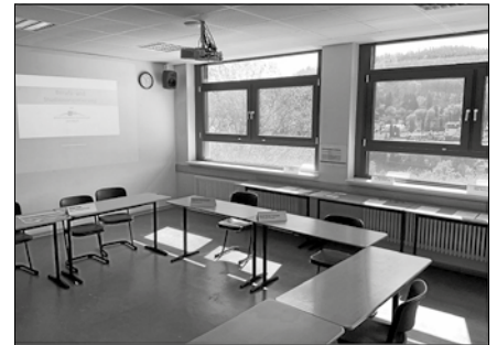
Der vorbereitete Zertifizierungsraum.