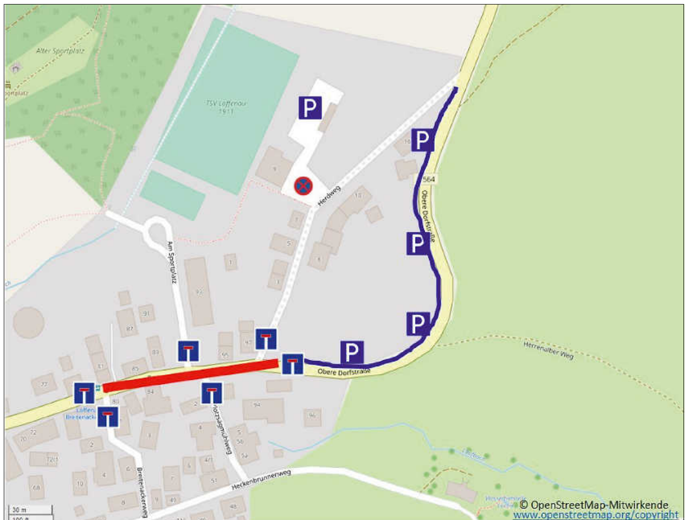
Die Vollsperrung Breitenackerweg bis einschließlich Kreuzung Herdweg in Rot eingezeichnet, die Parkmöglichkeiten für Fahrzeuge aus Richtung Bad Herrenalb in Blau. Foto: Open-Street-Map, Einzeichnung Verkehrsplan Gemeinde Loffenau

Rettungsfahrzeuge und Feuerwehr sind laut der Gemeinde Loffenau informiert und kennen ggf. anzufahrende Ausweichrouten. Für die Müllentsorgung sind Herdweg, Plotzsägmühlweg und Breitenackerweg nicht mehr anfahrbar. Es werden Mülltonnensammelplätze eingerichtet. Die Anwohner wurden per Anschreiben nochmals gesondert informiert. ■