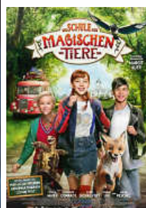
Täglich 16.00 Uhr