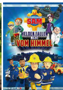
Nur Sonntag 14.45 Uhr