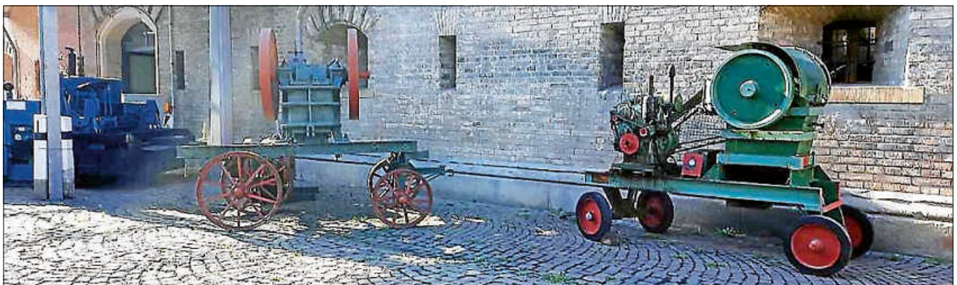
Der historische Steinbrecher aus Gernsbach hat seinen Platz in der Großgeräte-Ausstellung im Deutschen Straßenmuseum Germersheim gefunden.