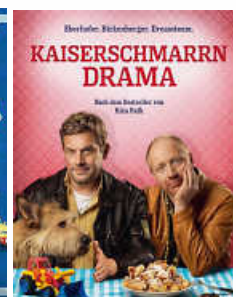
Nur Mittwoch 17.45 und 19.30 Uhr

Bitte Impfnachweis bereit halten und UNAUFGEFORDERT an der Kasse vorzeigen