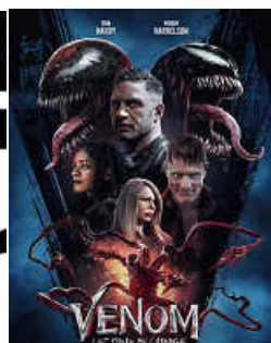
Montag bis Dienstag 17.45 und 19.45 Uhr