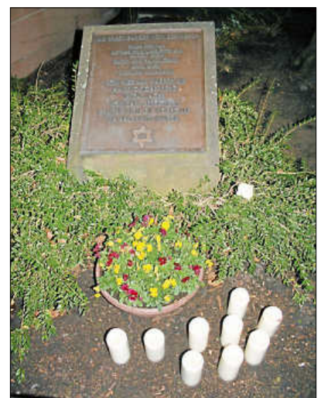
Gedenksteine erinnern in Gernsbach an die im Jahre 1940 deportierten Juden.

Die Gedenkfeier findet am Freitag, 22. Oktober, um 18.00 Uhr am Salmenplatz statt. Die Bevölkerung ist herzlich dazu eingeladen. ■