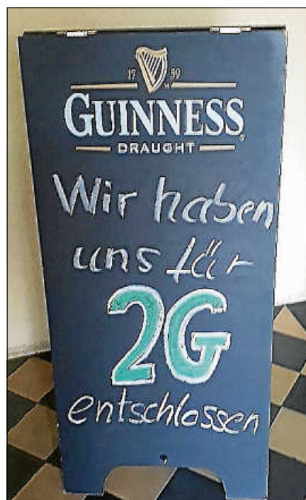
Entscheidet sich eine Einrichtung für das 2-G-Optionsmodell, muss sie dies deutlich kommunizieren.