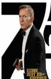
Täglich 16.00 und 19.30 Uhr