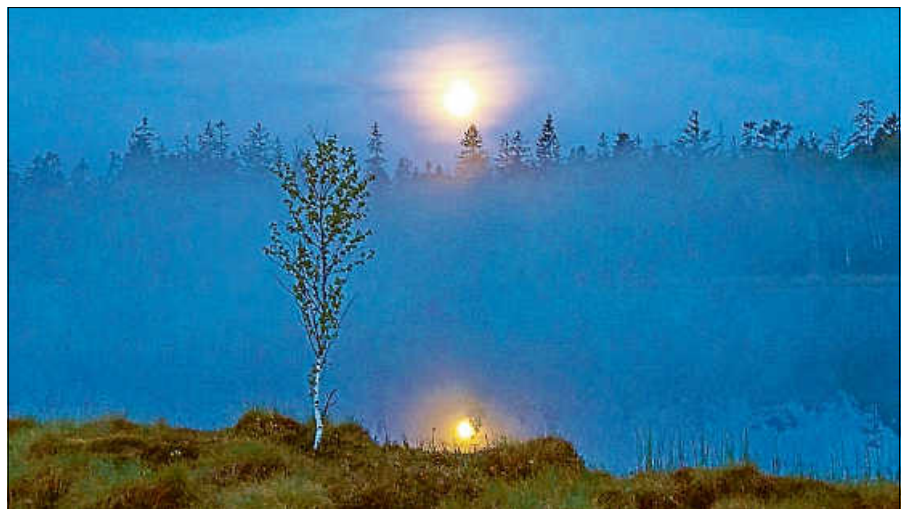
Black Magic Moor

Mystisch, geheimnisvoll, unergründlich? Moorlandschaften regen schon immer die Fantasie der Menschen an. Vielleicht, weil ihnen die Begegnung mit schwarzem Wasser, schwarzer Erde und sogar schwarzen Tieren unheimlich erschien? Mit Naturpädagogin Manuela Riedling geht es am Sonntag, 24. Oktober um 14 Uhr dem Schwarzen auf die