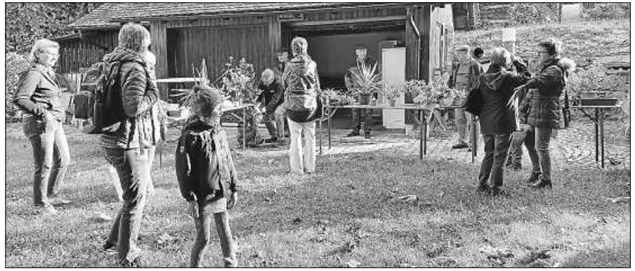
Bei herrlichem Wetter wurde rege getauscht.