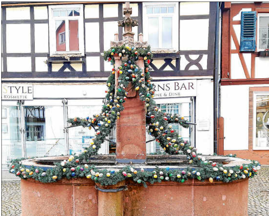
Der schön geschmückte Brunnen an der Hofstätte.