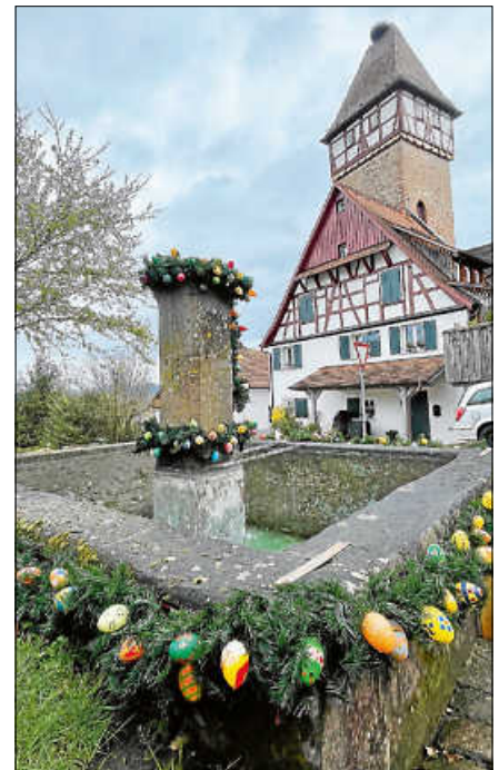
Dieses Jahr sind auch die Brunnen in der Oberstadt geschmückt.