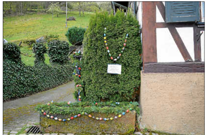
Zwei Brunnen in Lautenbach wurden gemeinsam vom Gemeindeteam und Obst- und Gartenbauverein mit handgefertigten Girlanden aus Naturmaterialien und marmorierten Ostereiern geschmückt.