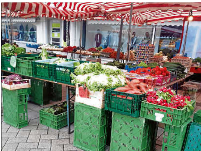
Gemüsestand am Wochenmarkt.

Wegen Karfreitag am 15. April 2022, findet der Wochenmarkt in der Osterwoche am Donnerstag, 14. April 2022 statt.