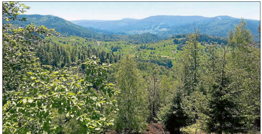
Blick auf die Landschaft um Reichental und das Murgtal.

Eine Anmeldung bei der Touristinfo Gernsbach unter 07224 64444 ist erforderlich. ■