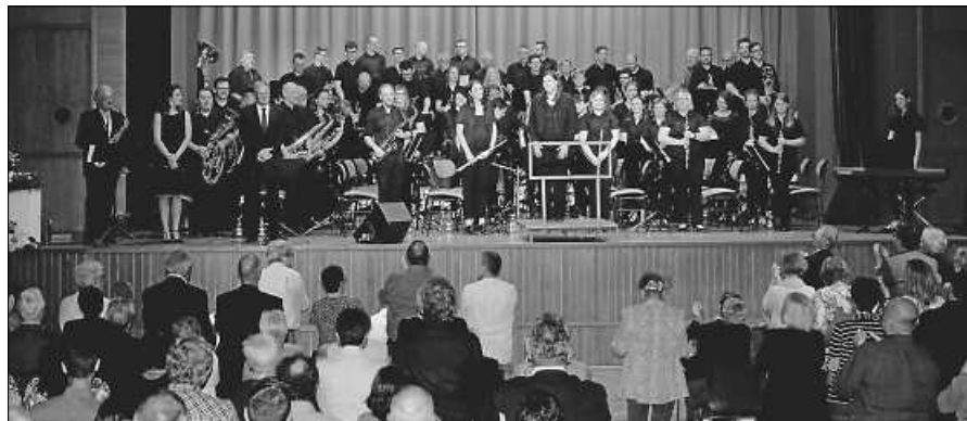
Beim letzten Konzert vor der Coronapandemie erteten die Musiker den stehenden Applaus des begeisterten Publikums.