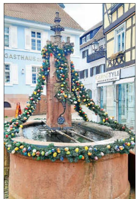
Die österlich geschmückten Brunnen in der Altstadt sind wahre Blickfänge.