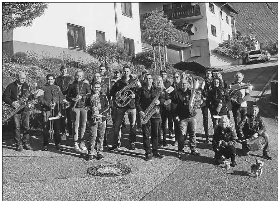
Letztes Spielen in den Mai 2019.

Traditionen waren und sind beim Musikverein Obertsrot e.V. ein fester Bestandteil der Vereinsgeschichte. So auch das bereits seit Jahrzehnten stattfindende Maispielen. Aufgrund der Kommunion in der heimischen Herz-Jesu Kirche am 1. Mai werden die Musikerinnen und Musiker des Musikvereins Obertsrot bereits am Vortag, Samstag der 30. April, den Mai willkommen heißen. Ab 14:30 Uhr können dann an traditionellen Stationen im Ort die vertrauten Melodien des Musikvereins zu hören sein. Nachdem das Maispielen zuletzt 2019 stattfinden konnte, freut sich der Musikverein