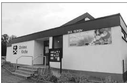
Die Gernsbacher Baptisten laden zum Alpha-Kurs ein.

Dienstag und Mittwoch von 15 bis 18 Uhr Bitte mit Mund-/Nasenschutz