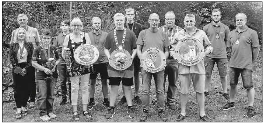
Die Königsfamilie 2021