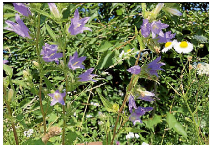
Kräuter am Wegesrand.