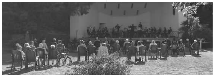
Der Musikverein Obertsrot im Kurpark in Gernsbach.

Der Musikverein Obertsrot gestaltete am Sonntag, 12. September nach eineinhalbjähriger Coronazwangspause seinen ersten Auftritt. Dieser fand bei bestem Wetter im Kurpark in Gernsbach statt. Hier konnten sich die Musikerinnen und Musiker über zahlreiche Zuhörer freuen, die es sich auf den Stühlen, den Kurparkbänken sowie den mitgebrachten Picknickdecken bequem machten. Nach 75-minütigem Programm waren sich die Musikerinnen und Musiker sowie die Zuhörer einig, dass dies ein gelungener Auftakt für eine hoffentlich bessere Zeit war.