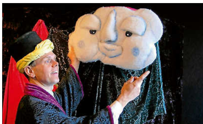
Die verliebte Wolke.