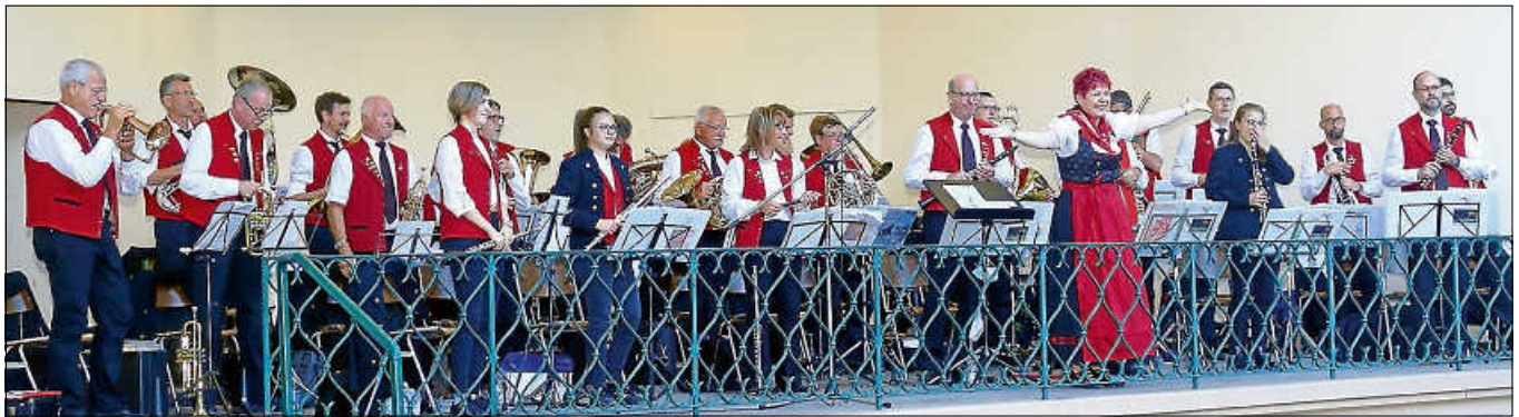
Auch die Stadtkapelle spielt.

Die Grillhütte am Salmenplatz freut sich über Ihren Besuch. ■