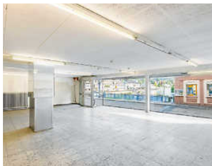
Ausblick aus den Geschäftsräumen des früheren ‚Pfannkuchs‘.

Dort werden Bilder und Berichte über Vergangenheit, Gegenwart und Zukunft der Brückenmühle zu sehen sein. Zudem