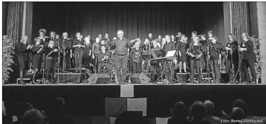
Salt o vocale „Happy together“, wie hier beim Konzert 2019.

Am Mittwoch, 22. September, treffen sich die Mittwochswanderer um 9.45 Uhr am Gernsbacher Bahnhof zur Fahrt nach Bad Rotenfels (Schloss). Die Wanderung führt über die Schöneichhütte, Brünnele bis zu einem kurzen Halt auf dem Kuppenheimer Friedhof. Auf dem Rückweg folgen wir der blauen Raute und dem Murgtalweg bis zum Ausgangspunkt, dem Rotenfelser Schloss. Im Unimog-Museum ist gegen 15 Uhr die Einkehr geplant. Die Strecke ist etwa 12 km, mit 200 Hm lang. Für weitere Informationen: 07224 658854. Wer