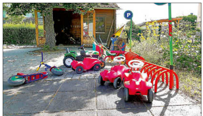
Geparkte Spielfahrzeuge im Kinderhaus Staufenberg.