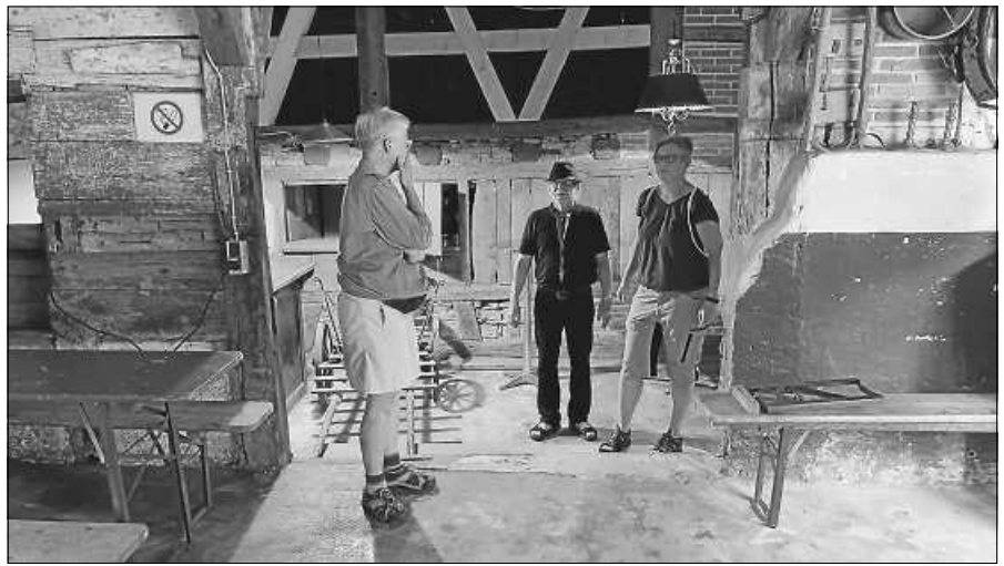
Mitglieder aus dem Vorstand beim letzten Feinschliff der Gestaltung, wie man es erkennen kann.

Da das Sommerfest im letzten Jahr ein so großer Erfolg war, freuen wir uns darauf auch dieses Jahr möglichst viele Freunde, Gönner und Mitglieder des HCG begrüßen zu dürfen. Der Tag startet