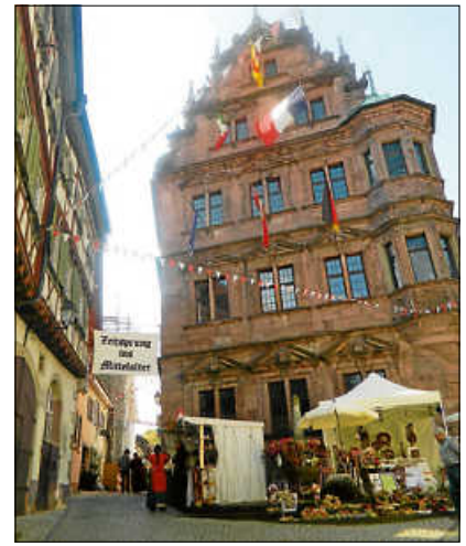
Blick auf das Alte Rathaus und die Mittelaltergasse

Die Stadtverwaltung bittet alle Anwohner der Amtsstraße und der Storrentorstraße, ihre Fahrzeuge bereits ab Donnerstag, 15. September, außerhalb des Festbereichs zu parken, ebenfalls wird gebeten, die Mülltonnen bereits ab Donnerstag anderweitig unterzustellen. Die Gruppe ProHistory wird mit den Aufbauarbeiten für den Mittelaltermarkt am Freitag, 16. September, ab 6 Uhr beginnen.