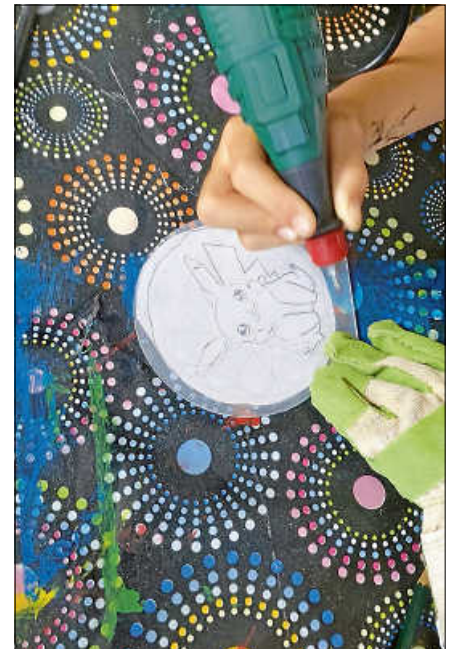
LED Lampen basteln.