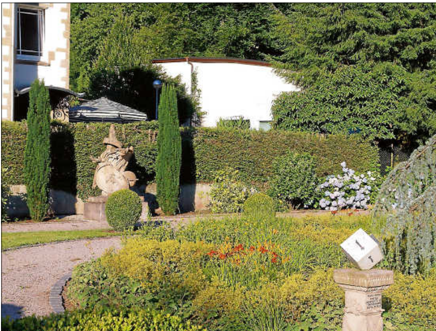
Sonnenuhr am Clemm’schen Garten.

Die Führung ist kostenlos, eine Anmeldung bei der Touristinfo unter 07224 644446 ist erforderlich.