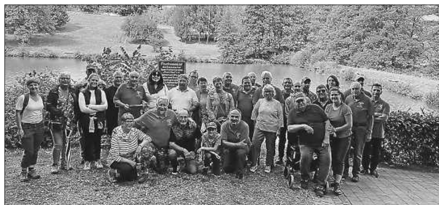
Die Angelfreunde aus Gernsbach und Baccarat.

Am Nachmittag verweilte man bei Kaffee und Kuchen im Schatten der Fischerhütte. Gegen 17.30 Uhr verabschiedete man sich mit vielen Umarmungen, nicht ohne darauf zu bestehen, dass die Gernsbacher Angler sich im Sommer nächsten Jahres zum Gegenbesuch nach Baccarat aufmachen müssen, um den „Bachamois“ wieder Gelegenheit zu geben, ihre Gastfreundschaft in gleicher Weise unter Beweis zu stellen. Es war nach Meinung aller wieder ein rundum sehr gelungener Tag.