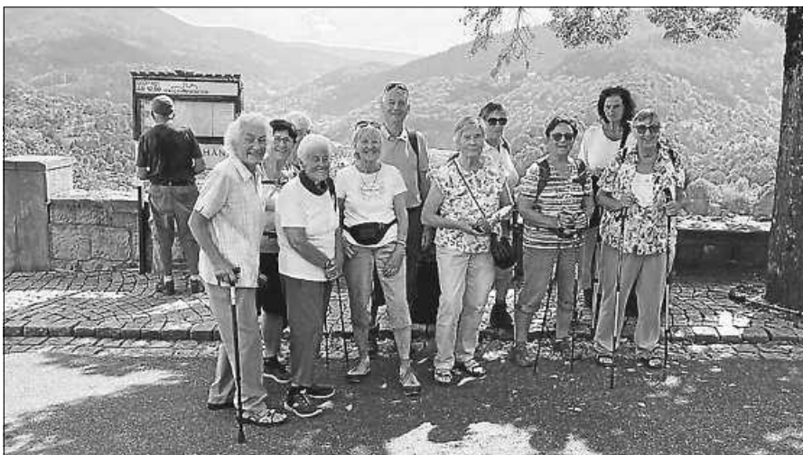
Dienstagswanderer am Gernsbacher Schloss.