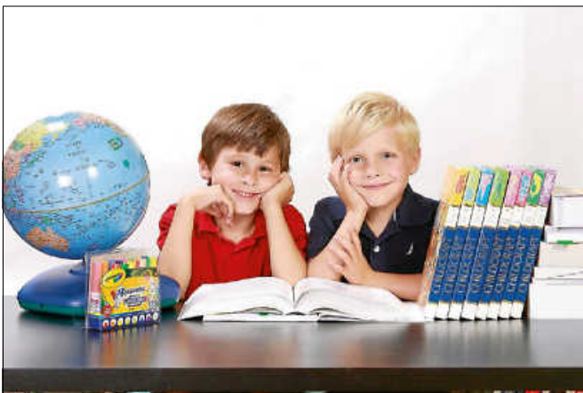
Unterstützung zum Schulanfang.