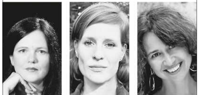
Die Musiker:innen der Formation tomaris & friends.