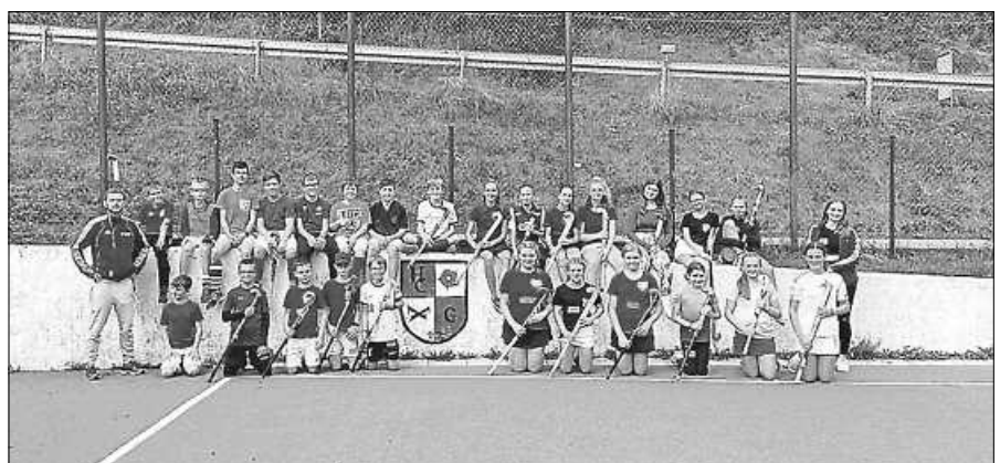
Freundetag beim HC Gernsbach.

Ort: Kloster Sankt Trudpert im Münstertal. Der Unkostenbeitrag beträgt für