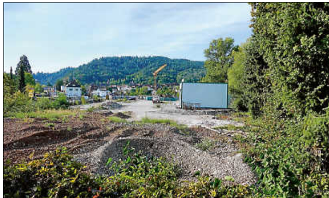
Erfolgreiche Altlastensanierung beim Pfeleiderer-Areal.

Hier die Bilanz in Zahlen: Rund 8.600 kg Quecksilber, 750 kg Arsen und 3.700 kg Teeröle/PAK wurden mit dem Bodenaushub aus dem Untergrund geholt und fachgerecht entsorgt – Das sind insgesamt mehr als 13 Tonnen Schadstoffe.