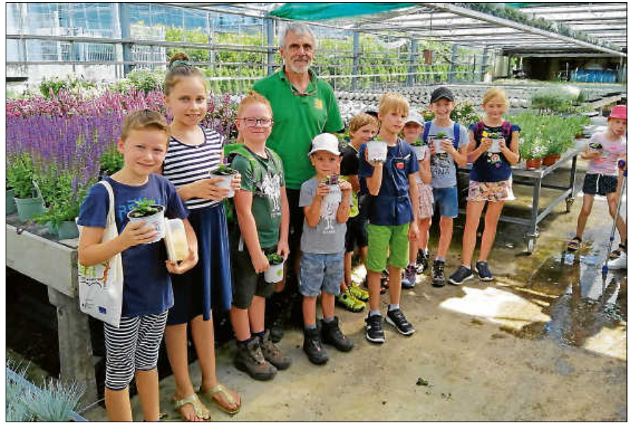
Bei der Gärtnerei.

Weiter ging es mit der Büchertauschbörse, einem Besuch bei der Gärtnerei Leiber, mit dem Flammkuchenbacken mit dem OGV Obertsrot-Hilpertsau und einem Spielenachmittag in der Bücherei. Das Jugendhaus war dieses Jahr zum ersten Mal als Veranstalter mit dabei und veranstaltete eine Zirkuswoche, Tanzworkshops, eine Caching-Schnitzeljagd, DIY Jewellery und Plitsch-Plitsch-Wasserspaß.