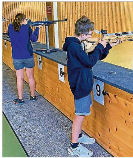
Beim Schützenverein Obertsrot.