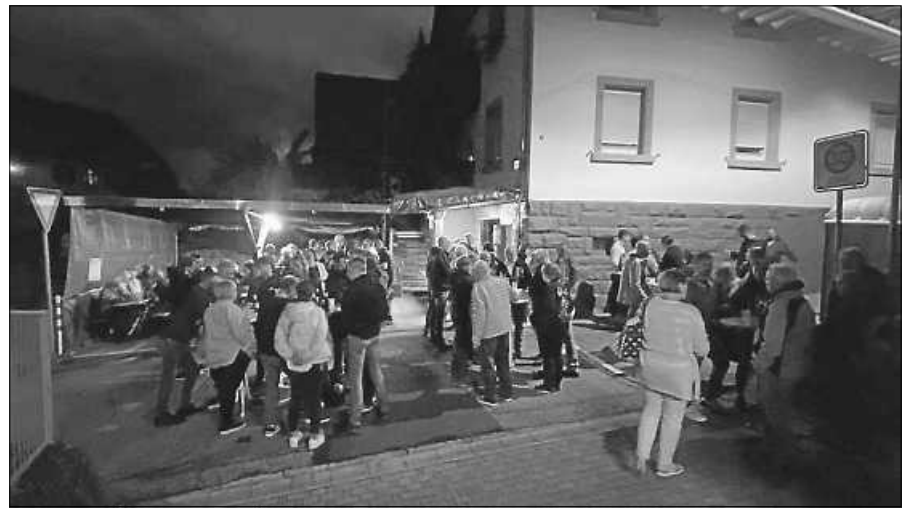
Reges Treiben am Sternenplatz.

Der Scheuerner Fasnachtsclub freute sich über den Besuch aller Bürgerinnen und Bürgern beim 1. Dorfhock am Sternenplatz. Trotz einiger Regenschauer herrschte gute Stimmung unter den Anwesenden und viele nette Gespräche wurden geführt. Am Ende konnten alle, nach dem Verzehr einer Wurst, eines Grillkäses und gekühlter Getränke, ein paar Stunden später zufrieden nach Hause gehen. Der SFC freut sich jetzt schon auf „Weihnachten am Sternen“.