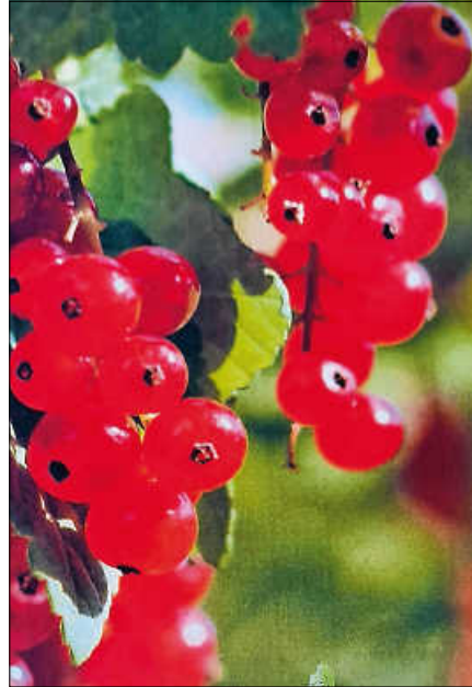
Ob Rot, Weiß oder Schwarz: Beim Schleckselwettbewerb dreht sich in diesem Jahr alles um heimische Johannisbeeren.