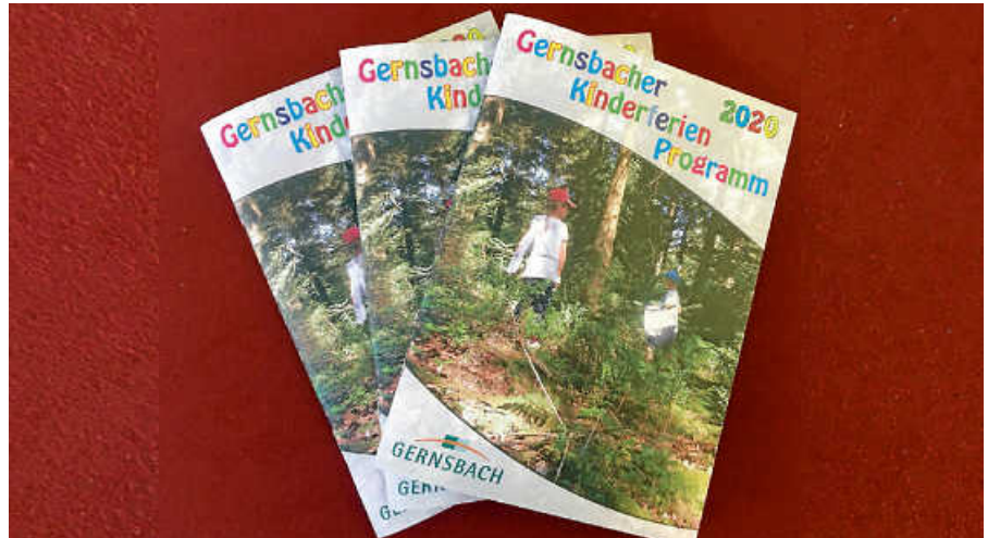
Das Gernsbacher Kinderferienprogramm.

Wir nehmen an einer Führung durch das Unimog-Museum teil und haben anschließend noch die Möglichkeit, im Unimog auf dem Außenparcours mitzufahren. Diese Fahrt muss gesondert bezahlt werden und ist nicht im Teilnahmebeitrag enthalten. Kosten zusätzlich 5 €. Kinder ab 7 Jahre, 8.30 - 13.00 Uhr, Bahnhof Gernsbach, Stadt Gernsbach