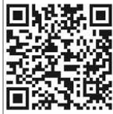
Trailer zum Nehemia-Film

- Jehova schenkt euch Freude, die euch stark macht! - Teil 2" ausgehen wird. Der Schlussvortrag wird das Tagesmotto näher erklären: „Hab größte Freude an Jehova und er wird dir deine Herzenswünsche erfüllen“ (Psalm 37:4).