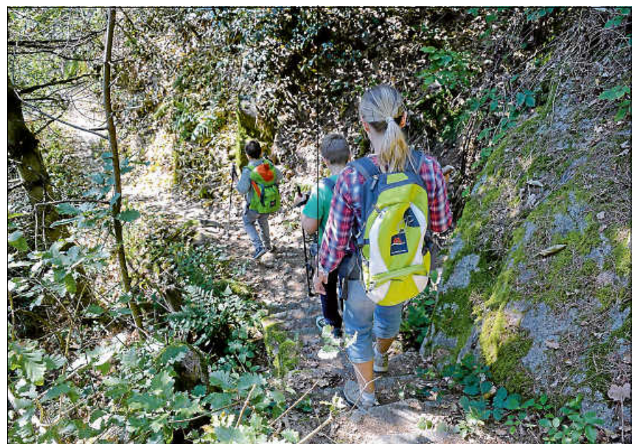
Familie unterwegs auf dem Sagenweg.

Scheffelstraße – Stadtbrücke – Hofstätte – Am Rumpelstein – Schöne Aussicht