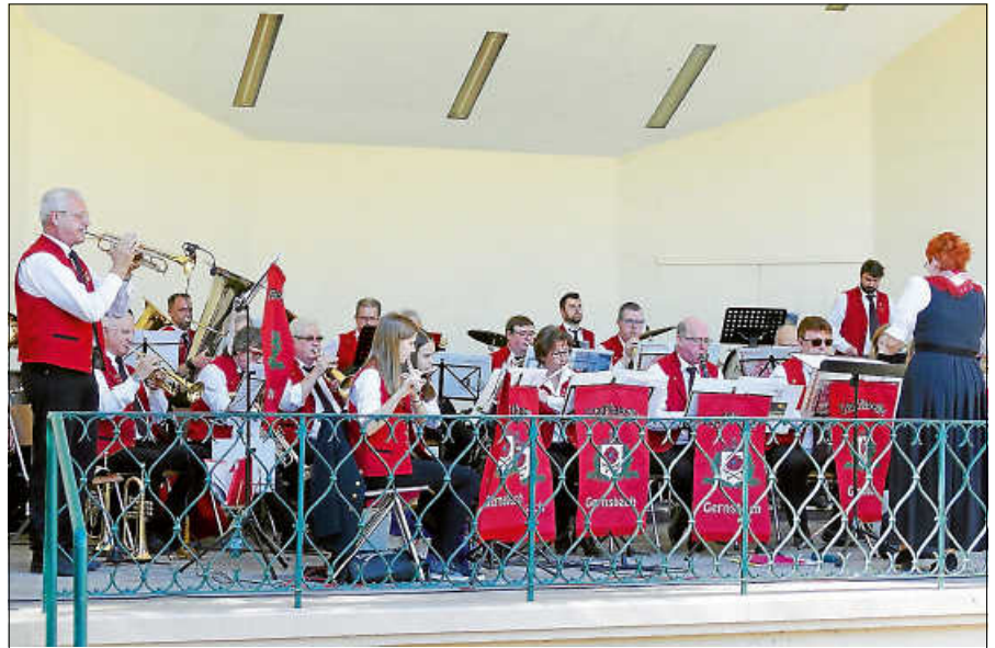
Auftritt in der Konzertmuschel an Ostern 2019