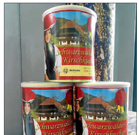
Glück in der Dose.