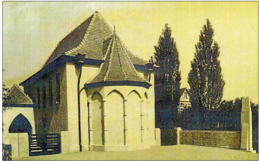
Die ehemalige Synagoge.

Die Teilnahme an der Themenführung ist kostenlos, die Teilnehmerzahl begrenzt auf 20 Personen. Eine Anmeldung ist unter Telefon 07224 64444 oder E-Mail: touristinfo@gernsbach.de unter Angabe der Kontaktdaten erforderlich.