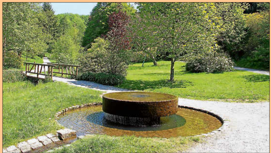
Der Gernsbacher Kurpark.

Am Dienstag, 11. Juni um 19.30 Uhr präsentiert der MV Orgelfels Reichental moderne wie auch traditionelle Blasmusik. Der Eintritt zu den Kurkonzerten ist frei. ■