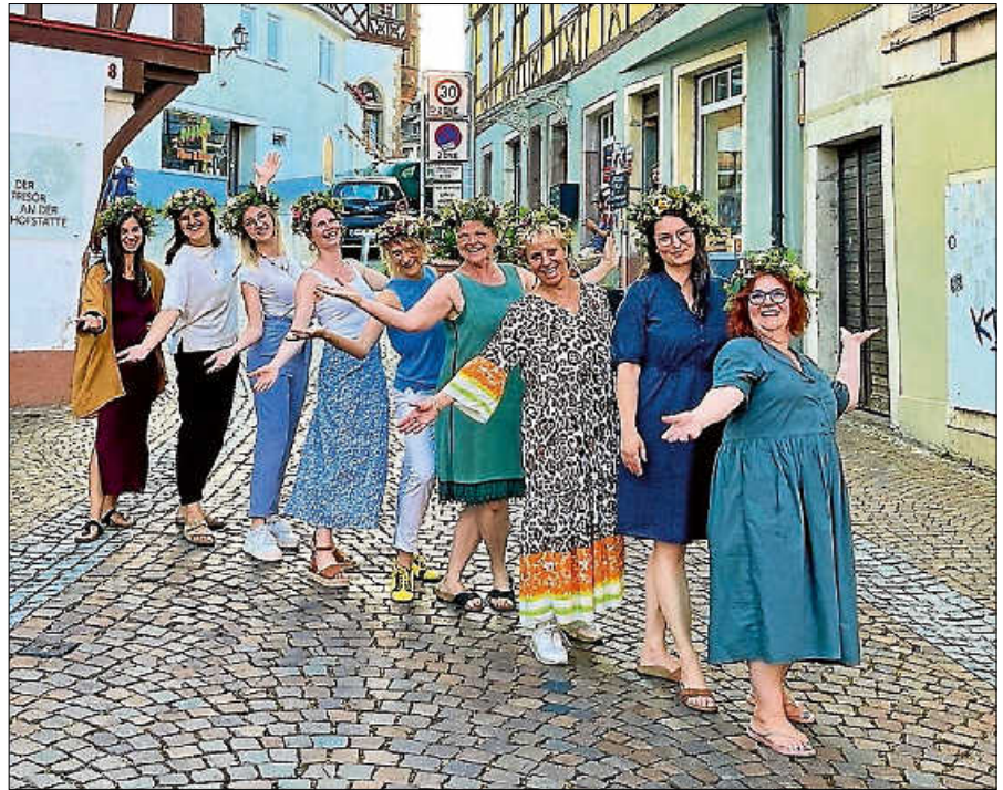
Herzlich willkommen zum Mittsommer-Late-Night-Shopping

Das KJØSK am Ladengeschäft in der Färbertorstraße 4 bietet Lose, Süßkram und kühle Getränke an. Sybilles Flickwerk offeriert zwischen 16 und 21 Uhr passend zum Midsommar in ihrem Pop-Up-Bistro HYGGEHJØRNET neben Carlsberg, kühlen Rosé und dänischen Gin auch selbst gemachte Leckereien wie Rødgrød med fløde. ■