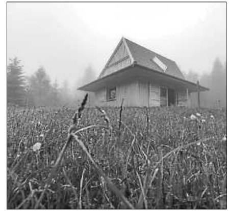
Die Naturpark-Moorstation auf dem Kaltenbronn.

Moore sind die weltweit größten CO 2 -Speicher. Sie zu erhalten, bedeutet, das Klima zu schützen. Zudem sind seltene oder bedrohte Amphibien-, Tier- und Pflanzenarten wie etwa das Wollgras, Zieralgen oder Libellen auf den Lebensraum Moor angewiesen und fühlen sich auf dem Kaltenbronn wohl. ■