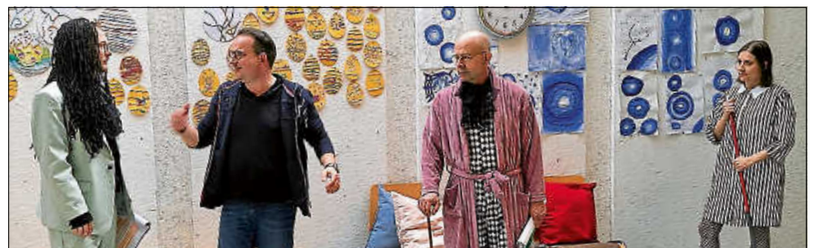
Szenenprobe für „Der eingebildete Kranke“ in der Grundschule Scheuern.

über www.theater-im-kurpark.de oder vor Ort im TUI-Reisecenter Gernsbach sowie in allen Eventim-Vorverkaufsstellen. ■