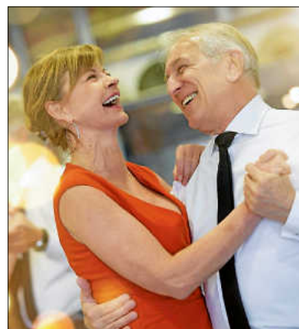
Ein Paar tanzt voller Anmut und Freude.

Die Teilnahme ist kostenlos. Bei Regen fällt die Veranstaltung aus. ■