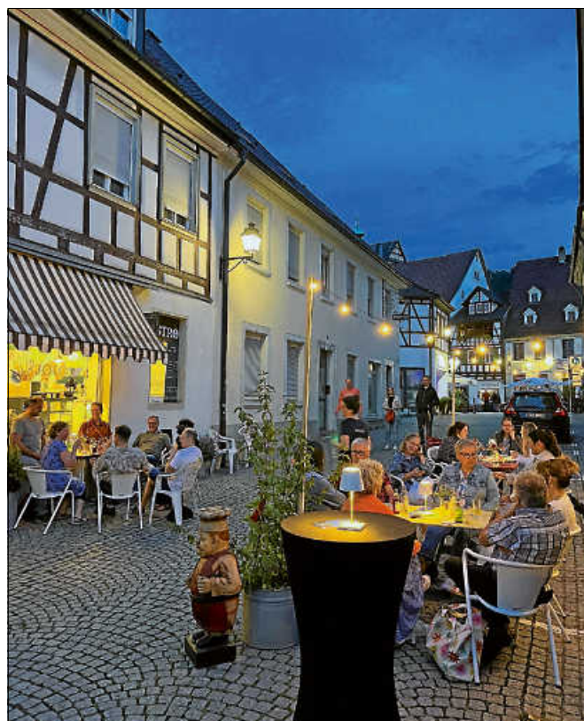
Mit dem Pop-up Bistrø kommt französisches Flair in die Altstadt von Gernsbach.

Für Gaumenfreuden sorgt eine Auswahl bekannter französischer Leckereien, darunter Crémant, Picon-Bière und köstliche Tartines, ergänzt durch innovative neue Kreationen. Das Pop-up Bistrø ist Teil der diesjährigen AltstadtLive-Termine und wird an folgenden Tagen geöffnet sein: 15. Juni, 20. Juli, 27. Juli und 3. August. ■