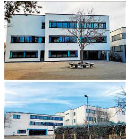
Die Realschule feiert ihr 50. Jubiläum.

Auch das leibliche Wohl darf bei solch einem Fest nicht zu kurz kommen, hierfür sorgt das Team der Grillhütte am Salmenplatz. Das Realschulteam freut sich darauf, viele Interessierte am 21. Juni beim Jubiläumfest begrüßen zu dürfen. ■