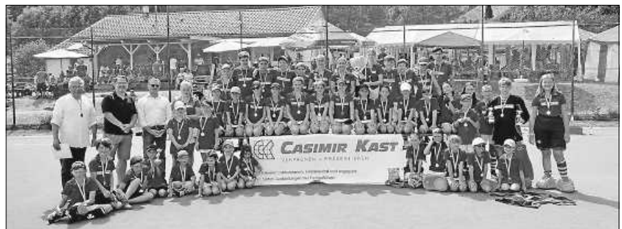
Gernsbacher Jugend beim Elchturnier 2023.

Am kommenden Wochenende findet das 29. Elchturnier des Hockey-Clubs Gernsbach statt. Auch dieses Jahr ist der HCG mit knapp über 30 Mannschaften restlos ausgebucht. Die ganze Hockeyfamilie freut sich auf ein tolles und erfolgreiches Wochenende an der Badener Straße. Das Turnier ist auch dieses Jahr wieder international. So machen sich fünf Mannschaften aus der Schweiz