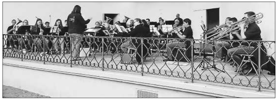
Das Publikum darf sich auf ein abwechslungsreiches Programm freuen.

Der OGV Lautenbach führt am Samstag, 15. Juni seinen Jahresausflug für alle Vereinsmitglieder, Angehörige und interessierten Gäste durch. Murg aufwärts ins Schwäbisch-Württembergische soll es dieses Mal gehen. Ziel ist Freudenstadt, bekannt für seinen großen, fast quadratischen Marktplatz. Bequem geht es mit der Bahn (DB-Regio) ab Bahnhof Gernsbach, ohne Umsteigen direkt durchs schöne Murgtal nach Freudenstadt, mit Zwischenhalten nur in Weisenbach, Forbach, Schönmünzach und Baiersbronn. Einsteigen, sitzen bleiben und die Fahrt auf der interessanten Bahnstrecke mit vielen Tunnels, der Murg und imposanten Granitfelsen genießen. Treffpunkt für alle ist am Bahnhof Gernsbach um 10.15 Uhr; Abfahrt am Gleis 2 um 10.44 Uhr; Ankunft Freudenstadt Stadtbahnhof 11.30 Uhr. Die Anfahrt zum Bahnhof Gernsbach ist selbst, möglichst über Fahrgemeinschaften zu organisieren, ggf. auch mit Anruf-