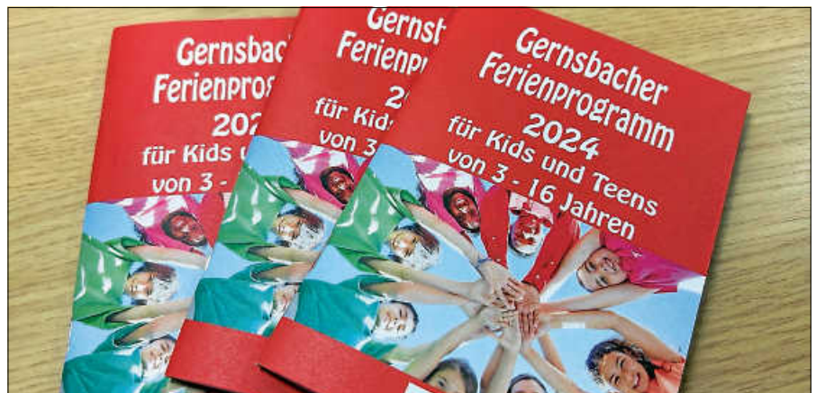
Das Gernsbacher Ferienprogramm liegt nun auch in Printversion vor.

Alle Infos rund um die Anmeldung finden Interessierte in der Broschüre. ■