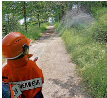
Wasser marsch! echtem Funkgerät – Wasser marsch - mit dem Feuerwehrschauch löschen.

Das Feuerwehrauto kam mit Blaulicht und Martinshorn zum Parkplatz am Rumpelstein gefahren. Die Waldkinder waren begeistert und sehr gespannt, was nun passieren wird. Sie bekamen die Möglichkeit, das Feuerwehrauto einmal ganz genau aus der Nähe anzuschauen und erfuhren von Peter Lukas und seinen Feuerwehrkollegen, welche Ausrüstung sich im Fahrzeug befindet und wozu die einzelnen Dinge bei einem Einsatz benötigt werden. Einen Feuerwehrmann auch einmal in kompletter Ausrüstung inklusive Atemschutzmaske zu sehen, war für die Kinder ein Erlebnis. Im Anschluss durfte jedes Kind in Feuerwehrkleidung und mit Funkanlage per