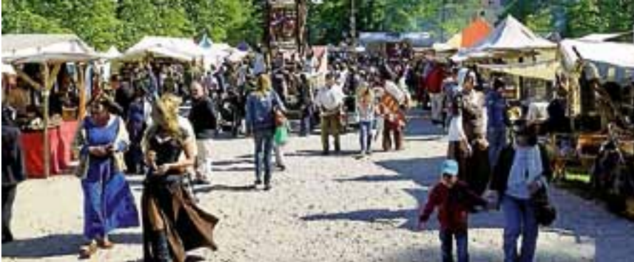
Die Murginsel verwandelt sich in einen bunten Mittelaltermarkt.

M ittelaltermarkt und dazu ein Feuerspektakel zur Walpurgisnacht: Auf der Murginsel laden Gaukler, Ritter und Musikanten von Samstag, 28. April, bis Dienstag, 1. Mai, wieder dazu ein, in längst vergangene Zeiten einzutauchen.