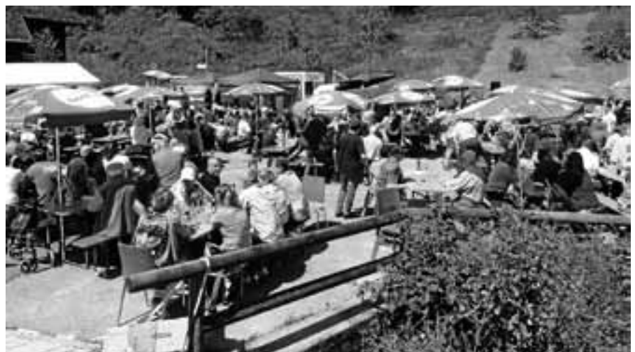
Bei hoffentlich schönem Wetter findet das Vatertagskonzert des MVL wieder im Freien statt.

Christ Himmelfahrt ist traditionell in Lautenbach mit dem Kurkonzert zum Vatertag verbunden. Los geht es am 10. Mai um 11 Uhr. Ab 12 Uhr wird das Vatertagskonzert musikalisch eröffnet vom Musikverein aus dem benachbarten Bad Herrenalb-Gaistal. Einen Einblick in den aktuellen Leistungsstand geben um ca. 14.30 Uhr die Jungmusiker des MVL zusammen mit der seit September 2017 bestehenden Bläserklasse der Grundschule Scheuern. Die Lautenbacher Musikanten unter der Leitung von Patrick Pirih haben ebenfalls wieder ein abwechslungsreiches Musikprogramm vorbereitet und werden die Vatertags-Ausflügler ab ca. 16 Uhr bis zum Ausklang unterhalten. Für das leibliche Wohl ist natürlich bestens gesorgt. Maultaschen mit Kartoffelsalat, Weißwürste mit Brezeln, Bratwürste, Steaks und „Heiße“ finden sich im Angebot. Wer es lieber süß mag: Die Kuchentheke bietet reichlich Auswahl. Maibock, Pils und vielerlei Getränke mit und ohne Alkohol stehen für die durstigen Kehlen bereit. Gern begrüßen wir wieder alle Lautenbacher Musikfreunde. Für die neu in Lautenbach zugezogenen Familien ist die Veranstaltung eine ideale Gelegenheit, in gemütlicher Atmosphäre moderne und traditionelle Blasmusik live zu genießen und Kontakte in ihrem neuen sozialen Umfeld zu knüpfen. Ebenso freuen wir uns auf unsere Stammgäste aus nah und fern.