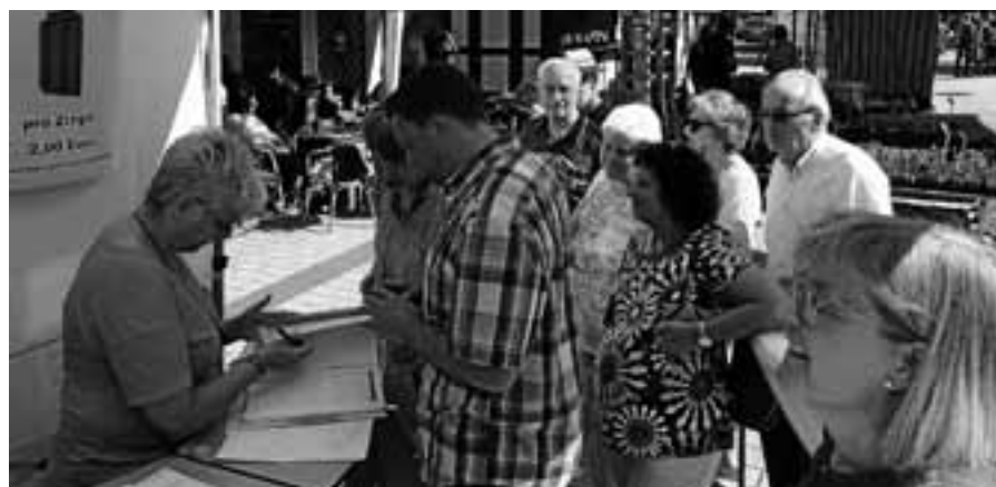
Die Suche nach Ziegelpatenschaften auf dem Wochenmarkt war ein voller Erfolg.

Der BBPV hat auf seiner Homepage verschiedene Informationen veröffentlicht. Die interessierten Mitglieder können unter www.petanque-bw.de Infos über die Kleiderordnung im Ligabetrieb und über die Organisation von Großspieltagen in den Liga-Klassen sowie über das Auswechsel-Procedere am Ligaspieltag erhalten. Bei Interesse bitte einfach die Homepage des Verbandes besuchen.