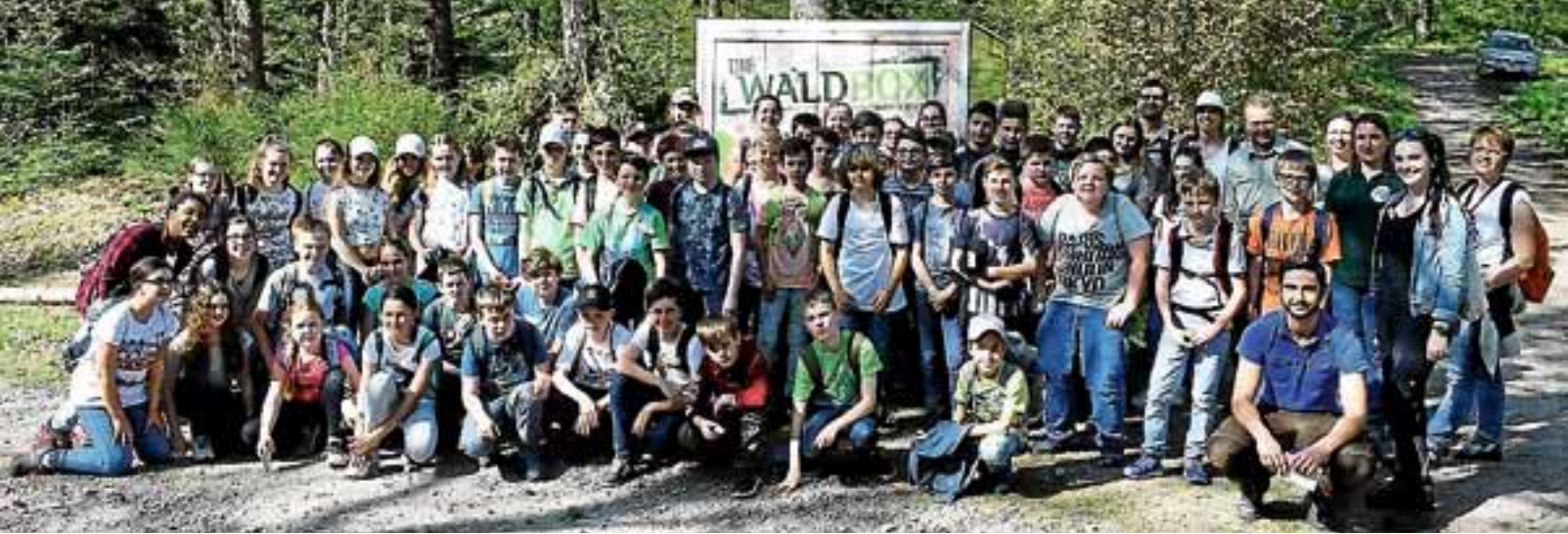
Die drei 6. Klassen des ASG nahmen an einem zweitägigen Projekt zum Thema Wald- und Umweltsensibilisierung teil.