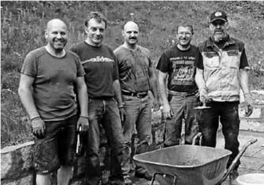
In mehreren Einsätzen haben die freiwilligen Helfer der Schwimmbadinitiative das Bad auf Vordermann gebracht.