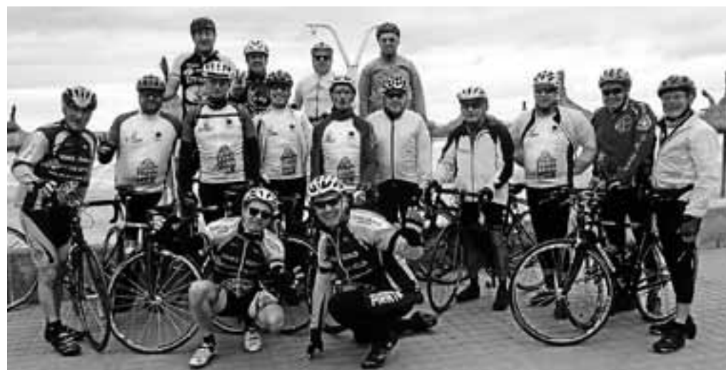
Die Radler des Ski-Clubs verbrachten gemeinsam mit vier Freunden aus Baccarat eine Woche auf Mallorca.