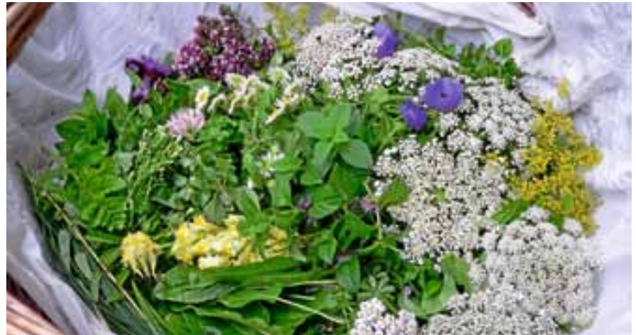
Erfahren Sie mehr über Wild- und Heilkräuter!

In unserer Zeit ist viel Wissen um Wild- und Heilkräuter verloren gegangen. Es scheint, dass wir vergessen haben, dass Pflanzen unsere Lebensgrundlage sind. Nicht nur in der Ernährung, auch im Bereich Gesundheit und Wohlbefinden sind die „Wildkräuter“ schon seit Urzeiten unsere Begleiter. Bei der Veranstaltung in Kooperation mit dem Weidenhof Gernsbach und der Naturschule Recktenwald werden mit Kräuterölen und -tinkturen aus eigener Herstellung sowie reinem Bienenwachs individuelle Salben auf dem Feuer gerührt. Um dies intensiv aufnehmen zu können, ist es von Vorteil selbst „duftfrei“, also ohne Parfüm zu kommen. Die Tagesveranstaltung findet