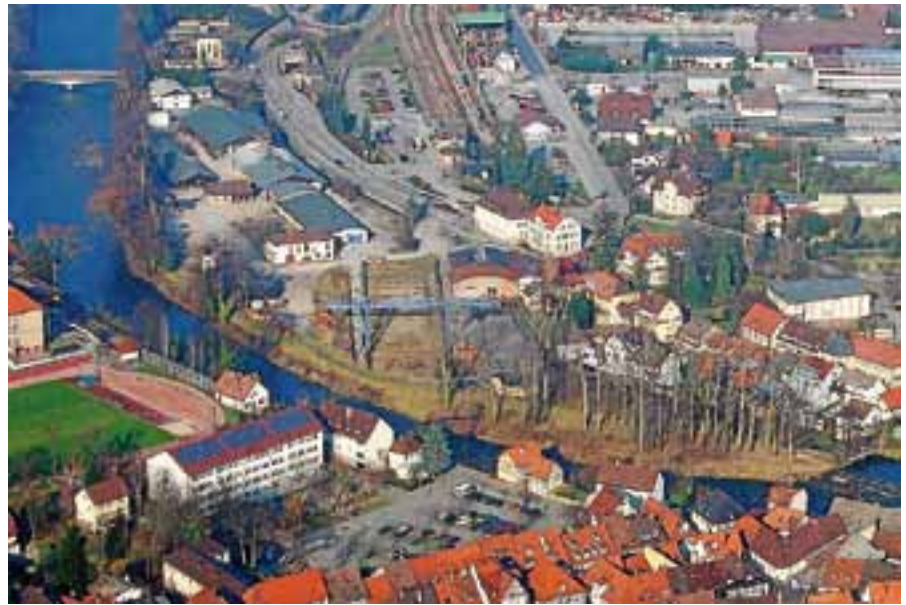
Bei der Info-Veranstaltung am 17. Mai werden insbesondere die ökologischen Auswirkungen der Altlasten auf dem Pfeleiderer-Areal beleuchtet.