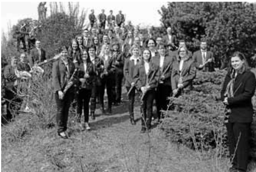
Mit „Unsere Farben“ verspricht der Musikverein Reichental beste Unterhaltung beim Muttertagskonzert.