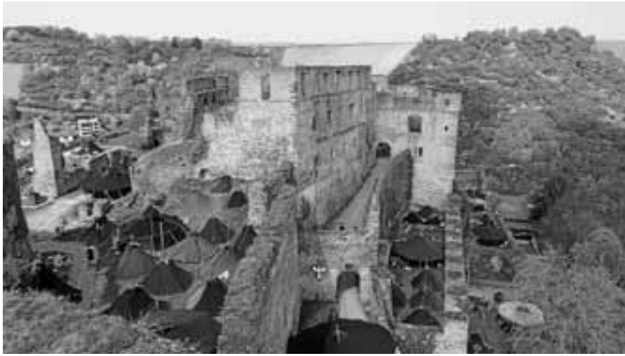
Zahlreiche Pfadfinderzelte auf dem Rheinischen Singewettstreit.