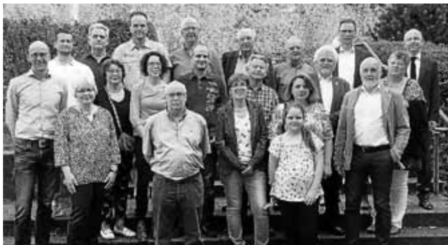
Papierherstellung ist "High tech". Davon konnten sich die Teilnehmer der "CDU-vor-Ort" Aktion überzeugen, die zu Gast im Papierzentrum waren.