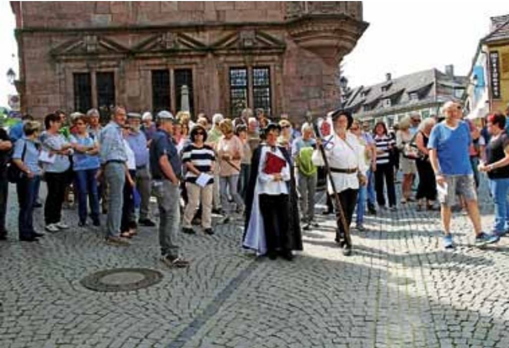
Das Historienstadel lässt wieder Gernsbachs Stadtgeschichte lebendig werden.