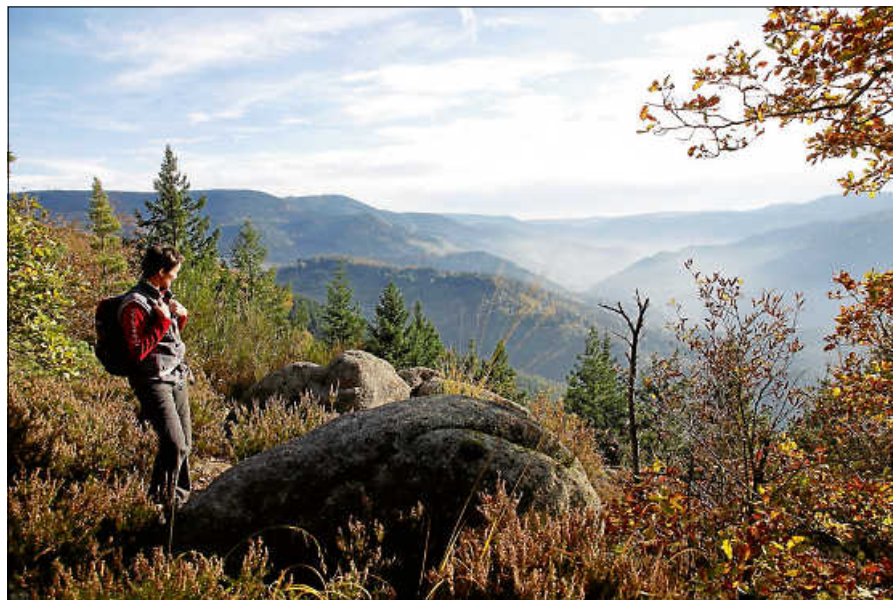
Auf den Rockertfelsen.

Mehrtagestouren müssen mindestens 50 Erlebnispunkte aufweisen um das Deutsche Wandersiegel zu erhalten. Alle fünf Wanderetappen der Murgleiter erfüllen die Kriterien des Deutschen Wanderinstitutes in vollem Umfang, sodass mit 65 Punkten eine Steigerung um drei Punkte im Vergleich zur letzten Zertifizierung im Jahr 2017 erzielt werden konnte. Bereits seit 2008 zählt die Murgleiter zur Spitzenklasse deutscher Wanderwege und trägt das Prädikat „Premiumwanderweg“. Alle drei Jahre muss die Zertifizierung erneuert werden. Das Landratsamt Rastatt als Koordinierungsstelle der Infrastruktur- und Marketingaktivitäten rund um die