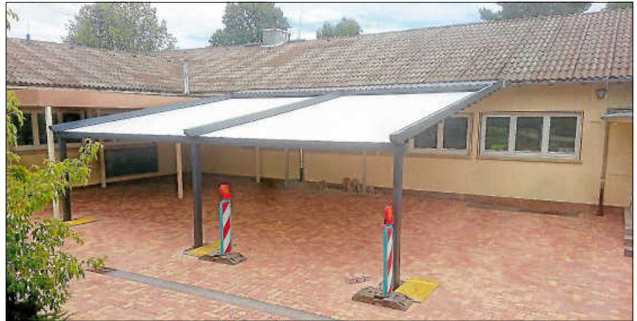
Die Beschattungsanlage dient als Sonnen- und als Regenschutz.

Nach der Erledigung einiger Restarbeiten, die beispielsweise auf dem rück-