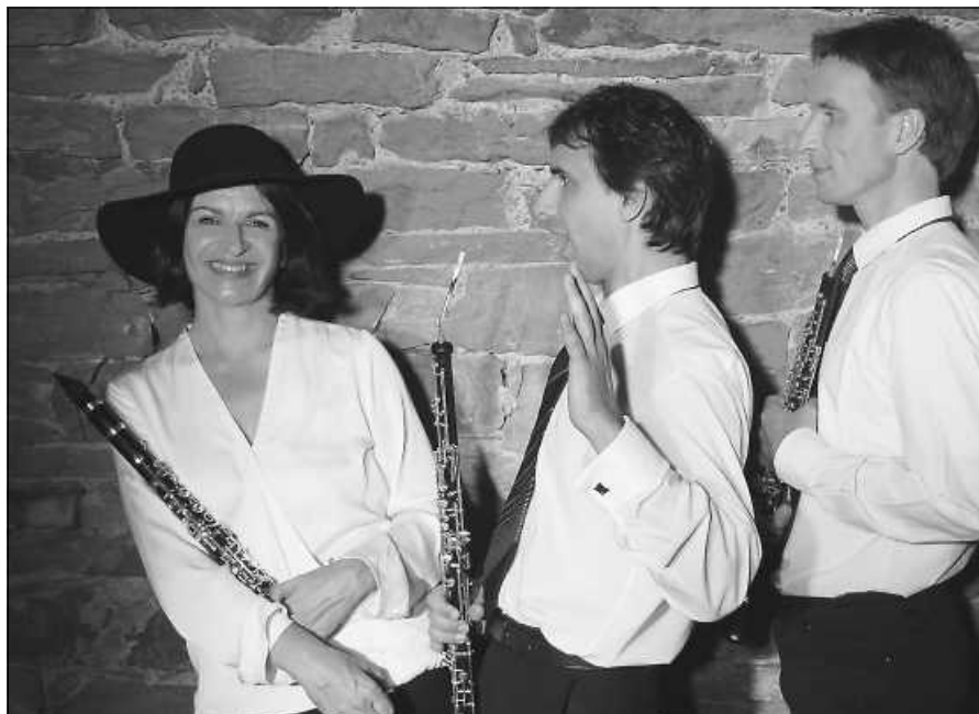
Busch Kollegium Bläserensemble.

Nur so lassen sich leer bleibende Plätze aber auch vergebliche Anläufe vermeiden. Wir bitten um Ihr Verständnis und um Ihre treue Aufmerksamkeit für unsere von der Baden-Württemberg Stiftung geförderte, kammermusikalische Reihe. ■