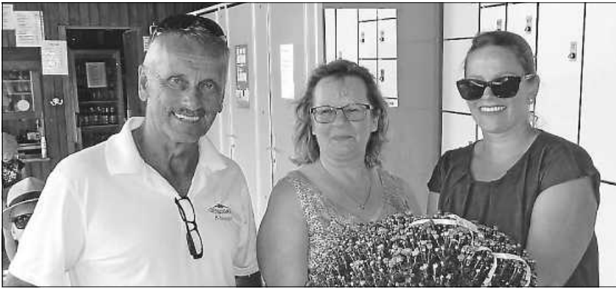
Abschied vom Schwimmbad.