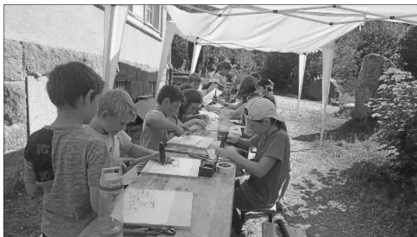
Religiöse Kinderwoche in Raumünzach.

Bibel unternommen. So lernten sie die Eigenschaften der biblischen Figuren Ester und Simson oder Veronika und Stephanus kennen. Die Teilnehmenden sind ihren eigenen Heldeneigenschaften durch erlebnispädagogische Spiele auf die Spur gekommen. Zu den Höhepunkten gehörten neben den kreativen Bastelangeboten und den Gruppenspielen die Murgbettwanderung mit einem ausgiebigen Bad sowie der zünftige Lagerfeuerabend.