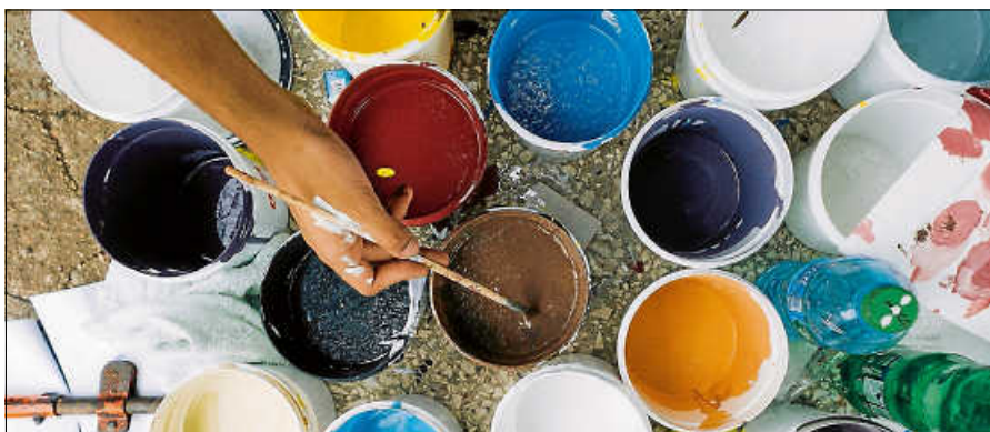
Ausgediente Farbeimer und andere im Haushalt anfallende Problemabfälle können beim Schadstoffmobil abgegeben werden.