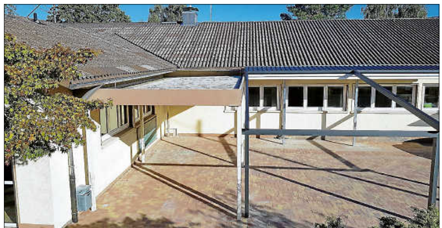
Wird keine Bedachung benötigt, kann die Markise eingefahren werden.

seits des Schulhauses gelegenen Weg zum Bolzplatz in den nächsten Wochen noch anstehen, ist die Pausenhofsanierung abgeschlossen. Die Kosten für das