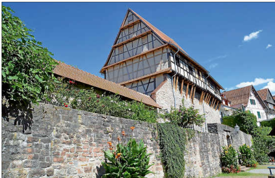
Die Zehntscheuern: Historisches Bauwerk an der Stadtmauer