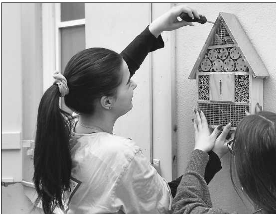
Schüler bei der Arbeit in Projekten zum Thema Nachhaltigkeit.

Die Handelslehranstalt zeichnet sich durch viele erfolgreiche Projekte in der Vergangenheit aus. So konnte über das Jugendforum Green Leadership bis hin zu den Erfolgen in landes- und bundesweiten Wettbewerben SchülerInnen von den Erfahrungen aus der Projektarbeit profitieren. Mit der Klimaschutzwerkstatt soll diese Arbeit mit Partnern der Region zukunftsorientiert fortgesetzt werden. ■