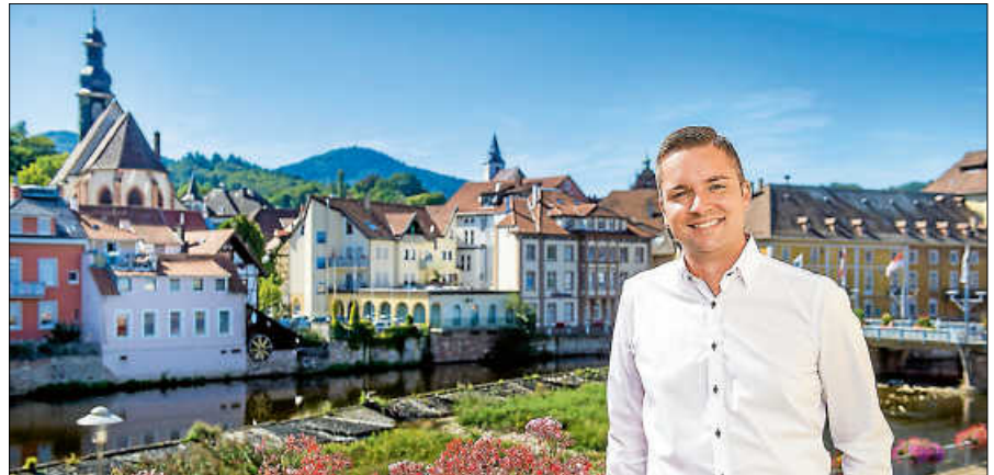
Bürgermeister Christ lädt zur Beteiligung am Altstadtentwicklungsprozess ein.