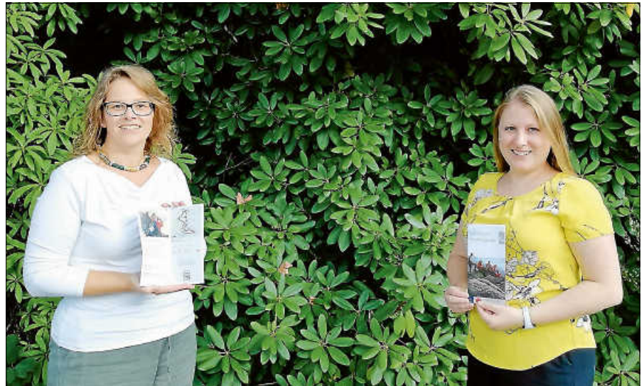
Der neue Gernsbach Wanderguide ist da.

Die Touren sind nicht mit einem speziellen Symbol ausgeschildert. Wanderer halten sich an die einheitliche Wanderwegbeschilderung, die schwarzwaldweit