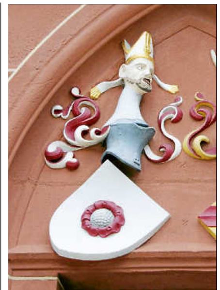
Die Ebersteiner Rose an der Ev. Kirche.