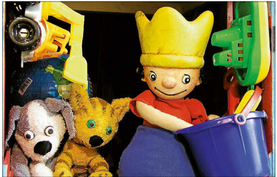
Der kleine König.

Weitere Veranstaltungen der Reihe sind: Sonntag, 8. November 2020: Kasper backt Pfannkuchen (für Kinder ab 3 Jahren) Sonntag, 17. Januar 2021: Der Zapperdockel & der Wock (für Kinder ab 4 Jahren) Sonntag, 28. Februar 2021: Balduin der Pinguin (für Kinder ab 4 Jahren)