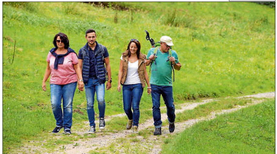
Wanderer im Laufbachtal.

Diese Tour führt auf die Teufelsmühle. Ausgangspunkt der Wanderung ist der Bahnhof Gernsbach. Dort stehen ausreichend Parkplätze zur Verfügung, ebenso ist die Anreise mit der Stadtbahn möglich. Durch die Nordstadt geht es zum Standort „Parkplatz Laufbachtal“. Dort befindet sich das Wanderportal zum Premiumwanderweg „Gernsbacher Runde“, dem man nun ein Stück des Weges folgt. Das ruhig gelegene Laufbachtal führt bis hinauf nach Loffenau. An der Laufbachbrücke angekommen, wendet man sich in Richtung Loffenau nach rechts weiter das Tal hinauf und biegt dann rechts ab zu den imposanten Laufbachwasserfällen, einem einzigartigen Naturdenkmal bei Loffenau. Nachdem man Loffenau durchquert hat, beginnt