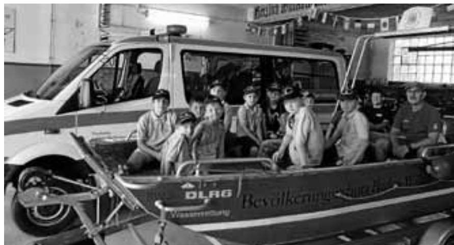
Die Kinder der FFW lernten vieles über die vielfältigen Aufgaben der DLRG.