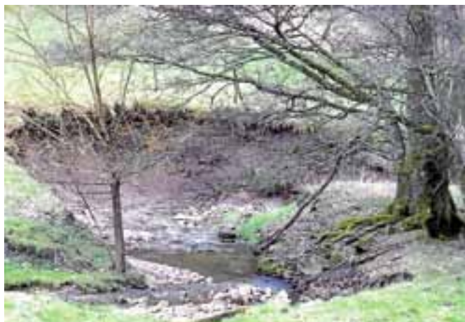
Viele Bäche führen aktuell nur noch sehr wenig Wasser.

Die Wasserbehörde weist weiter darauf hin, dass das Aufstauen von Fließgewässern und die Entnahme von größeren Wassermengen mit Elektro- oder Motorpumpen grundsätzlich wasserrechtlich erlaubnispflichtig sind. Die Wasserentnahme mit solchen technischen Hilfsmitteln ist ohne wasserrechtliche Erlaubnis verboten. ■