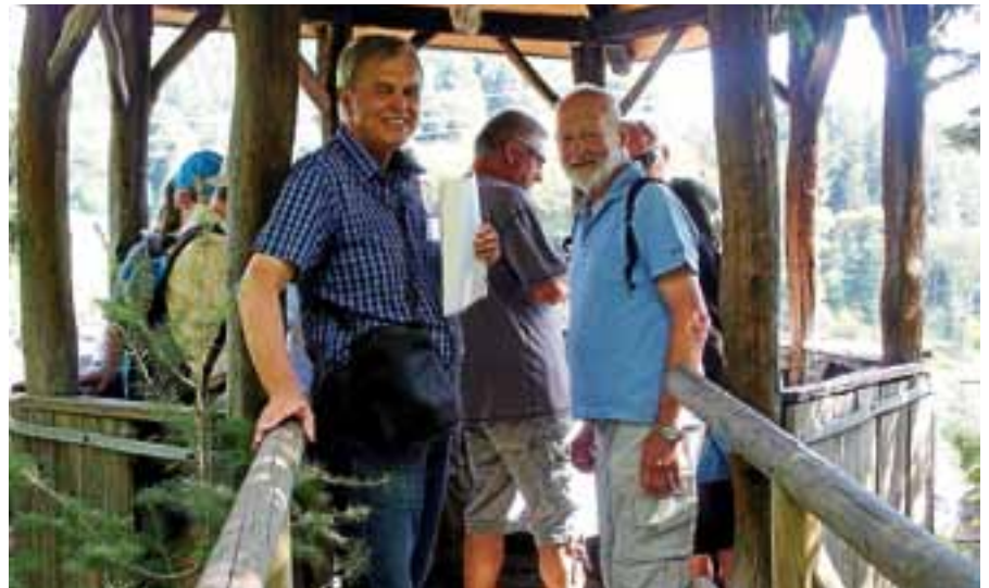
Bei der kostenlosen Führung erleben Kinder und Erwachsene den Zauber einer wunderbaren Sagenwelt.

Die Sagenwanderung dauert ca. 2,5 Stunden. Empfehlenswert sind Schuhe mit griffiger Sohle und dem Wetter angepasste Kleidung, außerdem eine Taschenlampe. Zu dieser kostenlosen und aussichtsreichen Führung laden wir Kinder und Erwachsene herzlich ein. Als