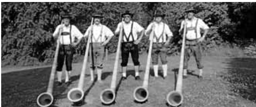
Die Alphornbläser aus Gernsbach unterhalten am Sonntag im Kurpark.

Am Sonntag, 5. August, laden um 16 Uhr die Gernsbacher Alphornbläser in den Kurpark ein.