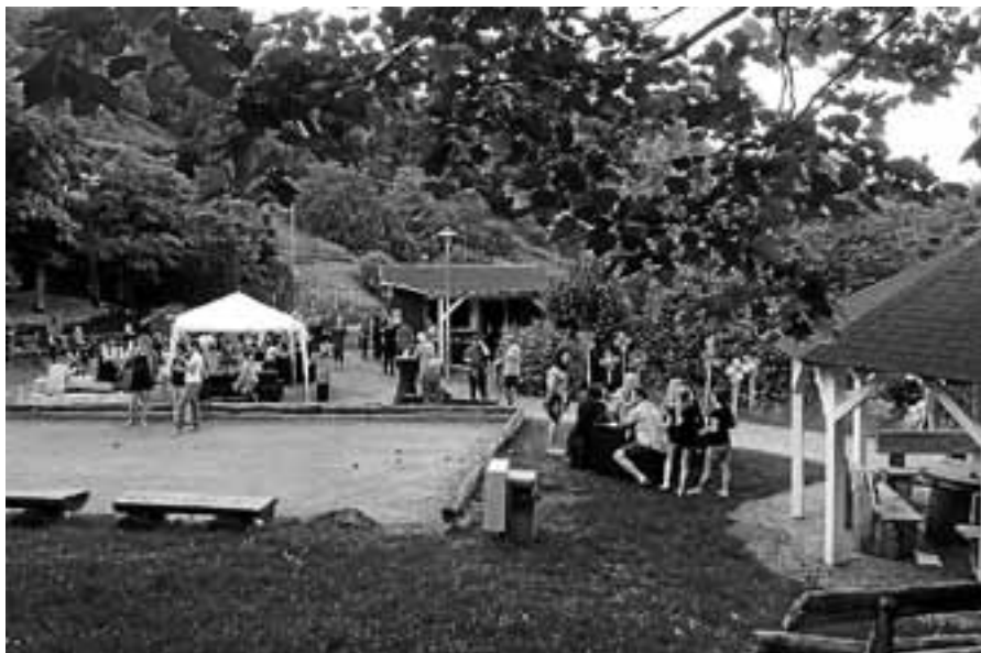
Beliebtes Feierabend-Grillen auf dem Dorfplatz.

Der nächste "Kids Bazar" findet am 22. September von 10.30 bis 13 Uhr in der Staufenberghalle statt.