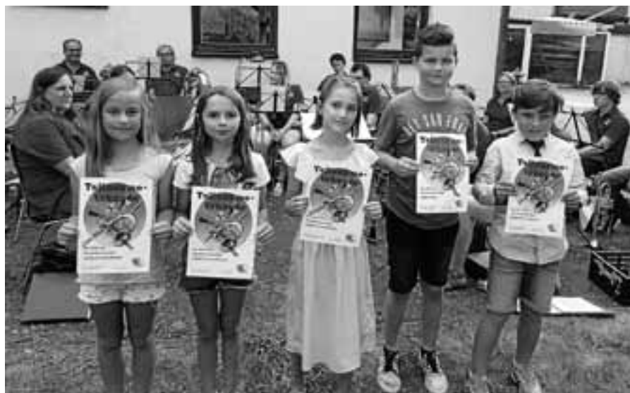
Stolz zeigen die Kinder ihre Teilnahme-Urkunde für den Instrumentenzirkel.

berühmte Münster auf dem Programm. Mit dem Bus geht es dann weiter zum gemeinsamen Mittagessen im Glottertal. Im Anschluss können im Rahmen einer Weinprobe vier Glottertaler Weine und ein Sekt verkostet werden. Die Rückkehr in Gernsbach ist für 19 Uhr vorgesehen. Die Kosten für den Bus und die Stadtführung betragen pro Person 30 Euro. Anmeldung bis spätestens 30. August, Telefon 5708. Der OGV bittet, gleichzeitig mit der Anmeldung die 30 Euro für Bus und Führung auf das Konto des OGV bei der Sparkasse Rastatt-Gernsbach mit genauer Namensangabe (Vor- und Familienname) zu überweisen: OGV Gernsbach, IBAN DE34 6655 0070 0060 0083 49, Stichwort: Ausflug 2018.