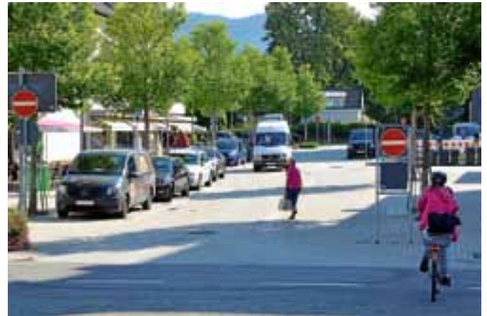
Bei der verkehrsberuhigten Salmengasse bleibt es bei der jetzigen Einbahnstraßenregelung, um den Salmenplatz nicht zu zerschneiden.

Außerdem hat sich der Gemeinderat darauf verständigt, Bleich- und Igelbachstrasse durch bauliche Veränderungen aufzuwerten. Gedacht ist unter anderem an eine Verbreiterung der Gehwege. Die verabschiedeten Eckpunkte sehen darüber hinaus einen durchgehenden Fußgänger- und Radweg im Bereich des Blumenwegs vor. Durch den Abriss des Gebäudes Salmengasse 3 sollen Kelterplatz und Salmenplatz miteinander verbunden werden. Das Gesamtpaket von Maßnahmen schließt damit den gegenläufigen Verkehr im Bereich der Gottlieb-Klump-Strasse sowie die Einrichtung eines Kreisverkehrs hin zur Salmengasse dauerhaft aus. „Diese Grundsatzbeschlüsse fügen sich hervorragend in die Erneuerung des Kelterplatzes ein, die wir im Rahmen des Neubauprojekts der Volksbank ohnehin angehen