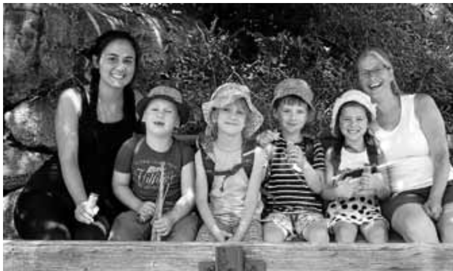
Der Vorschulausflug des Waldorfkindergarten führte an die Murg.

Offensichtlich war es für viele Einwohner von Hilpertsau bei der vorherrschenden Hitze eine willkommene Abendbeschäftigung, sich an einem schattigen Plätzchen niederzulassen und bei einem kühlen Getränk und bei einer heißen Wurst den Klängen des Musikvereins zu lauschen. Der Musikverein hatte traditionell zum Saisonabschluss zu einer öffentlichen Musikprobe eingeladen. Im Publikum des Platzkonzertes waren in diesem Jahr auch einige auffällig junge Zuhörer vertreten. Den Grund dafür konnte man nach der ersten kurzen Spielpause der Musikkapelle erfahren. In diesem Jahr hatte der Musikverein Hilpertsau mit der Unterstützung des Musikvereins Reichental zum ersten Mal einen sogenannten Instrumentenzirkel durchgeführt. Instrumentenzirkel bedeutet, dass die Blockflötenkinder, die in diesem Jahr die Blockflötenausbildung abschließen, die Möglichkeit haben, alle Instrumentengruppen, die ein Musikverein zu bieten hat, unter der Anleitung gut ausgebildeter Lehrer in einigen Schnupperstunden auszuprobieren. Jedes Kind bekam so einen ersten Einblick in die Gruppe der Holzblasinstrumente mit Querflöte oder Klarinette, der Blechblasinstrumente mit Trompete, Posaune oder Tenorhorn und natürlich auch in die Welt des Schlagzeugs. Den sieben teilnehmenden Kindern hat dies viel Spaß gemacht, so manch eines der Kinder hat da eine neue Vorliebe für eines der Instrumente entdeckt. Im Rahmen der öffentlichen