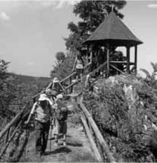
Mal nach oben, mal nach unten: nie langweilig.

Treffen ist am 7. August um 14 Uhr am Eingang zum Kurpark Gernsbach. Zusammen mit Gabi wandern wir nach Loffenau zur Einkehr.