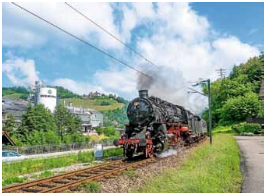
Der historische Dampfzug während der Fahrt durch Hilpertsau.

Die Rückfahrt von Baiersbronn nach Karlsruhe beginnt um 16.47 Uhr und erreicht Gernsbach um 18.12 Uhr. Es gelten die UEF-Dampfzugfahrkarten (Verkauf nur im Zug) sowie die KVV-Regio-Tickets, das Baden-Württemberg-