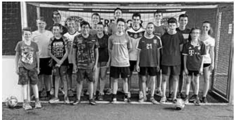
Spieler und Betreuer der TT-Jugend.

Der Obst- und Gartenbauverein Gernsbach e.V. lädt seine Mitglieder und Freunde herzlich zum diesjährigen Vereinsausflug ein. Am Sonntag, 23. September, geht es zunächst nach Freiburg und dann in das Glottertal. Der Bus startet um 8 Uhr am Bahnhof in Gernsbach. In Freiburg steht eine Stadtführung durch die Altstadt und das