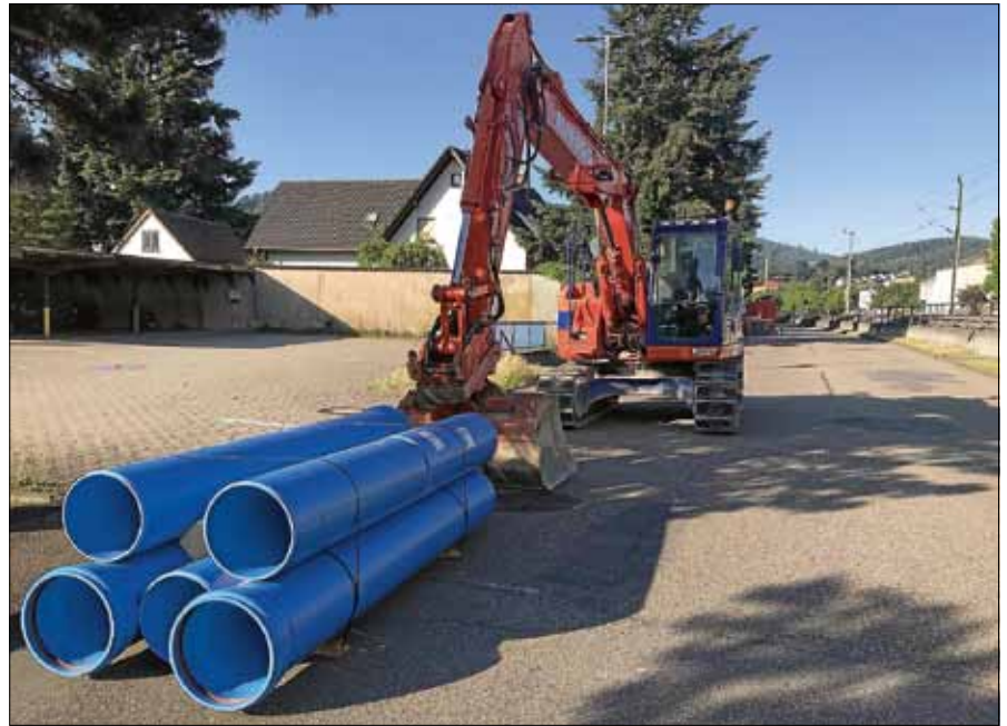
Beeinträchtigungen durch die Baumaßnahmen sind nicht zu vermeiden.

Wir bitten um Verständnis und wenn möglich, den Bereich großräumig zu umfahren. ■