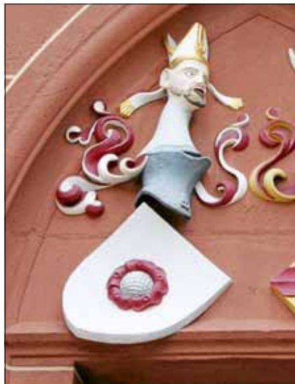
Das Wappen mit der Ebersteiner Rose an der Liebfrauenkirche in Gernsbach.

Treffpunkt: Parkplatz am vorderen Kurparkeingang. ■