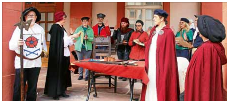
Szene aus der Erlebnisstadtführung.

Die zweite neue Szene spielt im Jahr 1644 und entführt die Zuschauer in die düstere Welt des Dreißigjährigen Krieges. Einfluss und Besitz der Ebersteiner sind auf ein Minimum zusammengeschmolzen, aber die Grafen mit der Rose im Wappen haben immer noch die Macht, in ihrer Stadt Gernsbach über Leben und Tod zu entscheiden. Die Zuschauer erleben, wie eine Hexe in letzter Minute vor der Hinrichtung gerettet wird. Der Historienstadel wird unterstützt von den Hörtelsteiner