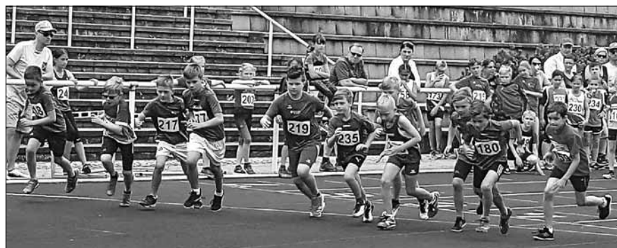
Start zum 800 m der U12 beim Fünfkampf

Bei gutem Leichtathletikwetter fanden in Bühlertal im Mittelbergstadion die Blockmehrkampf- und Fünfkampf-Kreismeisterschaften der Leichtathleten des Kreis Rastatt/Baden-Baden/Bühl statt. Bei den U16/U14 stand je ein Block mit fünf Disziplinen und bei den U12 ein Fünfkampf auf dem Programm. Beim Blockmehrkampf der U16 und U14 konnte man wählen zwischen Block Sprint/Sprung, Lauf oder Wurf. Die U12 absolvierten einen Fünfkampf mit 50 m,