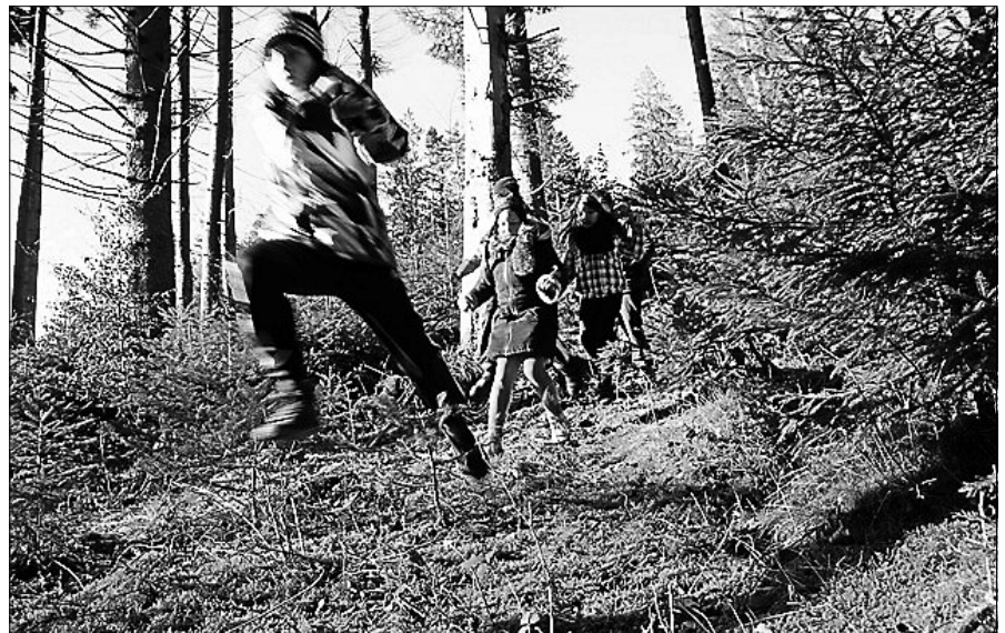
Kinder entdecken die Wildnis.

Die Kinderferienwoche ist für alle Wildnis-Fans zwischen 8 und 12 Jahren. Sie kann nur komplett gebucht werden. Fahrgemeinschaften auf den Kaltenbronn sind möglich. Sowie auch die gemeinsame Nutzung des öffentlichen Busses aus Gernsbach bzw. Bad Wildbad (Selbstzahler). Die Veranstaltung wird von Catherina Haessler und Kristina Schreier geleitet, dauert täglich 6 Stunden und kosten 100 Euro/Kind incl. gemeinsam gekochten Mittagessen. Weitere Info und Anmeldung unter 07224 655197 oder info@infozentrum-kaltenbronn.de ■