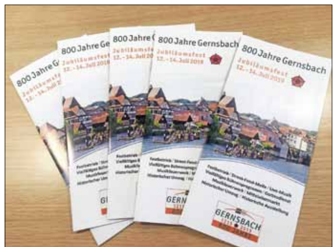
Infos rund um das Jubiläumsfest.