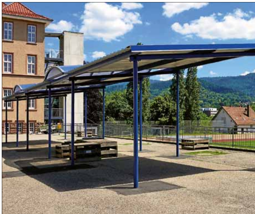
Die neue Überdachung auf dem Schulhof der Von-Drais-Gemeinschaftsschule berücksichtigt alle Anforderungen.

Auch mussten die örtlichen Besonderheiten berücksichtigt werden: Feuerwehrezufahrt, geringe Öffnung des Schulhofbodens, Anlieferungsverkehr, Nutzung in den Ferien, Parken bei Veranstaltungen, Möglichkeit unter dem Dach Hütten aufzubauen, zukünftige mögliche Sitzgruppen und Pflanzungen mit Pflanzkübeln. Die Entscheidung fiel auf eine große Fläche mit 100 qm Überdachung, durchbrochen mit zwei lichtdurchlässigen Tonnendächern. Sowie auf ein Stützensystem aus 12 runden Stützen, welche bei Veranstaltungen eine Nutzung als Parkplätze zulässt, und