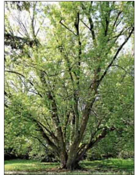
Sowohl einheimische als auch exotische Bäume gibt es im Kurpark zu bestaunen.

Eine Anmeldung zur Führung ist nicht erforderlich. Die Führung ist kostenlos. Sie dauert ca. 1 ¼ Stunden. Bei angekündigtem stärkerem Regen bzw. Gewitteransage fällt die Führung aus. Auskunft zum Stattfinden der Führung: Am 28.6. bis 15.30 Uhr, Telefon 1797.