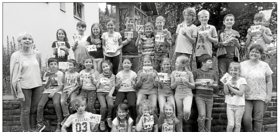
Die Zweitklässler zeigen ihr kleines Herbarium mit den fünf gesammelten Wiesenkräutern.

Glas“, jubelte eine Gruppe nach kurzer Zeit. Danach durften alle Schülerinnen und Schüler ihre Kräuterbutter auf Brotscheiben streichen und genießen. Mit einem selbst angefertigten Sandbild, auf dem jedes Kind nach seiner Vorstellung die fünf Pflanzen aufgeklebt hatte, traten alle den Heimweg an. So bleibt das Gelernte gut im Gedächtnis und zu Hause kann man sich mit den Eltern selbst auf die Suche nach diesen Schätzen der Natur begeben. ■