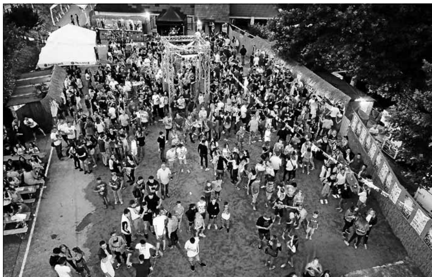
Beachparty auf dem Hallenparkplatz.