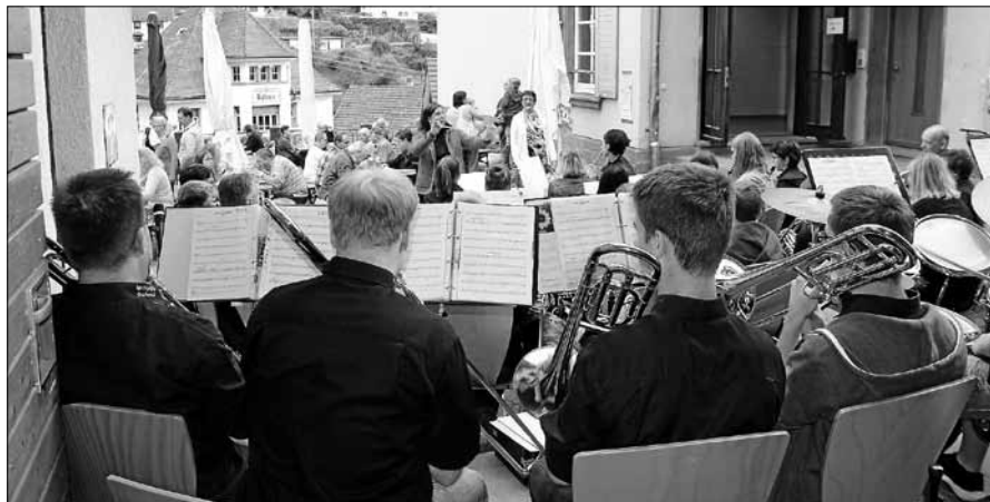
Der Musikverein lädt zum ersten Feierabendhock auf den Schulhof ein.

Am Freitag, 28. Juni 2019, lädt der Musikverein Orgelfels Reichental zum ersten Feierabendhock auf den Schulhof in Reichental, Langenackerstr. 4, ein. Mit Musik ins Wochenende heißt es ab 18 Uhr. Dazu sind die Jugendkapelle OHR, der Musikverein Forbach und erstmals die Murgtärer Mundstück-Schlotzer eingeladen um die Gäste musikalisch zu unterhalten. Mit MV Obertsrot und MV Hilpertsau haben wir uns schon vor einigen Jahren zusammengeschlossen um eine Gemeinschafts-Jugendkapelle zu gründen. Diese Jugendkapelle OHR besteht bis heute und wird von Markus Weißbecher geleitet. Der Musikverein Forbach feierte im letzten