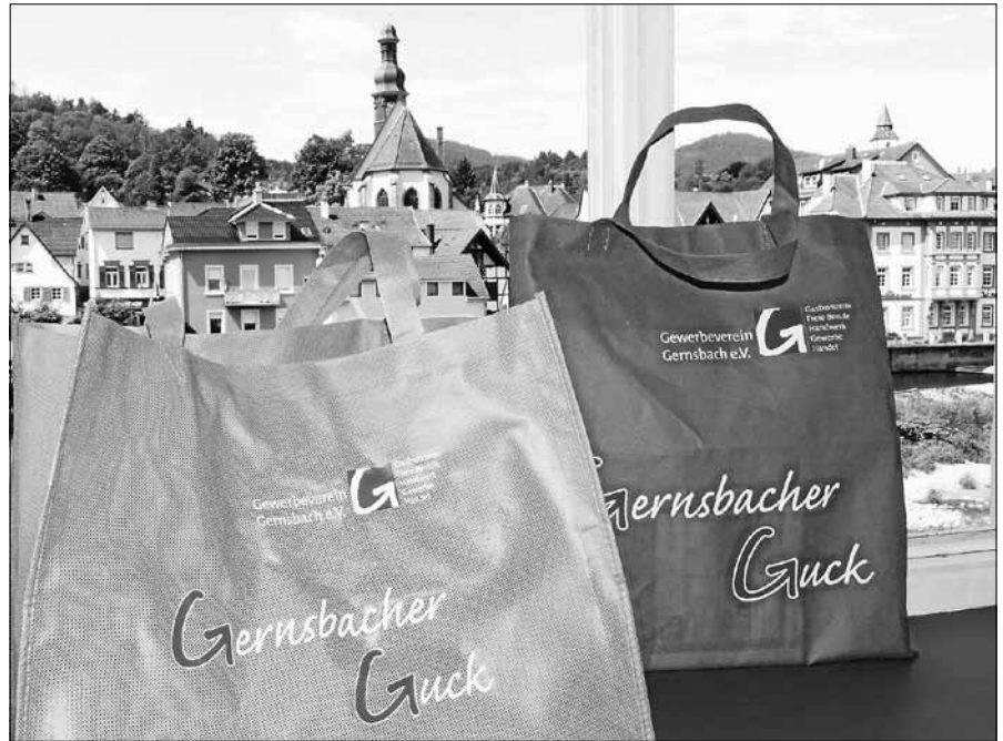
Einkaufen in Gernsbach - am besten mit der Gernsbacher Guck.

Mit dieser Aktion hat der Gewerbeverein bereits vor drei Jahren eine umweltschonende Alternative zur Plastiktüte in Gernsbach eingeführt. Die markanten grünen Taschen sind in zwei Ausführungen erhältlich. ■