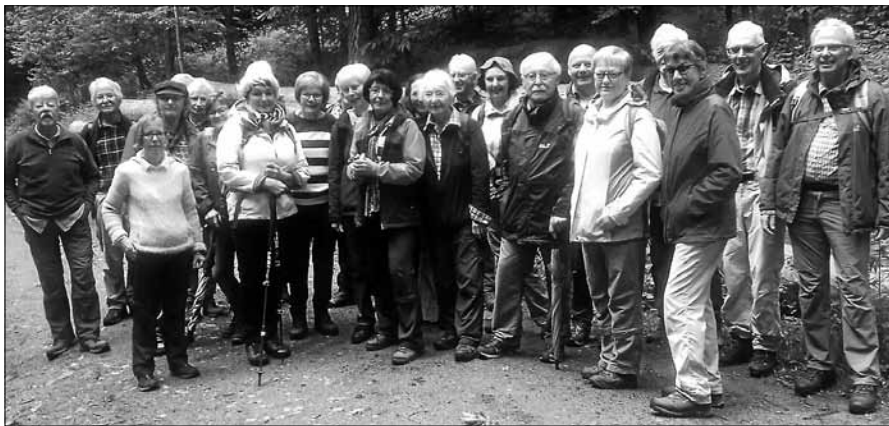
Bei jedem Wetter unterwegs.