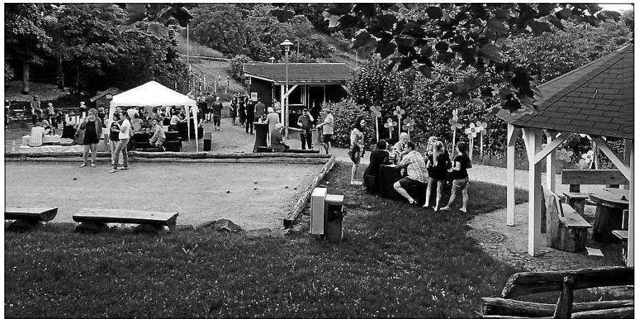
Grillgenuss zum Wochenschluss

Grillgenuss zum Wochenschluss – der neue Slogan für das Feierabendgrillen auf dem Staufenberger Dorfplatz. Wir starten am Freitag, 28. Juni, um 18 Uhr in die Grillsaison auf dem Dorfplatz. Das Cateringteam vom Treffpunkt