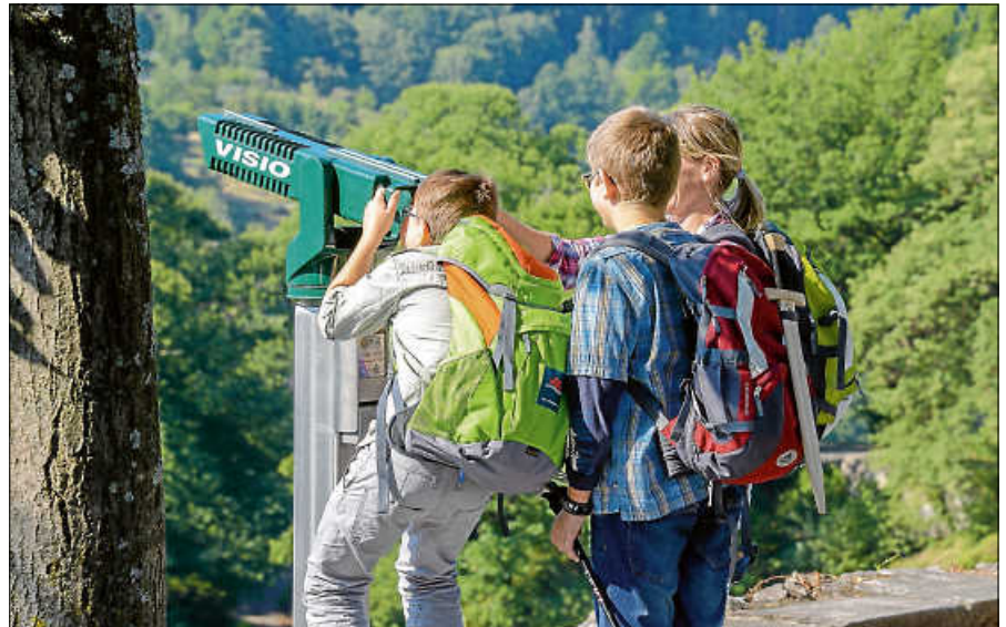
Der Sagenweg wird auf einer teuflischen Schnitzeljagd erkundet.

25 - Selbstbehauptungs- & Resilienztraining Mobbingprävention - Grundkurs Teilnehmerzahl mind. 4, max. 12 - Teilnahmebeitrag: 49 €