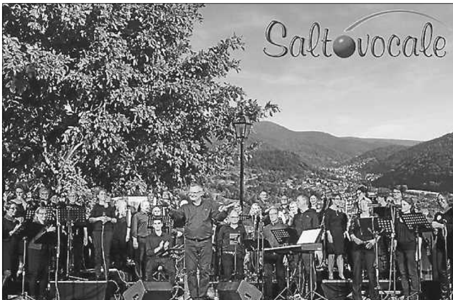
Salt o vocale im September auf der Platanenterrasse von Schloss Eberstein.

Die wöchentlichen Proben finden wieder ab Donnerstag, 1. September, um 20 Uhr im Gebetshaus Bad Rotenfels in der Mühlstr. 20 statt. Chorleiter Achim Rheinschmidt und die Vorstandschaft mit dem 1. Vorsitzenden Tim Keller