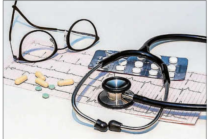
Die medizinische Versorgungssituation vor Ort: Mit dieser Thematik befasste sich der 'Runde Tisch Gernsbach'.

Auf Basis der Ergebnisse und Informationen, die im Rahmen des „Runden Tisches“ gesammelt wurden, werden nun weitere