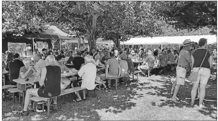
Unterhaltsamer Besuch beim Backofenfest.

Aufgrund der momentan herrschenden Preisschwankungen ist es nicht möglich, die Preise genau anzugeben. Sie sind jedoch gegenüber den regulären Baumschulpreisen bei Bezug über den OGV Lautenbach ermäßigt. Eine Sortenliste kann bei dem 2. Vorsitzenden auf Wunsch angefordert werden. Die bestellten Bäume und Sträucher werden