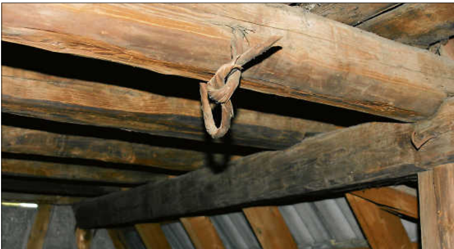
Bei den Führungen durch die Zehntscheuern lassen sich historische Details entdecken.

Im Jahr 2020 bewarb sich die Stadt Gernsbach erfolgreich um die Aufnahme in das Förderprogramm.