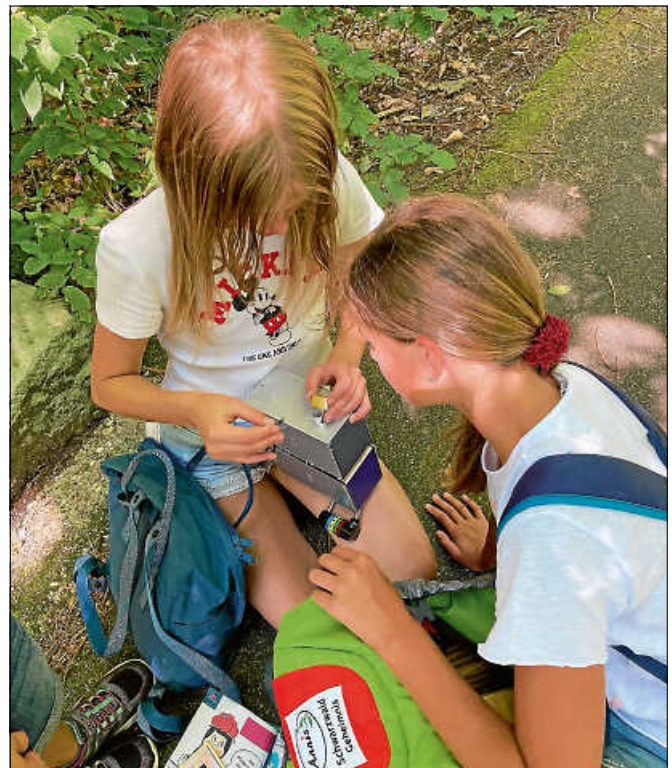
Gemeinsam werden spannende Rätsel gelöst.