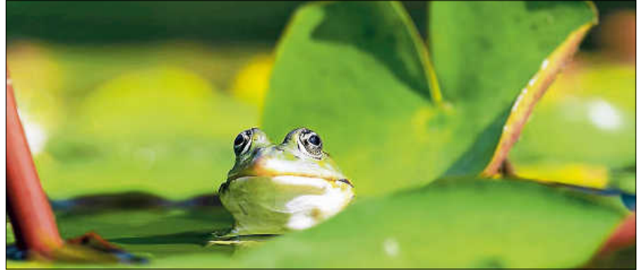
Das Abschöpfen von Wasser aus Bächen und Flüssen ist schädlich für die Pflanzen- und Tierwelt.

Fließgewässer führen nach wie vor wenig Wasser und einzelne lokale Schauer verbessern die Lage nicht nachhaltig. Angesichts der derzeitigen Wasserstände wird weiteres Abpumpen oder Abschöpfen selbst in geringen Mengen kritisch und kann zu gewässerökologischen Schäden der Tier- und Pflanzenwelt führen. ■