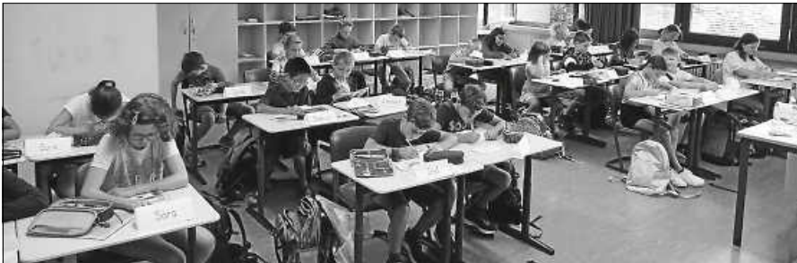
Die Klasse 5c in ihrem neuen Klassenzimmer.