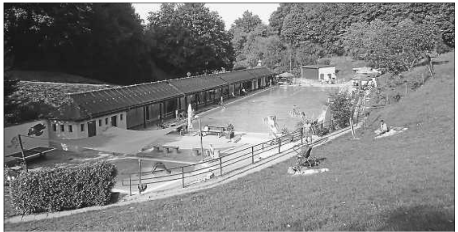
Schwimmbad Obertsrot mit der neuen Absorberanlage auf dem Dach.

Ab KW 41 startet der TVL wieder in sein umfassendes Trainingsprogramm. Etliche Gruppen im Erwachsenenbereich haben bereits in den vergangenen Wochen das Training schon aufgenommen. Ab 5.10. werden nun auch die anderen Gruppen wieder trainieren. Das Training erfolgt unter Einhaltung der Corona-Regeln und des Hygienekonzeptes des TVL. Genauere Informationen können bei den Trainern oder der Vorstandschaft eingeholt werden. Es ergeben sich vorübergehend folgende Änderungen im Trainingsplan: Das Eltern-Kind-Turnen und Kleinkinderturnen (montags) findet zunächst im 14-tägigen Wechsel von 16.30 bis 17.30 Uhr unter der Leitung von Beate Häfele-Zapf statt. Gestartet wird mit dem Kleinkindern in den ungeraden Wochen. Das EKT findet dann in den geraden Wochen (ab 12.10. um 16.30 Uhr) statt. Die Rockert Dancers (Tanzen ab 7. Klasse) trainieren dienstags von 18.00 bis 19.00 Uhr im Bürgerhaus. Die Fitness Gruppe wird gebeten sich der Gruppe um 19.00 Uhr unter der Leitung von Christa Melloh anzuschließen. Alle anderen Angebote finden zu den