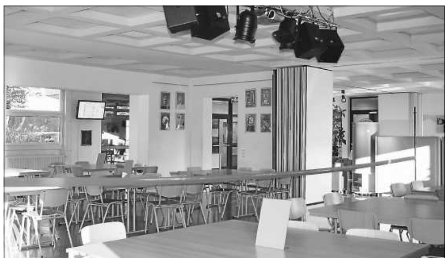
Mensa mit farbigen Zonen.

In diesem Schuljahr beginnt der erste Jahrgang in Klasse 10 mit der Realschulabschlussprüfung. Dazu bereiten sich die Schüler neben Deutsch, Mathematik und Englisch intensiv auf die schriftlichen und mündlichen Prüfungen in Französisch, Alltagskultur/Ernährung und Soziales und Technik vor. Um eventuelle Defizite