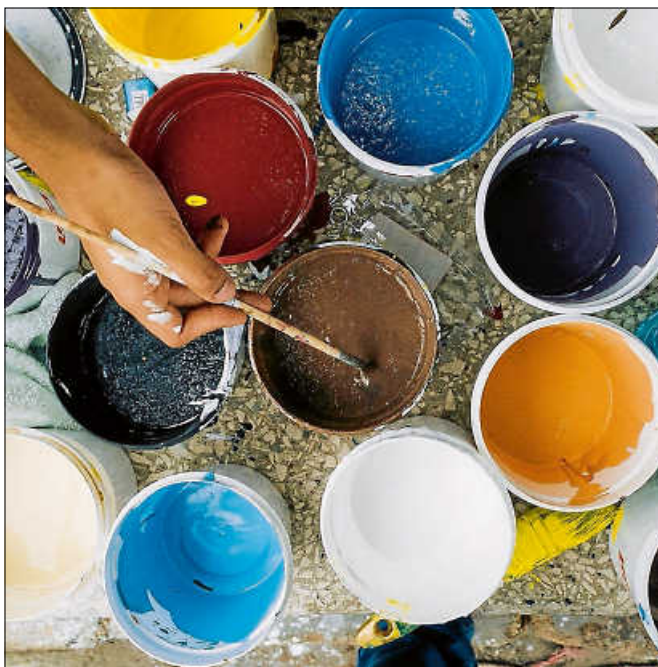
Ausgediente Farbeimer und andere im Haushalt anfallende Problemabfälle können beim Schadstoffmobil abgegeben werden.

Weitere Auskünfte erteilt der Abfallwirtschaftsbetrieb unter der Rufnummer 07222 381-5555. Alle Infos rund um die Abfallentsorgung finden sich auf der Homepage des Abfallwirtschaftsbetriebs: www.awb-landkreis-rastatt.de . ■