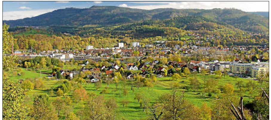
Auf der Gernsbacher Runde: Blick vom Lieblingsfelsen.

Altes Rathaus - Faltergasse - Hofstätte - Am Rumpelstein - Wingolfbrunnen - Schöne Aussicht - Eberpfad - Luisenruhe - Wachtelweg - Unter dem Schloss - Schloss Eberstein - Ochsenkopfweg - Jägerplatz - Saulauchkopfhütte - Nachtigall - Kieferscheid - Kohlplättel - Binsenwasen - Merkur - Wendeplatte - Zick-Zack-Weg - Nassmissweg - Auweg - Grossenberg - Galgeneck - Galgenbusch - Lieblingsfelsen - Weinau - Felix-Hoesch-Brücke - Bahnhof Gernsbach