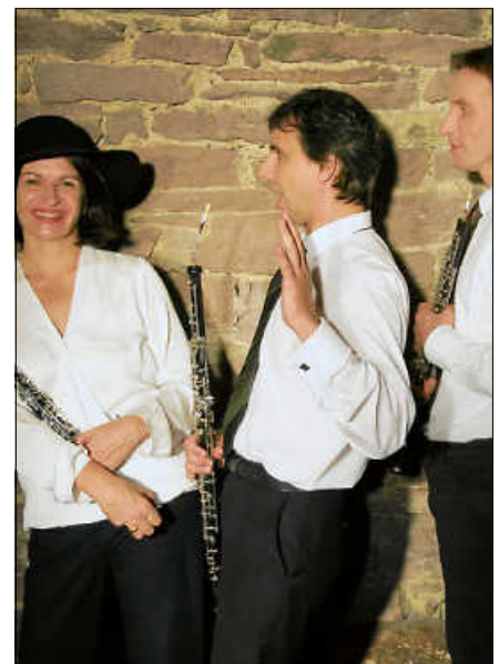
Die Holzbläser vom Busch Kollegium Karlsruhe.

Nur so lassen sich leer bleibende Plätze aber auch vergebliche Anläufe vermeiden. Wir bitten um Ihr Verständnis und um Ihre treue Aufmerksamkeit für unsere von der Baden-Württemberg Stiftung geförderte, kammermusikalische Reihe. ■