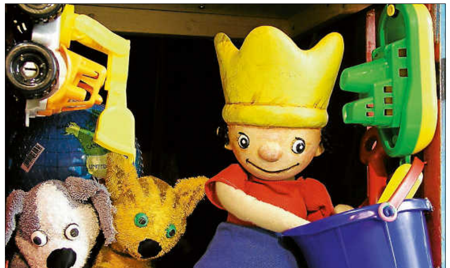
Der kleine König.

Sonntag, 28.02.2021: Balduin der Pinguin (für Kinder ab 4 Jahren)