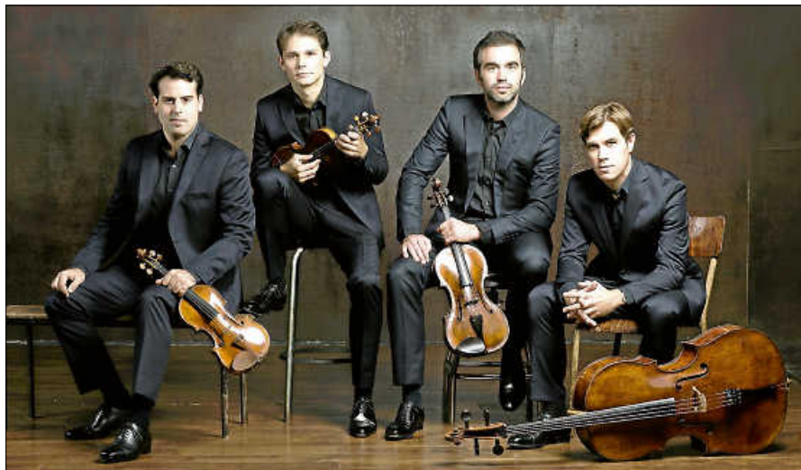
Streichquartett Quatuor Modigliani.

Zu hören sind in der Matinee am 11. Oktober das Streichquartett in a-Moll, D 804 („Rosamunde“) von Franz Schubert und das einzige Streichquartett von Maurice Ravel (F-Dur, op. 35).