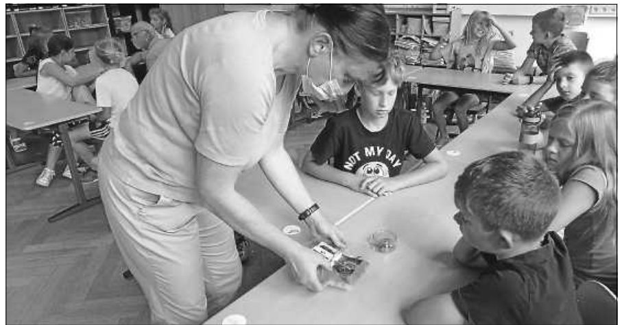
So eine tote Fledermaus kann genau betrachtet und auch gestreichelt werden.

Die Experten berichteten, dass sie sich jetzt im Herbst auf den Winterschlaf vorbereiten und dafür täglich ein Drittel ihres Körpergewichts an Nahrung aufnehmen, während des Winterschlafs die