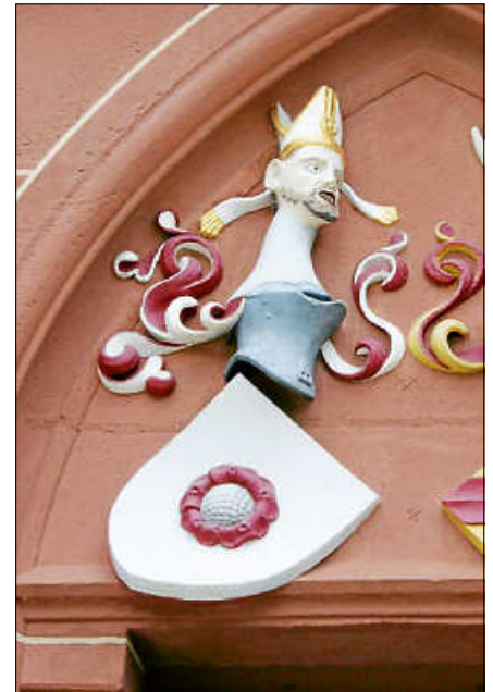
Die Ebersteiner Rose an der Kath. Kirche.