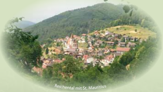
Reichental mit St. Mauritius