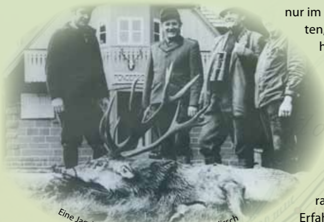
Eine Jagdgesellschaft vor einem erlegten Hirsch

Wir wollen Sie mit unserem Weg „Natur und Geschichte Pur“ ein kleines Stück mit unserem Leben im und mit dem Wald vertraut machen. Den Ort umschließen sieben Täler und damit sind wir fast vollständig von Wald umgeben. Reichental wurde 1339/40 zum ersten Mal urkundlich erwähnt und lebt seit Menschengedenken in Tradition mit dem Wald und den Waldberufen. Die Gemarkungsfläche betrug vor der Eingemeindung mit Gernsbach 4719 Hektar, davon waren 92% Wald, der zum einen Teil der Gemeinde, zum anderen Teil dem Land Baden-Württemberg als Staatsforst und Staatsjagd gehörte.