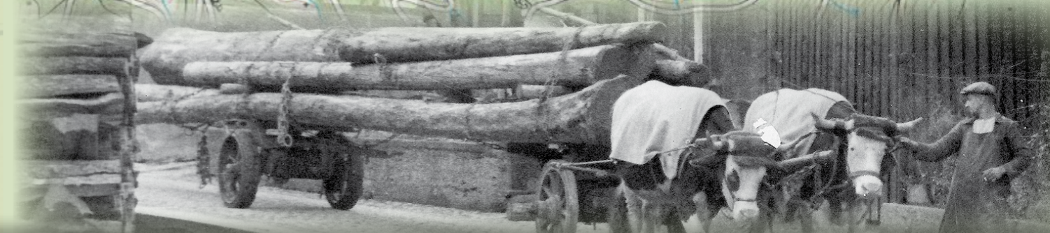
Langholzfuhrwerke wurden von Ochsen oder Pferden gezogen