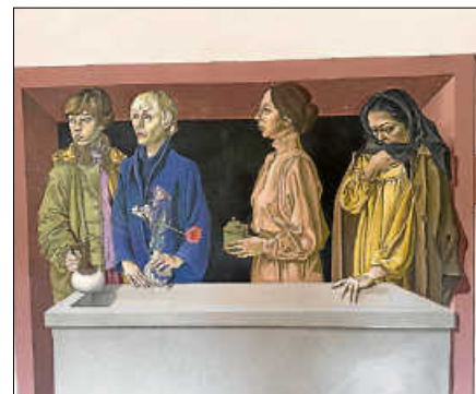
Aussegnungshalle Staufenberg - Ausmalungen des Künstlers Reinhard Dassler.

Im Storchenturm präsentiert der Arbeitskreis Stadtgeschichte wieder Informationen zu der mittelalterlichen Wehranlage der Stadt.