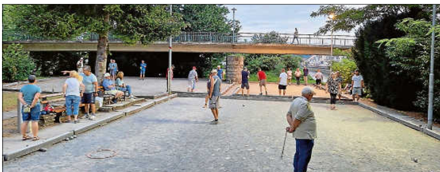
Treffen der Boulespieler auf der Murginsel.

Der OGV Gernsbach lädt seine Mitglieder sowie Freunde und Interessierte zu einem Tagesausflug am 13. Oktober in den Gasometer und nach Bad Wildbad ein. Start ist um 9 Uhr am Bahnhof Gernsbach, die Rückkehr ist gegen 19.30 Uhr