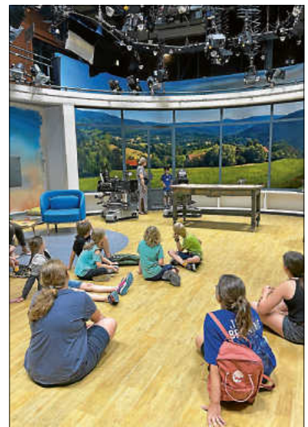
Beim Besuch des SWR in Baden-Baden besichtigten die teilnehmenden Kinder auch das Studio von Kaffee oder Tee.

Spiel und Spaß beim Musikverein Lautenbach (ab 6 Jahren) ■