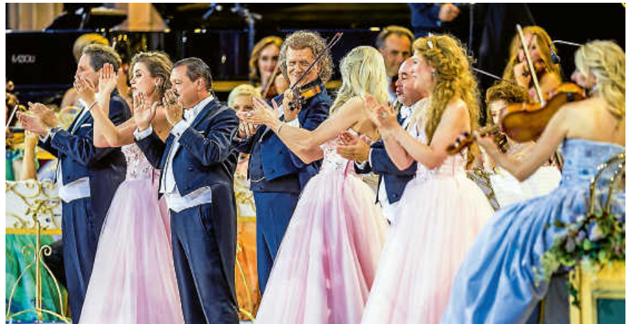
André Rieu und das Johann Strauss Orchester.

André Rieu ist der gefeierte Superstar der populären klassischen Musik. Er ist bekannt für seine außergewöhnliche Karriere und seine einzigartigen Erfolge. Mit seinen Maastricht-Konzerten hat er weltweit den Maßstab für spektakuläre Live-Auftritte gesetzt. Jedes Jahr pilgern Scharen von Bewunderern aus allen Ecken der Welt in seine Heimatstadt Maastricht, um selbst zu erleben, wie der Walzerkönig bei seinen Sommerkonzerten das Publikum begeistert. Drei Wochen lang diente der zauberhafte Vrijthof-Platz mitten in der Stadt als