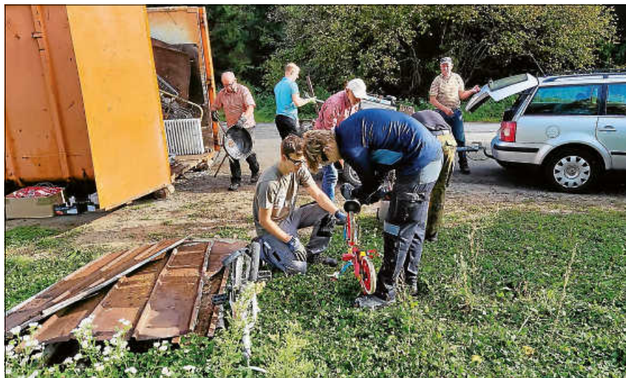
Das Altmetall muss sorgfältig getrennt werden.

Der Musikverein Orgelfels Reichental führt am Samstag, 26. Oktober, eine Altmetallsammlung in Reichental durch. Gesammelt wird nur Altmetall, aber keine Elektrogeräte. Das Altmetall soll gut sichtbar ab 8 Uhr am Straßenrand abgestellt sein. Bei Bedarf Abholung nach vorheriger Anmeldung bei Guido Wieland, Tel. 0151 41223081 oder Anlieferung direkt am Container am Samstag, 26. Oktober, zwischen 9 und 12 Uhr. Die Einnahmen werden für Instrumente und Reparaturen dringend benötigt. Der