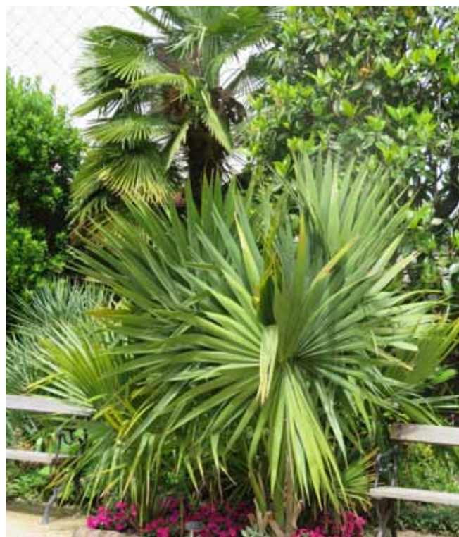
▲ Ruhebänke inmitten der einzigartigen Palmenpromenade

Dank des besonders milden Kleinklimas am Flusslauf der Murg gedeihen hier außergewöhnliche Pflanzen, die dem Garten ein mediterranes Flair verleihen. Mit einer exklusiv ausgepflanzten Palmenammlung mit alleine 15 Arten aus den verschiedensten Ländern der Erde von Argentinien bis Japan, weiter blühenden Bananenstauden, rankenden Passionsblumen mit ihren orangefarbenen Eierfrüchten sowie von der Sonne verwöhnte Granatäpfel im Herbst, zweimal im Jahr