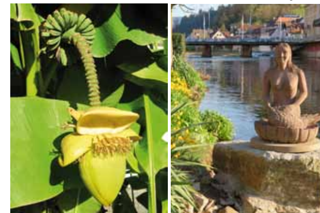
▲ Bananenstaude mit Früchten

Um die wertvolle Gartenanlage mit den darin befindlichen Sammlerstücken und Bauwerken für die Nachwelt zu erhalten, gründete sich im Jahre 1995 der Arbeitskreis Katz'scher Garten. Von 1996-2001 blieb der Garten für die aufwändige Restauration geschlossen, die von ehrenamtlichen Helfern in Zusammenarbeit mit der Stadt Gernsbach vorgenommen wurde.