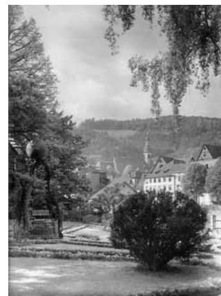
▲ Historische Ansicht des Katz'schen Gartens aus dem Jahre 1928

1849 diente der Garten zur Murguferseite als Gefechtsstellung der preußischen Truppen bei der Badischen Revolution.