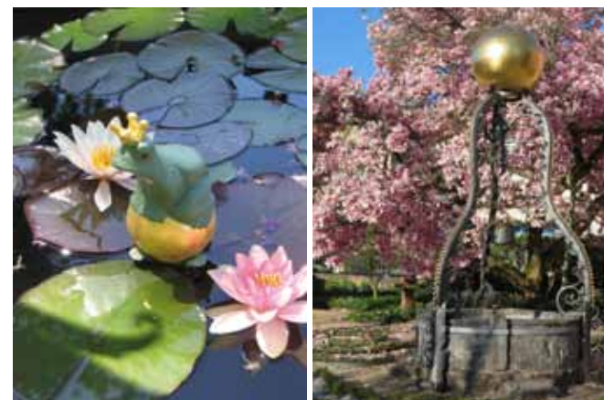
Ziehbrunnen mit Weltkugel ▼

Der Grundstein des Katz'schen Gartens wurde Anfang 1800 gelegt, nachdem die feudale Villa auf der gegenüberliegenden Seite der Murgschifferfamilie Katz durch den damaligen Großherzoglichen Baumeister Friedrich Weinbrenner aus Karlsruhe oder seiner Schüler fertig gestellt war. Ein italienischer Gartenbauarchitekt soll den für die ländliche Region ungewöhnlichen Garten geplant und gestaltet haben.