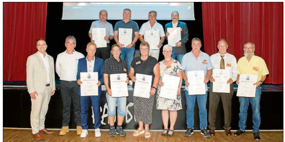
Geschäftsführung und Bürgermeister danken für den unermüdlichen Einsatz.

In seiner Ansprache hob der Bürgermeister die Loyalität und das Engagement der Mitarbeiter hervor, die nicht nur zur Stabilität des Unternehmens, sondern auch zur Entwicklung Gernsbachs beitragen. Die Veranstaltung bot einen würdigen Rahmen, um die außer-