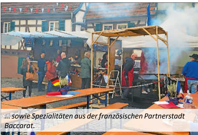
... sowie Spezialitäten aus der französischen Partnerstadt Baccarat.