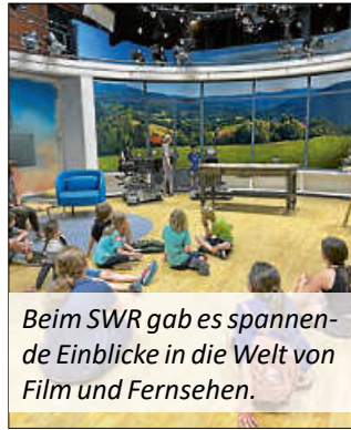
Beim SWR gab es spannende Einblicke in die Welt von Film und Fernsehen.