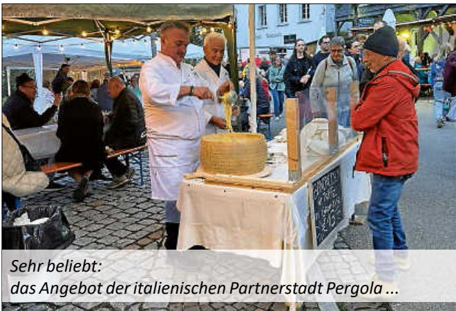
Sehr beliebt: das Angebot der italienischen Partnerstadt Pergola ...