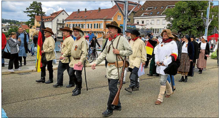
Einzug der Mitwirkenden des Revolutionstheaters.

Die kulinarische Vielfalt, das breitgefächerte musikalische Programm, zahlreiche Kunsthandwerkstände und