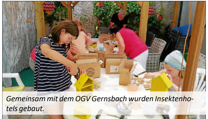
Gemeinsam mit dem OGV Gernsbach wurden Insektenhotels gebaut.