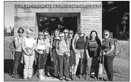
Ausflug der Wellness-Gruppe.

ter hätte nicht schöner sein können und die Einkehr in der Kniebishütte rundete den Tag für die Damen perfekt ab.