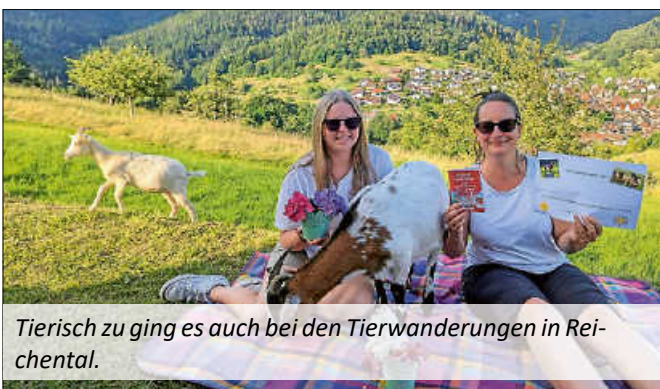
Tierisch zu ging es auch bei den Tierwanderungen in Reichental.