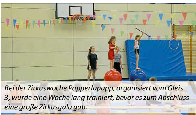
Bei der Zirkuswoche Papperlapapp, organisiert vom Gleis 3, wurde eine Woche lang trainiert, bevor es zum Abschluss eine große Zirkusgala gab.