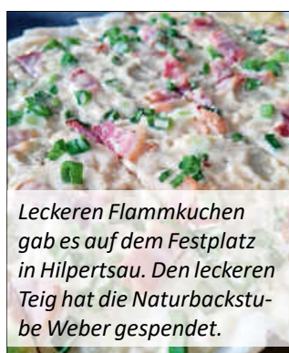
Leckeren Flammkuchen gab es auf dem Festplatz in Hilpertsau. Den leckeren Teig hat die Naturbackstube Weber gespendet.