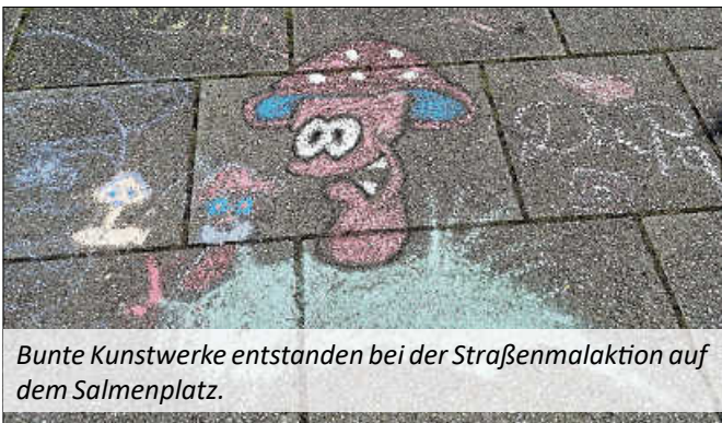
Bunte Kunstwerke entstanden bei der Straßenmalaktion auf dem Salmenplatz.