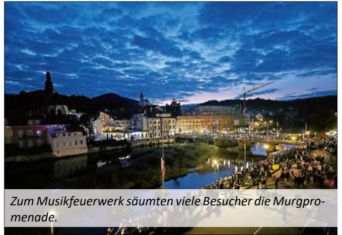
Zum Musikfeuerwerk säumten viele Besucher die Murgpromenade.