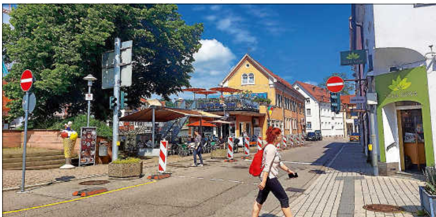
Das Ziel des Konzepts: Eine Infrastruktur schaffen, die das Zufußgehen und Radfahren sicherer, komfortabler und attraktiver macht.

Alle Informationen gibt es auf der Homepage der Stadt Gernsbach unter: www.gernsbach.de/radverkehr . ■