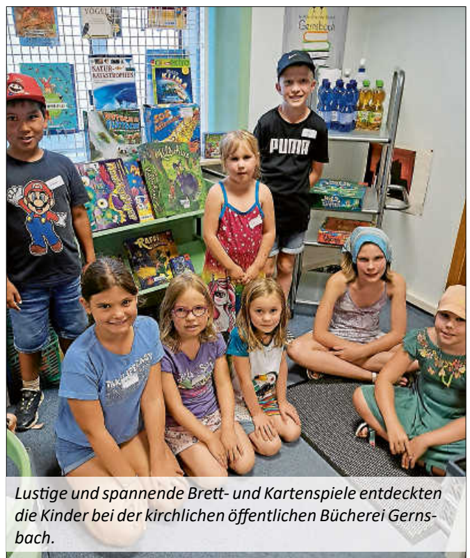
Lustige und spannende Brett- und Kartenspiele entdeckten die Kinder bei der kirchlichen öffentlichen Bücherei Gernsbach.