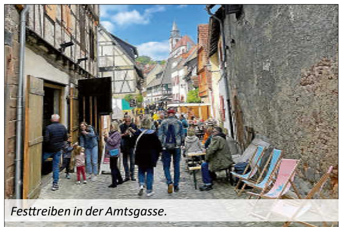
Festtreiben in der Amtsgasse.