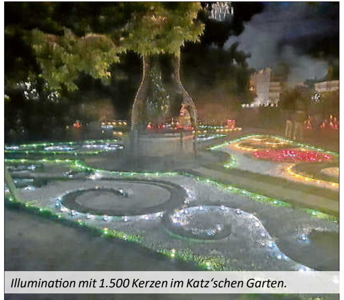
Illumination mit 1.500 Kerzen im Katz'schen Garten.