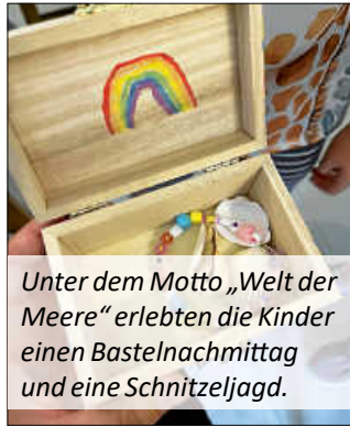
Unter dem Motto „Welt der Meere“ erlebten die Kinder einen Bastelnachmittag und eine Schnitzeljagd.