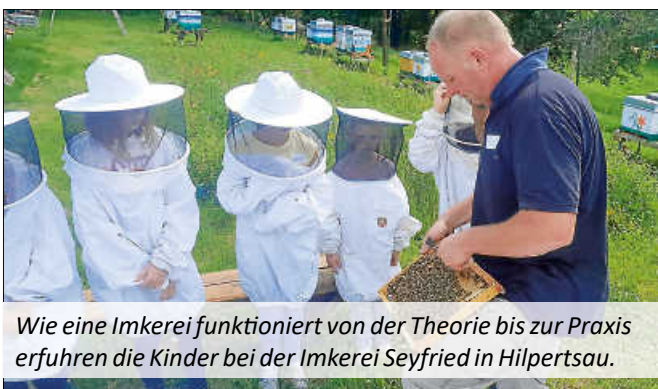
Wie eine Imkerei funktioniert von der Theorie bis zur Praxis erfuhren die Kinder bei der Imkerei Seyfried in Hilpertsau.