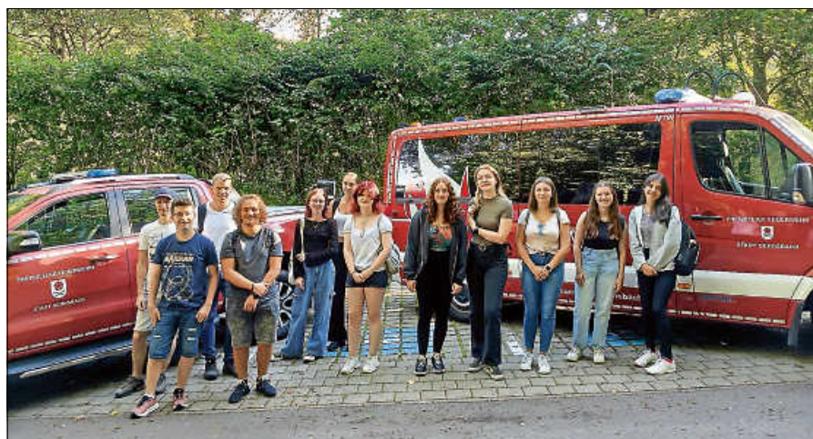
Dank der Feuerwehr Gernsbach erreichten die Azubis sicher das Haus Lautenbach zum ersten Programmpunkt.