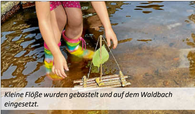
Kleine Flöße wurden gebastelt und auf dem Waldbach eingesetzt.