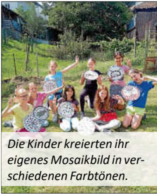
Die Kinder kreierten ihr eigenes Mosaikbild in verschiedenen Farbtönen.