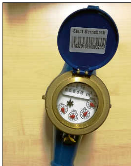
Die Wasserzähler müssen in diesem Jahr bereits bis 4. Oktober mitgeteilt werden.

liegen, muss der Verbrauch seitens der Stadtwerke geschätzt werden. ■