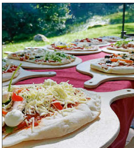
Frisch und ganz nach individuellem Geschmack belegte Pinsas.