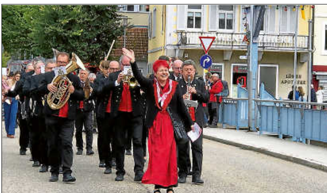
Einzug der Stadtkapelle über die Stadtbrücke.