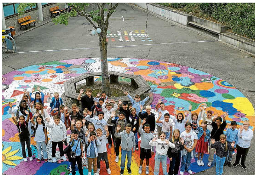
Die neuen Fünftklässler in der Realschule.