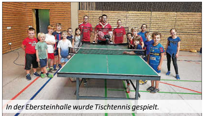
In der Ebersteinhalle wurde Tischtennis gespielt.