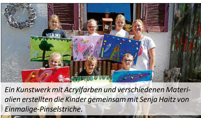
Ein Kunstwerk mit Acrylfarben und verschiedenen Materialien erstellten die Kinder gemeinsam mit Senja Haitz von Einmalige-Pinselstriche.