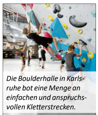
Die Boulderhalle in Karlsruhe bot eine Menge an einfachen und anspruchsvollen Kletterstrecken.