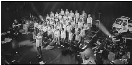
Salt o vocale in Aktion beim letztjährigen Jubiläumskonzert.