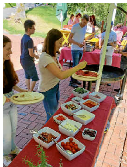
Azubis beim kreativen Belegen ihrer individuellen Pinsas.

Wer Interesse an einer Ausbildung bei der Stadt Gernsbach hat, kann sich gerne informieren. Ausführliche Informationen zu den verschiedenen Ausbildungsberufen sind auf der Internetseite www.gernsbach.de/ausbildung zu finden. Bewerbungen sind per E-Mail an ausbildung@gernsbach.de zu richten. ■