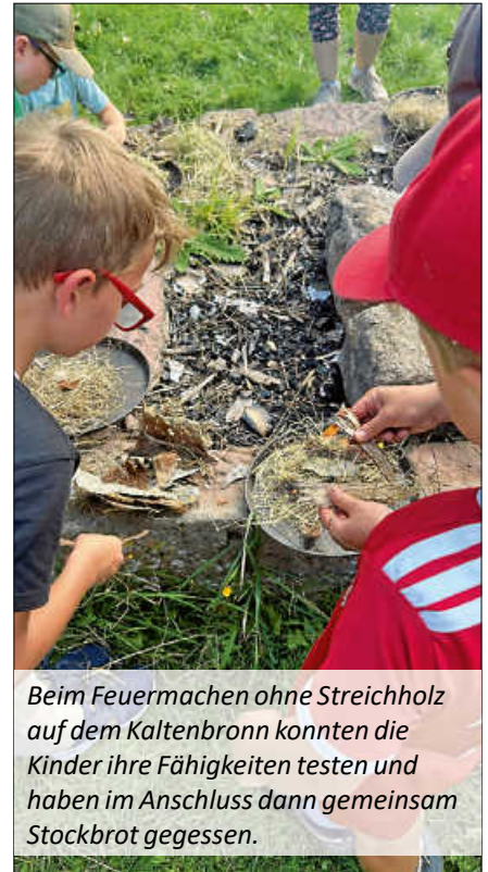
Beim Feuermachen ohne Streichholz auf dem Kaltenbronn konnten die Kinder ihre Fähigkeiten testen und haben im Anschluss dann gemeinsam Stockbrot gegessen.