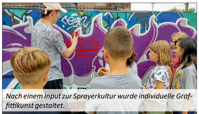
Nach einem Input zur Sprayerkultur wurde individuelle Graffiti-Kunst gestaltet.