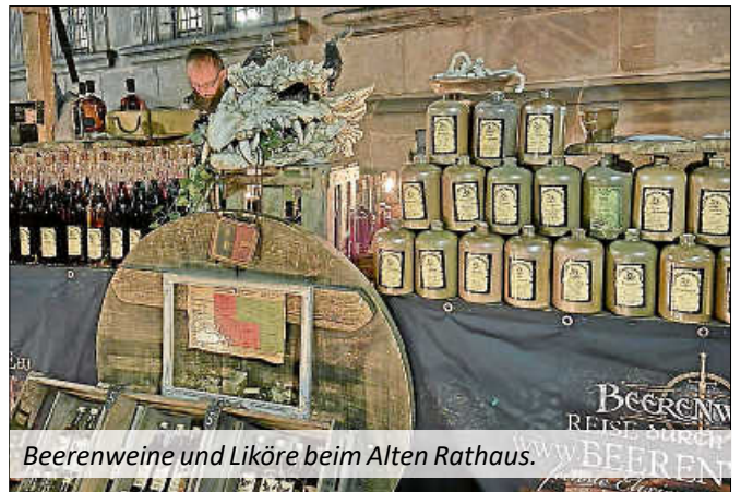
Beerenweine und Liköre beim Alten Rathaus.