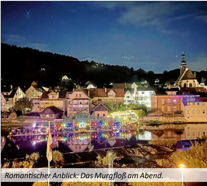
Romantischer Anblick: Das Murgfloß am Abend.