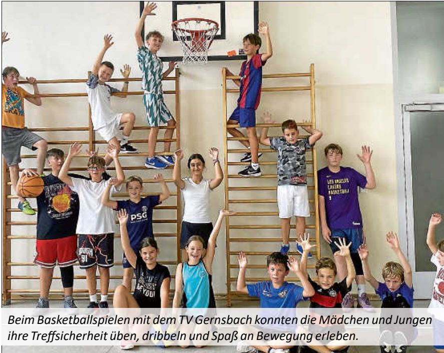
Beim Basketballspielen mit dem TV Gernsbach konnten die Mädchen und Jungen ihre Treffsicherheit üben, dribbeln und Spaß an Bewegung erleben.