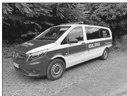
Das neue Einsatzfahrzeug.

stellung werden Pfarrer Jochen Lenz von der evangelischen und Vikar Adalbert Mutuyisugi von der katholischen Kirchengemeinde das Fahrzeug segnen. Im Anschluss wird es noch einen Umtrunk und einen kleinen Snack geben. Hier besteht dann natürlich auch die Möglichkeit, das neue Einsatzfahrzeug intensiv zu besichtigen. Neben dem neuen Fahrzeug steht auch das Bootsgruppenfahrzeug (inklusive Hochwasserboot) des DLRG-Bezirks Mittelbaden, welches Teil des Wasserrettungszuges 3 des Landes Baden-Württembergs ist, zur Besichtigung bereit. Zu diesem besonderen Ereignis sind alle Gernsbacher Bürgerinnen und Bürger herzlich eingeladen. Die Veranstaltung endet gegen 14.30 Uhr.