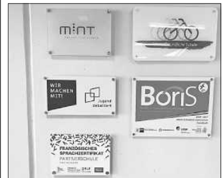
Siegel am Schuleingang.

neuer erwähnenswerter Meilenstein im Angebot der Schule. Außerdem finden vielfältige AG-Angebote statt, die unter anderem den dreizügig gestarteten Fünftklässlern (78) offenstehen. Die Neuzertifizierung als MINT-freundliche Schule erfolgt im Oktober.