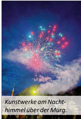
Kunstwerke am Nachthimmel über der Murg.