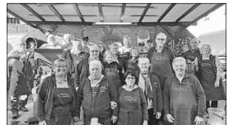
Mit Freude beim Altstadtfest aktiv: die Süßmostgruppe.