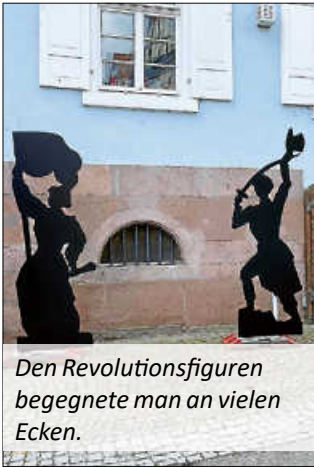
Den Revolutionsfiguren begegnete man an vielen Ecken.