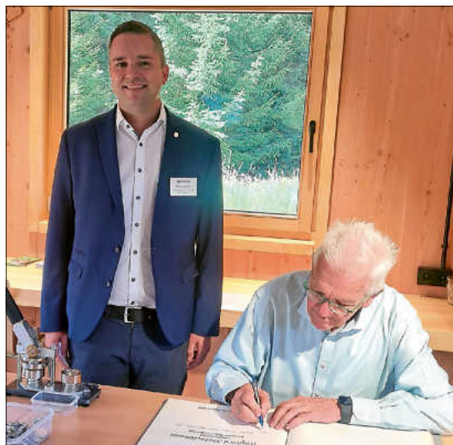
Ministerpräsident Kretschmann trägt sich ins Goldene Buch der Stadt Gernsbach ein.

Mit den Worten „Der Stadt Gernsbach wünsche ich eine gute Entwicklung für die Zukunft zum Wohle von Natur und der ganzen Bürgerschaft“ verewigte er sich in dem für Ehrengäste und verdiente Gernsbacherinnen und Gernsbacher reservierten Buch. ■