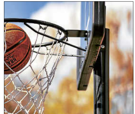
Basketball spielen macht Spaß.

Nr. 41 Montag, 02.09., Spiel und Spaß auf der Murginsel (ab 10 Jahren) Nr. 43 Mittwoch, 04.09., Wo kommen unsere Pflanzen her? (ab 8 Jahren) Nr. 47 Freitag, 06.09., Basketball spielen macht Spaß (ab 10 Jahren) Nr. 49 Freitag, 06.09., Spiel und Spaß beim Musikverein Lautenbach (ab 6 Jahren) ■