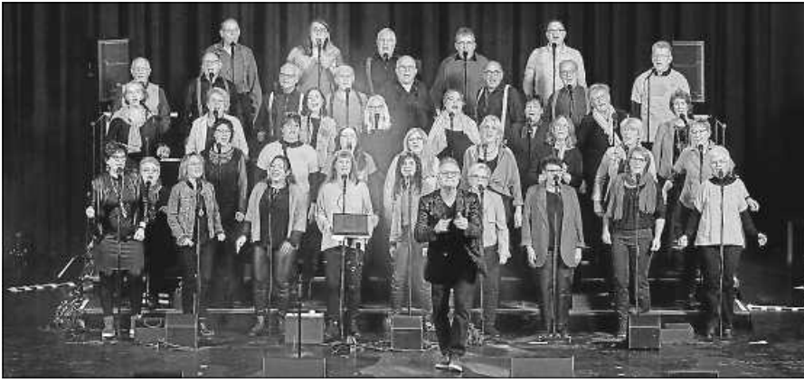
Salt o vocale in Konzertlaune.