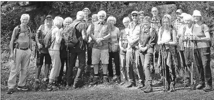
Die Mittwochswanderer unterwegs von Ebersteinburg nach Bad Rotenfels.

Die Mittwochswanderer treffen sich am 4. September um 9.45 Uhr am Bahnhof Gernsbach zur Fahrt nach Kaltenbronn. Dort beginnt die Wanderung über das Wildseemoor und weiter zur Weißensteinhütte. Von dort geht es über Blockhauswald auf dem Rotfußweg zum Lehenbrücke und einem kurzen Abstecher zum Großen Wendenstein. Der Weg führt dann zur Saustallhütte, und bald sind der Sommerberg und die Skihütte der Skizunft Bad Wildbad zur Mittagseinkehr erreicht. Danach kann noch ein Blick auf die Hängebrücke Wildline geworfen werden, bevor es auf dem Zickzackweg hinab ins Städtchen Bad Wildbad geht. Die Tour ist ca. 14 km lang, es sind ca. 120 Hm aufwärts, 500 Hm abwärts zu wandern, festes Schuhwerk und Wanderstöcke werden empfohlen. Gäste sind