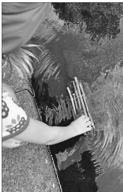
Flöße bauen beim Kinderferienprogramm.

kühlen Nass barfuß, mit Gummistiefeln oder Wasser-Sandalen zu folgen. Zur Abkühlung gab's zum Schluss des arbeitsreichen Nachmittags noch ein erfrischendes Eis. Danach durften die Kinder ihre gebastelten Flöße mit nach Hause nehmen. Ein bleibendes Erlebnis, das nicht in erster Linie der Geschichtsvermittlung diente, aber den Zugang zu einer der historischen Besonderheiten der Murgtalstadt schuf.