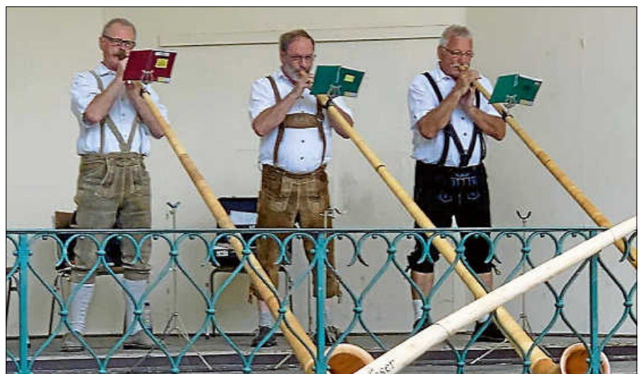
Konzert der Alphornbläser im Kurpark.

Mit dem weichen Ton des Alphorns möchten sie die Zuhörerinnen und Zuhörer in Urlaubsstimmung versetzen. Aber auch flotte Polkas und Märsche werden zu hören sein. Der Eintritt ist wie gewohnt frei. ■