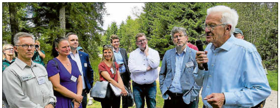
Kretschmann würdigt den Einsatz aller Beteiligten.

dem Aussterben des Auerhuhns und dem Betrieb von Windenergieanlagen keinen Zusammenhang gebe. Kretschmann würdigte den Einsatz aller Beteiligten und betonte, dass es vordergründig darum gehe, die Konflikte zu managen, die sich aus dem Erhalt der Kulturlandschaften und des Industriestandorts Baden-Württembergs ergeben. ■