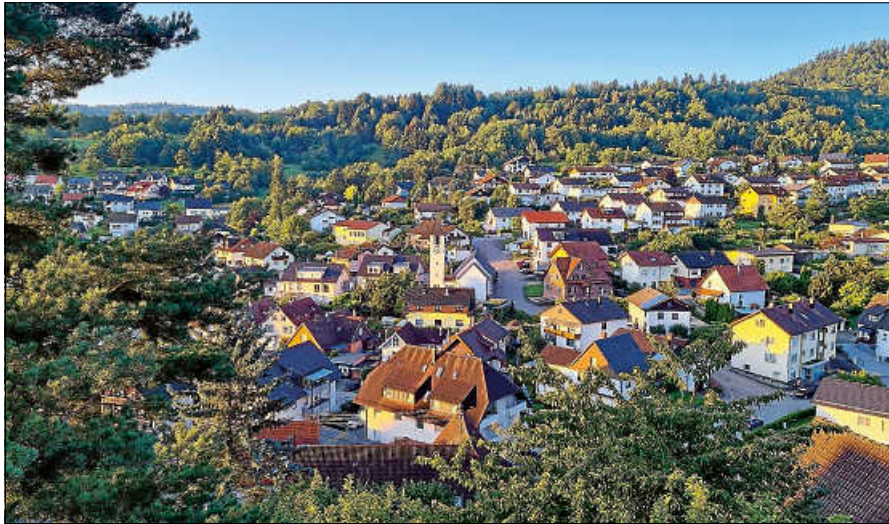
‚Rathaus vor Ort‘ in Staufenberg.

Donnerstag, 17. Oktober, 18 Uhr, im Restaurant La Piazza ■