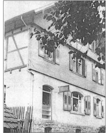
Suchbild: Wo stand dieses Haus?

Der ca. 2-stündige Rundgang startet um 14 Uhr am Kirchl. Der Turnverein Obertsrot freut sich über zahlreiche Besucher.