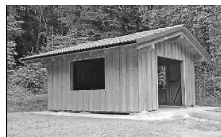
Neubau der Hardtberghütte.