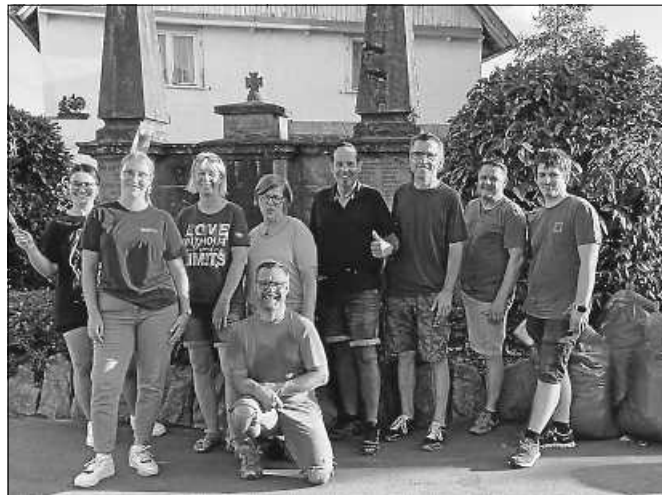
Die fleißigen Helferinnen und Helfer.

Bender „Champions-Party“ ab 19 Uhr gebührend gefeiert. Zudem können sich die Fußballfans um 16 Uhr auf ein „Damen-9-Meterschießen“ der örtlichen Vereine und gegen 17 Uhr auf ein Einlagenspiel der Jugend freuen. Neben den Klassikern vom Grill bietet der Verein seinen Gästen am gesamten Wochenende die legendären FCA-Burger und vegetarische Tomaten-Mozzarella-Brötchen. Der FC Auerhahn Reichental freut sich darauf, wieder zahlreiche Besucher auf dem Sportplatz zum Sportfest 2024 begrüßen zu dürfen.