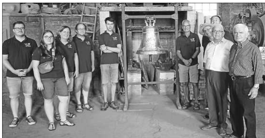
Ensemble des Musikvereins in der Glockengießerei Marinelli.