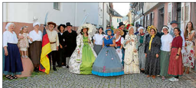
Derzeit finden Proben für das Revolutionsspiel statt.