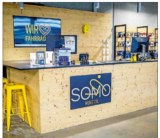
Mehr zu der Idee unter: https://www.somo2rad.de

Geplant sind neben Reparatur und Verkauf klassischer Fahrräder und eBikes auch besondere Mobilitätsangebote, gerade auch für Menschen mit Behinderung. ■