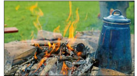
Ein Lagerfeuer gehört beim Wildnistag auf dem Kaltenbronn dazu.

Kosten: 25 Euro für Erwachsene und 15 Euro pro Kind. Buchung unter www.infozentrum-kaltenbronn.de/kalender . ■