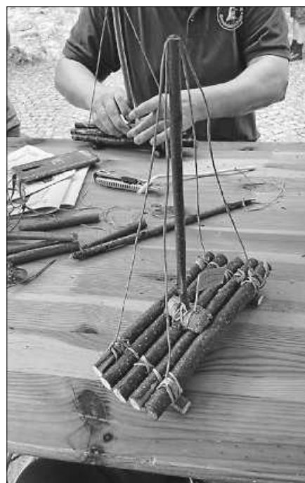
Flößlebau an der Waldbach.