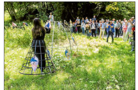
Jule Doll, Cage (home sweet home), 2024, Iglu aus Stahl.

In der begleitenden einmaligen Performance am Tage der Eröffnung nahm Jule Doll diese Fragestellungen auf und verwob sie mit dem dunklen, archetypischen Märchen Gebrüder Grimms „Hänsel und Gretel“. Damit verwies sie auf die Instabilität des Gefühls von Heimat und dem Drang des „Zuflucht-Findens“ in der heimatlichen – unheimlichen Natur. ■