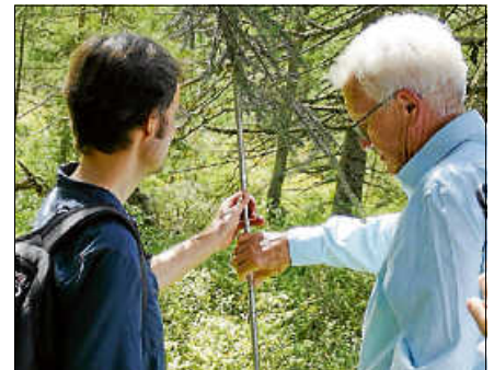
Mit einem Bohrstock prüft der Landeschef die Feuchtigkeit des Moores.