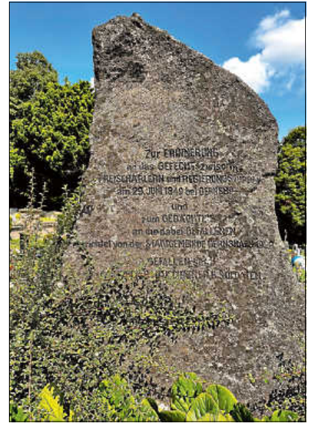
Freischärler-Denkmal Evangelischer Friedhof.

Historische Ortsbegehung Obertsrot mit Hubert Götz, Treffpunkt am Kirchl: 14 Uhr ■