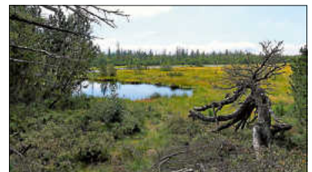
Das LIFE-Projekt MooReKa hat die Rettung des Hohlohmoors zum Ziel.

dem Aussterben des Auerhuhns und dem Betrieb von Windenergieanlagen keinen Zusammenhang gebe. Kretschmann würdigte den Einsatz aller Beteiligten und betonte, dass es vordergründig darum gehe, die Konflikte zu managen, die sich aus dem Erhalt der Kulturlandschaften und des Industriestandorts Baden-Württembergs ergeben. ■