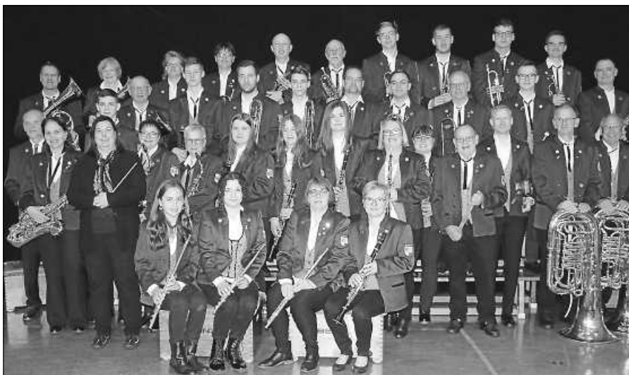
Der Musikverein präsentiert sich im Kurpark Bad Rotenfels.

Vergangene Woche hat der Scheuerner Fasnachtsclub das Sternenhüttel und das Denkmal in Scheuern am Sternplatz wieder auf Vordermann gebracht. Einige fleißige Helfer jäteten Unkraut und befreiten das Denkmal von übermäßigem Bewuchs. Nun sieht alles wieder vorbildlich aus.