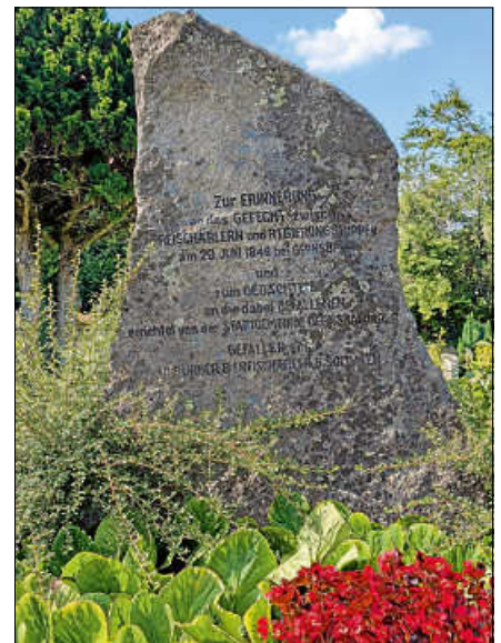
Seit 1928 erinnert ein Gedenkstein auf dem evangelischen Friedhof an die Toten des Gefechts um Gernsbach am 29. Juni 1849.

Die Eröffnung der Ausstellung findet am Samstag, 7. September, um 11 Uhr im großen Sitzungssaal des Rathauses statt. Nach der Begrüßung und Eröffnung durch Bürgermeister Julian Christ führt Stadtarchivar Wolfgang Froese in