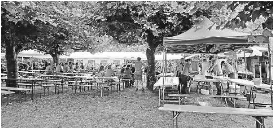
Die Gäste des Backofenfestes trotzten dem Regen.