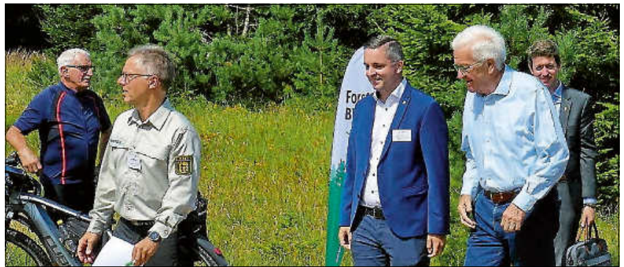
Ankunft des Ministerpräsidenten auf dem Kaltenbronn.

Mit großem Interesse verfolgte Kretschmann die Ausführungen von Regierungspräsidentin Felder zum LIFE-MooReKa-Projekt, das die Rettung des Hohlohmoors auf einer Fläche von 68 Hektar zum Ziel hat. An der Projektsumme von 8,7 Mio. Euro beteiligt sich die EU zu 75 % (6,55 Mio. Euro), was die hohe Bedeutung des Projektwertes erkennen lässt. Das Land Baden-Württemberg trägt unter Einrechnung der Finanzbeiträge der Landkreise Rastatt und Calw, die restliche Summe zu 25 % (2,15 Mio. Euro). Die Renaturierung des