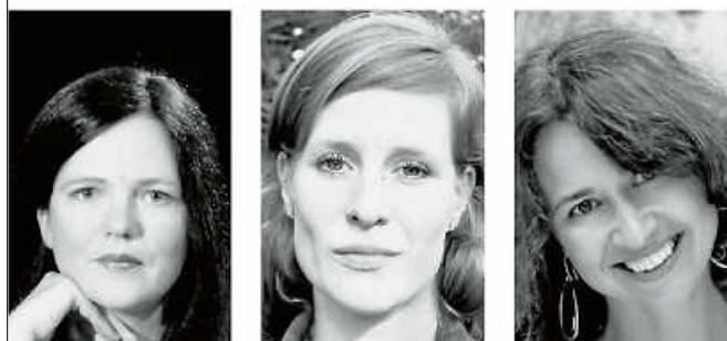
Die Musiker:innen der Formation tomaris&friends.