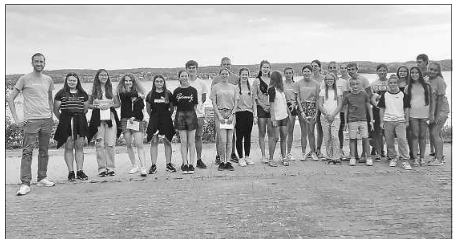
Ferienlager der Gernsbacher Jugend

Auch in den Sommerferien 2023 wird wieder ein Ferienlager stattfinden, dann aber an einem anderen Ort. Alle Infos dazu werden im kommenden Frühjahr veröffentlicht.