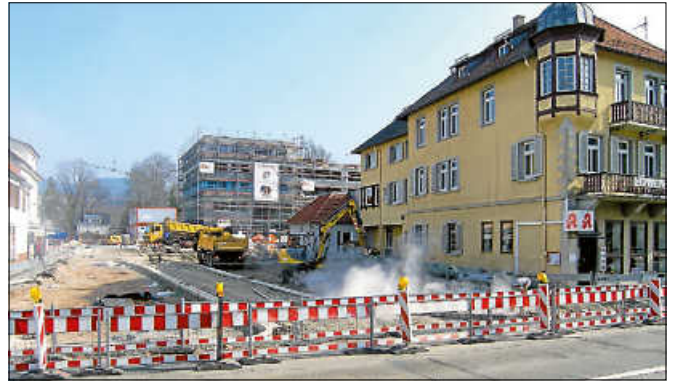
Die Baustelle am 02.03.2012.