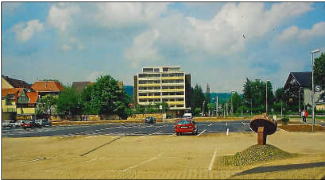
80er- und 90er Jahre.