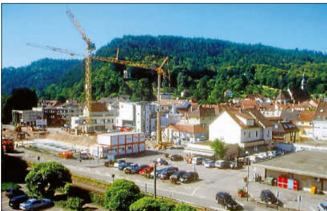
Bau des Hochhauses am Salmenplatz, 2011.