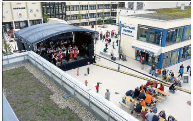
Blick auf die Eröffnungsfeier am 29.09.2012 von oben.