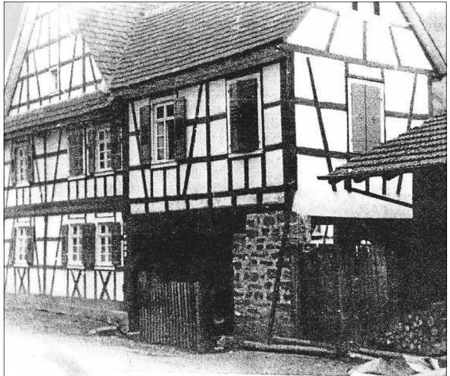
Wer kennt dieses Haus noch?

Zum sechsten Spieltag der Bezirksliga Baden-Baden kommt am Sonntag, 11. September, der SV Sinzheim II auf den