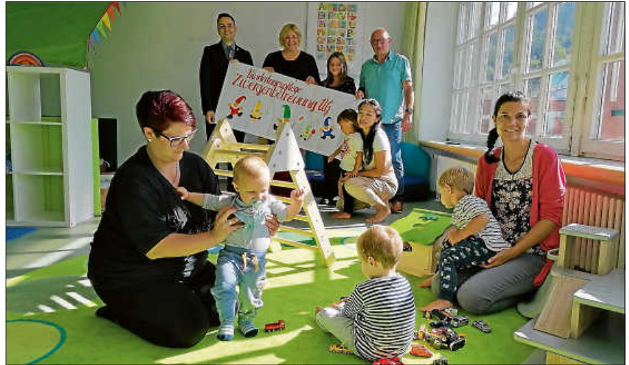
U3-Betreuung geht in Reichental an den Start.

Bürgermeister Christ wünscht alles Gute zur Eröffnung: „Schön, dass wir jetzt auch in Reichental eine Betreuung für unter Dreijährige anbieten können. Wünsche dem Team von der Zwergenbetreuung viel Spaß und Erfolg.“ ■