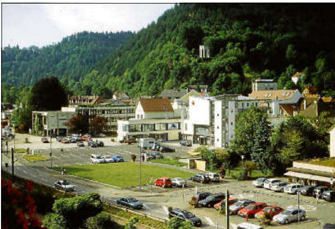
Parkplatz, 2000er Jahre.