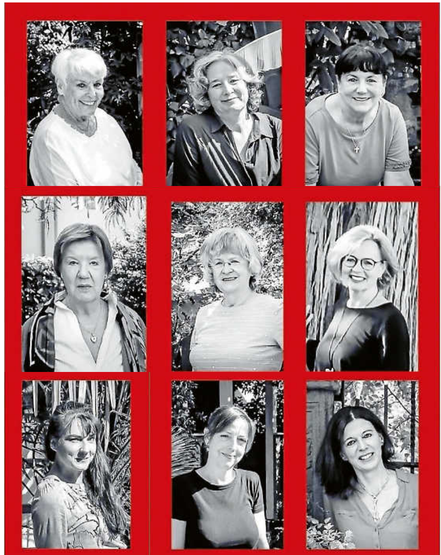
Neun Frauen lesen aus dem Buch 'Literarische Frauenzimmer'.

Der Eintritt ist frei. Um Anmeldung wird gebeten. Info@buecherstube-gernsbach.de oder Telefon 07224 40133. ■