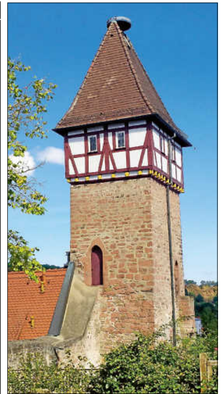
Der Storchenturm.

Das Motto des Tages „KulturSpur. Ein Fall für den Denkmalschutz“ wird inhaltlich auch bei einer Ortsbegehung von Hubert Götz in Obertsrot aufgenommen. Bei der Runde werden Originalschauplätze besucht und Gebäude sowie Menschen in den Mittelpunkt gerückt. Auf der Runde können rätselhafte Zeichen im Fachwerk entdeckt werden. Des Weiteren werden weitere Spuren früherer Bewohner angesprochen. Nicht alle Denkmäler konnten in Obertsrot erhalten werden und es gibt auch das ein-