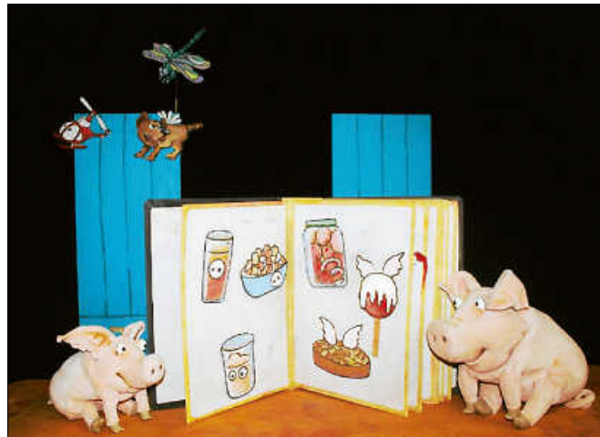
„Piggeldy und Frederick“.

Alle Veranstaltungen finden in der Stadthalle Gernsbach statt.