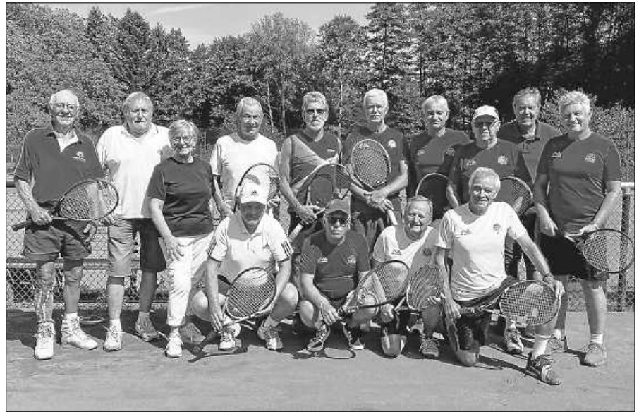
Teilnehmer der Senioren-Clubmeisterschaften des TCG.

14. September, Mittwochnachmittag in Baden-Baden Hasensprung Rundweg, Welterbe-Wanderung Treffpunkt Gernsbach Bf um 13.45 Uhr zwecks Bildung von Fahrgemeinschaften oder 14.02 Uhr mit Bus 244 nach Baden-