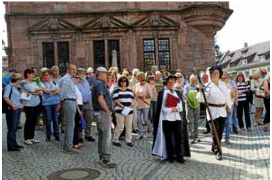
Lebendig dargestellte Stadtgeschichte mithilfe von Spielszenen.

Um bei allem Vergnügen auch bestmögliche Information zu gewährleisten, wird der Stadtwächter vom gelehrten