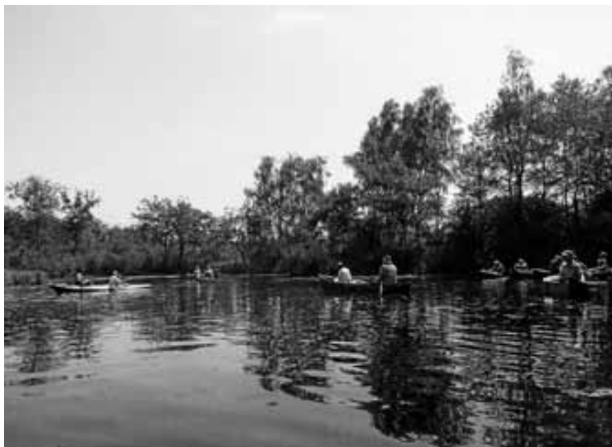
Bootstour auf dem Brunnenwasser im Elsass.

Am Samstag, 25. und Sonntag, 26. August, veranstaltet der TC Blumenweg sein Saisonabschlussfest. Sportwart und Vorstand würden sich sehr freuen, zu diesem Event viele Aktive und auch Nicht-Aktive noch einmal in 2018 auf der Clubanlage zu begrüßen, zumal Anmeldezahlen und aktive Beteiligung bei den diesjährigen Clubmeisterschaften so gering waren, dass einige Wettbewerbe nicht stattfinden konnten. So soll nun das traditionelle Mixed-Turnier ausgetragen werden und es wird der zunächst mangels Anmeldungen abgesagte Herren-Doppel-Wettbewerb nachgeholt. Meldungen im Doppel und auch Mixed wie gehabt direkt an den Sportwart per E-Mail, WhatsApp, Telefon oder Eintragung in die Liste, die am Clubhaus aushängt. Bei Einzelmeldung wird wie immer versucht, einen geeigneten