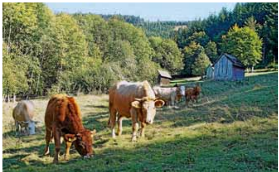
Die Teilnehmer können den Rindern auf ihren Weiden einen Besuch abstatten.

Mit einem zünftigen Vesper endet nach zirka drei Stunden die Wanderung im Stall der Weidgemeinschaft. Für Vesper und Getränke wird ein kostendeckender Betrag von 10 Euro erhoben.