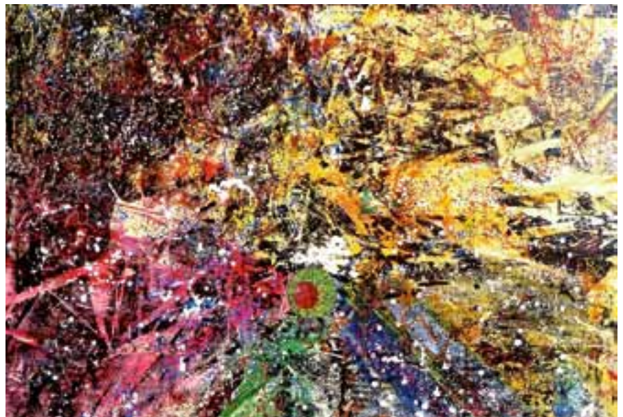
Christel Aytekin macht in ihren Gemälden die Beziehung zwischen Musik und Bildender Kunst zum Thema. Die Künstlerin stellt ab 9. September im Rathaus aus.

Die Ausstellung ist danach bis zum 19. Oktober zu den üblichen Öffnungszeiten des Rathauses zu besichtigen. Der Eintritt ist wie immer frei.