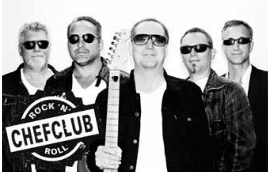
Die Band „Chefclub Rock 'n' Roll“ heizt ein beim Sportfest des FC Auerhahn.