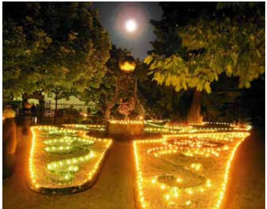
Am Samstagabend werden 1.500 Kerzen den Katz'schen Garten zum Leuchten bringen.

Unter dem Motto "Zeitsprung ins Mittelalter" lädt der historische Markt in die Amtsstraße und in die Storrentorstraße ein. Beim Gang durch die schmalen Gassen mit ihrem Kopfsteinpflaster kann man die Altstadt in einem ganz neuen „alten“ Blickwinkel sehen: Im Schein von Fackeln, Kerzen und Holzlaternen werden Handwerker und Händler ihre Waren ausbreiten und besondere leibliche Genüsse feilbieten. Kerzenzieher,