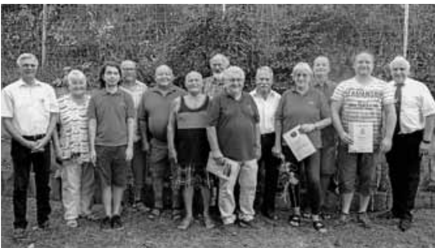
Die geehrten Mitglieder des Schützenvereins Obertsrot.

Die musikalische Unterhaltung am Sonntag zum Mittagessen übernimmt der Musikverein „Orgelfels“ Reichental. Gegen 19 Uhr findet dann die Siegerehrung des „Reichentaler Ortsturniers“ mit anschließender „Champions-Party“ statt.