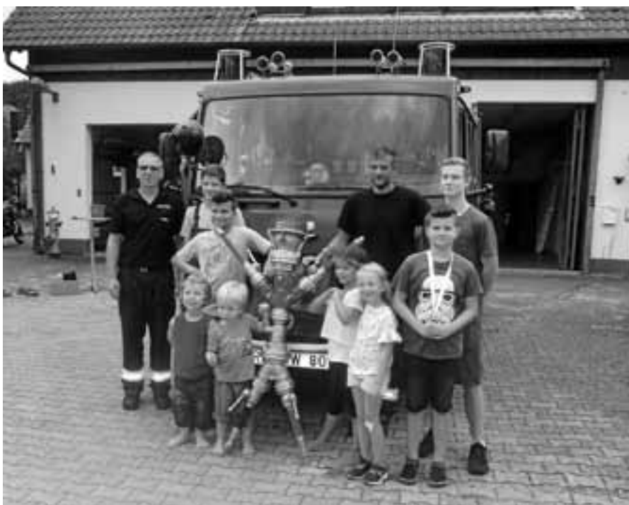
Kinderferienprogramm bei der Feuerwehrabteilung Hilpertsau.

Am Donnerstag, 20. September, kommt das Saftmobil auf den Festplatz in Hilpertsau. Nähere Informationen folgen. Aktuelle Informationen finden Sie auch auf der Facebookseite des Vereins.