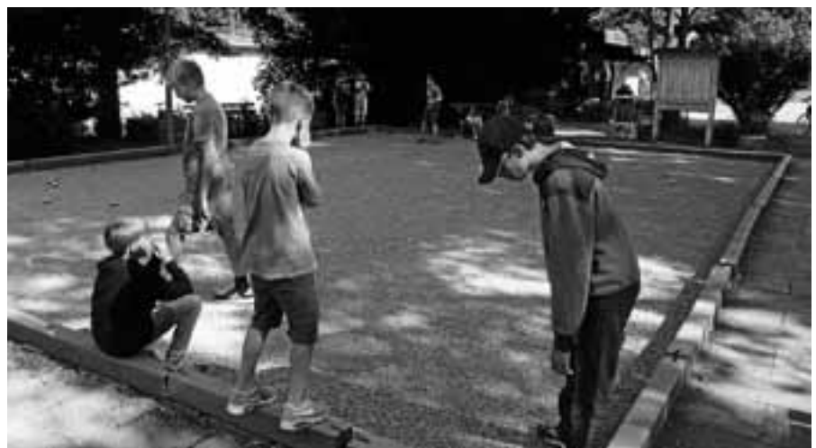
Kinderferienprogramm bei den Boulefreunden Gernsbach auf der Murginsel.