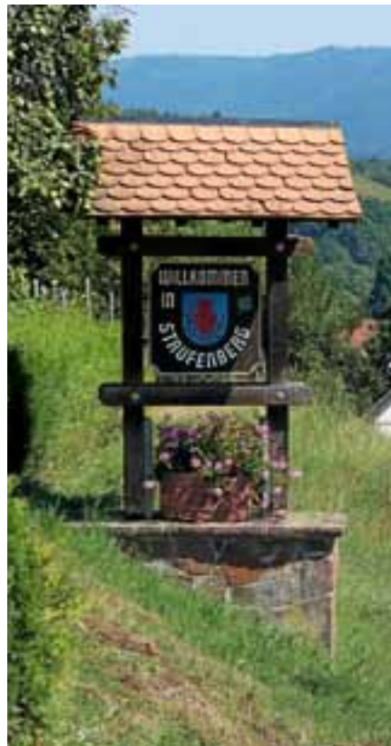
„Willkommen in Staufenberg“ heißt es beim SWR4-Sommererlebnis.