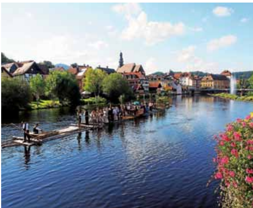
Kleine Auszeit vom Festtrubel bei gemütlicher Fahrt mit dem Murgfloß.

Das Musikfeuerwerk als Höhepunkt des Festes findet am Samstag um 20.30 Uhr statt. Am Sonntag startet der Festbetrieb mit dem Frühschoppen ab 11 Uhr.