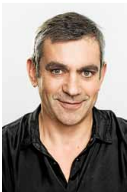
Wladimir Kaminer ist ein Star der jungen deutschen Literatur.

Seine Geschichten zeigen jenen tiefen und warmen Blick auf die Menschen, den nur der haben kann, der in zwei Kulturen zu Hause ist und stets die eine mit der anderen vergleichen kann. Alle seine befremdlichen und teilweise verwirrenden Erfahrungen mit den Tücken des deutschen Alltags, die Kaminer als Migrant und Neuling in Deutschland gemacht hat und immer noch macht, bietet er in einer schnörkellosen Spra-