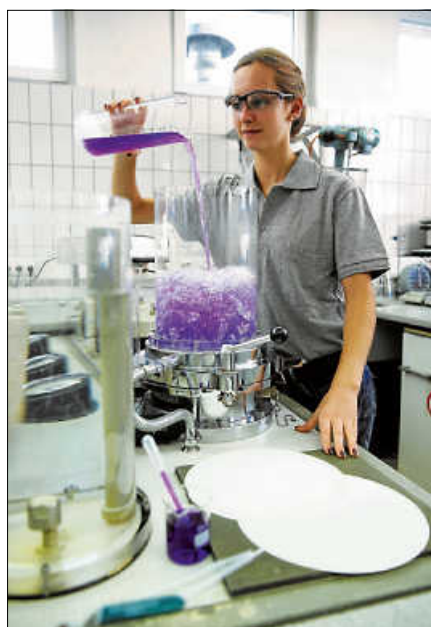
Blick ins Labor.

Die Schülerinnen erfahren Wissenswertes rund um den dualen Ausbildungsberuf zur Papiertechnologin und über das duale Studium „Sustainable Science and Technology – Papiertechnologie“. Ge-