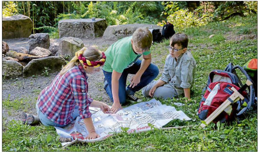
Unterwegs auf dem Sagenweg.

Die Stadt Gernsbach lädt am Samstag, 24. Juni 2023, ein zum Gernsbacher Kinderfest auf der Murginsel. Beginn ist um 11 Uhr. Nach der Begrüßung durch