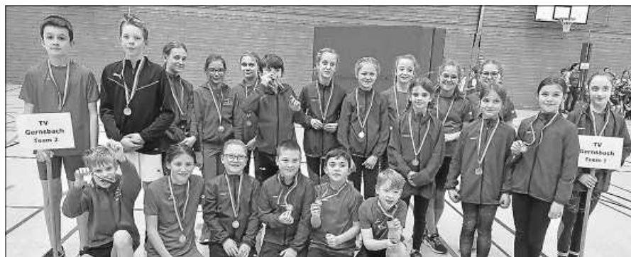
Pokalsieger der U12.

Die Bevölkerung kann sich auf ein hochwertiges Konzert freuen. Für das leibliche Wohl ist gesorgt. Eintrittskarten gibt es im Vorverkauf über die Musiker und an der Abendkasse. Im Anschluss an das Konzert unterhält Sie „Hubert & Friends“ Kommen Sie in die Ebersteinhalle. Der Musikverein Hilpertsau freut sich auf Ihren Besuch.