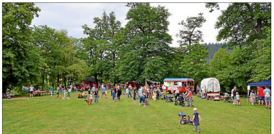
Kinderfest auf der Murginsel 2022.

Mehr Infos unter www.gernsbach.de/kinder ■