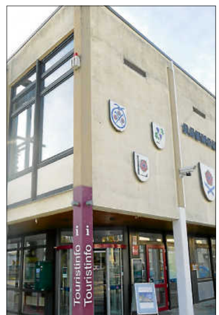
Ein Arbeitsplatz im Öffentlichen Dienst bietet viele Vorteile.