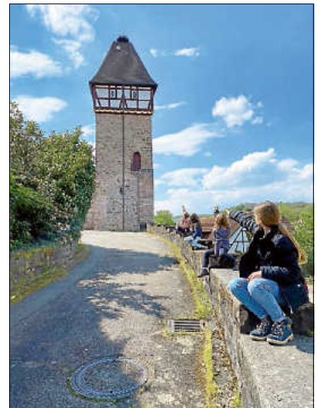
Die Altstadtrallye führt auch zum Storchenturm. Fotos: Stadt Gernsbach

An insgesamt 11 Stationen gilt es, zu be-