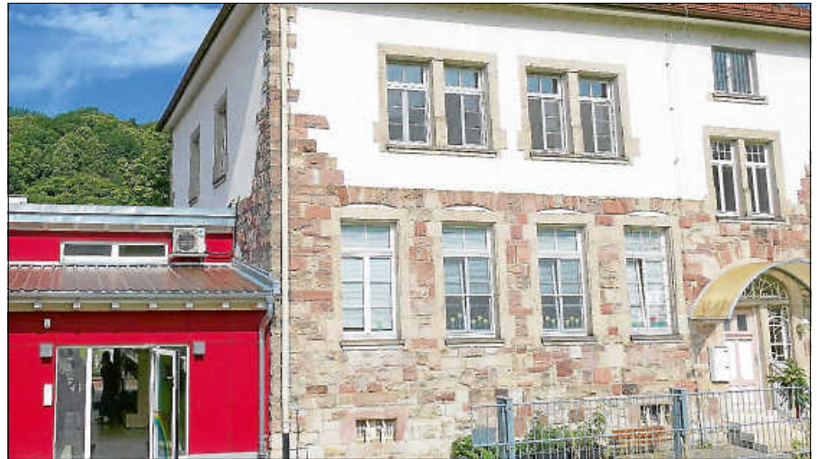
Kindertagesstätte Rockettstrolche in Hilpertsau.

Darunter leiden nicht nur die Erzieherinnen, die ständig kurzfristig einspringen müssen, sondern auch die pädagogische Arbeit. Ausflüge können unter diesen Umständen nicht durchgeführt werden. In den Betreuungseinrichtungen arbeiten überwiegend Teilzeitkräfte, viele nur mit 0,5 Stellenanteilen. Außerdem finden Erzieherinnen, die selbst ein Kind zu betreuen haben, an ihren Wohnorten