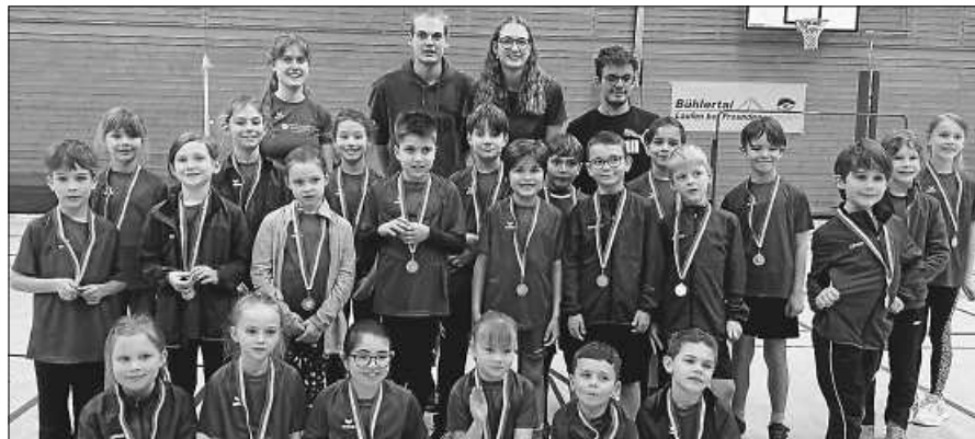
Pokalsieger der U10.