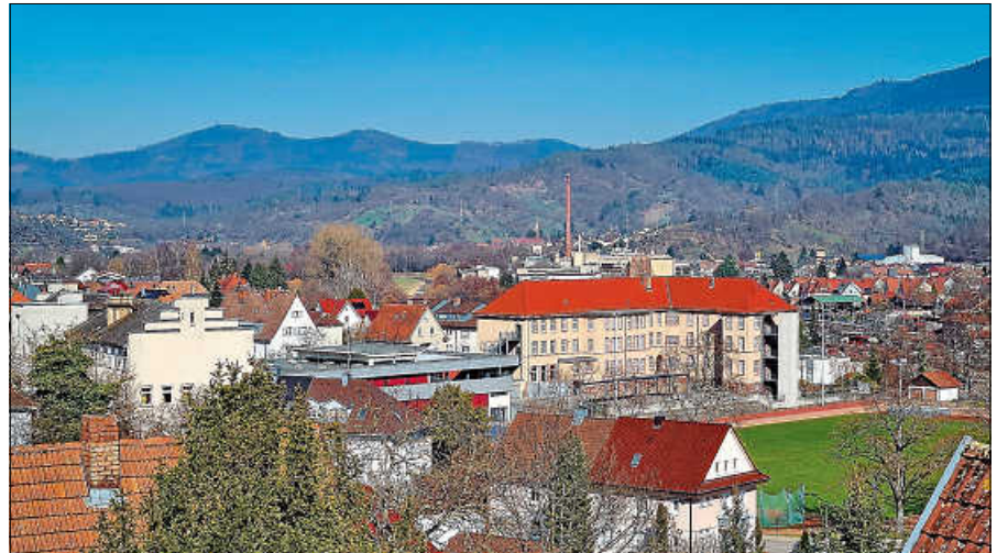
Blick auf die Grund- und auf die Von-Drais-Gemeinschaftsschule.

Die Einführung des Ganztagsbetriebs an der Grundschule ist daher folgerichtig, damit das Erlernen der wichtigsten