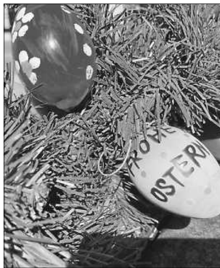
Der Phantasie sind keine Grenzen gesetzt beim Ostereier-Anmalen.

Die Tradition, die Brunnen der Altstadt mit Girlanden voller bemalter Ostereier zu zieren, wurde 2007 vom Hausfrauenbund Gernsbach ins Leben gerufen und erfreut Altstadtbesucher und -bewohner seither jedes Jahr aufs Neue. Seit 2019 hat diese Aufgabe die Süßmostgruppe übernommen und schmückt den Hofstätte-, Markt- und Metzgerbrunnen. 2021 kam mit Unterstützung der Nachbarschaft auch der Oberstadtbrunnen hinzu.