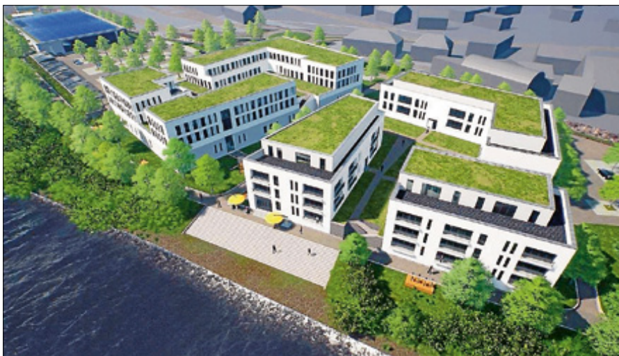
Visualisierung der Entwicklung des Wörthgartens.

Entsprechend des städtebaulichen Vertrages ist die Krause-Gruppe als Projektträger verpflichtet, 40 % der entstehenden Kosten des Kreisverkehrs mitzutragen. ■