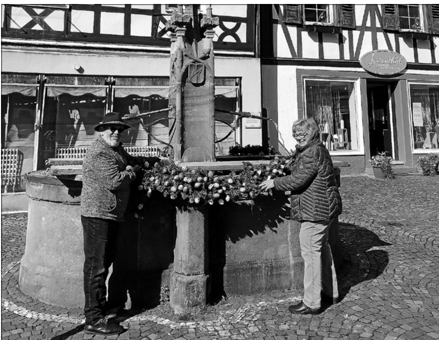
Jeweils ein Zweierteam der Süßmostgruppe Gernsbach sorgte in diesem Jahr für den Osterschmuck der Altstadt-Brunnen.

Als die Süßmostgruppe im vergangenen Jahr die liebgewordene Tradition des