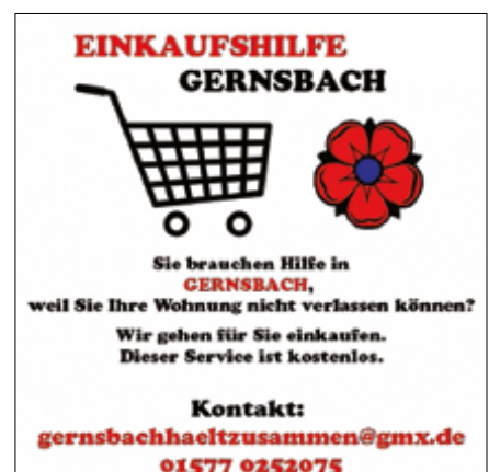
Nachbarschaftshilfe in Gernsbach.

Unter dem Hashtag #gersnbachhältzusammen finden Sie in den sozialen Medien wie Facebook und Instagram ebenfalls Informationen zur Gernsbacher Nachbarschaftshilfe. ■