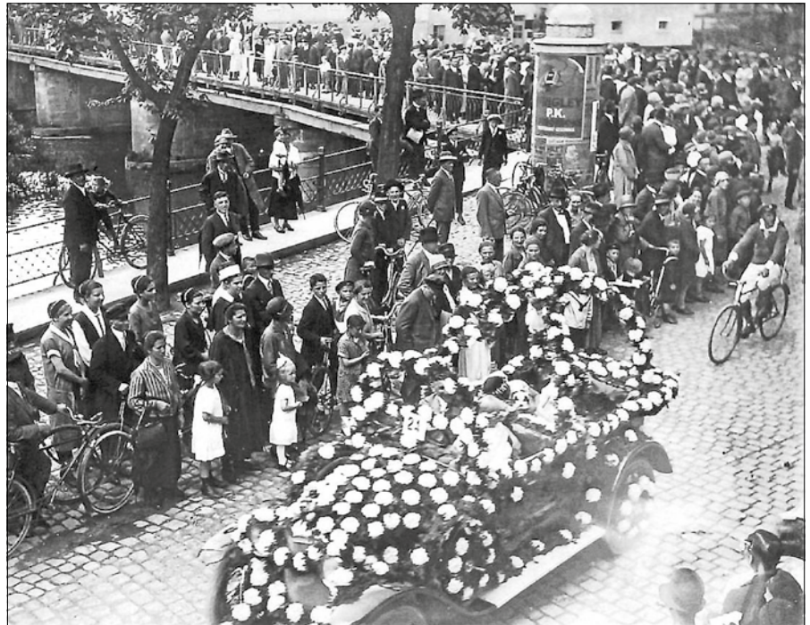
Das um 1926 an der Ecke Stadtbrücke/Igelbachstraße aufgenommene Bild vermittelt einen Eindruck von den Kinderfestumzügen des Verkehrsvereins.

Der Festzug, der sich am 17. Juli um viertel nach zwei auf der Höhe des ehemaligen Badhotels in Bewegung setzte, umfasste nicht weniger als 47 Gruppen in sechs Abteilungen. Angeführt wurde er von Standartenreitern des Carneval-Vereins, denen die Stadtkapelle, zwei Kindergruppen mit Stäben und Turnerrinnen mit Girlanden folgten. Es folgten zahlreiche Motivgruppen, teils zu Fuß