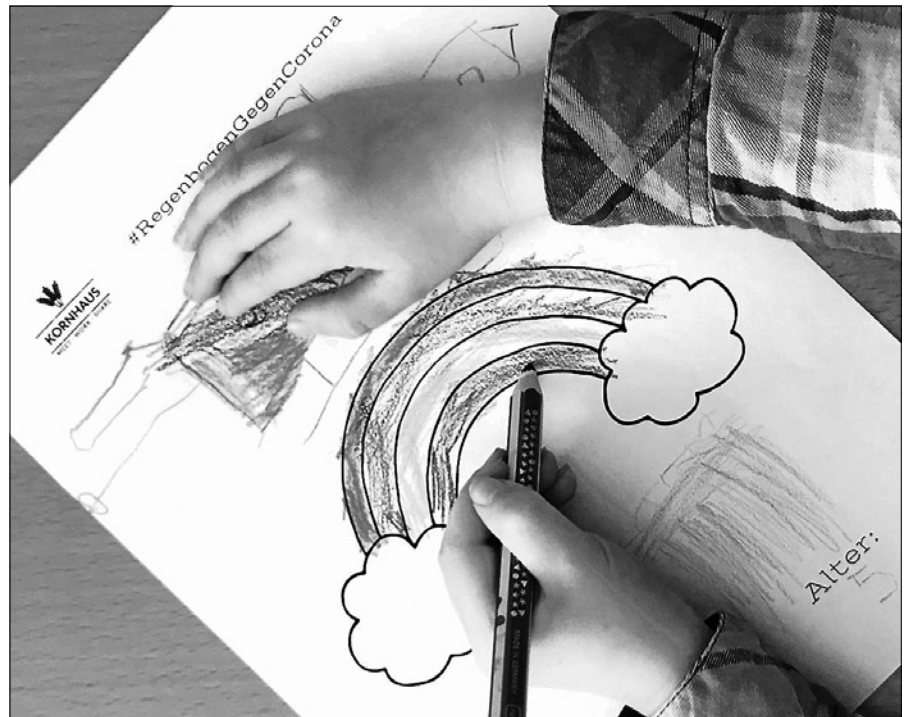
Gratis Malvorlagen für Regenbogen gegen Corona.

Leider kann das Kornhaus derzeit kein physischer Treffpunkt sein. Aber gern vernetzen wir uns mit euch online und über die Fensterbilder eurer Kinder. Zeigt uns auch online eure Kunstwerke im Internet. Verwendet hierzu bitte einfach auf Instagram unseren Hashtags #kornhausgernsbach #kornhausliebe und / oder markiert uns im Bild @kornhaus_gernsbach auf Insta & Facebook! Und bald hoffentlich wieder gemeinsame Kreativ-Events im Kornhaus mit der Community!