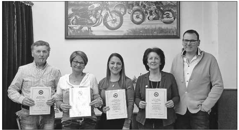
Ehrungen des AC-Eberstein bei der Hauptversammlung.

Der OGV Gernsbach lädt zur ordentlichen Mitgliederversammlung am 30.3., um 15 Uhr, ins DRK-Haus Gernsbach ein. Folgende Tagesordnung steht auf dem Programm: