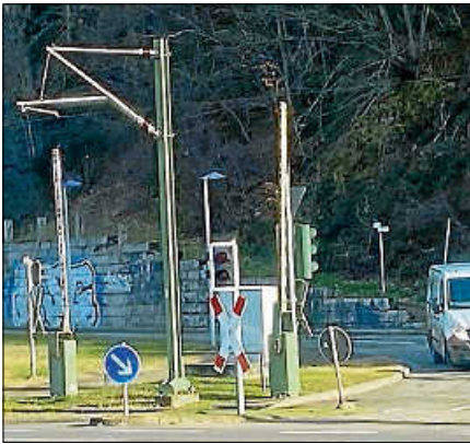
Mauergraffiti an der Markgraf-Berthold-Straße Ende vergangenen Jahres.

E nde des vergangenen Jahres kam ein überdimensional großes Graffiti an der Mauer entlang der Markgraf-Berthold-Straße in Obertsrot zur Strafanzeige.