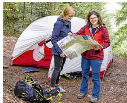
Die Trekking-Camps verfügen über Plätze für bis zu drei Zelte à drei Personen, eine Feuerstelle und ein Toilettenhäuschen.

Ausrüstung und Verpflegung müssen selbst mitgebracht werden. Weitere Infos sind unter www.trekking-schwarzwald.de verfügbar. ■