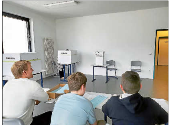
Das Wahllokal sowie die Wahlhelfer mit Wahlleitung.

Ein großes Dankeschön geht an die Wahlhelfer, die für ihre ehrenamtliche Unterstützung eine Urkunde bekamen. Die Ergebnisse der Wahl können nun nach einer Auswertung für die weitere politische Bildung im Rahmen der Gesellschaftswissenschaften genutzt werden. ■