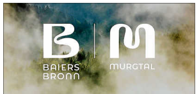
Die neuen Logos von Murgtal und Baiersbronn.

In einem Kurzfilm der Baiersbronn Touristik können sich Interessierte einen ersten Eindruck vom neuen Markendesign verschaffen: www.baiersbronn.de/neues-design ■