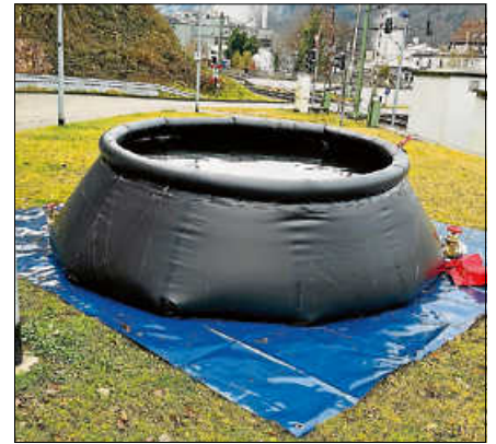
Flüssigkeitsfaltbehälter der Feuerwehr.

Die Kosten für die Beseitigung der Sachbeschädigung inklusive des Feuerwehreinsatzes belaufen sich auf 3.000 €. ■