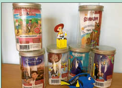
Für zuhause warten neue Erzählgeschichten im Tonie-Regal der Bücherei.

Scooby-Doo: Zusammen mit seinen Freunden Shaggy, Vera, Fred und Daphne ist Scooby-Doo der Spezialist für unheimliche Fälle. So haben die Schurken dieser Welt keine Chance gegen das Detektivbüro? Mystery Inc.?. Ab 6 Jahren