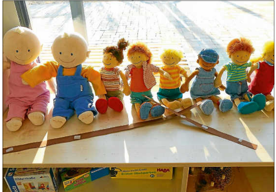
Vielfalt in der Kinderbetreuung - Elternbefragung für zielgruppengerechte Angebote.

Die Befragung dient als Grundlage für ein langfristig tragfähiges und bedarfsgerechtes Konzept zur Weiterentwicklung der Kindertagesstätten- und Schulkindbetreuungsstruktur. Die Stadt Gernsbach bittet daher alle betroffenen Eltern, den Fragebogen auszufüllen und im verschlossenen Umschlag bis spätestens Mittwoch, den 19. März 2025, an die jeweilige Kindertageseinrichtung zurückzugeben. Der Datenschutz wird dabei vollumfänglich gewährleistet. Die Fragebögen enthalten keine personenbezogenen Kennzeichnungen, sodass die Anonymität der Teilnehmenden