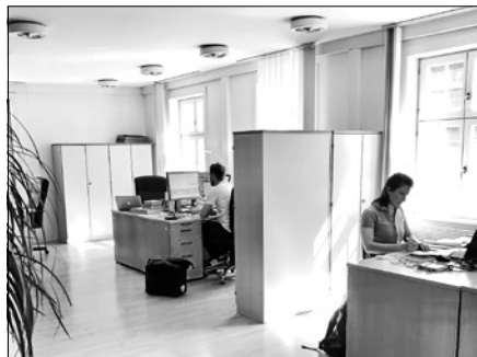
Optimale Arbeitsbedingungen für Freiberufler etc. unter Einhaltung der Corona-Auflagen im Kornhaus Gernsbach.

Der Termin der Sommer Shopping Lounge wird verlegt. Weitere Infos unter www.kornhaus-gernsbach.de .