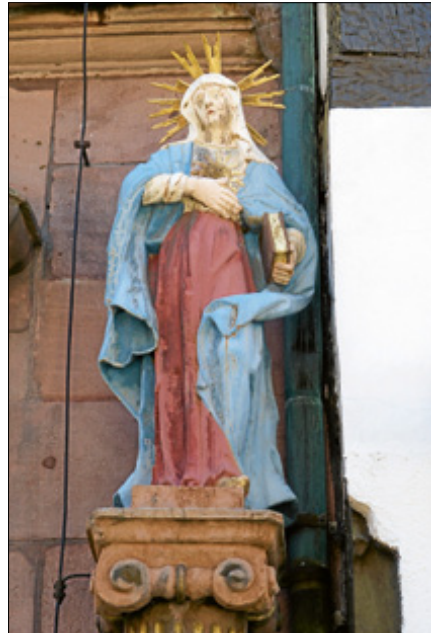
Heilige Anna in der Altstadt.

Weitere Führungen finden Sie in unserer Broschüre „Geführte Kultur- und Naturerlebnisse“ oder unter www.gernsbach.de