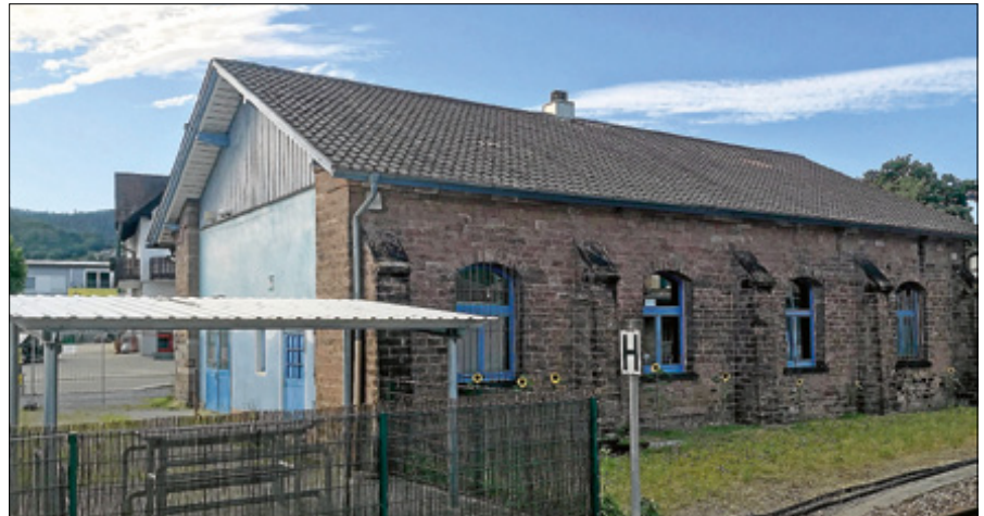
Die Schließzeit wurde für Verschönerungsarbeiten genutzt.

Die Jugendberatung findet ab sofort wieder regelmäßig dienstags von 15 bis 16.30 Uhr statt. Für den offenen Treff öffnet das Jugendhaus seine Pforten