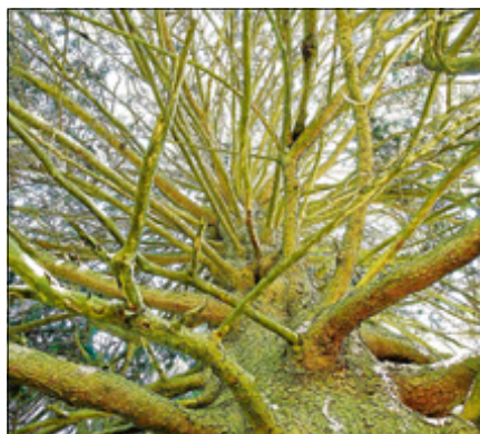
Interessante Bäume säumen die Strecke.

Treffpunkt: Parkplatz am Schwimmbad Reichental. Die Wanderung ist kostenlos, die Teilnehmerzahl begrenzt auf 20 Personen. Eine Anmeldung ist unter