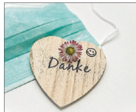
Bitte Maske tragen - zum Schutze aller!