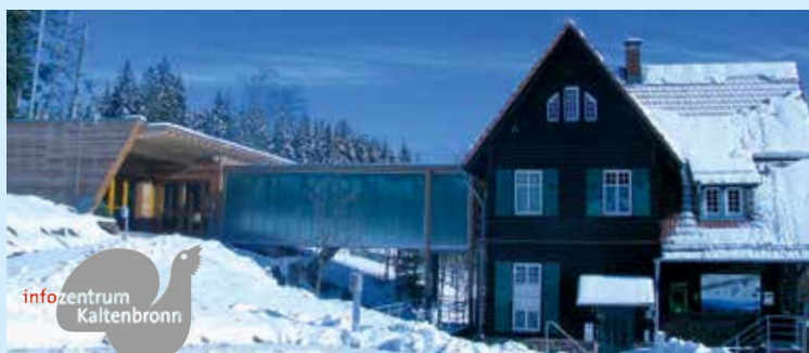
Autor: E. Marek

Bitte folgen Sie keinen Spuren abseits der Wege.