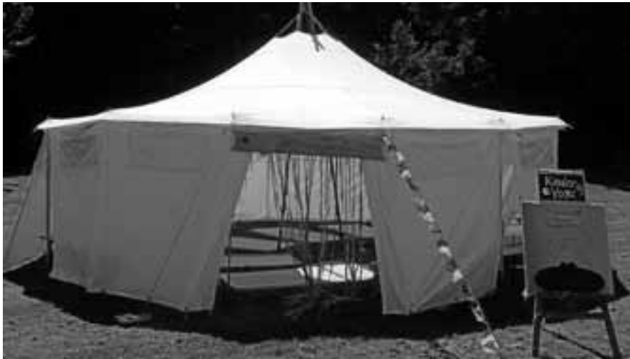
Das "Mobile Grüne Klassenzimmer" auf dem Weidenhof.