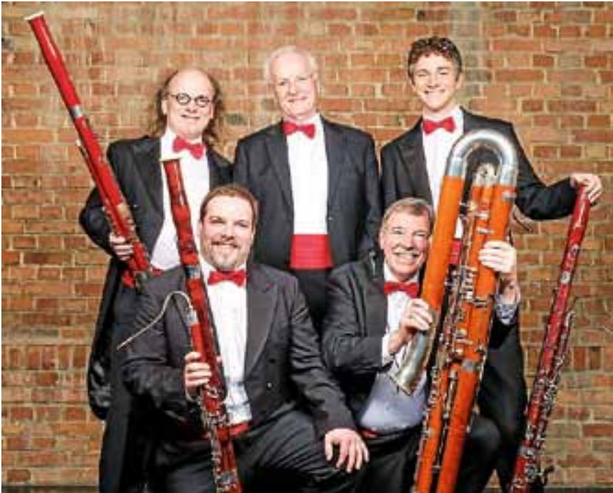
Das Ensemble lädt zu einer musikalischen Weltreise ein.

A m Sonntag, 22. April, lädt die Kulturgemeinde Gernsbach um 18 Uhr in die Stadthalle zu ihrem Geburtstags-Konzert ein. Die Kulturgemeinde möchte dabei mit allen Besuchern des Konzerts bei einem Glas Champagner auf diesen Tag anstoßen und mit dem „SWR Swing Fagottett“ beschwingt und heiter auf eine musikalische Weltreise gehen.