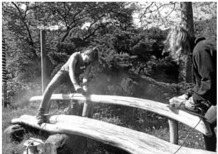
Vorarbeiten für das Malerteam.

Am 24. August wird SWR 4 mit seinem „Sommererlebnis“ bei uns zu Gast auf dem Staufenberger Dorfplatz sein. Alle Staufenberger Vereine werden diese Veranstaltung gemeinsam ausrichten. Eine einmalige Gelegenheit, Staufenberg auch über die Dorf- und Stadtgrenzen hinaus bekannt zu machen und zu zeigen, was Staufenberg lebens- und liebenswert macht. ■