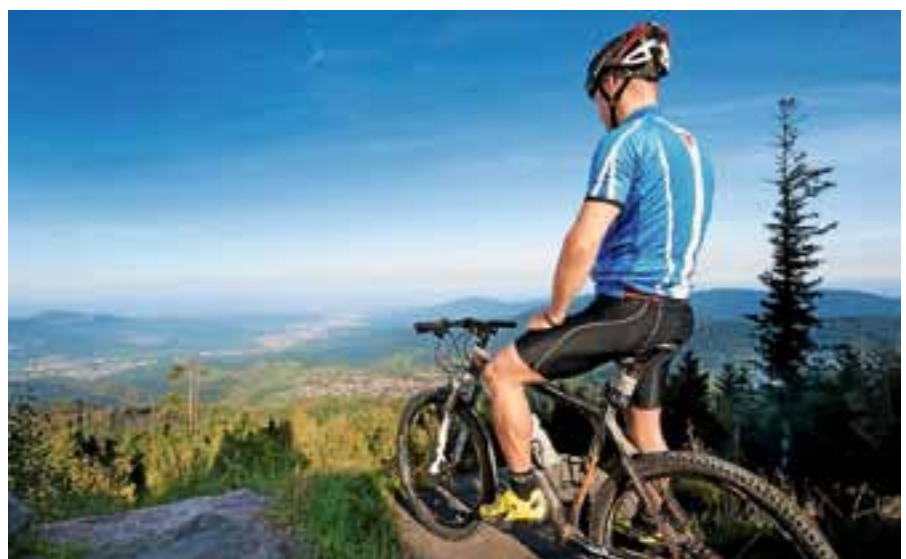
Ende April startet offiziell die Mountainbike-Saison 2018 im Murgtal.

In diesem Jahr wird eine geführte Tour von Gernsbach auf den Kaltenbronn angeboten. Die Tour startet um 9.30 Uhr vor der Touristinfo Gernsbach auf dem Rathausparkplatz und führt über abwechslungsreiche Wege bis zum Zielpunkt beim Infozentrum Kaltenbronn, wo um 13 Uhr feierlich eine E-Bike-Ladestation übergeben wird. Dazu werden ein zünftiger Abschluss der Veranstaltung sowie eine Verlosung geboten. Zur Stärkung gibt es unterwegs wieder eine Streckenbewirtung durch das bewährte Bike-Opening-Team.