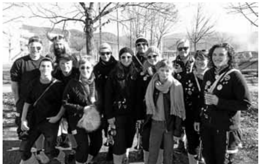
Die Blechsprenger Murgtal starten wieder durch.

HSG Murg – TVS Baden-Baden 3, 39:27 (14:12). Bis zum 3:3 verlief die Partie ausgeglichen (9. Min). Danach konnten sich die Gastgeber auf zwei Tore absetzen (5:3). Eigentlich hätte man sich schon in dieser Phase viel deutlicher absetzen können, aber ein ums andere Mal wurden gute Chancen nicht genutzt oder Bälle viel zu ungenau gespielt, dadurch hielt man die Gäste im Spiel (9:6, 19. Min; 12:10, 25. Min). In der 27. Minute gelang den Baden-Badenern sogar nochmal der Ausgleich (12:12). Zwar konnte die HSG bis zur Pause wieder in Führung gehen, aber wirklich zufrieden konnte man nicht sein (HZ, 14:12). Nach der Pause konnte die Führung zwar nach und nach ausgebaut werden, aber so richtig überzeugen konnte man immer noch nicht (19:14, 37. Min). Nach der zweiten roten Karte gingen den Gästen so langsam die Spieler und die Kraft aus, außerdem spielten die Hausherren endlich etwas konzentrierter. Nach 46 Minuten hatte man auf Treffer Vorsprung erhöht (26:16). Doch anstatt die Konzentration oben zu halten und das Spiel souverän zu Ende zu spielen, ließ man die Gäste durch Abspielfehler etc. noch einmal ins Spiel kommen (27:24, 51. Min). Gegen stärkere Gegner brechen einem solche Phasen das Genick. Glücklicherweise hatten die Gäste keine Körner mehr übrig und wurden von der HSG in den letzten Minuten förmlich überrannt. Mit einem 12:3-Lauf beendeten die Murgtälern die Partie und konnten das Ergebnis doch noch recht erfreulich gestalten.