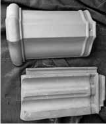
Das Forum Zehntscheuer sucht Patenschaften fürs Ziegeldach.

StadtDenkmal zukünftig vor Wind, Regen und Wetter schützen. Schon für zwei Euro kann man sich als Pate für einen Ziegel eintragen lassen. Je größer die Summe umso mehr Ziegel werden unter dem Namen des Sponsors registriert. Es existiert eine Liste der Ziegel von Nr.1- Nr. 6270, in der die Namen festgehalten werden und es wurde ein Plan erstellt indem die einzelnen Ziegelnummern verortet sind. Der Verein möchte mit dieser Aktion jedem Bewohner oder Fan der Stadt Gernsbach die Möglichkeit geben Anteil an der historischen Bausubstanz unserer Altstadt zu nehmen und einen Beitrag zu leisten.