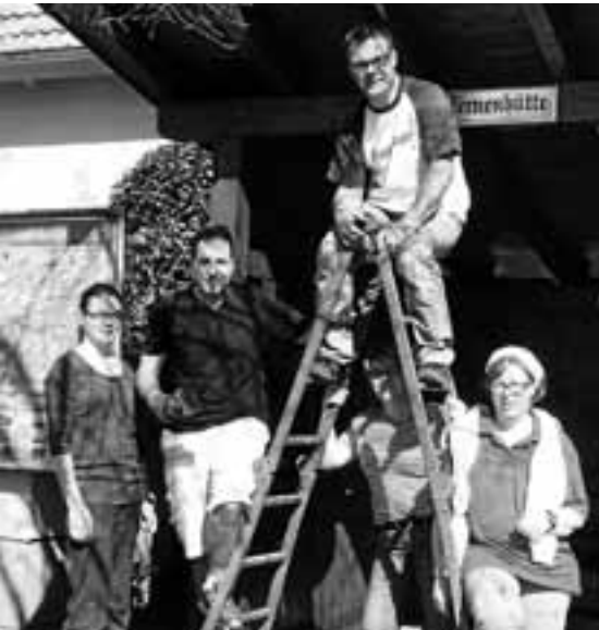
Die Sternenhütte bekommt einen frischen Anstrich.

Abständen frisch gestrichen, das Dach vom Moos befreit, und der Vorplatz von Unkraut. Am letzten Samstag fand dieser Arbeitseinsatz mal wieder statt, bei schönstem Wetter fanden sich ein paar fleißige Helfer und gaben der Hütte neuen Glanz.