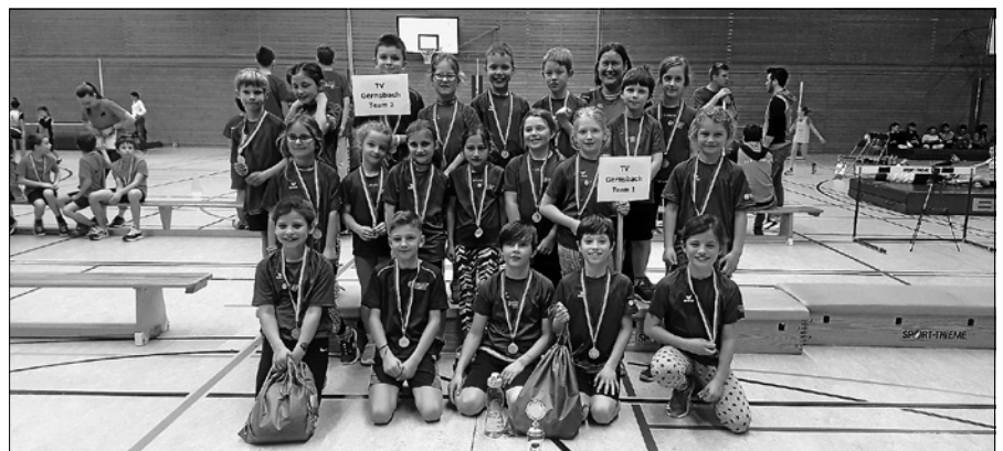
TVG Leichtathletik: U10 Pokalsieger beim ersten Kinderleichtathletik-Cup in der Halle 2020