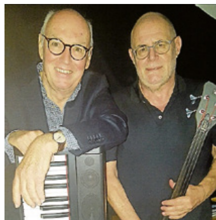
Die South Side Boys.

von Obertsrot lebendig werden lassen. Beginn 20 Uhr, Eintritt 10 Euro, Einlass eine Stunde vor Beginn, barrierefreier Eingang. S-Bahn-Halt Obertsrot. Parken dort, Obertsroter Straße entlang der Murg und Dorfstraße.