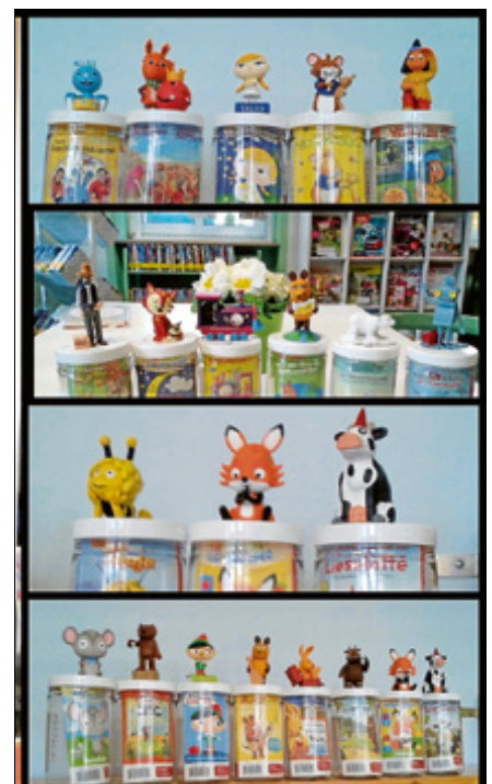
Die beliebten Tonie-Hörspiele.

Spiele-Nachmittag beim Ferienprogramm und Weihnachtsflohmarkt sind fester Bestandteil des Jahresprogramms. Führungen für Kindergärten und Schulen werden kurzzeitig durchgeführt und das Team ist auch weiterhin