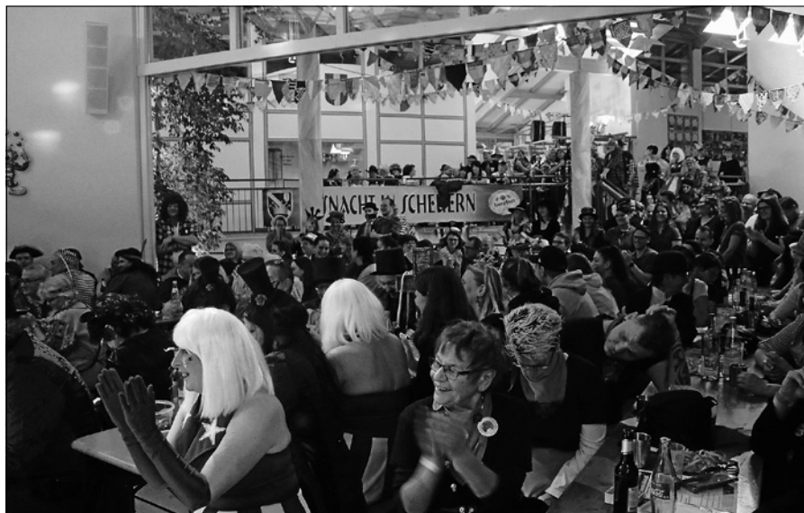
Ausgelassene Stimmung beim Fasnachtsball.

Der Scheuerner Fastnachtsclub möchte nochmals auf die kommenden Veranstaltungen in Scheuern aufmerksam machen. Der bereits 19. Fasnachtsball