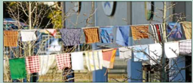
‚Fasentföhne‘ am Rathaus

Am Rosenmontag und Faschingsdienstag ist das Rathaus zu den üblichen Zeiten geöffnet.