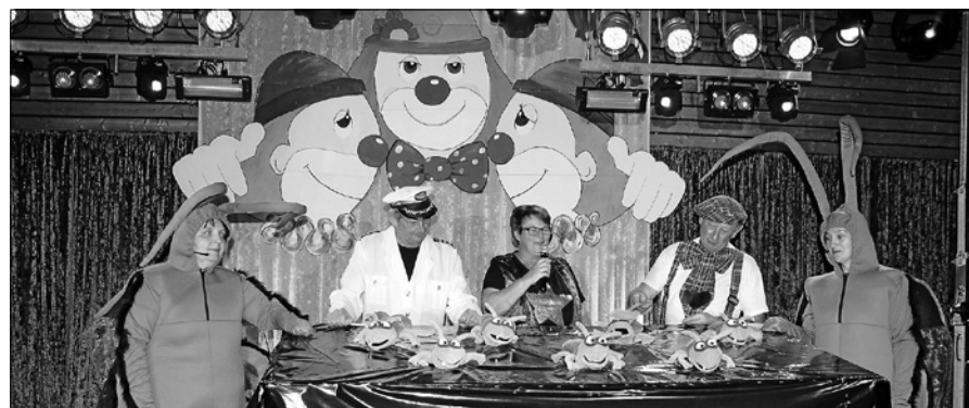
Die Akteure versprechen viel Spaß und gute Laune.

Die Fastnachtssitzungen des Fördervereins MV Orgelfels Reichental am Freitag,