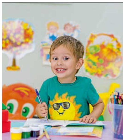
„Stark zum Schulstart“ unterstützt beim Schulstart.

eine Förderung für den Schulbedarf ihrer grundschulpflichtigen Kinder beantragen.