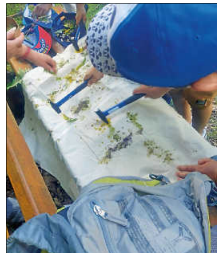
Erstellen eines Blütenbildes.

Blütenbild gestaltet wurden. Pünktlich zum Schulende waren die Kinder wieder an der Schule angekommen und konnten in das Wochenende entlassen werden. ■