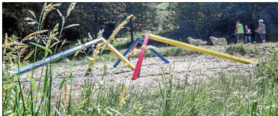
Gary Schlingheider, MULTI PART PIECES 2021 , pulverbeschichtetes Aluminium 380 x 190 x 190 cm.

Die Tour dauert rund zwei Stunden und findet bei jedem Wetter statt. Treffpunkt ist am Beginn des Kunstweges an der Infotafel auf dem Parkplatz im Reichenbachtal hinter dem Gewerbegebiet. Mit der Ausstellung 2024 bereichern neue Arbeiten von Gary Schlingheider den Kunstweg am Reichenbach, der bereits von 2020 bis 2023 mit Skulpturen am Kunstweg vertreten war. Der Künstler spricht von seinen Werken als stille Zeugen einer Welt, die oft von Lärm und Überfluss dominiert wird, und so einen Ort der Ruhe und Reflexion bieten (können). Die Interaktion zwischen dem Kunstwerk und dem umgebenden Raum schafft eine Dynamik, die das Werk belebt und die Betrachtenden einlädt, sich körperlich und emotio-