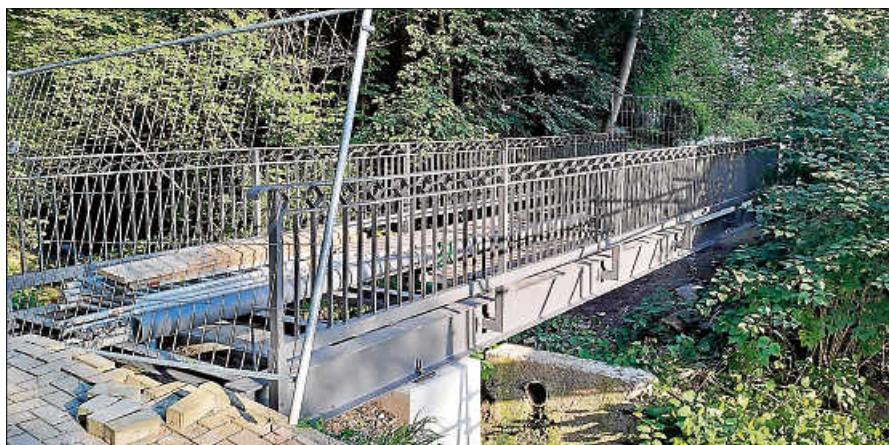
Der Ersatzneubau der Ziegelbachbrücke wurde eingesetzt.

Die Gesamtmaßnahme umfasst ein Kostenvolumen von 311.000 Euro. Die