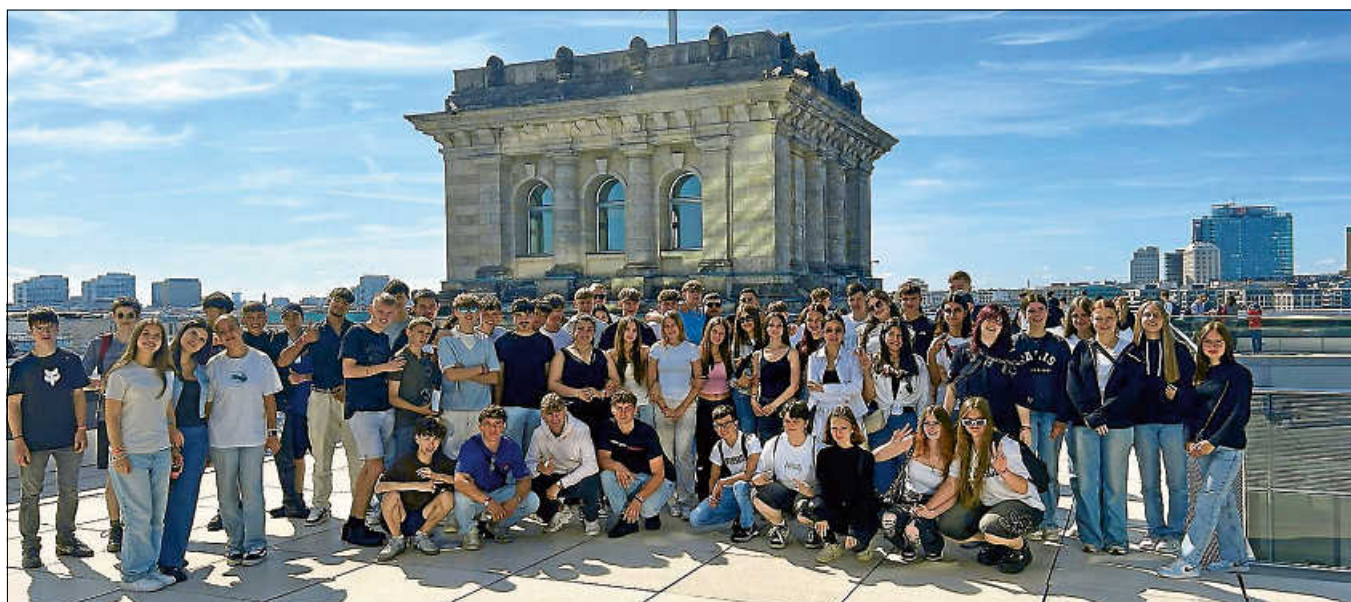
Auf dem Reichstagsgebäude in Berlin.

Freizeit erkundeten sie anschließend die lebendige Kultur der Stadt, probierten das internationale Spektrum der Speisen und genossen abends die berühmte Disco „Matrix“, wo der ein oder andere sein bisher unerkanntes Tanztalent entdecken konnte. Insgesamt war die Studienfahrt nach Berlin für alle ein unvergessliches Erlebnis, das allen lange in Erinnerung bleiben wird. ■