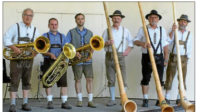
Gemeinsames Kurkonzert der Alphornbläser mit dem Eichbaumtrio.