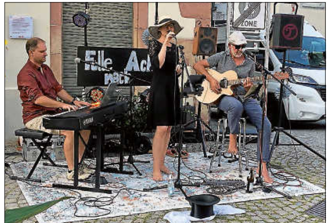
‘Fülle nach acht‘ sorgte bereits für beste Unterhaltung auf dem Stadtbuckel.

Neben der großartigen Musik werden die Gäste mit erfrischenden Getränken und leckeren Speisen an der Pop-Up-Bar am Kornhaus verwöhnt. Wer das französische Savoir-Vivre liebt,