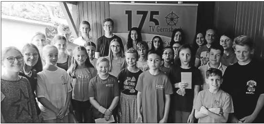
Die Geehrten des TVG.