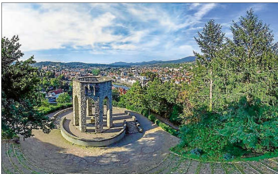
Das Denkmal am Rumpelstein.

Eine Anmeldung bei der Touristinfo Gernsbach unter touristinfo@gernsbach.de oder 07224 644 446 ist erforderlich. ■