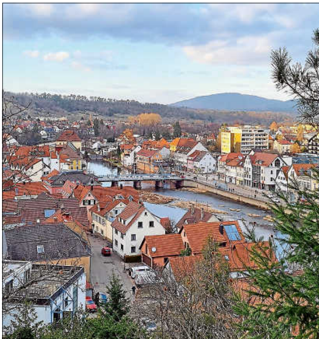
‚Rathaus vor Ort‘ für die Kernstadt findet am 17. Oktober statt.

Das Bewerbungsvideo ist unter diesem Link hinterlegt: www.gernsbach.de/startseite/buerger/woerthgarten ■