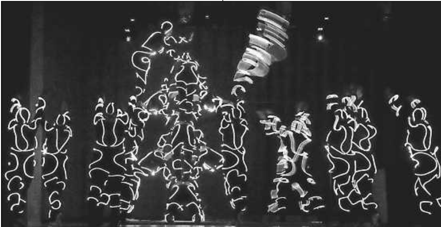
Einen außergewöhnlichen Beitrag gestaltet die Gruppe Trongym bei der TVG-Turnshow.