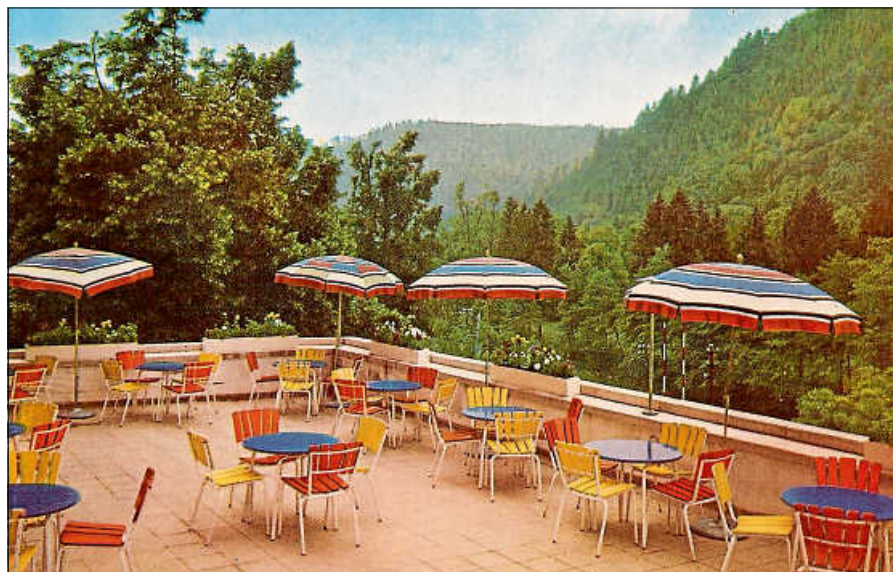
Terrasse des Gernsbacher Kurhauses in den 1960er Jahren.

schon jetzt auf die vielfältigen privaten Einblicke in die Stadtgeschichte. ■