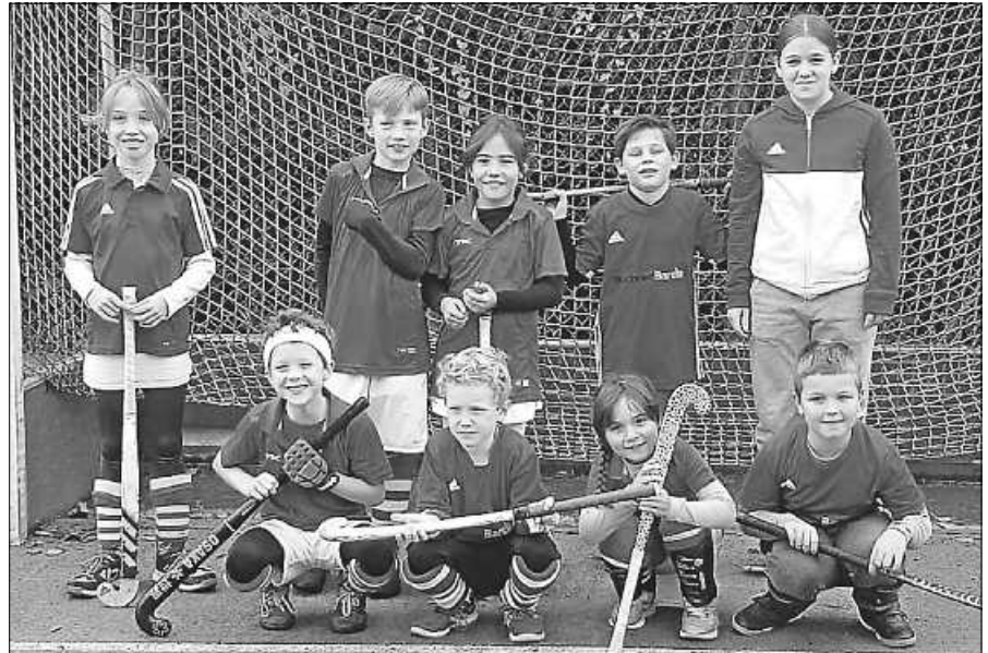
U8 des Hockey-Clubs Gernsbach.