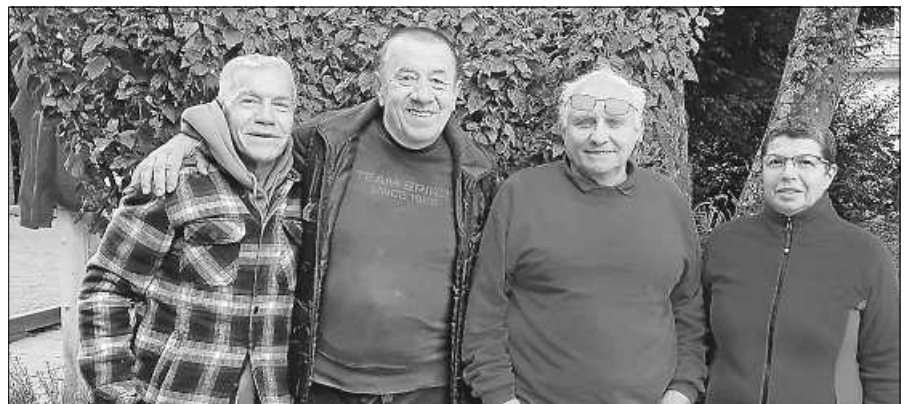
Die Vereinsmeister Tête 2024.

Nach der Niederlage gegen den FC Phönix Durmersheim empfängt die SG Staufenberg/Gernsbach in der Fußball-Kreisliga A Nord am Samstag den FV Hörden zum Derby. Anpfiff ist um 16