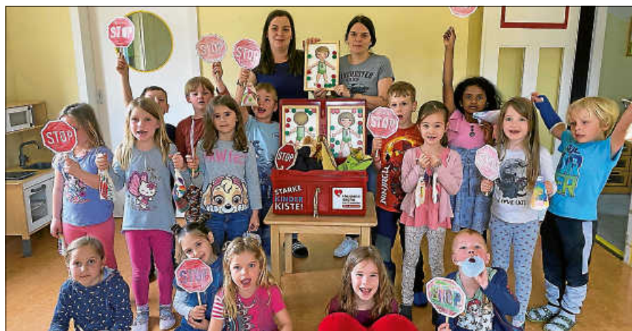
Die Kinder der KiTa ‚Rocketstrolche‘ nutzen gerne die Starke-Kinder-Kiste.

Die pädagogischen Teams der Kitas wurden intensiv im Bereich Kinderschutz geschult, auch durch eine enge Vernetzung mit dem Verein Feuervogel. Die Arbeit mit der „STARKE KINDER KISTE!“ ist ebenso geprägt von einer intensiven Zusammenarbeit mit den Eltern durch Elternabende und eine gute Erziehungspartnerschaft.