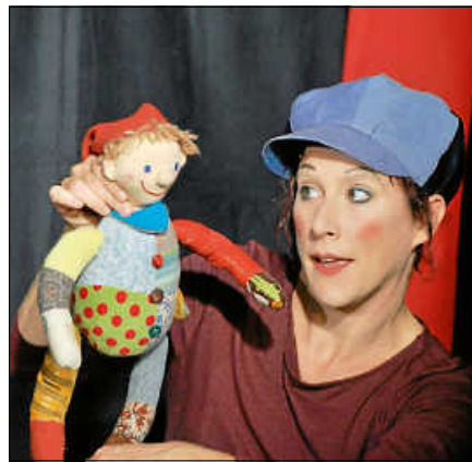
Das kleine Lumpenkasperle.

Das kleine Lumpenkasperle ist aus lauter bunten Stoffresten genäht und gehört dem Büblein. Es ist sein bester Freund und Spielkamerad und bringt ihn immerzu zum Lachen. Eines Tages sieht das Büblein in einem Schaufenster jedoch viel schönere Spielfiguren. Plötzlich mag es sein kleines Kasperle gar nicht mehr leiden und wirft es einfach aus dem