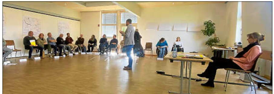
Konstruktive Klausur des neu gewählten Gemeinderats.

Bedeutung sein werden, um die Lebensqualität in Gernsbach zu erhalten. Bürgermeister Julian Christ betont: „Es ist unser gemeinsames Ziel, Gernsbach nachhaltig zu gestalten und weiterzu-