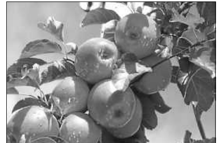
Obstbaum- und Beerenstrauchbestellung ab sofort möglich.

Obstbäume und Beerensträucher bei Udo Janetzki, Südhangstr. 6, Tel.: 07224 40501 oder E-Mail: uj40501@aol.com bestellt werden können. Bestellannahme bis Ende Oktober 2024.