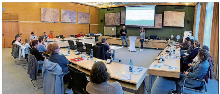
Teilnehmerinnen und Teilnehmer des Gründungsworkshops tauschen sich über ihre Ideen und Erfahrungen aus.