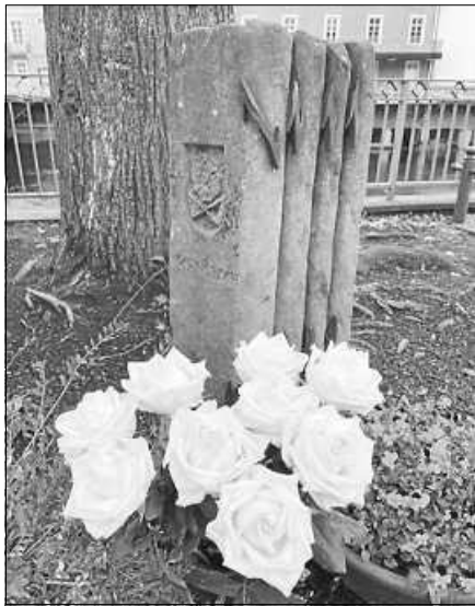
Gedenkstein am Nepomukplatz.

Das alljährliche Gedenken an die Deportation jüdischer Bürgerinnen und Bürger nach Gurs wird am 22. Oktober 2024 um 18 Uhr auf dem Salmenplatz stattfinden. Bürgermeister Julian Christ wird die Namen der Deportierten verlesen. Es werden Kerzen entzündet und zu den Gedenksteinen am Nepomukplatz an der Stadtbrücke getragen. Der Arbeitskreis Stadtgeschichte lädt zum gemeinsamen Gedenken an die neun deportierten Jüdinnen und Juden aus Gernsbach ein.