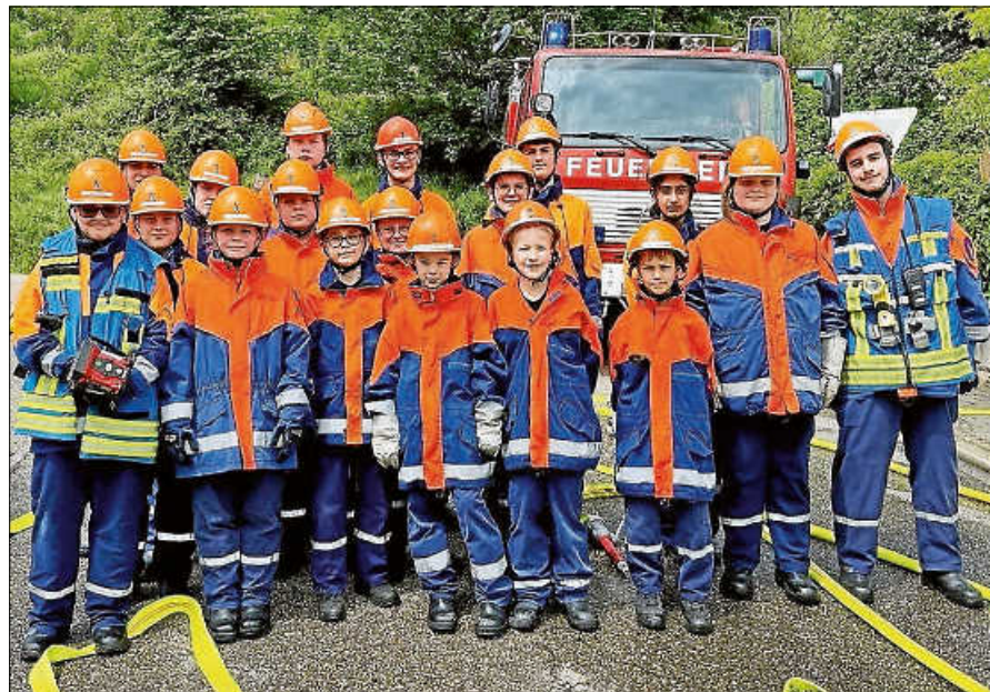
Mitmachen beim Team Jugendfeuerwehr.

13 Uhr – Blasmusik mit den Lautenbacher Musikanten