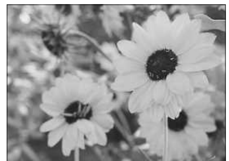
Stauden, Samen, Knollen wechseln ihre Besitzer:innen.

Bestellwünsche können ab sofort bis zum 10.11.2024 bei Walter Schmeiser (Tel. 07224/50837) abgegeben werden. Die Lieferung erfolgt in Obertsrot und Hilpertsau frei Haus durch Vereinsmitglieder.