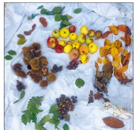
Die Ausbeute der Klasse 2.

Am Donnerstag, den 24.10., ist Jahresplanung für das Jahr 2025. An diesem Tag bleibt das Haus geschlossen. Ansonsten ist das Jugendhaus wie gewohnt geöffnet. Öffnungszeiten für Kinder und Jugendliche von 10 bis 27 Jahren: Montag bis Donnerstag, 13 bis 20 Uhr, Freitag 14 bis 22 Uhr, Tel.: 07224/6574110, Mail: Stephanie.Daferner@ib.de ■