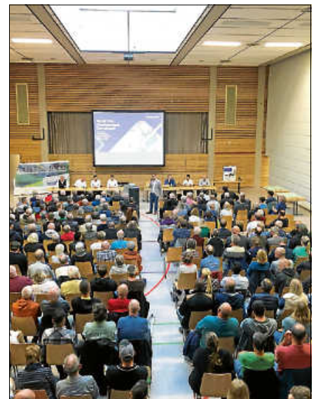
Rund 250 Bürgerinnen und Bürger informierten sich über den Glasfaserausbau in Gernsbach.

Für weitergehende Informationen stehen die Stadtwerke Gernsbach sowie die NetCom BW gerne zur Verfügung. Ergänzend gibt es auch eine Internetseite: www.netcom-bw.de/gernsbach . ■