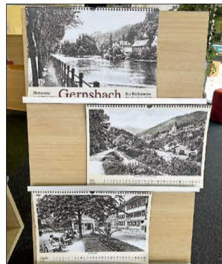
Historischer Kalender 2025.

Die Ansicht von Hilpertsau stammt aus dem Jahre 1925, die von Lautenbach aus dem Jahre 1965. Und Scheuern ist mit einem Bild vom Erholungsheim und Schwesternheim aus dem Jahre 1935 vertreten. ■