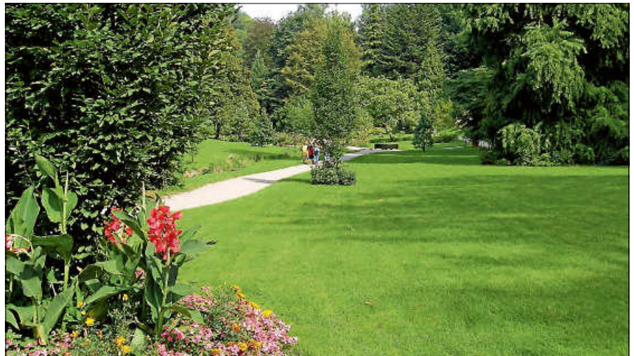
Der Gernsbacher Kurpark.

Bitte feste Schuhe, ausreichend Getränk-