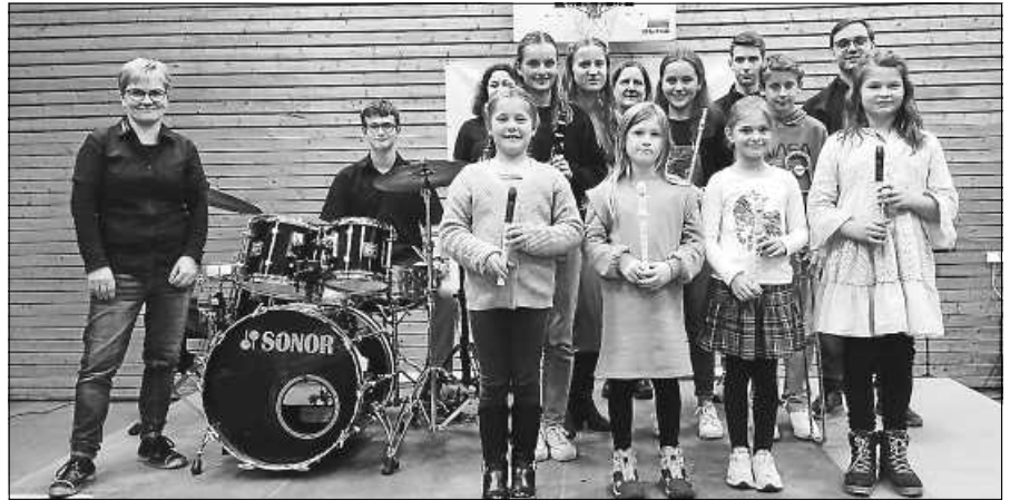
Die Nachwuchsmusiker des Vereins stellen sich vor.