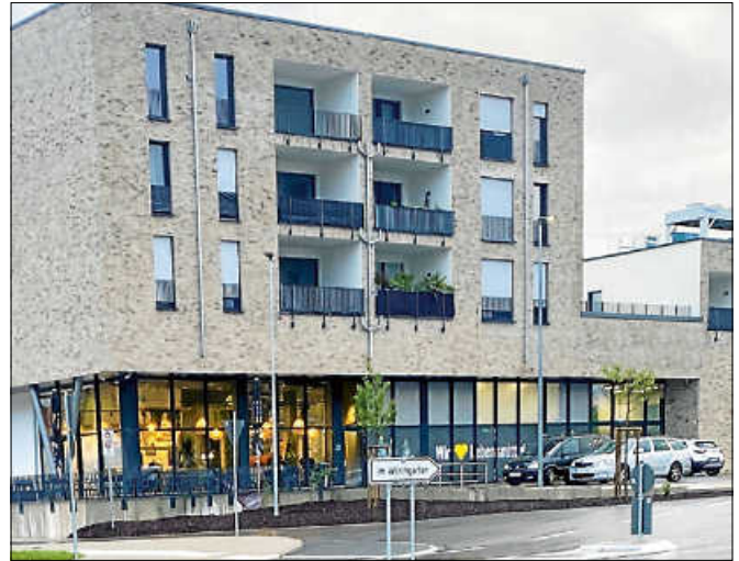
Der Wörthgarten - ein neues Quartier in Gernsbach.

Das entsprechende Bewerbungsvideo ist auch auf der städtischen Homepage hinterlegt und zeigt die Historie und die Entwicklung des neuen Quartiers.