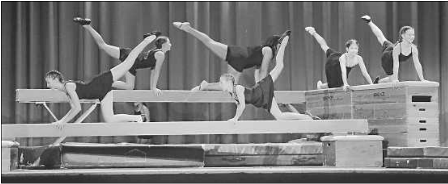
Gerättturnen war ein Beitrag in der TVG-Turnshow.