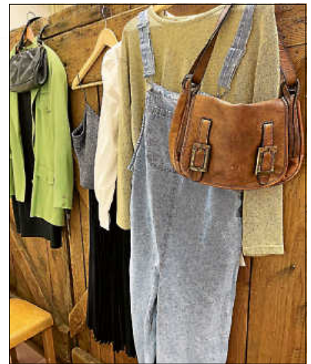
Neue Lieblingsstücke entdecken und alte Schätze teilen.

Weitere Informationen sind auf der Website www.zweimaleinmal.de verfügbar. ■