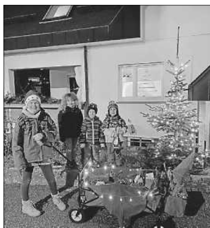
Nikolausgeschenke für die SVS-Turnkinder.