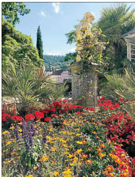
Der Katz'sche Garten: Ein Kleinod in Gernsbach.

„Wir sind froh, dass wir das bisherige Pfeleiderer-Areal erwerben konnten und