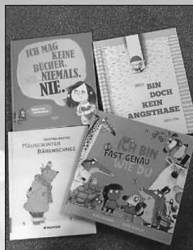
Lies mir bitte vor ...