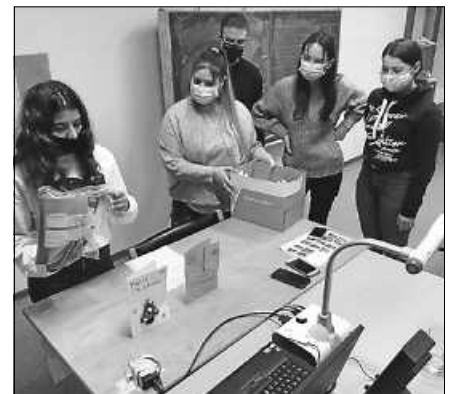
Schülerinnen aus der BFW2 bei dem Online-Workshop.