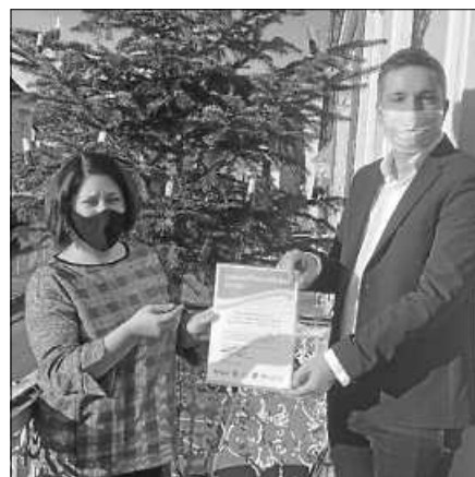
Übergabe Zertifikat "Jugendfreundlicher Verein"

Wir alle wissen noch nicht, was das Jahr 2021 uns bringen wird und ab wann wir wieder ohne Einschränkungen planen und leben werden. Trotzdem haben wir bei unserer letzten Vorstandssitzung die Terminplanung für 2021 auf der Tagesordnung gehabt. Wie zu erwarten, wird