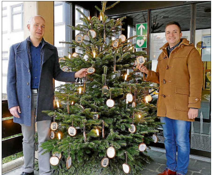
Die Spendenaktion am Rathaus läuft noch bis zum 6. Januar.

Erfahren Sie mehr über die Stiftung 'Gernsbach hilft'.