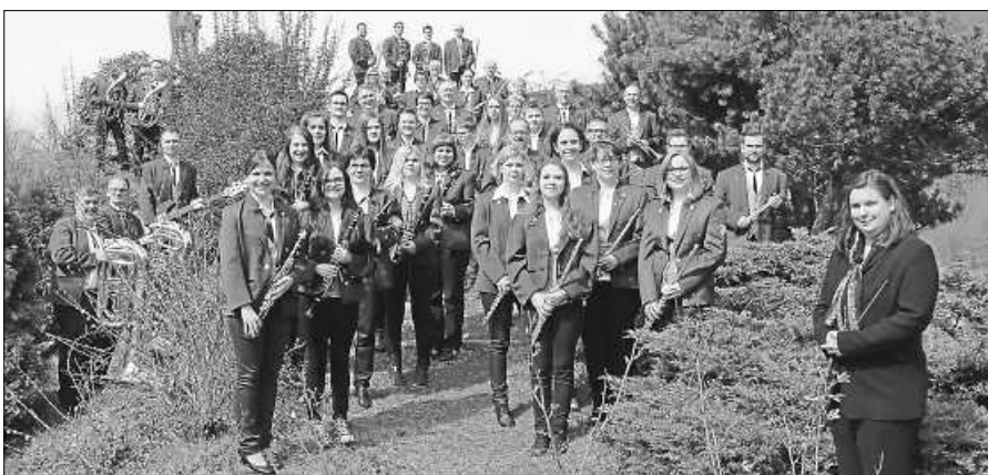
Wir halten zusammen.

Das Jahr 2020 war für uns alle ein ungewöhnliches und anstrengendes Jahr. Alle geplanten Veranstaltungen, wie auch direkte Begegnungen im Vereinsleben mussten abgesagt werden. Wir hoffen, dass wir im neuen Jahr unsere Freude an der Musik wieder gemeinsam teilen können. Sobald es uns wieder möglich ist, werden wir Veranstaltungen planen und Sie über die Presse und auf unserer Homepage www.musikverein-reichen-