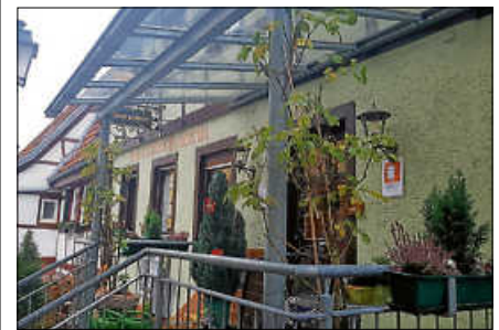
Viele Gastronomen bieten einen Abhol- und/oder Lieferservice.