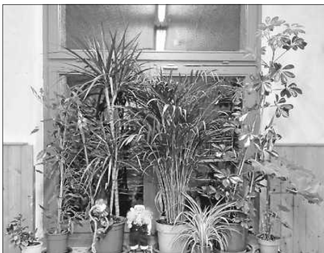
Das Kinder- und Jugendhaus Gernsbach.

Wegen der Corona-Regelungen ist das Tragen eines Mund-Nasen-Schutzes erforderlich. Der Mindestabstand von 1,50 Metern wird auch im Beratungskontext eingehalten. ■