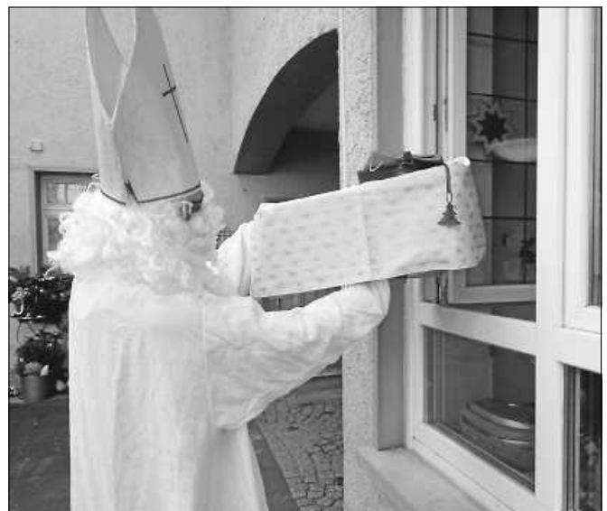
Im Coronajahr reicht Bischof Nikolaus die Geschenke durchs Fenster.

Am 8.12. war es endlich soweit. Ein lautes „HOHOHO“ hallte durch den Kindergartenhof. Wegen der geltenden Abstandsregelungen zog der heilige Mann draußen von Fenster zu Fenster. Aus jeder Gruppe strahlten ihm die Kindergesichter voller Freude entgegen, dass er es doch noch zu einem Besuch im Kindergarten geschafft hat. Viele gute Sachen konnte er zu jeder Gruppe aus seinem goldenen Buch vorlesen, welche die „Negativen“ fast wieder wettmachten. Die Kinder bedankten sich bei ihm mit wunderschönen Gedichten, welche schon Tage im Voraus auswendig gelernt wurden. Zur Belohnung reichte Bischof Nikolaus prall gefüllte Socken für die Kinder durch die Fenster.