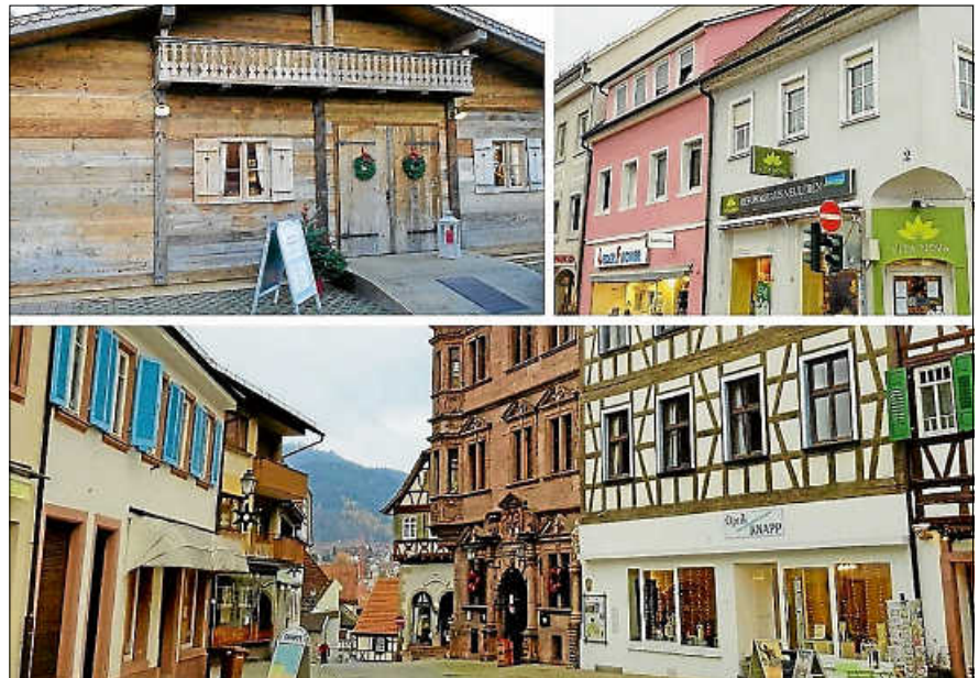
Viele Gernsbacher Unternehmen bieten einen Bestell- und Lieferservice.