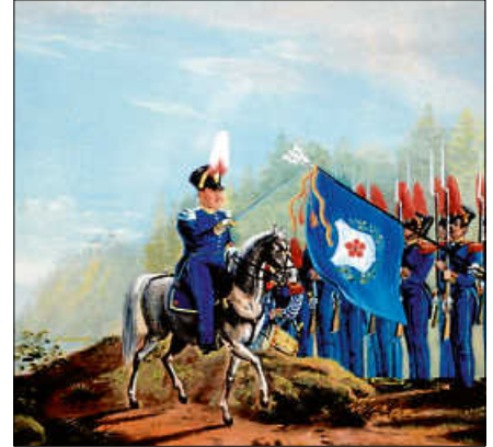
Mitglieder der Gernsbacher Bürgerwehr.

Eine Anmeldung ist nicht erforderlich. Der Eintritt ist frei. ■