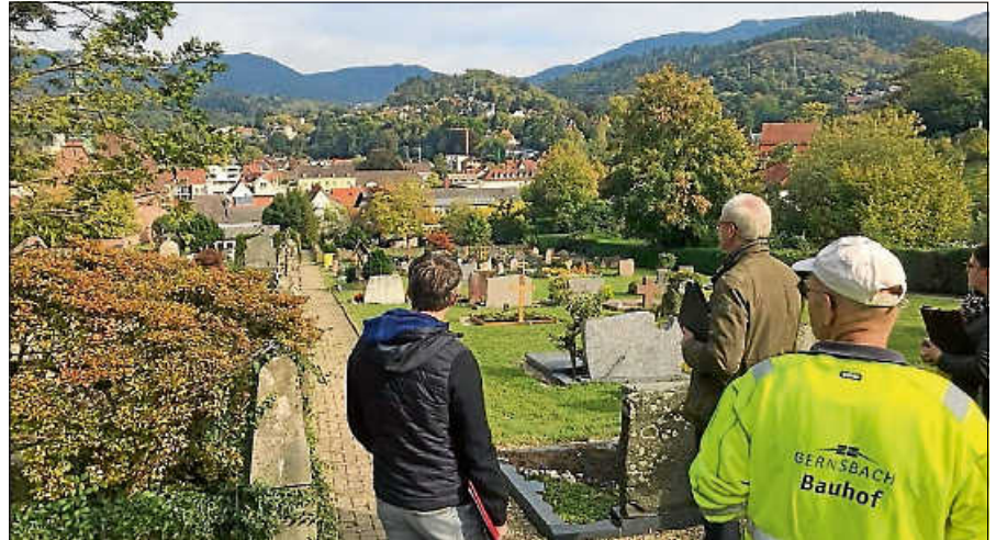
Evangelischer Friedhof Gernsbach.

Ein Bodengutachten analysiert daher die Bodeneigenschaften und Verwesungsleistung, um bei Umgestaltungen des