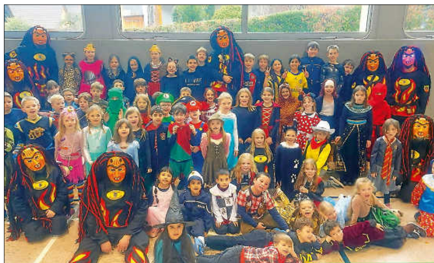
Die Obertsroter Schlossbergteufel mit den Kindern der Grundschule Hilpertsau.