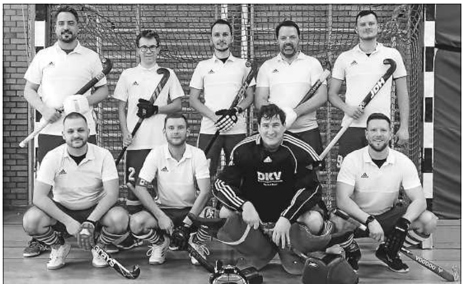
Herrenmannschaft des HCG.

Am Sonntag, 25.2.2024, findet der letzte Spieltag in der Ebersteinhalle in Obertsrot statt. Das erste Spiel für die Gernsbacher Herren beginnt um 11.50 Uhr gegen den HC TSG Heilbronn 2, das zweite Spiel gegen den TC RW Tuttlingen 2 beginnt um 13.30 Uhr. Die letzten beiden vielversprechenden