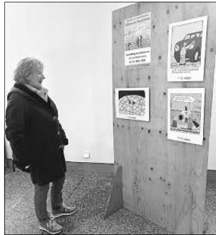
Die Karikaturen zu „Klima, Konsum und anderen Katastrophen“ stammen aus einem misereor-Projekt.

Die Ausstellung kann bis zum 10. März zu den Öffnungszeiten der Kirchen besichtigt werden.