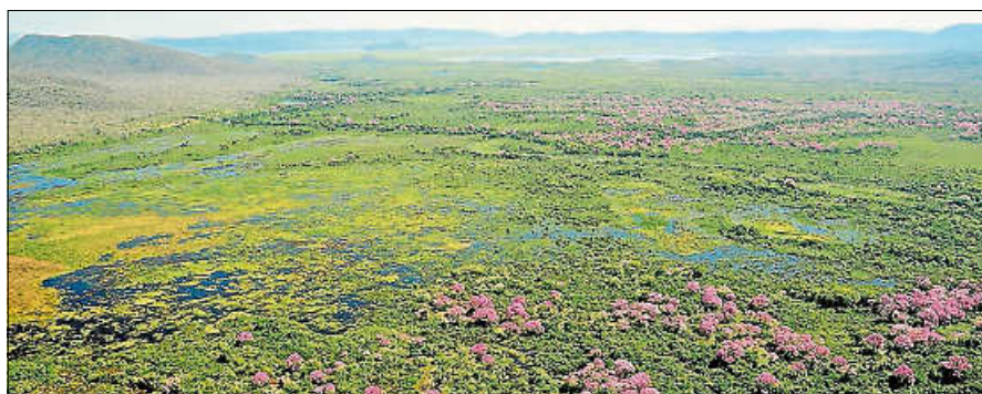
Das Pantanal - das größte Feuchtgebiet der Welt.

Das Pantanal – brasilianisch für „großer Sumpf“ – ist das mit über 170.000 km 2 größte Feuchtgebiet der Welt und fast halb so groß wie Deutschland. Die Lage im Zentrum des südamerikanischen Kontinents zwischen Bolivien und Brasilien machen das Ökosystem zur Schnittstelle der angrenzenden Savannen des Cerrado im Osten und den Regenwäldern des Amazonasgebiets im Norden. Entsprechend groß ist hier die Artenvielfalt an Pflanzen und Tieren. Zahlreiche Flüsse durchqueren das Pantanal und lassen die Senke in der Regenzeit zu einem gigantischen, flachen See anschwellen. In der Trocken-