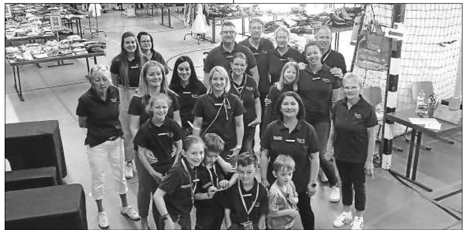
Das KidsBazarteam erwartet sie.