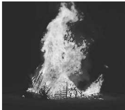
Traditionelles Verbrennen der Tante Fasnacht.

Donnerstag im Kindergarten und in der Schule besucht und feierten eifrig mit. Zahlreiche Besucher kamen auch wieder zum Faschingsball am Freitag und wurden mit einem bunten Programm bis in die späten Stunden unterhalten. Wer noch nicht nach Hause wollte, durfte in der Outdoorbar weiterfeiern.