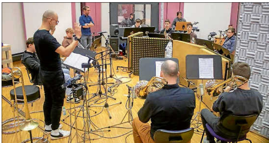
Der Traum eines jeden Musikers: Aufnahme im professionellen Tonstudio