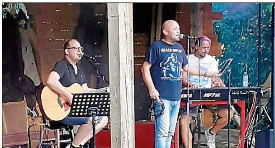
Das „Red Hot Acoustic Trio“ kommt ins Kirchl.

Samstag, 02. März 2024, Beginn 20 Uhr, Einlass 19 Uhr, Eintritt 15 Euro. Tickets-Reservierung gerne über die Homepage www.kultur-im-kirchl.de ■