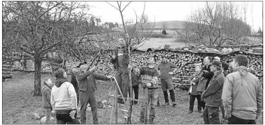
Zuschauer beim Schnittkurs.

Und schon wieder ist eine tolle Faschingskampagne zu Ende. Innerhalb einer Woche wurden in Scheuern vier Veranstaltungen über die Bühne gebracht. Der Regen konnte die Stimmung beim Narrenbaumstellen am „schmutzigen Mittwoch“ nicht verderben, die Murgfetzer gaben alles, und auch die Männer am Baum zeigten keine Schwäche. Viele kleine Narren wurden am