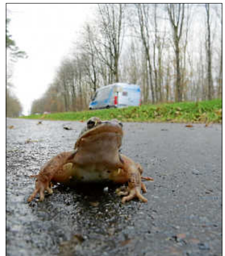
Mit den Krötenschutzzäunen sorgt die Helferguppe dafür, dass die Amphibien sicher über die Straße kommen.