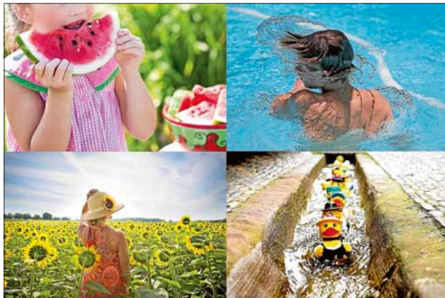
Der Sommer ist bunt - auch in Gernsbach!

Einfach das Foto bis zum 18. August per Mail an pressestelle@gernsbach.de oder per Facebook-Messenger an "Stadt Gernsbach" senden und mit etwas Glück und Talent einen tollen Preis gewinnen. Alternativ dazu kann das Foto auch unter Angabe von #gernsbachersommer auf Instagram hochgeladen werden. Pro Teilnehmer darf nur ein Sommerbild eingereicht werden. Die fünf besten Bilder werden im Stadtanzeiger sowie auf der Homepage und der Facebook-Seite der Stadt Gernsbach veröffentlicht und prämiert.