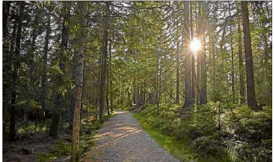
Abendstimmung am Kaltenbronn.

Nach der Führung können Interessierte noch den Aufstieg auf den Hohloh-Turm bewältigen, wo sie mit wunderbaren Aussichten in alle Himmelsrichtungen belohnt werden. Die Sonnenuntergänge sind immer ein Erlebnis (19:30 Uhr). Sofern keine Wolken die Sicht behindern, kann auch der Mondaufgang (20:37 Uhr) betrachtet werden. Eine Taschenlampe