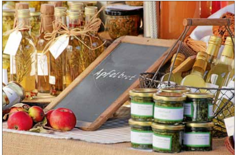
Einheimische Produkte und Köstlichkeiten zum Probieren und Erwerben.

11.00 Uhr Eröffnung durch Bürgermeister Julian Christ 11.00 Uhr Musikalische Unterhaltung