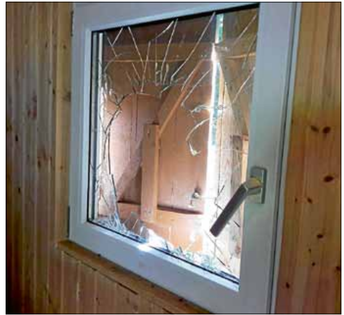
Mutwillige Zerstörung am Bauwagenfenster.