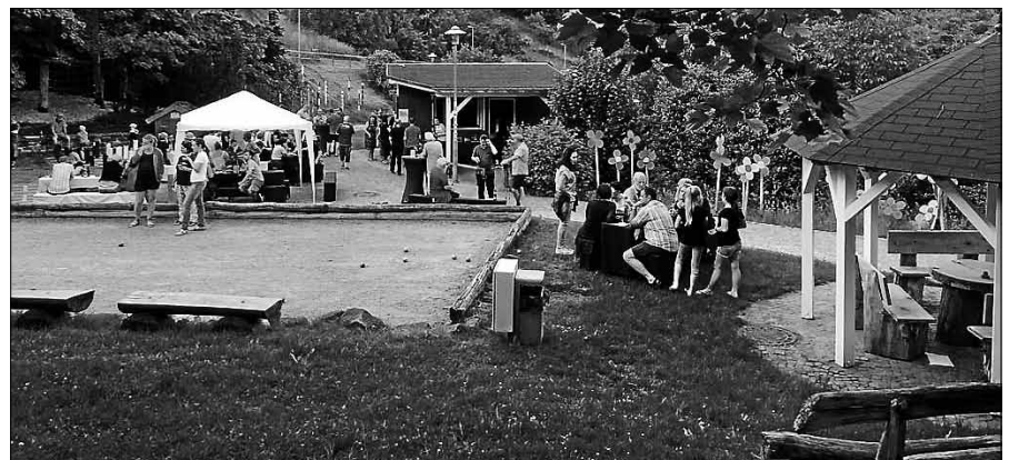
Viel los beim Feierabendgrillen