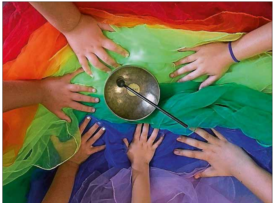
Ein buntes Angebot bietet das Kinderferienprogramm.