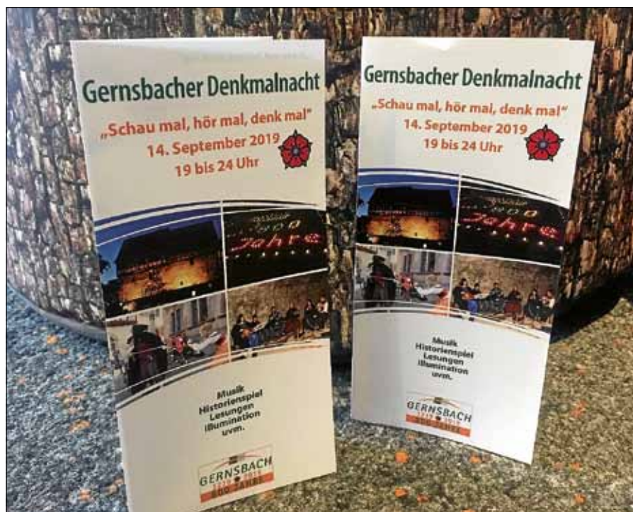
Der neu erschienene Programmflyer.

Der Flyer ist erhältlich bei der Tourist-Info Gernsbach und verschiedenen Auslageorten. ■