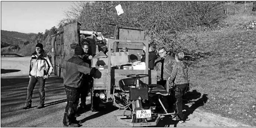
Die Musiker des MV Orgelfels Reichental sammeln am 17. August Altpapier