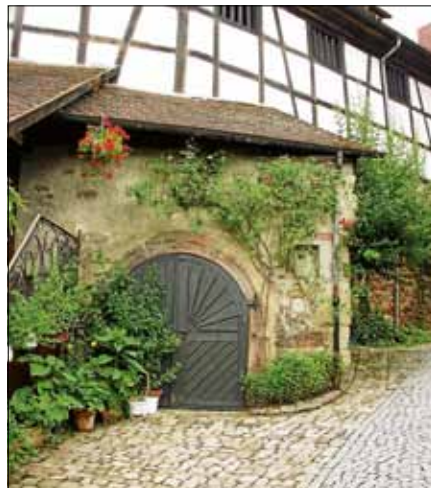
Auch im Wolkensteinschen Keller findet ein buntes Programm statt.

lässt das Bücherei-Team wieder aufleben. Mit den Teilnehmern – auch kinder-geeignet – werden unter Anleitung an diesem Abend aus dem Trägerpapier der Einbindefolien kleine Taschen genäht. In einer Ausstellung wird gezeigt, was noch aus Resten genäht werden kann. Klangvoll wird es auch in der Liebfrauenkirche. Das als Makulatur verwendete Doppelblatt eines klösterlichen Antiphonalbuches aus dem späten 13. Jahrhundert ist die älteste Handschrift im Gernsbacher Stadtarchiv. Eine Auswahl der darauf notierten Antiphonen wird durch eine Schola gesanglich vorgetragen und das zur Besichtigung ausgestellte Originalpergament hierdurch hörbar gemacht. Eintauchen kann man außerdem in die schaurige Welt der Gothic pipes. Gotischer Baustil und geisterhafte Orgelmusik sind oftmals Zutaten für schaurige Effekte in Geisterbahnen und Gruselfilmen. Bekannte und weniger