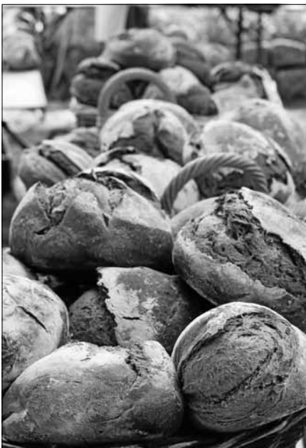
Großer Beliebtheit erfreuen sich die frischen Holzofenbrote.

Der Obst- und Gartenbauverein Obertrot/Hilpertsau veranstaltet am Sonntag, dem 18. August, sein alljährliches Backofenfest auf seinem Platz in Hilpertsau. Die kleine Anlage wird von den Vereinsmitgliedern gehegt und gepflegt. Aushängeschild ist ein originalgetreuer Nachbau eines Murgtäler „Backhiesels“, das selbstverständlich zu diesem Anlass auch angefeuert wird. Im historischen Backofen werden die Holzofen-Krustenlaibe gebacken, die bei allen Besuchern sehr begehrt sind. Des Weiteren werden Speisen wie u.a. Flammkuchen und Schmalzbrot angeboten. Selbstverständlich gibt es auch eine Kuchentheke mit reichhaltiger Auswahl.