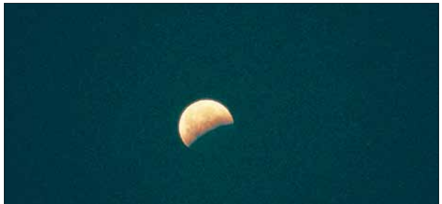
So schön zeigt sich der Mond über dem Murgtal.

Kai Lierheimer weiß Geschichten, um und über den Mond zu berichten, aber auch Geschichte(n) vom Murgtal und von der Natur. Beginn der Wanderung ist um 19.30 Uhr, die Tour dauert ca. 2-3 Stunden. Treffpunkt ist der Parkplatz an der S-Bahn-Haltestelle Gernsbach-Hilpertsau. Bitte an wetterfeste Kleidung, geeignetes Schuhwerk und eine Sitzunterlage denken! Die Teilnahme ist kostenfrei, um Anmeldungen per Mail hallo@kai-lierheimer.de oder Telefon 0172/7285940 wird gebeten. ■