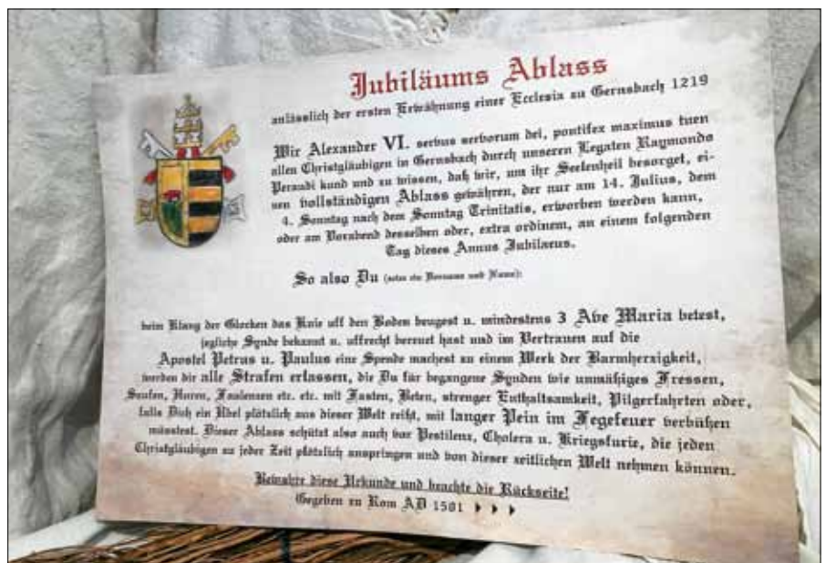
Der Jubiläumsablass kann durch Eintragung von Namen personalisiert werden und eignet sich auch hervorragend als besonderes Geschenk.

Der repräsentative, nach mittelalterlichen Urkunden gestaltete Gernsbacher Jubiläumsablass ist nun noch bis Ende des Jubiläumsjahres bei der Tourist-Info der Stadt Gernsbach für eine Spende von mindestens einem Euro erhältlich. Mit den Einnahmen wird ein wohltätiger Zweck in Gernsbach unterstützt. ■