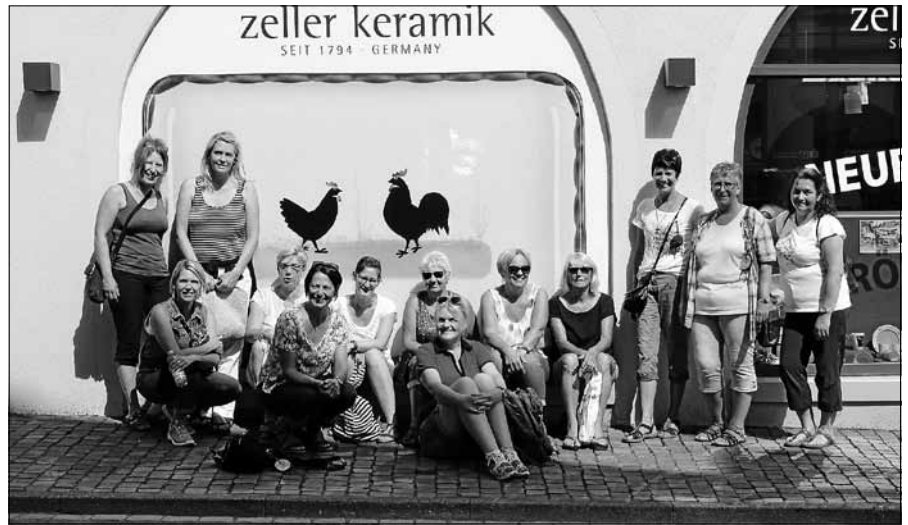
FCA Wellnessdamen in Zell am Harmersbach

Beginn des Fests ist um 10.00 Uhr. Der Musikverein Hilpertsau stattet dem OGV von ca. 11 Uhr bis 12:30 Uhr einen Besuch ab und wird in bekannter Weise