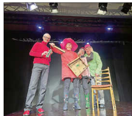
Drei Affen.

Das Ensemble Materialtheater beschloss die diesjährige Puppentheaterwoche mit einer Parabel vom Aufstand der Dinge. In „Drei Affen“ fühlten sich die Menschen von ehemals geliebten Dingen bedroht und erklärten diesen den Krieg. ■