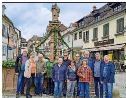
Die Süßmostgruppe Gernsbach bei ihrer jährlichen Aktion vor dem Metzgerbrunnen.

Die Süßmostgruppe Gernsbach hat in dieser jährlichen Aktion, die sie 2019 vom Hausfrauenbund übernommen hat, mit Ostereiern geschmückte Ketten an den Brunnen angebracht. Auch der Bauhof hat die Aktion mit der Anlieferung der zahlreichen großen Kisten und dem Anbringen von Dielen wieder tatkräftig unterstützt.