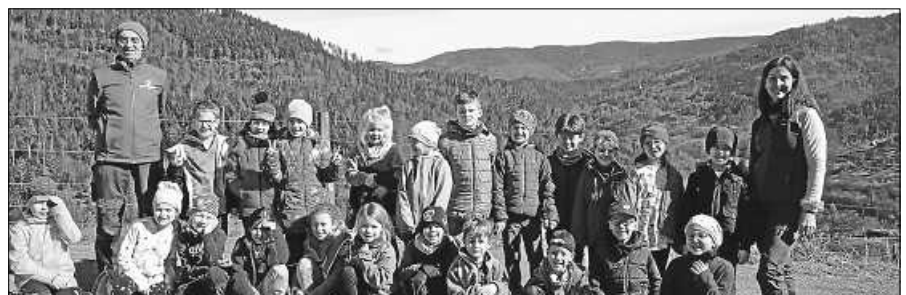
Ausflug der 1. Klasse zu den Ziegen.