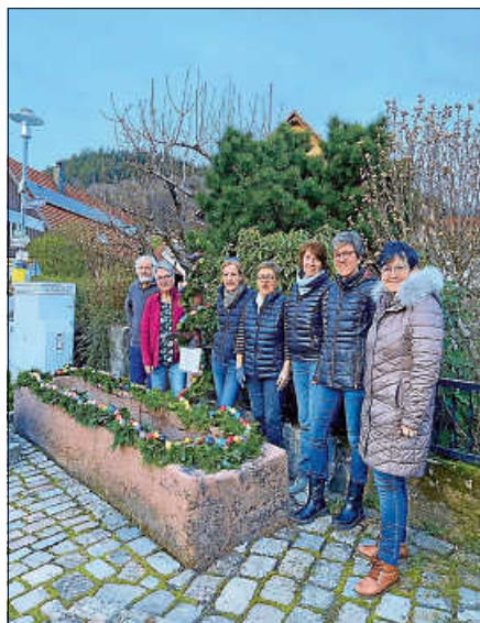
Sieben Mitglieder des Kath. Gemeindeteams und des OGV Lautenbach beim Zieren des Brunnens im Oberdorf (bei der „Alten Kirche“).

schmückt und erstmals auch zwei weitere Brunnen im alten Dorfkern, nämlich am Birkenweg und am Erlenweg. Die schönen Osterbrunnen können bei einem lohnenden Dorf-Rundgang besichtigt werden. ■