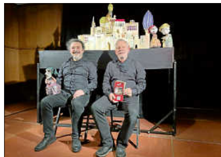
Ali Baba und die 40 Räuber.