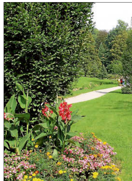
Der Gernsbacher Kurpark.

Weitere Termine: Do., 04.07., 10 Uhr, Do., 10.10., 10 Uhr ■