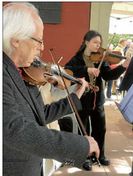
Die Musikschule Murgtal umrahmte die Feierlichkeit musikalisch.