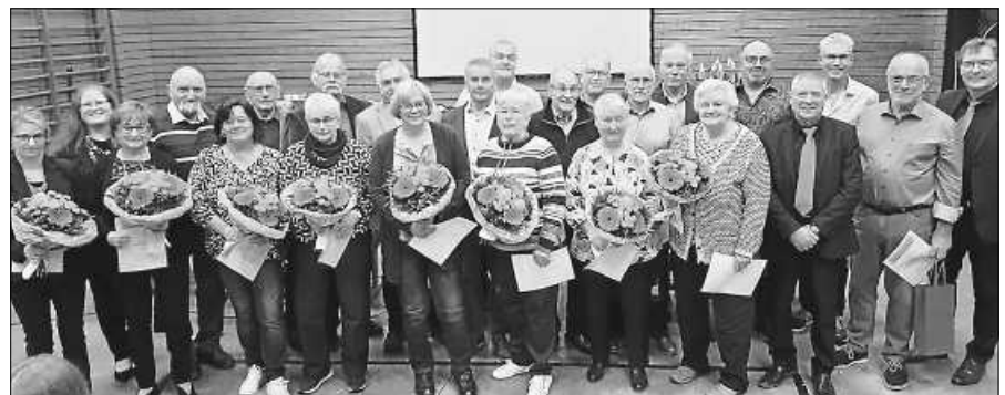
Die geehrten anwesenden Mitglieder des Gesangvereins zusammen mit dem Vorstandsteam.

Für das Jahr 2024 plant der Chor ein Adventskonzert in der Kirche in Reichental am 30. November. Als nächster Termin steht am 1. Mai der traditionelle Maihock auf dem Schulhof in Reichental an. Mit „Fängt der Mond die Sterne“ schloss der Chor die Versammlung mit einem weiteren Liedbeitrag.