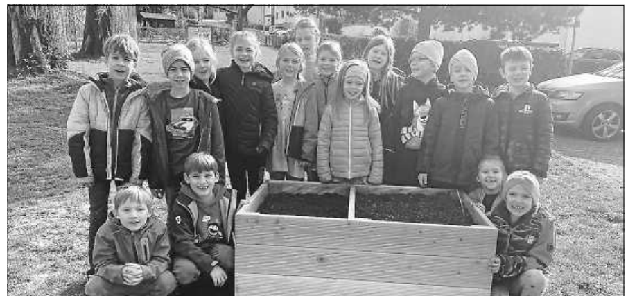
Kinder der Naturparkschule mit dem Hochbeet der Getreidesaat.

Um den Kindern einen Überblick über den gesamten Ablauf von der Aussaat, über die Wachstumsphase, der Reife des Kornes, dem Aussehen der Ähren und der Ernte zu geben, haben die Lehrkräfte beschlossen, mit den Kindern auf einem der schuleigenen Hochbeete Getreide anzubauen. Ausgesät wurde dabei eine Sorte namens ‚Schwarzer Samtemmer‘, eine alte Sorte, die von den ‚modernen‘ Sorten wie Weizen, Roggen und Gerste verdrängt wurde. Natürlich wird die Menge für alle Kinder nicht ausreichen, und auch das erforder-