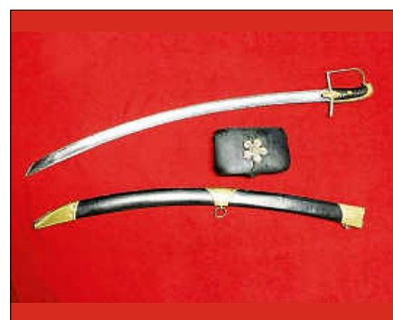
2024: Jubiläumsjahr 175 Jahre Badische Revolution.

Treffpunkt ist um 14 Uhr am Brunnen am Salmenplatz. Die Führung dauert ca. 2 Stunden. Eine Anmeldung bei der Touristinfo Gernsbach, 07224 644 446 oder touristinfo@gernsbach.de ist erforderlich. ■