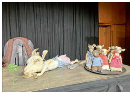
Herr Wolf und die sieben Geißlein.