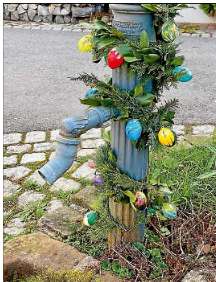
Auch am Ende des Erlenwegs, bei der Einmündung in die Sägemühlstraße wurde die Brunnen-Zapfsäule erstmals mit einer Oster-Girlande geziert.