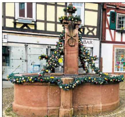
Brunnen an der Hofstätte.

In den Ostereier-Ketten kann man wahre Kunstwerke entdecken, es lohnt sich, die Girlanden genauer anzuschauen. Da gibt es Eier mit dem Stadtwappen, aber