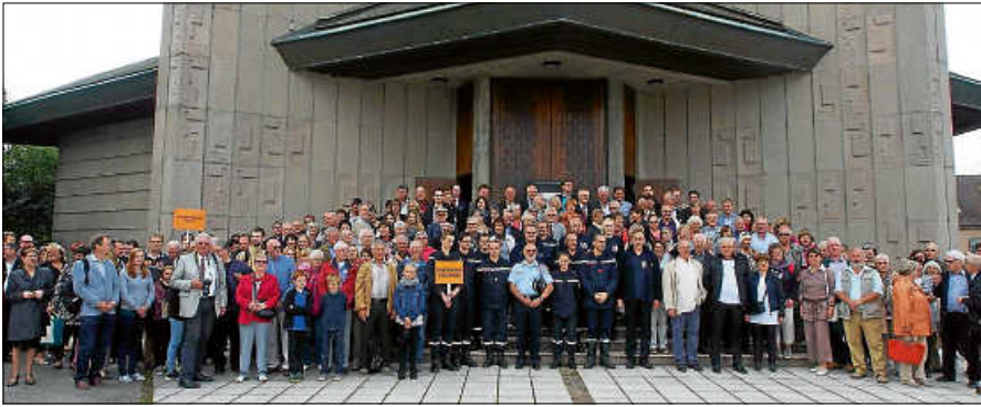
Partnerschaftsfeier 2014 in Baccarat.