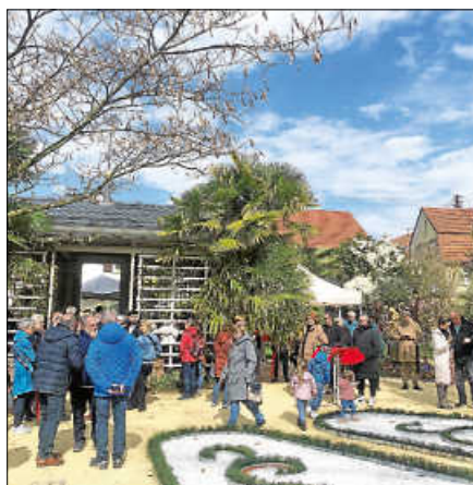
Gemeinderäte, Bürgermeister und Besucherinnen sowie Besucher genossen die Feierstunde.

Der Garten öffnet täglich von 10 bis 18 Uhr seine Pforten für Besucherinnen und Besucher. Der Eintritt ist frei. ■