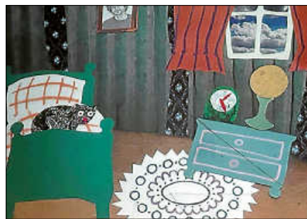
Wenn Ferdinand nachts schlafen geht.