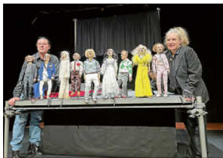
Der Fall Hamlet.

Das Grimm-Märchen Hans im Glück wurde von Abdul Haq Haqjoo in „Hassan im Glück“ umgewandelt und zeigte die bekannte Geschichte aus Sicht seines Heimatlandes Afghanistan. Die Geschichte wurde zum einen für Kinder gezeigt, zum anderen aber auch in einer Version für Erwachsene, die