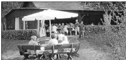
Hock bei der Fischerhütte am Träufelbachsee.

Der Gernsbacher Sportfischerverein „Petri Heil“ lädt am Karfreitag, den 29.03., ab 10 Uhr, zum Fischessen in seine Fischerhütte am Träufelbachsee. Neben gebackenen Forellen und Forellenfilets werden in diesem Jahr auch wieder Forellen geräuchert; dazu gibt es Kartoffelsalat oder Weck. Angeboten werden auch wieder Fischweck und Maultaschen. Kaffee und Kuchen runden unser Angebot ab. Die Speisen können auch mit nach Hause genommen werden. Wir freuen uns auf Ihren Besuch.