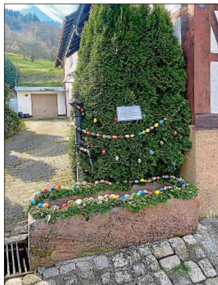
Der geschmückte idyllische Brunnen im Mitteldorf (Lautenfelsenstraße/Abbiegung Bernauerstraße zur Kath. Kirche).