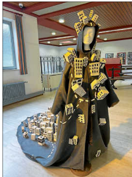
Die begleitende Ausstellung der Studierenden der HfS Ernst Busch.

V iele begeisterte Zuschauer konnten in dieser Spielsaison bei 22 Vorstellungen Bühnen aus ganz Deutschland und Frankreich/Afghanistan in der Stadthalle erleben.