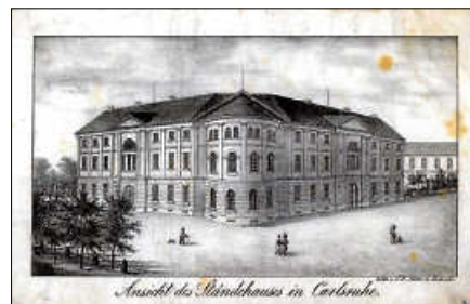
Das Ständehaus in Karlsruhe. Tagungsort der Verfassungsgebenden Versammlung.

Minderheit. Überkreuzten sich hier die Bestrebungen nach weitergehenden Frei-