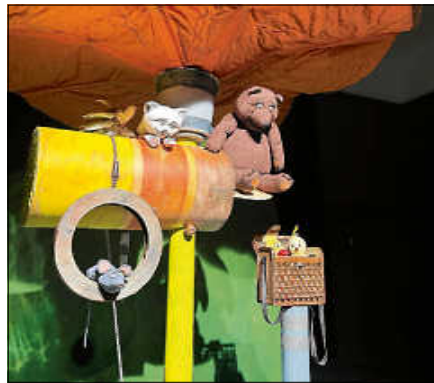
Pieps - Lustige Tiergeschichten.

In dem Stück „Der Meteor“ nach Dürrenmatt kehrte die Hauptfigur Schwitter in sein altes Atelier zurück, um sich dort seinen letzten Wunsch zu erfüllen - er möchte sterben. Was sich als schwierig erwies, war er