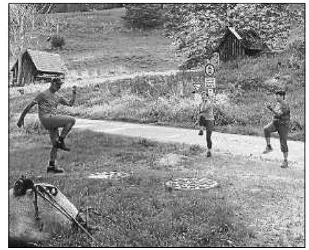
Fit und gesund.

Mitbringen: Feste Schuhe, dem Wetter angepasste Kleidung, in der man sich gut bewegen kann, eine Sitzunterlage, ausreichend Getränke und Kondition für ca. 170 Höhenmeter im Anstieg. Treffpunkt: Parkplatz am Kunstweg, Abzweig Reichentaler Straße. Die kostenfreie Tour hat eine Strecke von ca. 7 km und dauert ca. 3 Stunden.