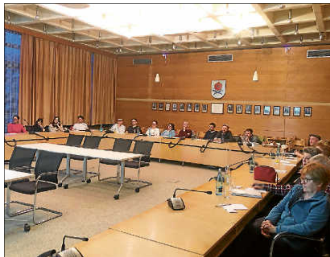
Google-Workshop für Gernsbacher Unternehmen im Sitzungssaal des Rathauses.

ihre Geschäftstätigkeit mitnehmen konnten. Den gemeinsamen Austausch im Anschluss an die Veranstaltung empfanden alle Mitwirkenden als besonders bereichernd. ■