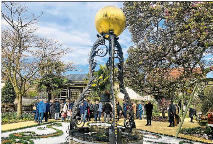
Gemeinderäte, Bürgermeister und Besucherinnen sowie Besucher genossen die Feierstunde.

In einer feierlichen Zeremonie wurde der Katz'sche Garten nach mehr als einem Jahr der Schließung aufgrund von Hochwasserschutzmaßnahmen offiziell wieder seiner Bestimmung übergeben.