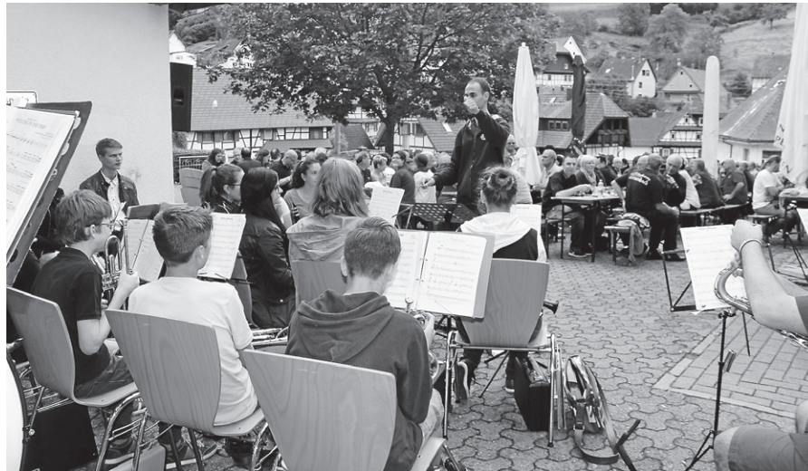
Der Musikverein Reichental lädt zum ersten Feierabendhock auf den Schulhof ein.