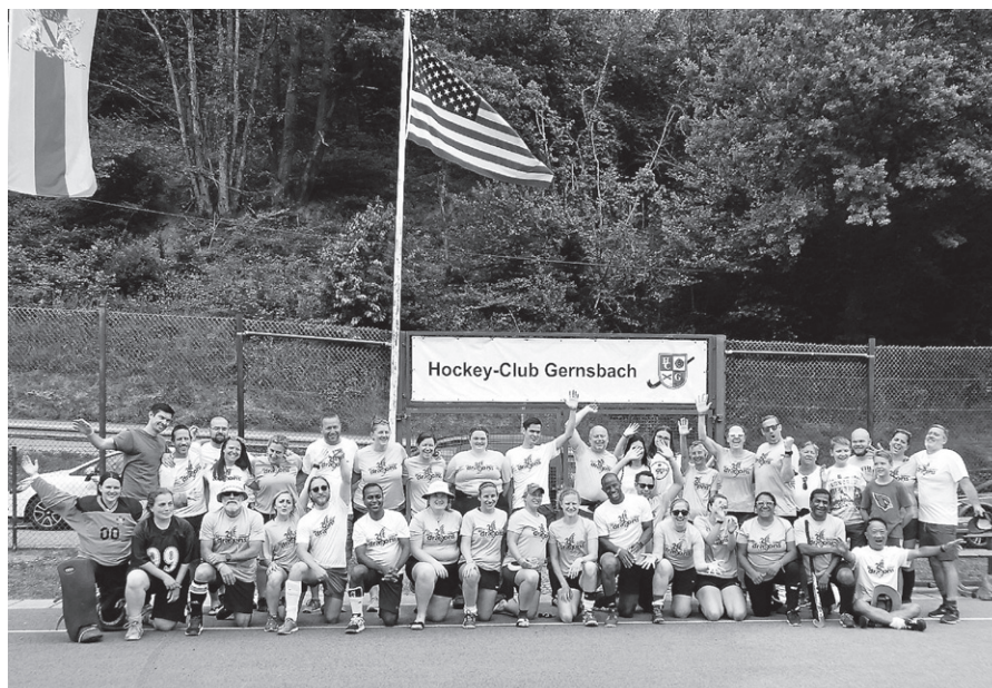
DC Dragons aus Washington D.C./USA.

Der „Kuno-Hellmann-Pokal“ ging wie die Jahre zuvor wieder an die Damen vom „Trinkwasserschutzverein“ aus Mannheim, die ihr Finalspiel gegen die „DC Dragons“ aus Washington D.C./USA mit 4:0 gewannen. Den Mixed-Pokal gewann die Mannschaft „MonacoTrink !“, gebildet von den Monaco Allstars/Trinkwasserschutzverein gegen die „Wiesbabos“ aus Wiesbaden mit 3:1. Eine klare Bereicherung für das Turnier war auch das Team aus Washington D.C./USA. Mit 36 Sportlern stellten sie die größte Gruppe. Eine weitere Neuerung war das Slippery Hockey. Hier wird ein aufblasbares Spielfeld mit Wasser rutschig gemacht und mit Softball und weichen Keulen gespielt. Dies ist eine schnelle und lustige Fun-Variation des Hockey und die Spieler und Spielerinnen hatten sichtlich Spaß. Hier gewannen den Mix