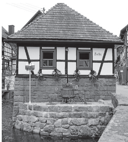
Dorfhock an der Kelter.

Mit würzigem Rollbraten und Spätzle, knackigen Würsten und Pommes ist ab 12 Uhr für das leibliche Wohl bestens gesorgt. Flammkuchen aus dem Holzofen und hausgemachte Kuchen runden das Angebot ab. Wir freuen uns auf Ihren Besuch und wünschen Ihnen gemütliche Stunden beim OGV Reichental.