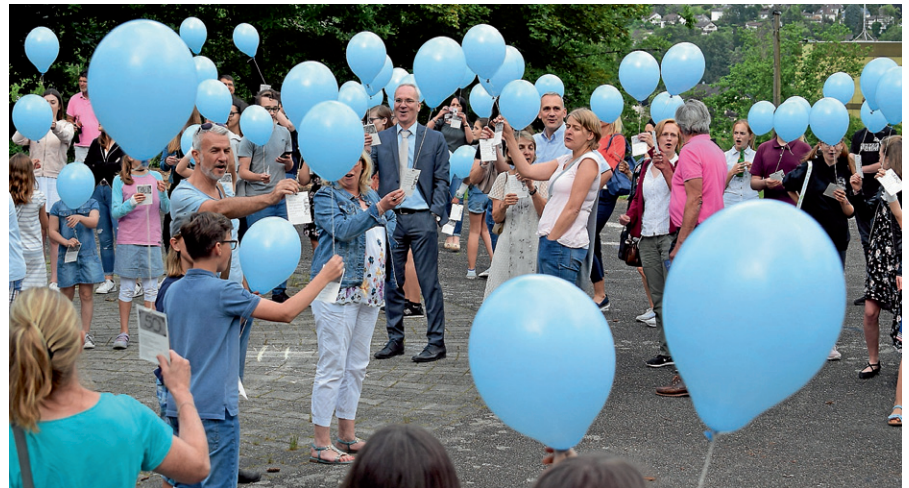
Soziales Engagement verbindet das ASG mit der Luftballonaktion.

Im Anschluss konnten Ehemalige ihre Schule und die Veränderungen, die die Schule im Laufe der Jahre erlebte, bei einer „Stunde der Offenen Schule“ und einem Gang durch die verschiedenen Unterrichtsräume erleben. Die Fachschaften und AGs stellten ihre Fachgebiete vor. So konnte man im Fach Gemeinschaftskunde herausfinden, wie knifflig der Einbürgerungstest ist, in Mathematik an den Aufgaben des jährlich stattfindenden „Känguru-Wettbewerbs“ knobeln, in der Robotics-AG Roboter programmieren, sich in Sport motorischen Tests unterziehen und vieles mehr.