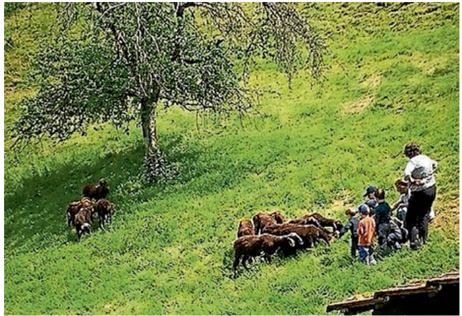
Die SpielWald-Kinder lernen bei Dominik Sämann, wie man mit den gutmütigen und ängstlichen Schafen umgeht.

In der letzten Maiwoche durften sie dann zum ersten Mal mit dem Schäfer den Stall und das Gehege der Tiere betreten. Schafe sind gutmütig und ängstlich. Die Kinder müssen im Stall und im Gehege ihr Verhalten den Tieren anpassen. Regeln wurden schon im Vorfeld erarbeitet. Sie sollen sich langsam bewegen, leise verhalten und warten, bis die Schafe auf sie zukommen, um keinen Fluchtreflex bei den Tieren auszulösen - eine Herausforderung für die Kinder, der