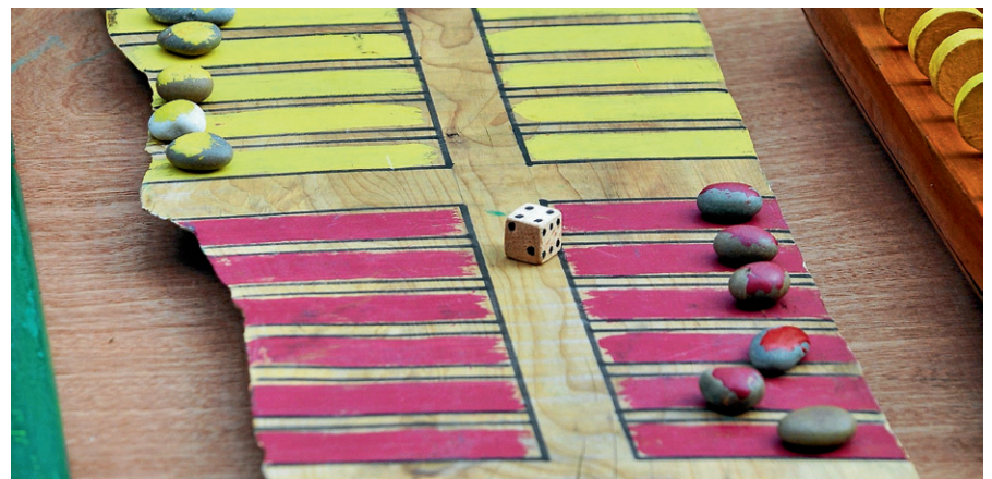
Die Kinder zeigen, wie man mittelalterliche Steinspiele selbst herstellt.

Auf dem Wochenmarkt zeigen sie, wie man Lederbeutel und Lederarmbänder bastelt. Zusätzlich fertigen sie mittelalterliche Steinspiele an und erproben diese vor Ort. Nach Mitteilung der Hortleiterin Doris Klein möchte der Schülerhort auf diese Weise einen Beitrag zum Gernsbacher Stadtjubiläum leisten. ■