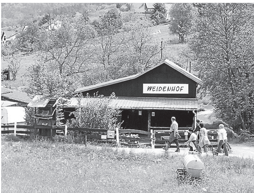
Fühlen Sie sich herzlich willkommen auf dem Weidenhof.

Was: Kinderprogramm, leckere Verpflegung aus dem Holzbackofen und Zeit zur Entspannung sowie Infos zu unseren Angeboten wie tiergestützte Therapie,