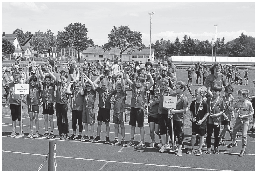
Das U10-Pokalsieger-Team gewann bei allen fünf Disziplinen.

Drei Pokale für die Kinder der Leichtathleten des TVG. In Ötigheim fand der erste Freiluftwettkampf des Kinderleichtathletik-Cups 2019 statt. Bei schönem Wetter nahmen 33 Mannschaften der U8 bis