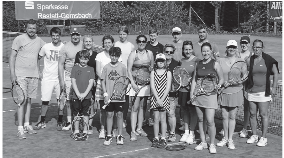
Die Teilnehmer des Schleifchenturniers.

Mehr als 20 Teilnehmer hatten an Christi Himmelfahrt bei strahlendem Sonnenschein jede Menge Spaß beim Schleifchenturnier des TCG. Besonders erfreulich war dabei, dass auch zahlrei-