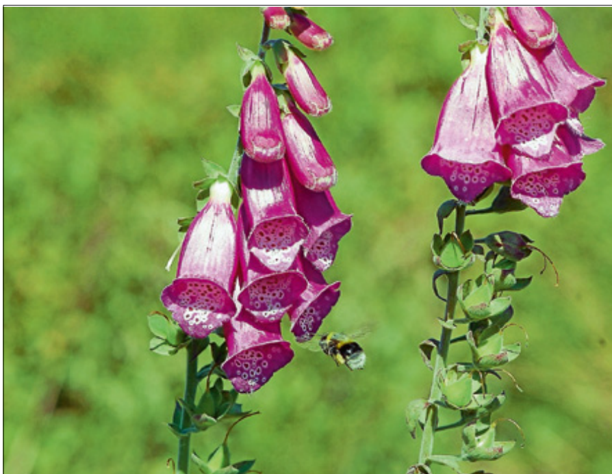
Fingerhut am Wegesrand.