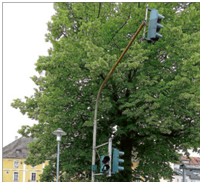
Grünes Licht für eine neue Fußgängerampel an der Bleichstraße.