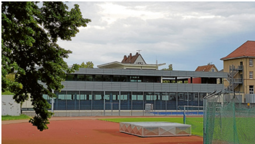
Die Stadionshalle Gernsbach.