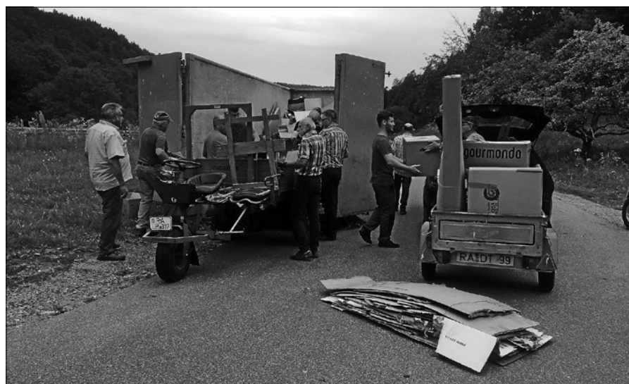
Altpapier für die Vereinskasse

Bitte passen Sie auf sich auf und bleiben Sie gesund. Halten Sie uns auch in diesen schwierigen Zeiten die Treue.