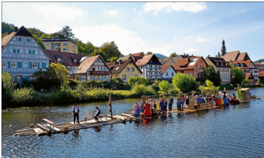
Die Floßfahrt auf der Murg ist eines der beliebten Highlights auf dem Altstadtfest.

Anfang Mai hatte Bürgermeister Christ einen Rücklaufbogen an die Teilnehmer der vergangenen Altstadtfesten sowie an neue Interessenten verschickt, um so das Stimmungsbild und die Einschätzung der Teilnehmer zu einer Durchführung abzufragen. Die Rückläufe der Teilnehmer haben gezeigt, dass die Mehrheit eine Ausrichtung des Altstadtfestes unter ‚Corona-Bedingungen‘ als nur schwer