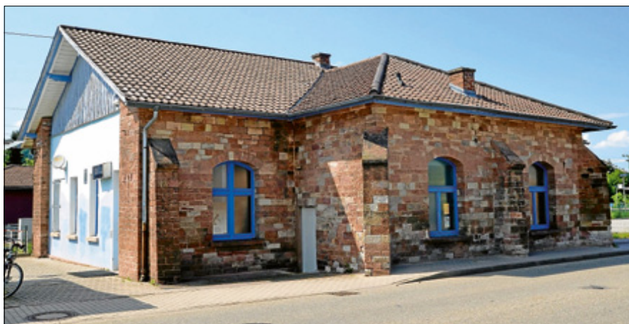
Im nächsten Schritt werden die Kinder und die Jugendlichen mit an der Neukonzeption beteiligt.

Die Präsentation der Sozialraumanalyse ist ein erster Zwischenschritt. Der Gemeinderat sprach sich in seiner Junisitzung ebenfalls dafür aus, wie von der Stadt Gernsbach empfohlen, die Beteiligung der Jugendlichen bei der Neukonzeption des Gernsbacher Kinder- und Jugendhauses auf den Weg zu bringen. Im Rahmen einer Beteiligungsrunde sollen nun die Bedürfnisse