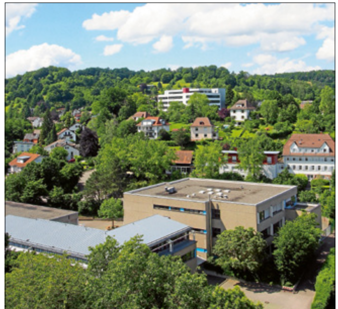
Weitere Schulöffnungen nach den Pfingstferien.

Weitere Infos und Details zum Verfahren bzw. zu den jeweiligen Schulöffnungen sind auf den jeweiligen Homepages der Schu-