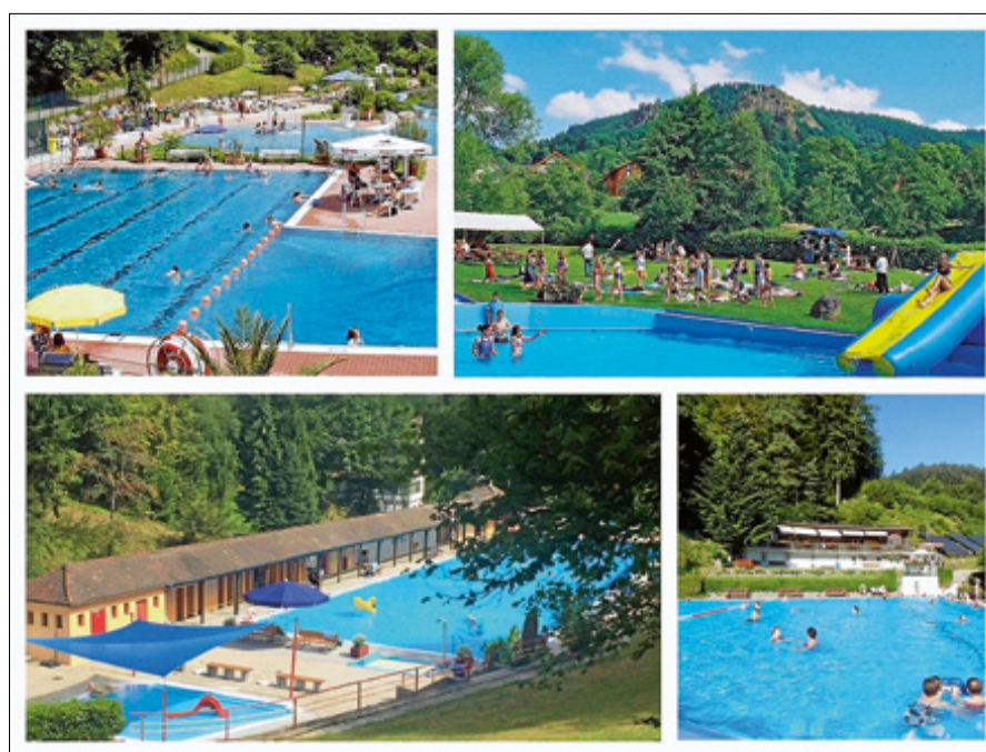
Die Corona-Hygienemaßnahmen werden die Badesaison 2020 verändern...

Die Kommunen müssen einrichtungsspezifische Hygienekonzepte, die die örtlichen Gegebenheiten berücksichtigen, erstellen und darin festlegen,