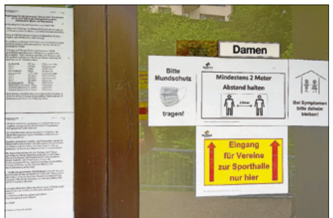
Regelungen und Hinweise zur Nutzung der Sporthallen sind gut sichtbar an den Eingängen angebracht (hier: Realschulhalle).

Sport- und Spielsituationen, bei denen ein körperlicher Kontakt möglich oder erforderlich ist, sind allerdings noch immer