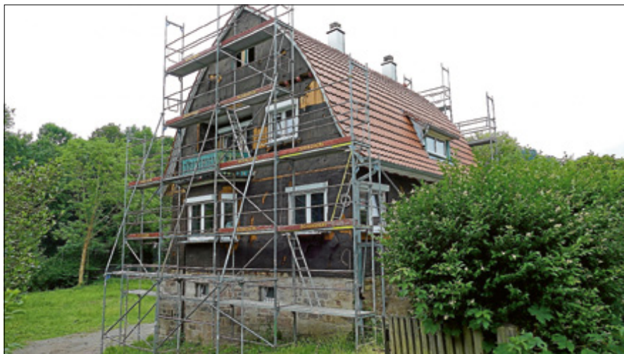
Noch steht das Gerüst am Haus in der Jahnstraße 7.

Der Kindergartenbedarfsplan 2019/20 machte den zwingenden Handlungsbedarf zur kurzfristigen Einrichtung