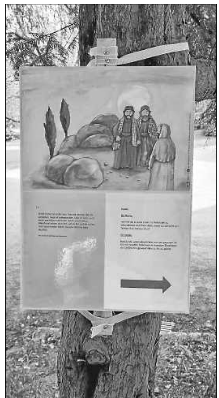
Eine Station des Pfingstwegs im Kurpark.

Der in den Pfingstferien im Gernsbacher Kurpark eingerichtete Impulsweg zu der Geschichte von Pfingsten stieß auf große Resonanz. Die Verantwortlichen freuten sich über das positive Feedback von vielen großen und kleinen Besucherinnen und Besuchern.