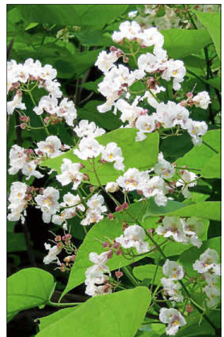
Ein Trompetenbaum.

Die Teilnehmerzahl ist begrenzt auf 20 Personen. Während der Führung wird darum gebeten, Abstände einzuhalten und wenn Abstände nicht eingehalten werden können, eine Maske zu tragen. Bitte weisen Sie außerdem einen Nachweis über Getestet, Geimpft, Genesen vor.