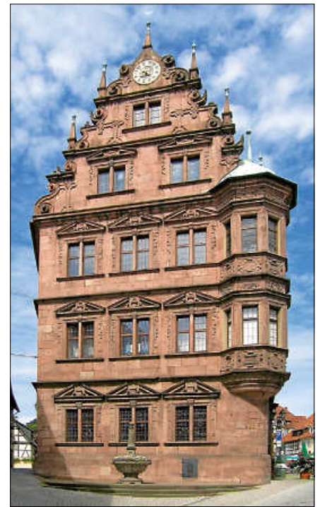
Das Alte Rathaus.