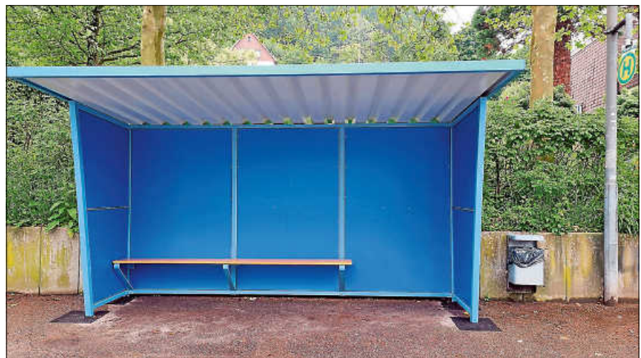
Frisch gestrichen: Das Buswartehäuschen an der Ebersteinhalle.