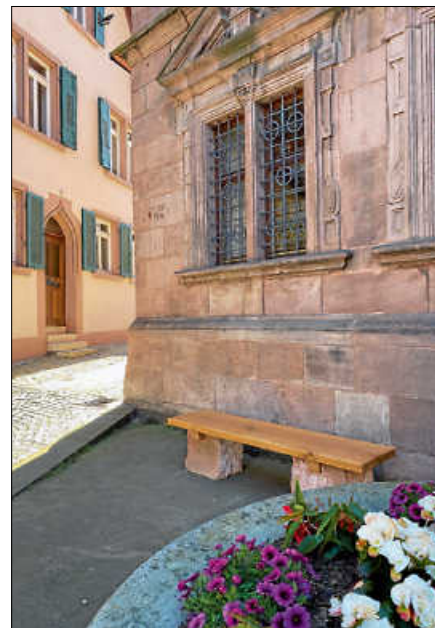
Die Sitzgelegenheit lädt zum Verweilen am Altstadtbuckel ein.