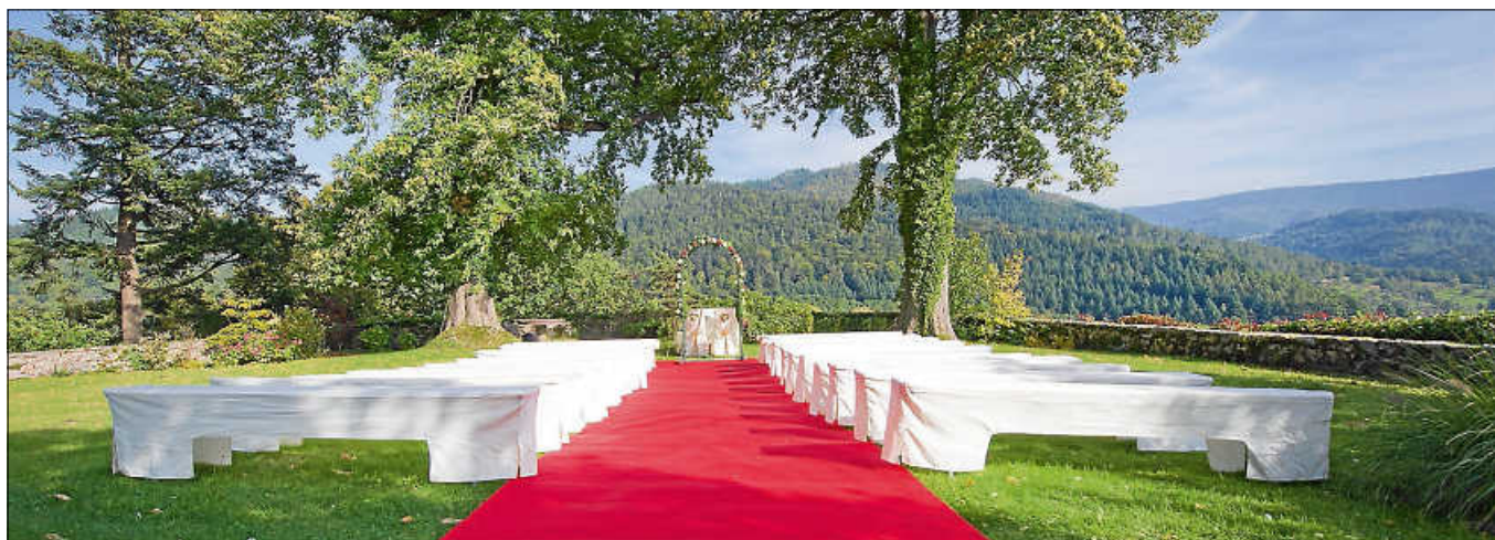
Der Rosengarten auf Schloss Eberstein: Traumhaft schöne Location für das Ja-Wort unter freiem Himmel.