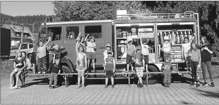
Kinderferienprogramm FFW Gernsbach Abt. Hilpertsau/Obertsrot.