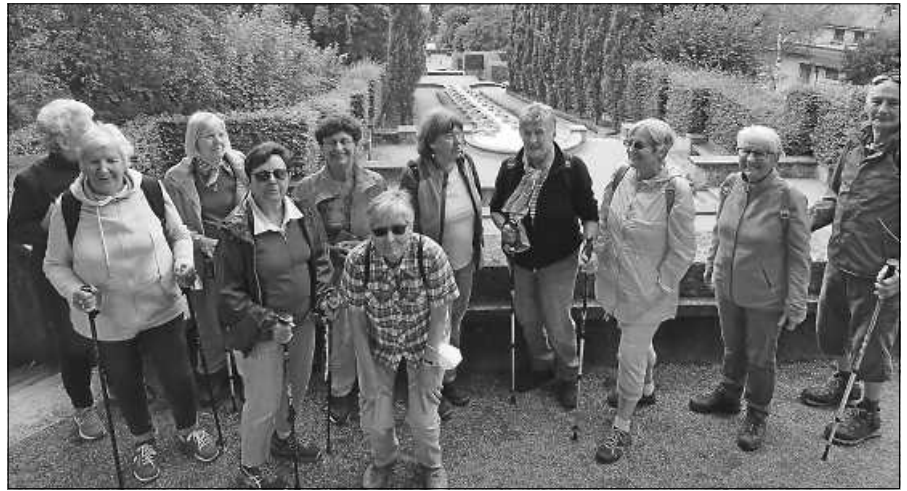
Ausflug nach Baden-Baden.