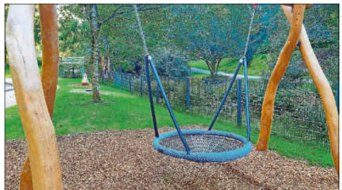
Eine Nestschaukel und die Holz-Wildente wollen entdeckt werden.

Die Baumaßnahmen waren pünktlich zum Beginn der Sommerferien beendet. Da der Rasen neu eingesät werden musste, mussten sich Kinder und Eltern bis zur Öffnung des Spielplatzes allerdings noch gedulden. Infolge der starken Regenfälle mussten Samen nachgesät werden, was die Wartezeit zusätzlich verlängerte. Zwischenzeitlich ist der Rasen so fest angewachsen, dass er betreten werden darf. „Wir freuen uns sehr, dass Familien diesen schönen, naturnahen Spielplatz am schattigen Ufer des Igelbachs endlich nutzen können. Mein Dank geht an den Lions Club Gernsbach-Murgtal, an die beteiligten Baufirmen und an unser Bau-