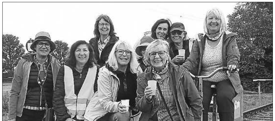
TCG-Damen auf der Fahrt mit der Draisinenbahn.