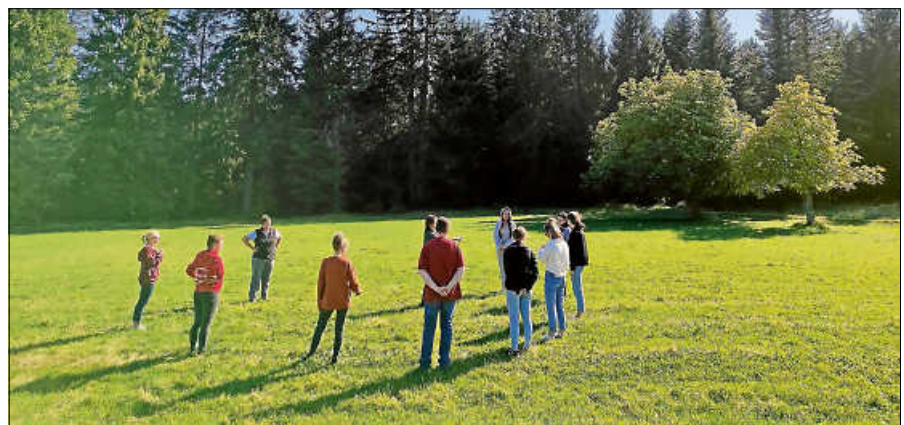
Viel Spaß hatten die Azubis beim Kennenlerntag auf dem Kaltenbronn.