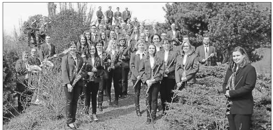
Die Musiker/innen des MV Orgelfels Reichental freuen sich auf ihr Publikum.

Am Freitag, 10. September lädt der Musikverein Orgelfels Reichental um 19 Uhr zum Kurkonzert in den Kurpark nach Gernsbach ein. Zum Neubeginn