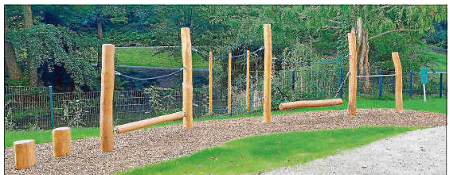
Der neue Holzparcours lädt zum Klettern und Balancieren ein.