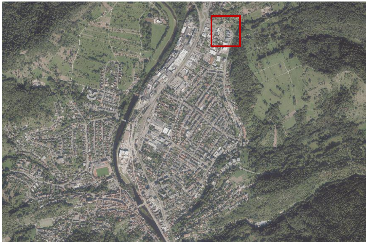
Luftbild (ohne Maßstab)