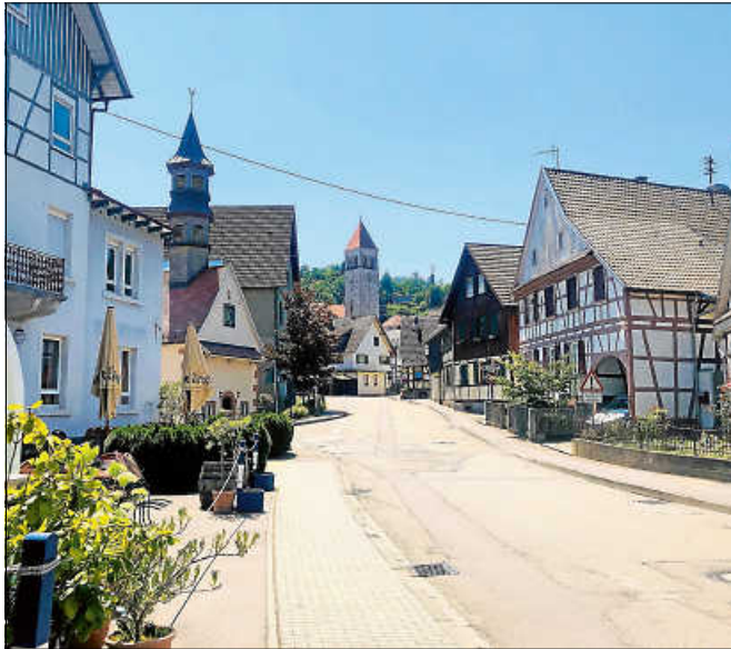
Historische Ortsbegehung in Obertsrot.

In diesem Jahr sind mehrere Akteure in Gernsbach eingebunden in den Tag des offenen Denkmals.