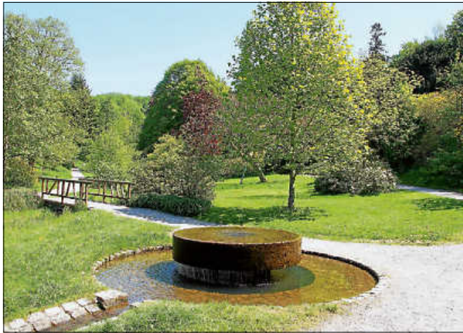
Der Gernsbacher Kurpark.