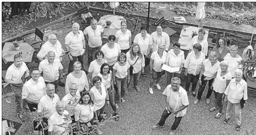
Chor „Salt o vocale“.

Rotenfels, Mühlstr. 20, zur Vorbereitung zahlreicher anstehender Highlights, sind bereits wieder in vollem Gange. Geplante Termine sind: Bewirtung der Gäste des Gernsbacher Altstadtfestes (WE 15. – 17. Sept.) im eigenen Zelt, Waldbachstraße / Ecke Ebersteingasse, mit original handgemachtem elsässischem Flammkuchen, dazu freitags und samstags ab 19.30 Uhr Unterhaltung mit Livemusik der Band We3 plus 2 sowie sonntags um 15 Uhr mit einem Auftritt des Chores. Darüber hinaus Auftritt von Salt o vocale beim Chorfestival Mittelbaden, Konzert „Stimmenzauber“ anlässlich „160 Jahre MSK“ am Sa., 30. Sept., 19 Uhr, Bürgerhaus Neuer Markt, Bühl. Schließlich am Sa., 4. Nov., 20 Uhr, als Höhepunkt des Vereinsjahres, Konzert „Street Party“ mit Chor, professioneller Band & Streetfood zum 22-jährigen Vereinsjubiläum, Jahnalle Gaggenu. Der Vorverkauf zu diesem musikalischen Abend der Extraklasse ist bereits in vollem Gange, Tickets sind online erhältlich. Weitere Infos dazu gibt es auf www.salt-o-vocale.de .