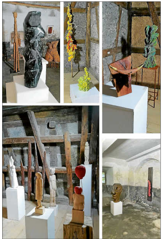
Kunstaussstellung in den Zehntscheuern.

Am Samstag, 9. September, gibt es noch einmal von 15 bis 18 Uhr die Gelegenheit, das besondere Ambiente und die zahlreichen Kunstwerke zu genießen und mit der anwesenden Künstlerin ins Gespräch zu kommen. Am Sonntag, 10. September, endet die Ausstellung mit einer Finissage um 17 Uhr, die musikalisch von Ulrike Eberle umrahmt wird. ■