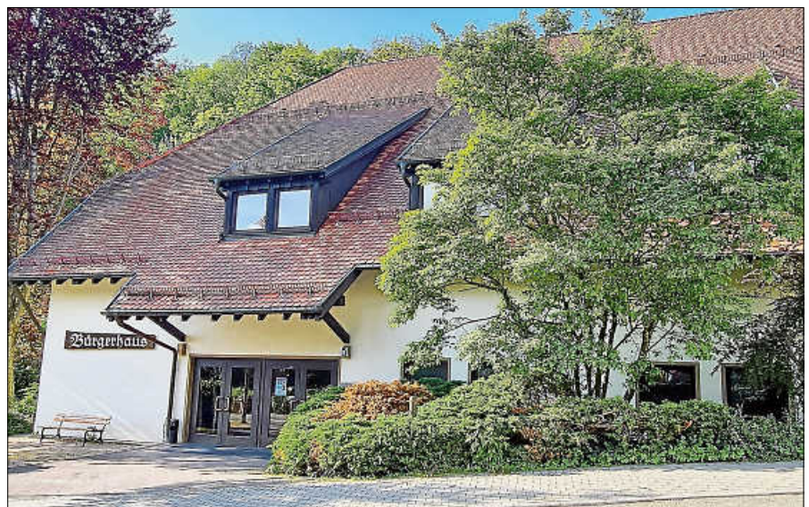
Das Bürgergespräch in Lautenbach findet im Bürgerhaus statt.

Der Auftakt fand bereits im April in der Kernstadt im Gasthaus Brüderlin statt, die letzte Veranstaltung in dieser Reihe steht in der Gernsbacher Nordstadt an. Sie findet am Dienstag, 26. September, um 18 Uhr im Restaurant Michelangelo statt. ■