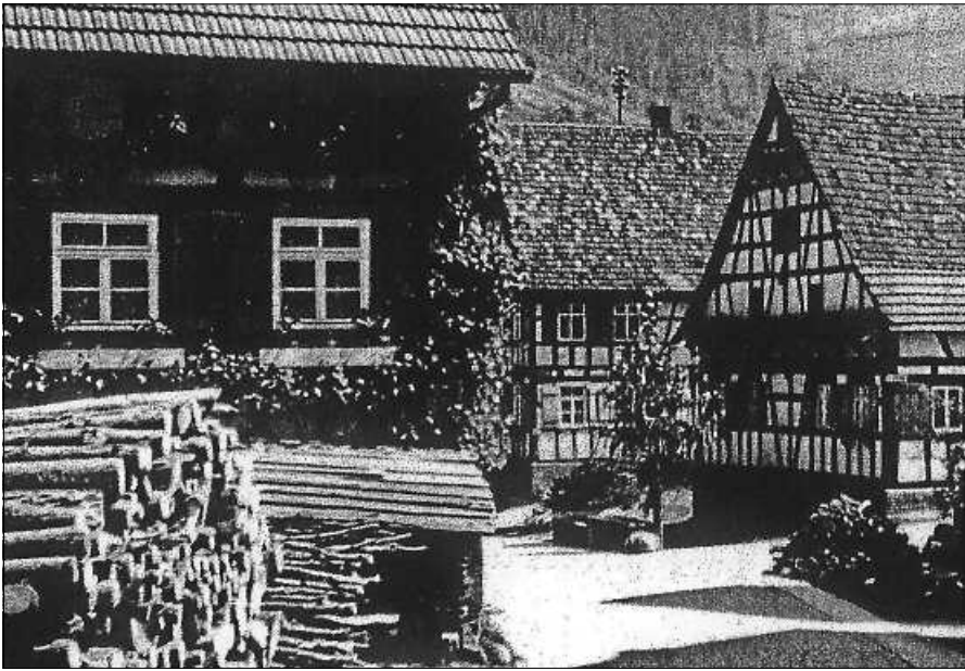
Kann man dieses Haus noch erkennen?