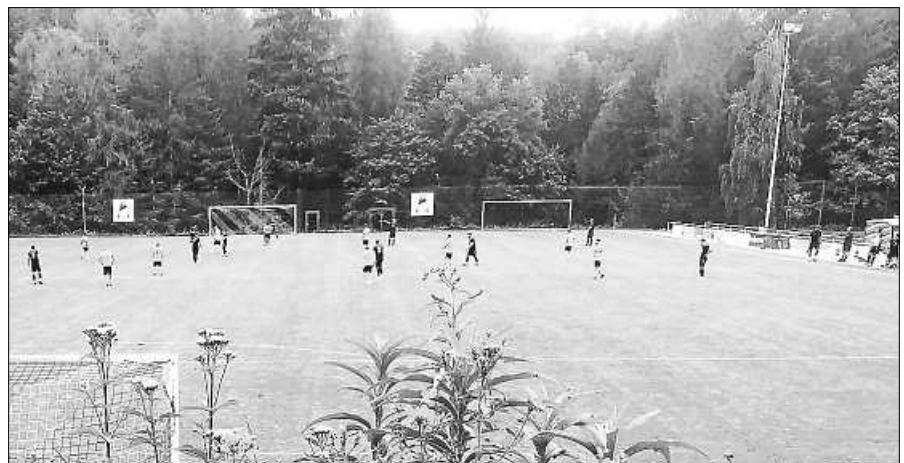
Das Heimspiel der SG SVS / FCG findet am Sonntag auf der Auwiese in Staufenberg statt.

„Wassergymnastik für Jung und Alt“ Die Wassergymnastik ist für Männer und Frauen jeden Alters geeignet. Das Element Wasser eignet sich hervorragend für ein schonendes und effektives Training. Durch den Auftrieb im Wasser werden die Gelenke entlastet, der Wasserwiderstand nimmt die Geschwindigkeit und hat zugleich eine verstärkende Wirkung für das Training. In diesem Kurs liegt der Schwerpunkt mit und ohne Geräte auf der Stärkung der Muskulatur und der Verbesserung der Ausdauer. Der Kurs beginnt am 25.09.2023 und findet 8 x montags, je 45 Minuten von 19:00 - 19:45 im Schwimmbad des Reha-Zentrums MediClin, Langer Weg 3 in Gernsbach, statt. Der Kurs kostet 50 € für SVS-Mitglieder und 70 € für Nichtmitglieder (Eintritt inklusive). Anmeldung und Infos bei Kathrin Schäfer, Tel. 0179 / 9020481 oder schaefer.kathrin@arcor.de