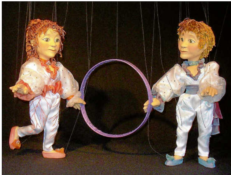
Hokusdipokus-Zauberei an Fäden.

Sonntag, 03. Dezember 2023, 15 Uhr: Der Wunderschlitten (Kumulus Figurentheater, Stuttgart)