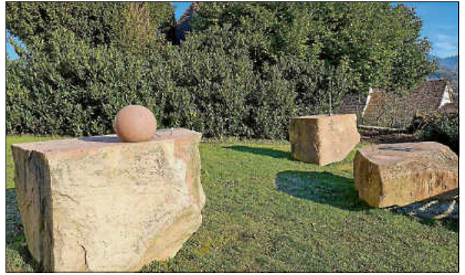
Sonnenuhren bei der Liebfrauenkirche.

Treffpunkt ist um 9.30 Uhr an der Südseite der katholischen Kirche (Liebfrauenkirche). Besucht werden auf der Route Katholische Kirche – Altes Rathaus – Evangelischer Friedhof acht Sonnenuhren an drei Standorten. Erläuterungen gibt es zu Geschichte und Entwicklung des ca. 6000 Jahre alten Kulturgutes „Sonnenuhr“ sowie über Zeitmessung und über die verschiedenen Systeme. Die Gernsbacher Sonnenuhren - derzeit 25 Exemplare in der Kernstadt - stellen einen Querschnitt der unterschiedlichen Arten dieses Uhren-Systems dar. Eine „Sonnenuhr zur Selbstbedienung“ macht sicherlich auch