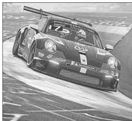
1. Sieg für Halder eSports

In ihrem ersten Rennen für das neu gegründete Halder eSports Team holten Luca Domko, AC-Eberstein und Niklas Hinneberg sensationell ihren 1. Sieg beim 7. Lauf zur Nürburgring Langstreckenmeisterschaft (NEC). Unter schwierigsten Wetterbedingungen, einem typischen Eifelwetter, sehr viel Nebel, niedrigen Temperaturen und rutschiger Strecke, erzielte Luca Domko, AC-Eberstein, auf einem Cup Porsche in der Qualifikation die Pole Position. Im Rennen selbst fuhr Luca gleich zu Beginn 3 Stints in Folge, da Niklas mit Netzwerkproblemen zu kämpfen hatte. Mit einer sehr kontrollierten und professionellen Fahrweise und Reifenmanagement konnte Luca den Vorsprung von Runde zu Runde, trotz fehlendem ABS und Traktionskontrolle, ausbauen.