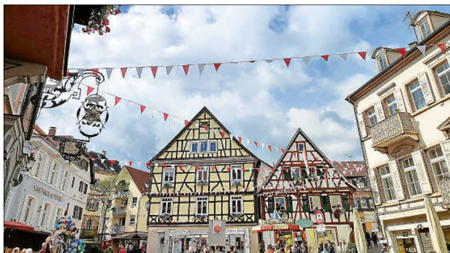
Im September lockt das Altstadtfest Gernsbach mit tollen Angeboten.

Die Stadtverwaltung bittet alle Anwohner der Amtsstraße und der Storrentorstraße, ihre Fahrzeuge bereits ab Donnerstag, 14. September, außerhalb des Festbereichs zu parken, ebenfalls wird gebeten, die Mülltonnen schon ab Donnerstag anderweitig unterzustellen. Die Gruppe ProHistory wird mit den Aufbauarbeiten für den Mittelaltermarkt am Freitag, 15. September, ab 6 Uhr beginnen. ■