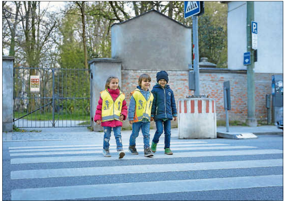
Die Sicherheit und die Selbständigkeit auf dem Schulweg sollten gefördert werden.

Der Verkehr vor Schulen und Kindergärten ist auch in Gernsbach zeitweise nicht unkritisch. Elterntaxis parken auf Gehwegen, blockieren Zufahrtswege und sorgen für ein erhöhtes Verkehrsaufkommen. Dadurch wird die Sicht für