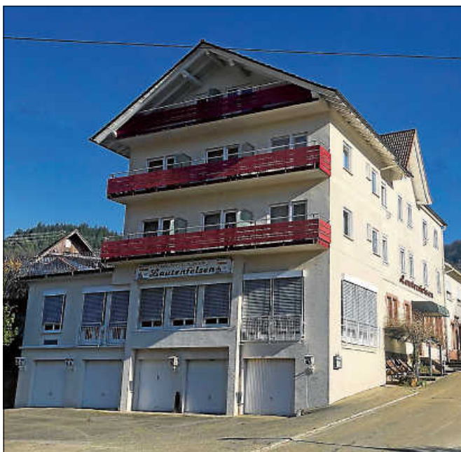
Neue Unterkunft für Geflüchtete in Lautenbach.