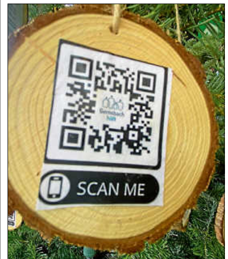
QR-Code für Spenden an „Gernsbach hilft“.