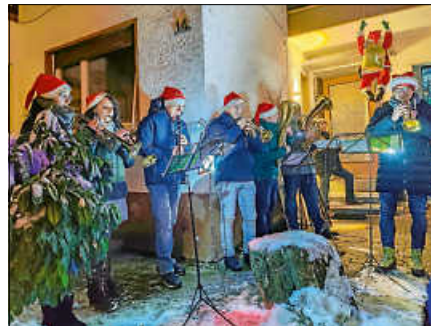
Blasmusikeinlage der „Schwellwog-Kapelle“ beim Glühweinschlotzen.

Am Freitag, 20. Dezember, ab 17.30 Uhr, lässt die Schwimmbadinitiative Lautenbach beim gemeinsamen Glühweinschlotzen das Jahr 2024 ausklingen. Es werden reichlich Glühwein & andere Getränke, Flammkuchen & Gegrilltes sowie die traditionelle Blasmusikeinlage der „Schwellwog-Kapelle“ angeboten. Das Glühweinschlotzen findet allerdings nicht im Schwimmbad, sondern in geselliger Runde im Hof der Lautenfelsenstr. 14 statt. Der Verein bedankt sich bereits im Vorfeld bei Monika Zorko, da sie den Abend möglich macht.