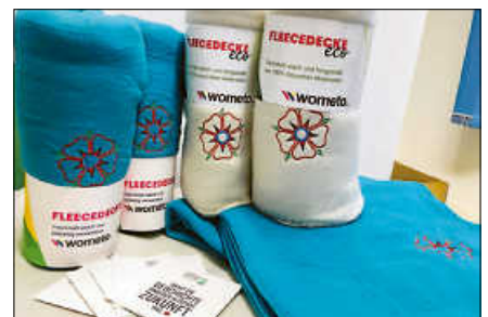
Die Decken gibt es in zwei unterschiedlichen Farben und Qualitäten.

Die Bürgerstiftung freut sich zudem jederzeit über Spenden, die direkt zur Förderung der Altstadt verwendet werden. Weitere Informationen finden Sie unter www.gernsbach.de/buergerstiftung . ■