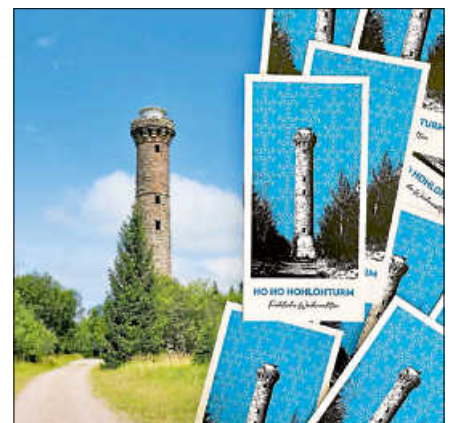
Postkarten zugunsten der Restaurierung des Hohlohturms.