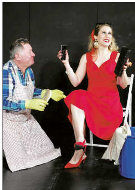
Das Tournee Theater Stuttgart präsentiert die Komödie Heisenberg.

Unterschiedlicher kann es nicht sein, das Paar, dessen ungewöhnliche (Liebes-) Geschichte auf einem Bahnhof beginnt, als ein Mann scheinbar zufällig auf den Nacken geküsst wird. Georgie (Anfang 40, quirlig, impulsiv, gesprächig, kontaktfreudig und trotzdem einsam) beginnt, das pedantisch geordnete Leben von Alex (Mitte 70, verschlossen und seit