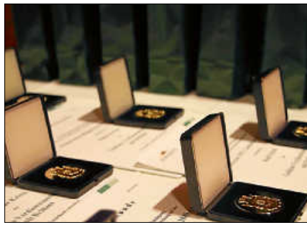
Städtische Verdienstmedaillen für besonderes ehrenamtliches Engagement.

Musikalisch umrahmt wird der Abend durch den Musikverein Hilpertsau. ■