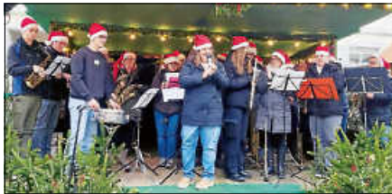
Der Musikverein Reichental beim Gernsbacher Weihnachtsmarkt.

Infos und die neuen Termine unter: www.musikverein-reichental.de .