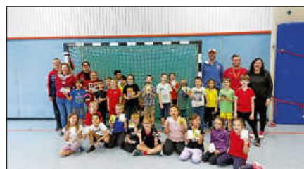
Grundschüler der Forbacher Grundschule beim Grundschulaktionstag mit den Handballern der Murgtal Panthers.

Die Handballer aus Forbach und Gausbach bedanken sich bei allen Kindern, die begeistert mitgemacht haben, sowie bei der Klingenbachschule Forbach für die langjährige Kooperation. Die Murgtal Panthers würden sich freuen, eventuell das Interesse am Handball bei einigen Grundschüler geweckt zu haben und diese bald im Training begrüßen zu dürfen.