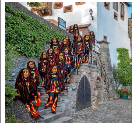
Die Obertsroter Schlossbergteufel feiern ihr 25. Jubiläum.

Am 11. Januar feiern die Schlossbergteufel Obertsrot ihr 25. jähriges Jubiläum mit der Teufelsnacht 3.0. Zu diesem Brauchtumsabend haben sich viele Fasnachtsgruppen angemeldet. Fünf Guggemusiken und ein DJ sorgen für die musikalische Vielfalt an diesem Abend. Zudem gibt es Show- und Brauchtumstänze. Auch die Schlossbergteufel selbst sind mit einem Tanz am Start. In der Obertsroter Ebersteinhalle wird ein illuminiertes Indoor-Narrendorf aufgebaut, welches mit verschiedenen Getränken ausgestattet ist, wie z.B. einer Likörbar und Teufelsbar. Auch das Essensangebot kommt an diesem Abend nicht zu kurz. Ein Partypass oder U 18 Formular ist nicht zugelassen. Die Veranstaltung bei freiem Eintritt ist ab 16 Jahren und beginnt ab 19.11 Uhr.