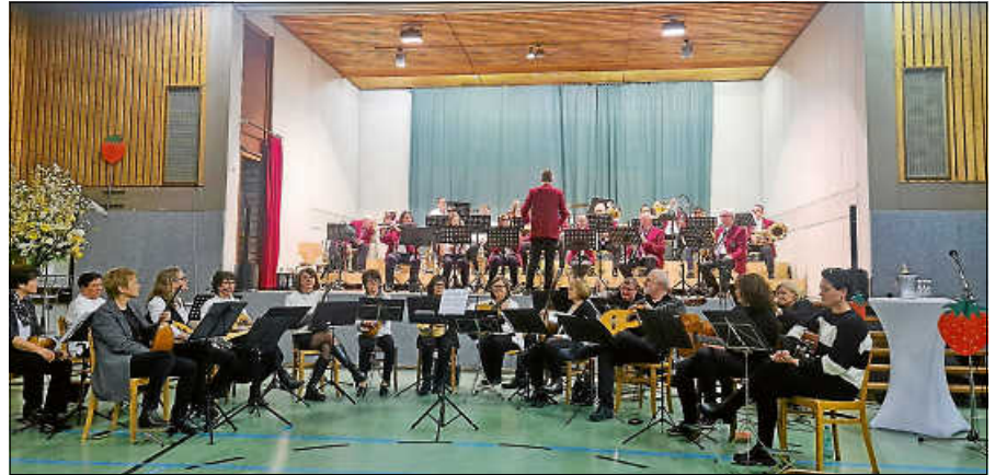
Für die musikalische Unterhaltung sorgen beim Neujahrskonzert neben dem Musikverein (hinten) und dem Mandolinorchester (vorne) auch der Cantiamo-Chor.

Alle Bürgerinnen und Bürger sind hierzu herzlich eingeladen. ■