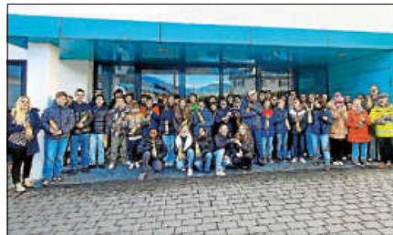
Die Siebtklässler freuten sich über eine Flasche Apfelsaft aus den selbst geernteten Äpfeln.