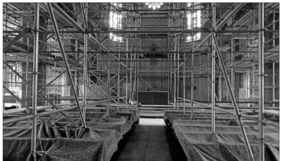
Ein imposantes Gerüst beherrscht derzeit das Innere der Liebfrauenkirche.

Über den Baufortschritt werden Fotos auf Schautafeln auf der Pfarrwiese informieren. Für die Besichtigung gelten die aktuellen Corona-Regeln. Ein Ordner-Team wird für ausreichend Abstand sorgen und den Zugang in nur eine Richtung durch den Mittelgang lenken. Mit Wartezeiten muss gerechnet werden. Ein Mund-Nasen-Schutz wird empfohlen.