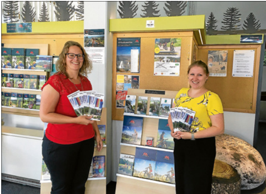
Der neue Flyer ist da!

Der Flyer ist auch als Download erhältlich unter www.gernsbach.de . ■