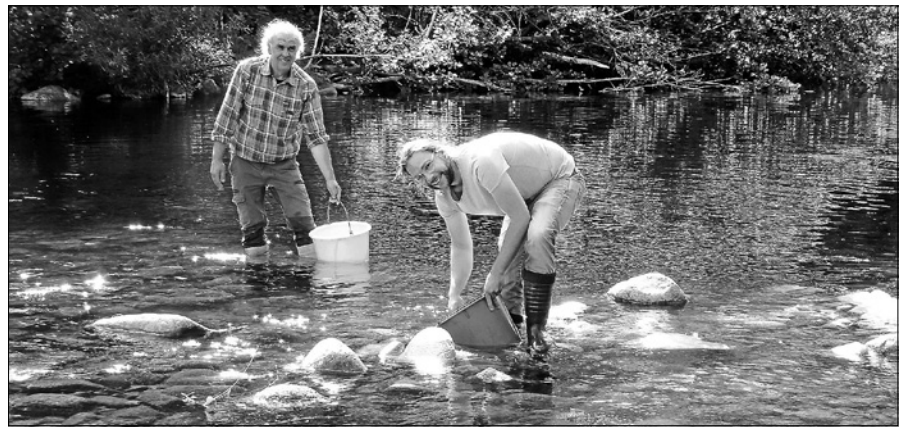
Quappenbesatz am Hahnbacheinlauf

Die Vorstandschaft bedauert, mitteilen zu müssen, dass die geplanten Veranstaltungen anlässlich des 100-jährigen Vereinsjubiläums am 18. und 19. Juli abgesagt werden. Dies erfolgt in Abstimmung mit den Verantwortlichen des Turngaus Mittelbaden-Murgtal auch für die Ausrichtung der Gauveranstaltung „It's Showtime“. Großveranstaltungen sind wegen der Corona-Pandemie bis 31. August nicht gestattet und die derzeit bekannten Auflagen und Hygienevorschriften haben uns schweren Herzens zu dieser Entscheidung bewegt. Ein Ersatztermin steht noch nicht fest.