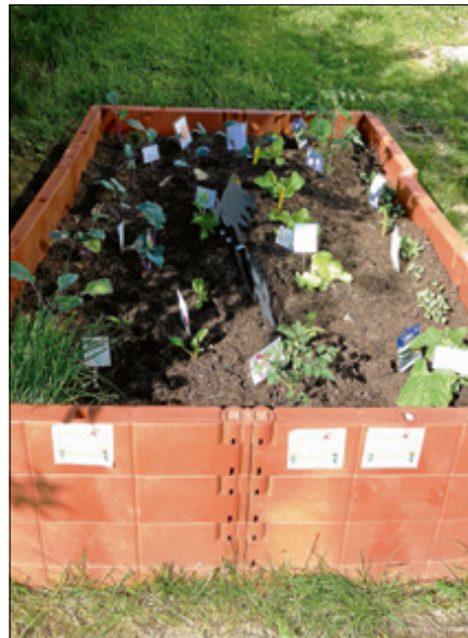
Das frisch angepflanzte Beet.

Das Einpflanzen und Säen übernahmen die Kinder der zwei bestehenden Notgruppen. Jeweils getrennt buddelten sie Löcher für die Setzlinge wie Kohlrabi, Salat, Rote Beete und Gurke. Die Kinderhauskinder freuten sich gerade in diesen Zeiten sehr auf das Bepflanzen des Beetes, welches doch schon ein Stück Tradition geworden ist. Durch die Unterstützung unseres Edeka Paten Herrn Huck aus Hörden war diese Aktion erst möglich. ■