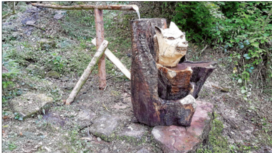
Mit dem Brunnen „Wolfskopf“ ist der „Brünnelesweg“ um eine Attraktion reicher.

2018 nahm Aaron Klumpp mit einer Gruppe aus dem Kreis der Bauwagenjugend - darunter mit Robin Grimm auch ein Enkel des ursprünglichen Initiators Felix Grimm - die Idee der Brunnener-