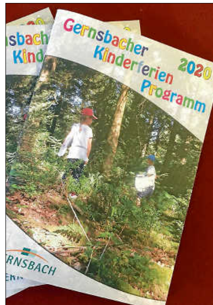
Das Kinderferienprogramm 2020.

Die Veranstaltung findet bei jedem Wetter statt und auch für Snacks und Getränke ist gesorgt.