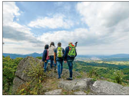
Wanderer am Lautenfelsen.

Diese Wanderung führt auf einen der schönsten Aussichtspunkte in Gernsbach, den Lautenfelsen. Die Tour beginnt beim Stadtbahn-Haltepunkt Gernsbach Mitte und verläuft zunächst entlang des Felsenweges in den Gernsbacher Kurpark. Vorbei am unteren Kurparksee sowie dem Rosarium und durch den hinteren Kurpark geht es weiter hinauf in das Igelbachtal. Hinter dem Igelbachbad hält man sich beim Standort Igelbachtal rechts in Richtung Käferplatte. Von nun an verlässt man das sonnendurchflutete Tal und wandert durch den Wald hinauf zum Fechtenbuckel bis zur Hardtberghütte. Die Route führt nun auf dem Höhenrücken zur Illertkapelle oberhalb Lautenbachs. Zwischendurch kann man schon einen Blick auf den Lautenfelsen werfen, der sich geradezu majestätisch über dem kleinsten Ortsteil von Gernsbach erhebt. Bei der Illertkapelle, dem ersten Etappenziel, begibt man sich für einige Zeit auf den Premiumwanderweg Gerns-