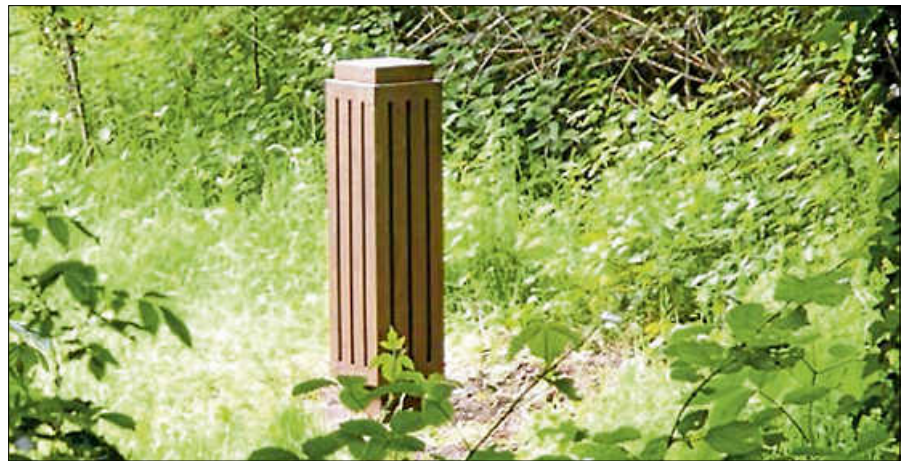
Robert Schad DONN 1991 Vierkantstahl massiv 60 mm 146 x 28 x 28 cm.

In seinen Arbeiten interessieren den Künstler Linien. Sie sind Metapher für Bewegung, Energie und Zeit und halten