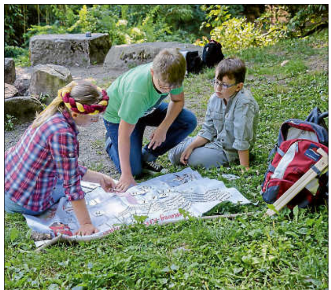
Gemeinsames Rätsellösen auf dem Sagenweg.

Der Sagenweg verläuft mit einer Länge von ca. 6 km auf überwiegend natürlichem Untergrund. Charakteristisch sind die vielen schmalen, teilweise schon alpinen Pfade, die die Stationen miteinander verbinden. Der Weg ist nicht für Kinderwagen oder Rollstuhlfahrer geeignet. ■