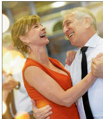
Ein Paar tanzt voller Anmut und Freude.