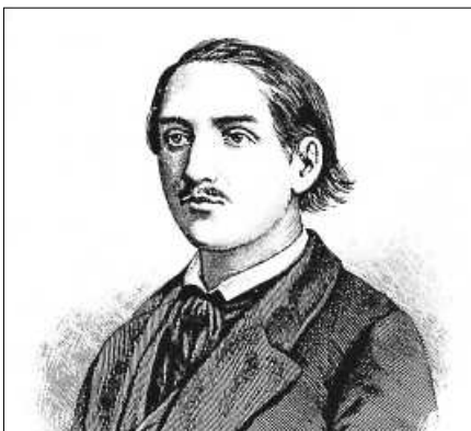
Max Dortu in einer zeitgenössischen Darstellung.

Eine Anmeldung ist nicht erforderlich. Der Eintritt ist frei. ■