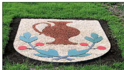
Das Staufener Dorfwappen.

Das Handwerkermuseum ist an beiden Festtagen von 12 bis 17 Uhr für Besichtigungen geöffnet. ■