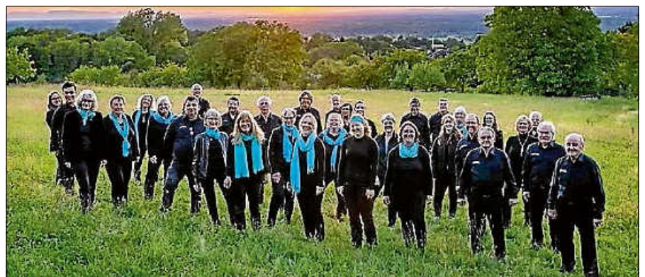
Der Chor WINDIAMO aus Sinzheim/Winden tritt in Gernsbach auf.

Das Konzert findet bei schönem Wetter im Innenhof der Cafeteria – bei Regen im Innenbereich statt. Der Eintritt ist frei, Geldspenden sind willkommen. ■