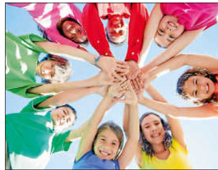
Die Broschüre zum Ferienprogramm 2024 liegt vor.

Wie in den vergangenen Jahren erhält die Stadt auch in diesem Jahr wieder Unterstützung von vielen Vereinen, Institutionen, Firmen und engagierten Privatpersonen mit einem oder mehreren Aktionen, sodass sich eine bunte Palette an spannenden und abwechslungsreichen Veranstaltungen im Ferienprogramm finden.