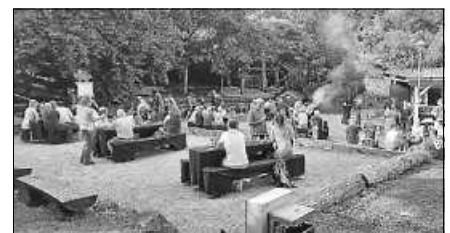
Feierabendgrillen auf dem Dorfplatz.

Am Freitag, 31. Mai bleibt die Küche kalt, denn ab 18 Uhr findet das beliebte Feierabendgrillen auf dem Staufenberger Dorfplatz statt. Das Cateringteam vom Treffpunkt Staufenberg hat neben den Klassikern Wurst und/oder Steak im Weck auch ein vegetarisches Angebot auf der Karte. Und da sich im Jubiläumsjahr von Staufenberg fast alles um die Erdbeere dreht, wird an diesem Abend auch eine köstliche Erdbeerbowle angeboten.