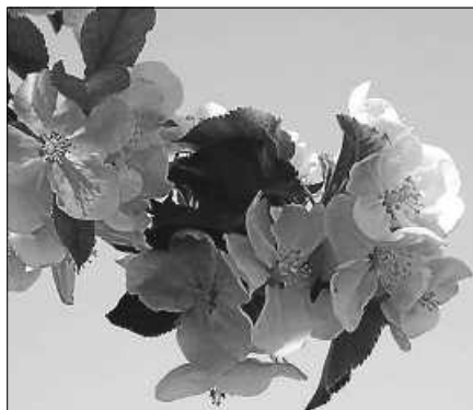
Der OGV Gernsbach lädt zur Hockete in der Weinau.

auch auf erfrischenden Most freuen. Der Verein freut sich auf viele Besucher.