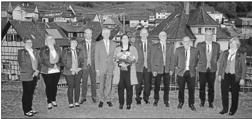
Ehrungen verdienter Mitglieder.