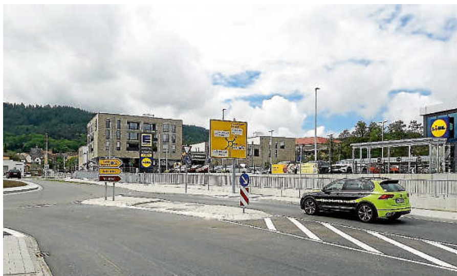
Der Kreisverkehr am Bahnhof wurde für den Verkehr freigegeben.