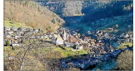
Blick auf Reichental.

Eine Anmeldung bei der Touristinfo Gernsbach ist erforderlich, Telefon 07224 644446. ■