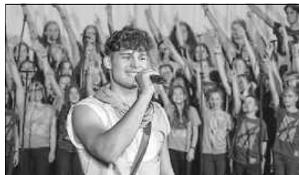
Petrus der Apostel.

Der Eintritt ist frei, freiwillige Spenden zur Kostendeckung sind willkommen.