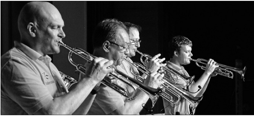
Mitglieder der Schlossbergmusikanten.