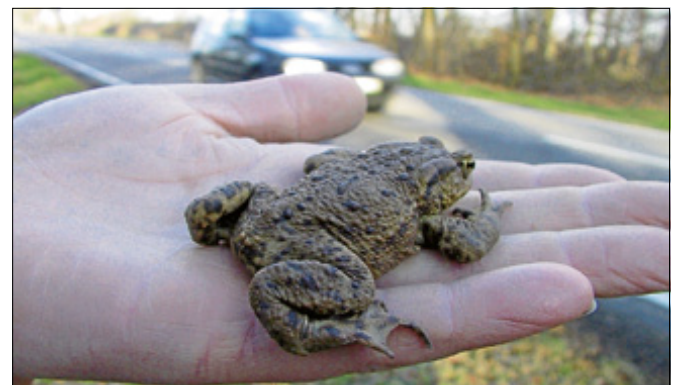
Eine gerettete Kröte.