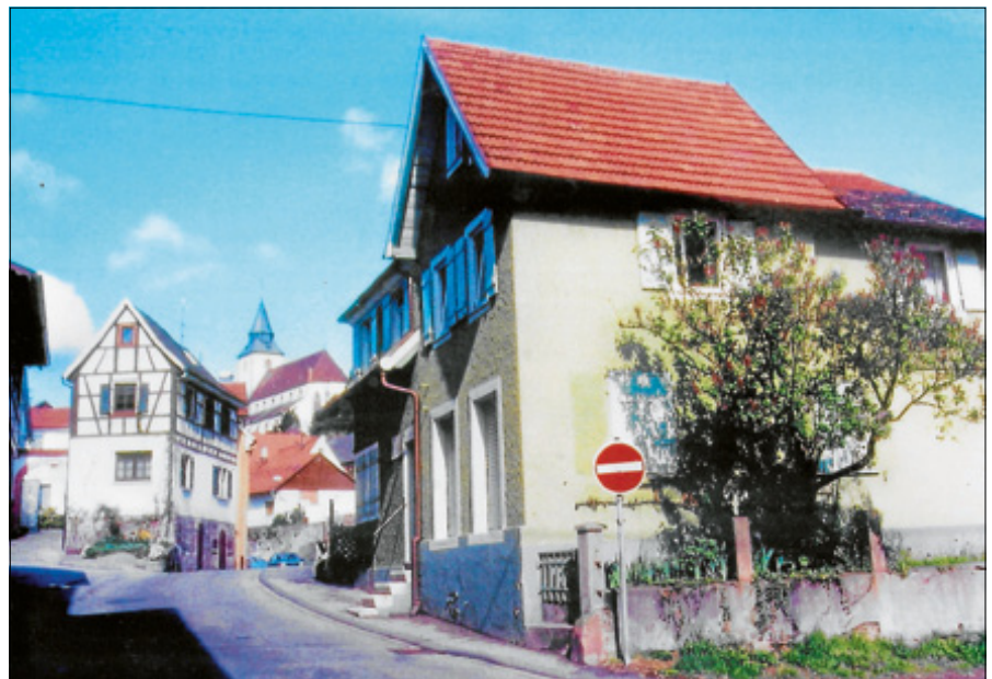
Alte Aufnahmen zeigen Gernsbach von einer anderen Seite.

Untermalt mit vielen Fotos werden längst vergessene Straßenzüge wieder sichtbar und die gewaltigen baulichen Veränderungen deutlich gemacht. In dem Vortrag werden auch einige Persönlichkeiten, die diese Zeit geprägt haben, auf der Leinwand präsentiert. In Text, Bild und Ton wird dieses ereignisreiche Jahrzehnt, sowie seine Kultur, der Alltag und das Lebensgefühl der Men-