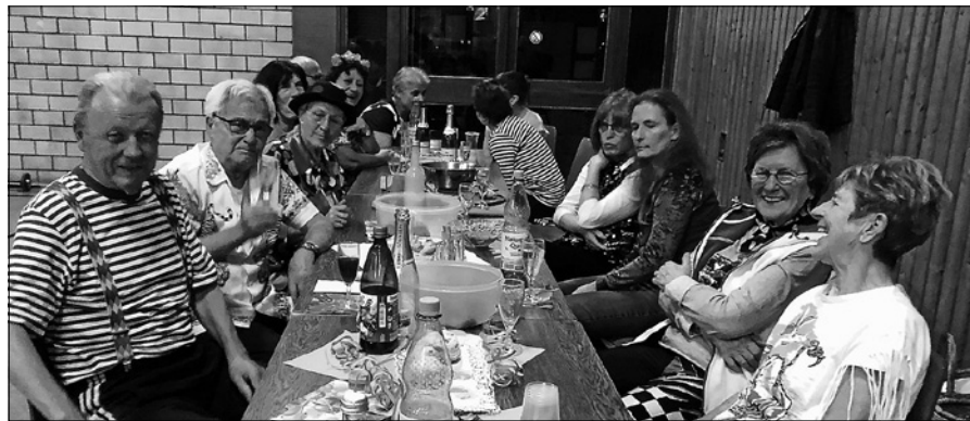
Närrische Gymnastikstunde beim SVS.