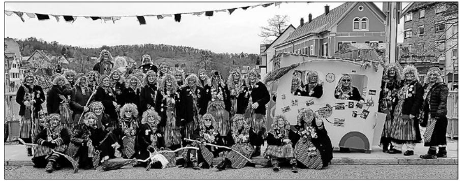
Am Morgen des Schmutzigen Donnerstags treffen sich die Bleichhexen traditionell auf der Stadtbrücke.

„Leute, mir fahrn mim Bus“, tönte es am Schmutzigen Donnerstag überall dort, wo die Bleichhexen auftauchten. Mit