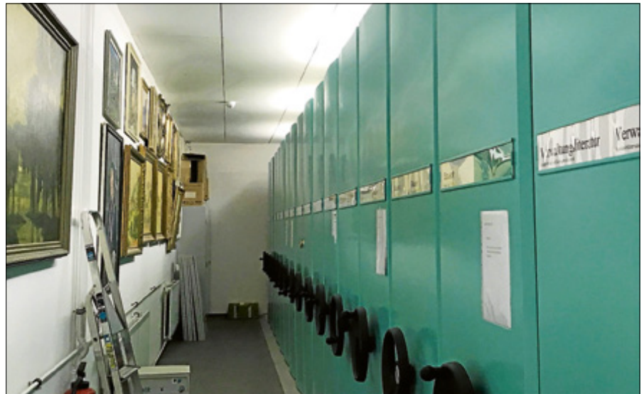
Das Stadtarchiv ist das Gedächtnis für die Gernsbacher Stadtgeschichte.

Mit der Beteiligung am Archivtag möchte das Stadtarchiv Gernsbach über seine Arbeit informieren und zugleich