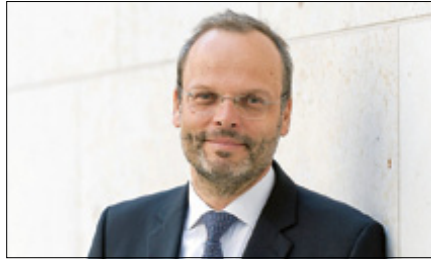
Dr. Felix Klein, Antisemitismusbeauftragter, zu Gast in Gernsbach.

Der Antisemitismusbeauftragte der Bundesregierung hatte im Rahmen der 800-Jahr-Feier bereits im November nach Gernsbach kommen wollen. Aufgrund des Anschlags auf die Synagoge in Halle und einer deswegen angesetzten Sondersitzung des Bundestagsinnenausschusses musste er den Besuch damals kurzfristig verschieben. Nun holt er den Termin nach. Das Thema seines Vortrags lautet „Antisemitismus in Deutschland – und was wir dagegen tun können“. Dr. Klein beleuchtet in ihm Mechanismen und Ausdrucksformen der Judenfeindlichkeit, und er zeigt auf, was jeder einzelne gegen antisemitische Einstel-