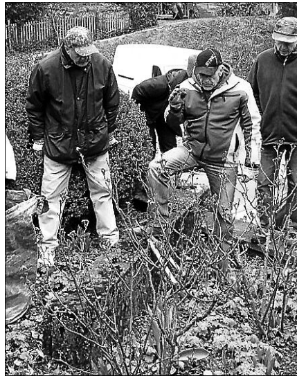
Rosenschnittkurs am 7. März.

Der Obst- und Gartenbauverein Gernsbach e.V. veranstaltet dieses Jahr am