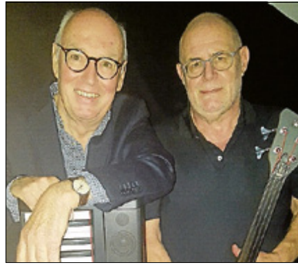
Die South Side Boys.

Ob es sich dabei um Fats Domino mit ‚Blueberry Hill‘ oder Sam Cook mit seinem ‚Bring it on home‘ handelt – es klingt, als wären alle die großen Blueshouser wieder auferstanden und quicklebendig. So wie auch die Beatles mit