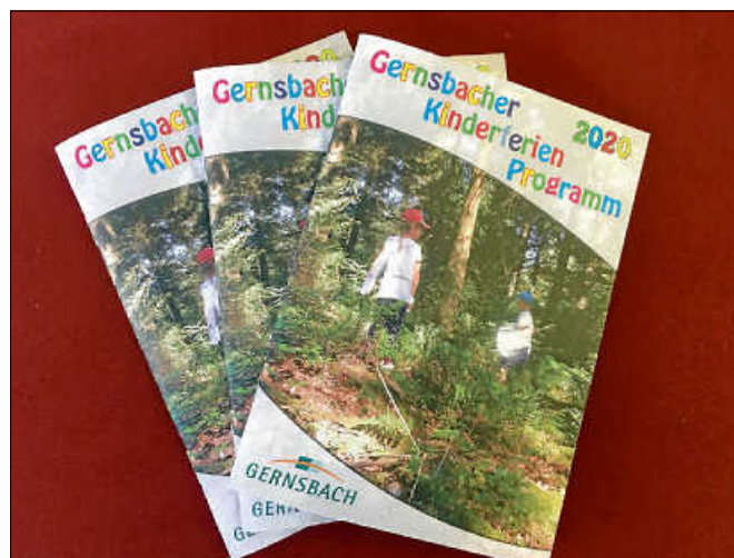
Das Gernsbacher Kinderferienprogramm.