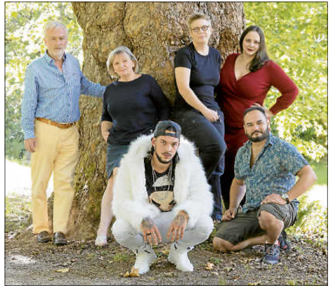
Gruppenfoto der Künstler.

Die Tage des Offenen Fensters - Kunst in Gernsbach 2020 finden an den Wochenenden vom 8. bis 30. August jeweils