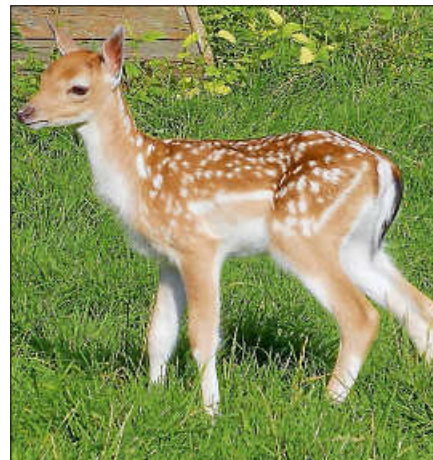
Besonders Jungtiere gilt es zu schützen.