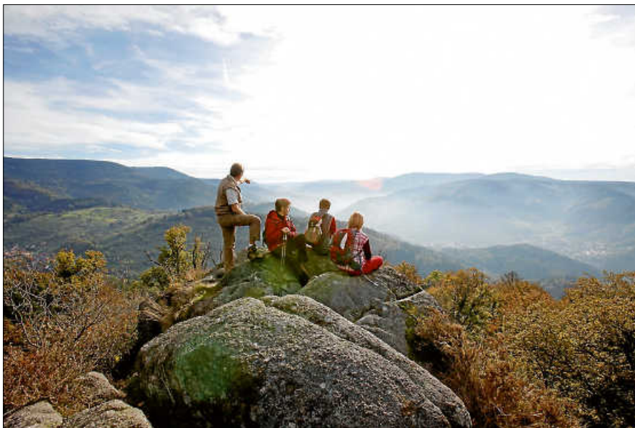
Wanderer auf dem Dachsstein.

Von der Steintalstraße aus durchquert man den Ort in Richtung Alte Kirche und Bürgerhaus, um schließlich auf der gegenüberliegenden Talseite bergauf den letzten Anstieg bis zum Wegkreuz Haiderain zu erklimmen. Nun befindet man sich auf der Alten Weinstraße, der man bis zum Fechtenbuckel folgt. Von hier aus geht es der Beschilderung nach zur Käferplatte und weiter ins Igelbachtal hinab, dem man dann in Richtung Gernsbach folgt. Vorbei am solarbeheizten Igelbachbad und dem schönen Kurpark erreicht man über den Felsenweg schließlich das Tagesziel, den Stadtbahn-Haltepunkt Gernsbach Mitte, von dem aus der Bahnhof fußläufig und der Startpunkt in Hilpertsau bequem per Stadtbahn zu erreichen ist.