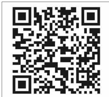
Trailer zum Nehemia-Film

Das bereits seit längerem feststehen- de Motto „Freut euch immer“ könnte angesichts der aktuellen Krise kaum passender sein. Anhand von Vorträ- gen, Interviews, Videos und Filmen soll