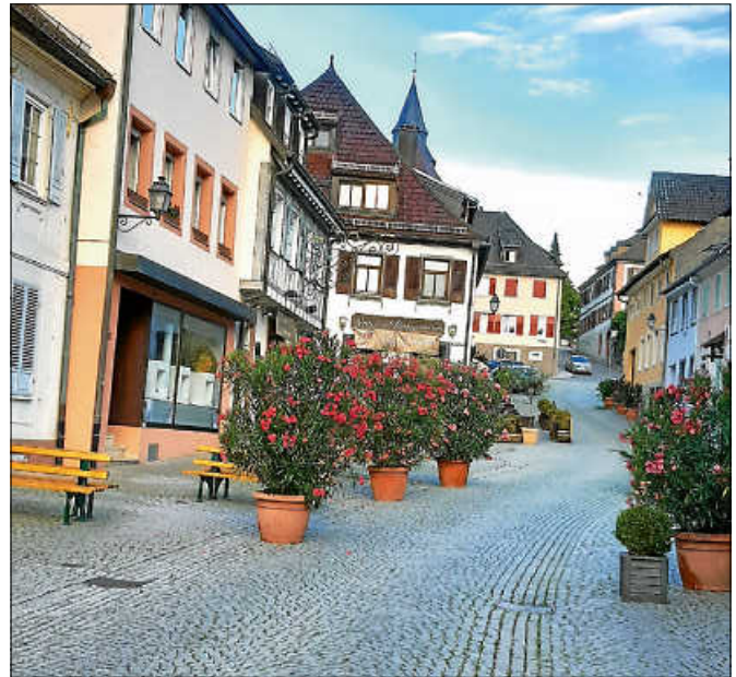
Bänke und Bepflanzungen laden zum Verweilen ein.

„Sie geben den (Farb)Ton an. Es kommt jetzt auch auf die ansässigen Gewerbetreibenden, Gastronomen, Künstlerinnen und Künstler sowie auf die Anwohnerinnen und Anwohner an, mit Hilfe von Leuchtmitteln und vielen weiteren Ideen zusätzlich die Atmosphäre schön zu gestalten. Alle sind