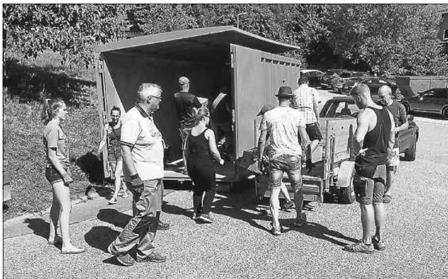
Guten Mutes und mit viel Enthusiasmus ging man bei gefühlten 45 °C an die Arbeit und konnte sich am Ende über eine gute „Ernte“ freuen.

Fahrzeuge und schleppten in kurzer Zeit so viel Papier heran, dass ein zweiter Container bestellt werden musste. Auf die Firma Schumacher war Verlass und so stand um 18:00 Uhr auf dem alten Messplatz am Ortseingang ein Zweiter zur Befüllung zur Verfügung. Denn der Platz vor dem Bürgerhaus war durch die Badbesucher unseres tollen Freibads „mit Herz“ besetzt.