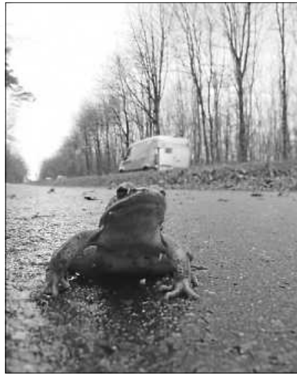
Springfrosch vor Auto.