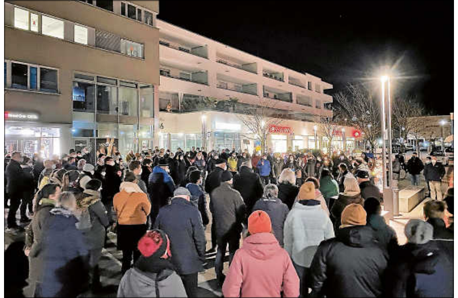
Mahnwache 2022: Gernsbacher Bürger:innen auf dem Salmenplatz.