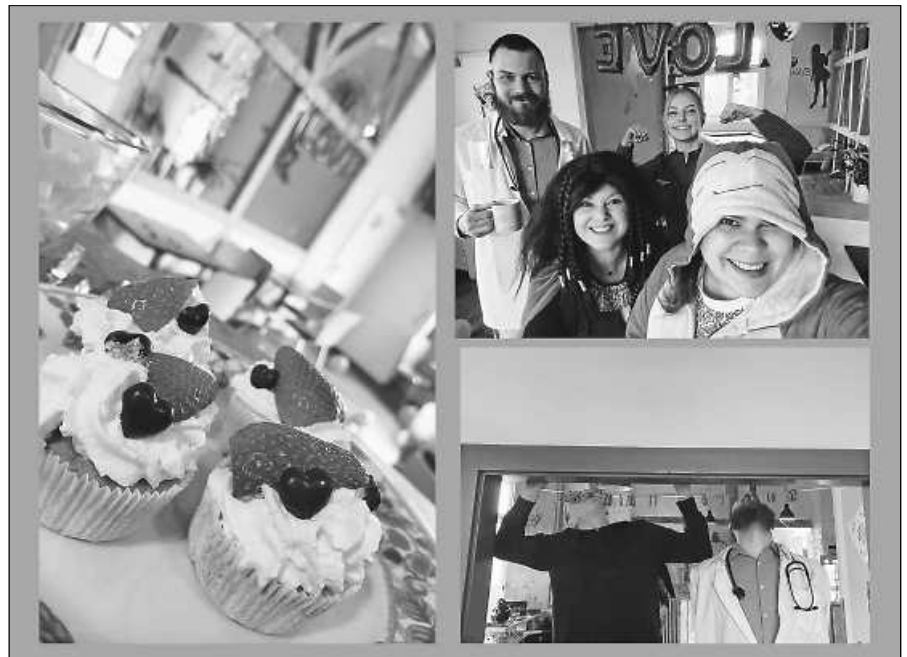
Fastnachtsparty am Valentinstag.

Freitag/ BurgerTag: Für 2,50 € gibt es bei uns große leckere Burger.