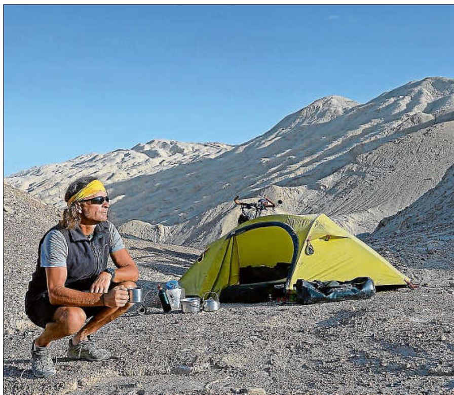
Lager am Morgen in Westchina.

Infos auch unter: www.thomasmeixner.de ■