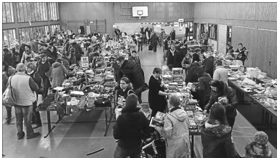
Schnäppchenjagd beim KidsBazar.

Der Förderverein Schwimmbad Reichenal führt am Samstag, 25. Februar seine diesjährige Altpapiersammlung durch. Wir bitten, das Altpapier nach Möglichkeit ab 8.30 Uhr gebündelt bereitzustellen. Helfer sind herzlich willkommen.