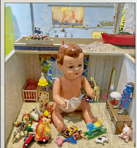
Die begleitende Ausstellung in einem Puppenhaus.

Gewächshauses und entdecken allerlei Miniaturen, Spielzeug, kleine Puppenstuben ... absurde Ideen werden zu einem anarchischen Kunstwerk). Weiter geht es im großen Saal der Stadthalle, in dem eine tschechische Produktion spielt, die bereits auf unzähligen Festivals im europäischen Ausland zu sehen war: Das Theater