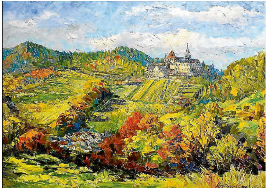
Blick auf Schloss Eberstein.

Sie gehört nach eigenem Bekunden zu den Künstlern, die ihre Emotionen in einer möglichst kurzen Zeit herauslassen wollen, ohne etwas zu versäumen. Im Pleinair verwickelt sie sich oft in ein Wettrennen mit der Natur. Die Arbeit ist emotional und schnell, weil sie nicht mit dem Kopf, sondern mit dem Herzen malt. Pleinair gibt ihr mehr Freiheit und die Bilder werden dadurch anders, lebendiger. Sie hat es sich zur Aufgabe gemacht, die ständige Veränderung der Farbtöne und des Lichts zu verschiedenen Tageszeiten und bei unterschiedlichen Wetterbedingungen festzuhalten. Im Schwarzwald-Pleinair hat sie sich für selbst neu wiederentdeckt. Über die