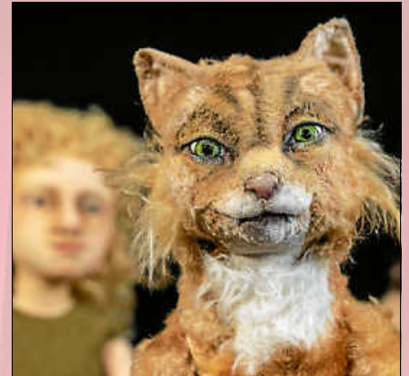
„Die Katze, die tut, was sie will“