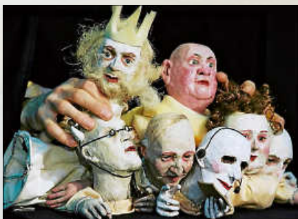
„Kasper tot. Schluss mit lustig.“