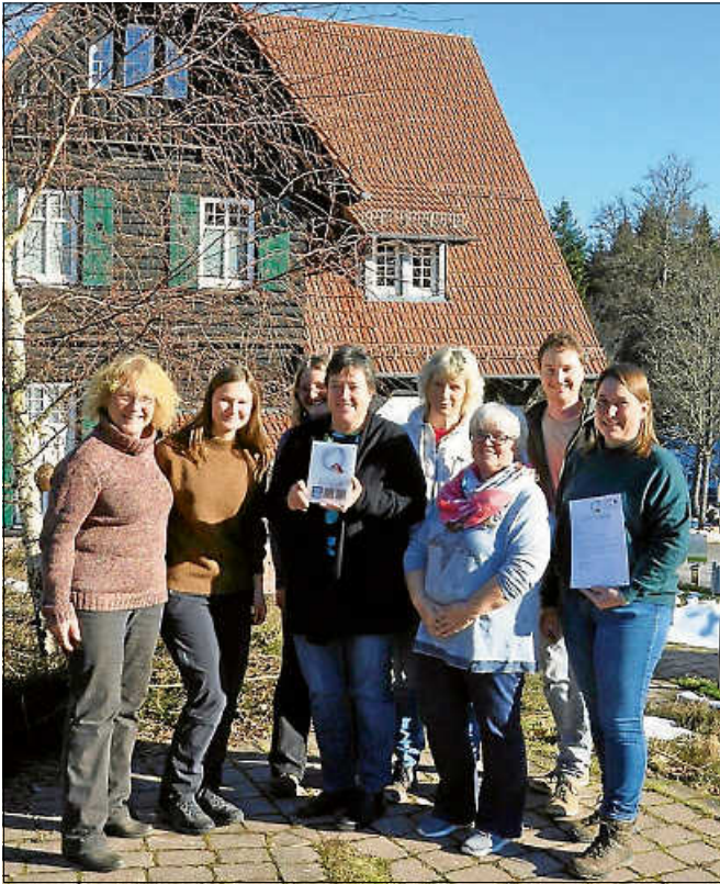
Das Team vom Infozentrum Kaltenbronn.