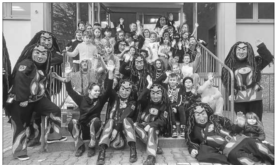
Die Obertsroter Schlossbergteufel und Kinder der Naturparkschule Gernsbach am Faschingsfreitag.

Die Obertsroter Schlossbergteufel hatten ihr Kommen angekündigt. Als sie endlich da waren, verflieg bei einer Polonaise durch das Schulhaus auch das letzte bisschen Angst, dass der eine oder andere vielleicht noch gehabt hatte. Auf dem Schulhof wurde mit den Faschingsliedern ‚Hubschrauber 117‘ und ‚Da steht ein Pferd auf dem Flur‘ weiter gefeiert und getanzt. Als dann noch Schokoküsse verteilt und Kamellen geschmissen wurden, stieg die Stimmung immer mehr. Mit dem Versprechen, das nächste Jahr wieder zu kommen, verließen die Schlossbergteufel eine ausgelassene und glückliche Kinderschar. ■