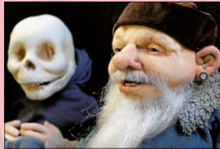
„Grand Hotel Grimm“.

Und zum großen Finale spielt am Samstag, 01. April 2023 das Theater auf der Zitadelle ihren bereits fünften Teil der Berliner Stadtmusikanten: „Grand Hotel Grimm!“