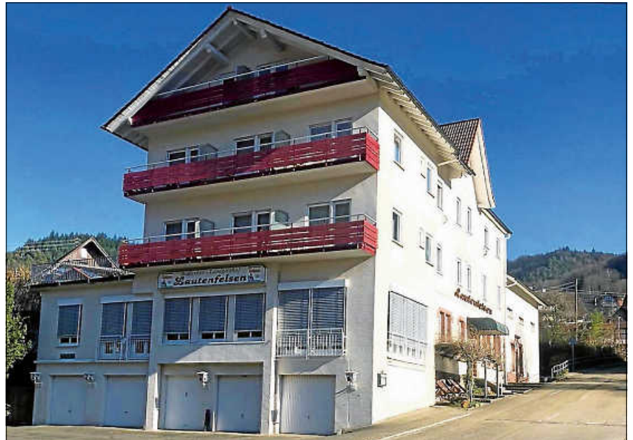
Das ehemalige ‚Hotel Lautenfelsen‘ wird zur Unterkunft für Geflüchtete.

Angesichts der sehr starken Flüchtlingsbewegung von bis zu 180 Flüchtlingen alleine in diesem Jahr reicht die bisherige Strategie, Geflüchtete in angemieteten Privatwohnungen unterzubringen, nicht aus. Daher setzt die Stadt auf die Schaffung weiteren Wohnraums: So sollen geeignete Bestandsimmobilien der Stadt, wie beispielsweise das alte Postgebäude in der Bleichstraße,