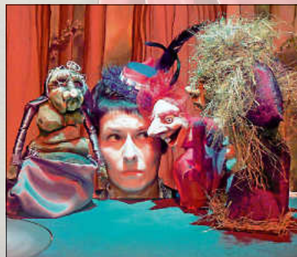
„Die kleine Hexe“.

Der Kinderbuch-Klassiker „Die kleine Hexe“ findet mit Sabine Mittelhammer