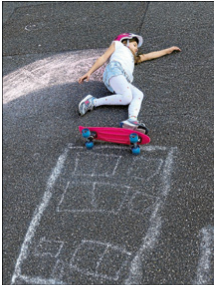
Skaten auf dem Dach

Viele Familien stehen während der Corona Pandemie vor besonderen Herausforderungen: Ob es um die eigenen Job-Sorgen geht, Kinderbetreuung oder Hausaufgabenhilfe.