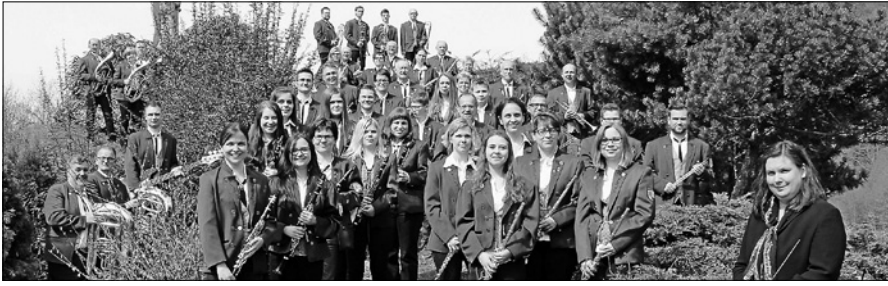
Das Muttertagskonzert des MV „Orgelfels“ Reichental wird auf unbestimmte Zeit verschoben

sollten nun bereits auf Hochtouren laufen. Leider hat das Coronavirus und seine Auswirkungen auch uns erreicht. Gemäß der Landesverordnung mussten wir den Probebetrieb auf unbestimmte Zeit aussetzen. Deshalb kann das Muttertagskonzert zum eigentlichen Termin nicht stattfinden. Sobald wir mit den Proben wieder beginnen können, planen wir einen neuen Termin für das schon zur Tradition gewordene Muttertagskonzert. Zeitnah wird es dann auch den Kartenvorverkauf durch unsere Musikerinnen und Musiker geben. Wir wünschen unseren Ehrenmitgliedern, Mitgliedern und Freunde des Vereins alles Gute.