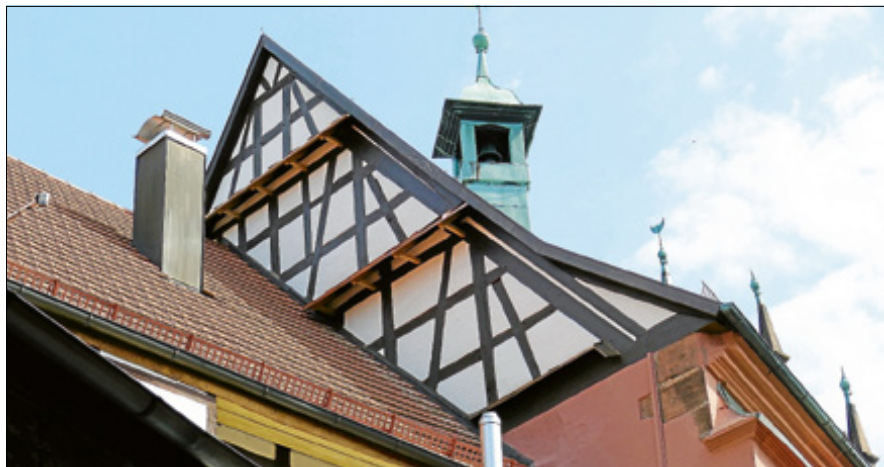
Der Giebel des Alten Rathauses nach der Sanierung.

Um die im Vorfeld bearbeitete Fachwerkwand einzusetzen, wurde im Januar eine komplette Wand in Richtung Hauptstraße herausgenommen, die