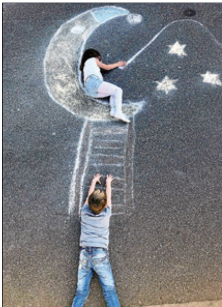
Leiter zum Mond

Da kommen kreative Ideen gerade richtig und bieten Abwechslung im Alltag! Aus diesem Grund bietet die Schulsozialarbeiterin Patricia Mizera unter der Trägerschaft des Ev. Mädchenheimes Gernsbach e.V. kreative