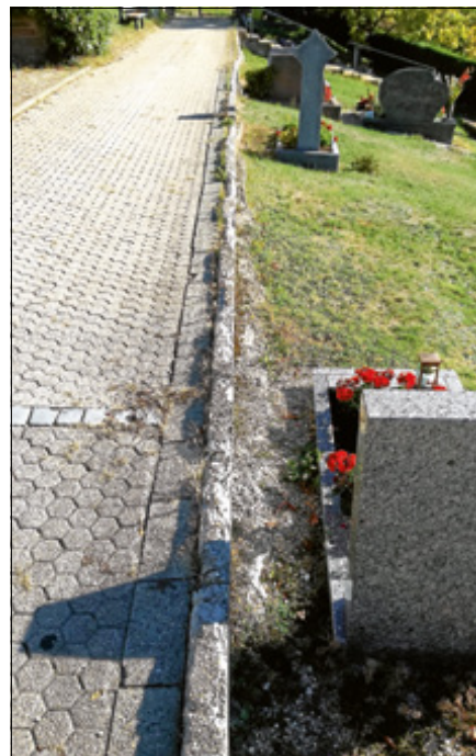
Auf dem Friedhof Lautenbach stehen dringende Sanierungsmaßnahmen an.

Die Baumaßnahmen werden voraussichtlich bis Ende Juni abgeschlossen sein. Während der Bauzeit ist der Zugang zum Friedhof nur über den Fußweg vom Parkplatz aus möglich. Für die in diesen Zeitraum fallenden Bestattungen wird die Baustelle geräumt und eine provisorische Zufahrt ermöglicht. Mit der Ausführung der Arbeiten wurde Firma König Gartengestaltung aus Lichtenau beauftragt. Die Auftragssumme beläuft sich auf 146.215,78 €. ■