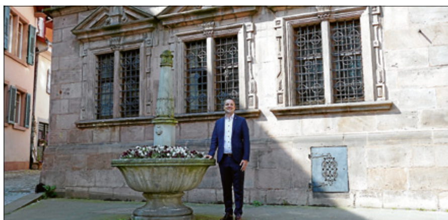
Bürgermeister Christ freut sich auf den Start in den Altstadtprozess.

Bitte beachten Sie, dass 96 Stunden vor Beginn der jeweiligen Maßnahme im benötigten Aufstellbereich ein Halteverbot eingerichtet wird.