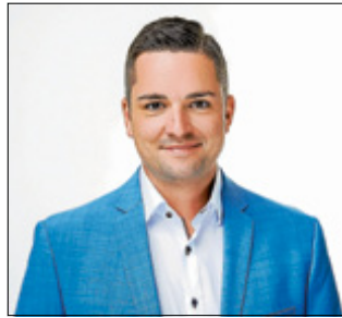
Bürgermeister Christ

N achdem auf Bundesebene die Diskussion über mögliche Lockerungen der bisherigen Kontaktsperre Fahrt aufgenommen hat, meldet sich Gernsbachs Bürgermeister Julian Christ zu Wort: „Die bisherigen Maßnahmen zur Verlangsamung des Virus waren richtig und notwendig. Gleichzeitig brauchen die Menschen eine Perspektive für eine schrittweise Lockerung der bisherigen Beschränkungen.“