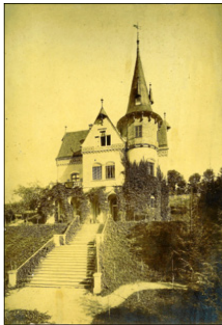
Die Villa Bolin.

Am Geld kann es jedenfalls nicht gelegen haben, dass er der Murg statt der Oos den Vorzug gab, denn Bolins Privatvermögen wurde auf 50 Millionen Goldmark geschätzt, ein „Superreicher“