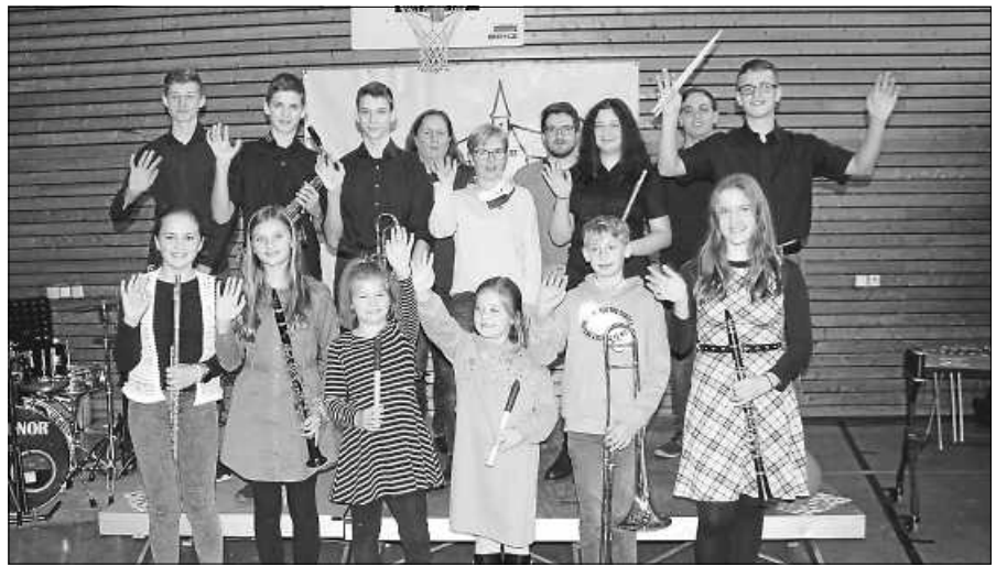
Die Jugendlichen präsentieren ihre Leistung beim Herbstfest.

Der SV Staufenberg und der Förderver- ein SV Staufenberg laden alle Mitglie- der zur Jahreshauptversammlung am Freitag, 17. November 2023, um 19 Uhr in das Gasthaus Sonne ein. Die einzelnen Abteilungen werden ihre Rechenschafts- berichte präsentieren, zudem stehen die Neuwahlen des SVS und des Förderver- eins auf der Agenda. Wir würden uns auf eine zahlreiche Teilnahme freuen.