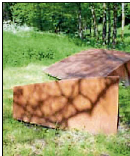
Gert Riel, Flächenspannung 2007, oxydiertes Stahlblech, 110 x 550 x 250 cm.

Gert Riel (*1941 in Prien am Chiemsee) präsentiert seit 2008 seine Arbeit Flächenspannung am Kunstweg am Reichenbach. Ausgangspunkt für die