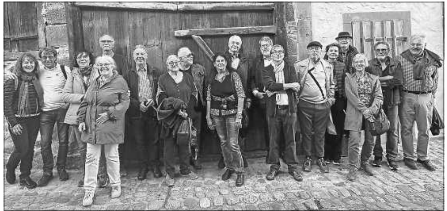
Der Klassenverband Gymnasium Gernsbach 1964-72 besichtigte die Zehntscheuern.

Die Zehntscheuern waren im Oktober Ziel des Klassentreffens von ehemaligen Schülerinnen und Schülern des Gernsbacher Gymnasiums. Einmal jährlich trifft sich der Klassenverband von allen Ehemaligen, die in der Sexta 1964, damals noch im Gernsbacher Progymnasium in dem ehemaligen Pfeffer-Münz-Gebäude (heute Grundschule) starteten und 1972 mit dem Abitur nach der Oberprima im Neubau in der Otto-Hahn-Straße endeten. In diesen Jahren gingen einige Schülerinnen und Schüler ab, andere kamen hinzu, die Kurzschuljahre taten ein Übriges, sodass es insgesamt 79 Ehemalige sind, die diesem Klassen-