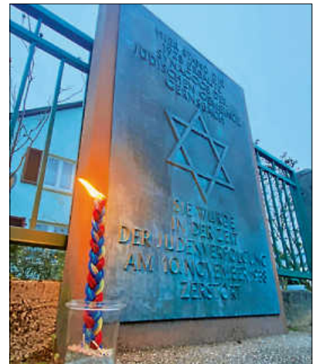
Gedenktafel für die ehemalige Synagoge in der Austraße.

Hinweis: Eine Broschüre zum Sabbatweg Gernsbach ist für 5 € erhältlich bei der Touristinfo Gernsbach. ■