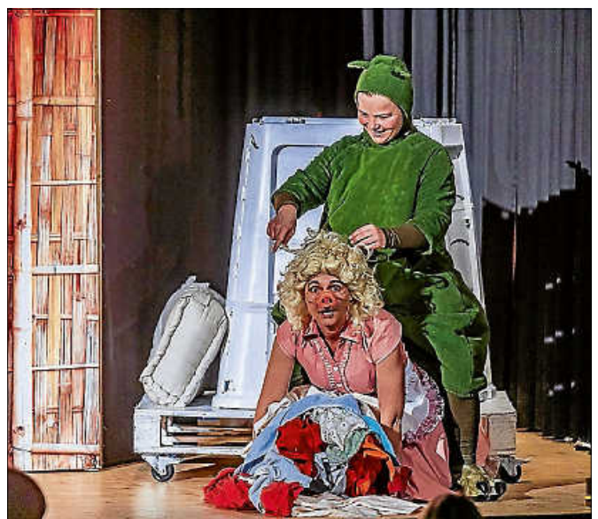
Urmel aus dem Eis.

Eintrittskarten zum Weihnachtsmärchen können Sie auch online unter www.gernsbach.de und www.reservix.de bestellen (zzgl. Service- und Versandgebühren). Dann bekommen Sie Ihr Ticket bequem nach Hause geschickt. Mit der print@home-Funktion drucken Sie Ihre Eintrittskarte sogar direkt zu Hause aus und sparen sich so die Versandkosten und die Wartezeit. Bitte die Altersbeschränkung beachten. Die Veranstaltung findet im großen Saal der Stadthalle Gernsbach statt. Bitte bringen Sie bei Bedarf eine Sitzerrhöhung mit. ■