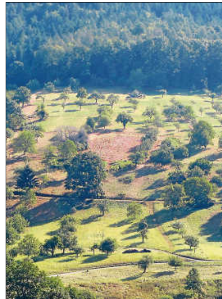
Neue Flurordnung wird erarbeitet.

Adresse „ flurneuordnung@landkreis-rastatt.de “ geschickt werden. ■