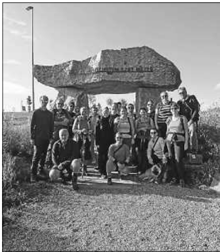
Hockey-Club Gernsbach am Feldberg.

Nach der Anreise und dem Abendessen verbrachte man einen gemütlichen Abend mit Spielen und guten Gesprächen. Nach dem Frühstück ging es bei bestem Wanderwetter auf den Feldbergsteig. Auf dem Gipfel des Feldberges wurde ein gemeinsames Picknick abgehalten. Die Aussicht reichte von dort bis in die Alpen. Die auf der Wegstrecke liegenden Hütten wurden ebenfalls besucht und man stärkte sich mit Getränken oder Kaffee und Kuchen. Den Abend ließ man wieder in geselliger Runde ausklingen. Am nächsten Morgen ging es nach Todtnau. Unser dortiges Ziel war der Wasserfall, der mit 97 Metern Höhe Deutschlands höchster natürlicher Wasserfall ist. Überragt wird er von der erst in diesem Frühjahr eröffneten „Blackforest-Line“, einer spektakulären Hängebrücke. Auch diese wurde von ein paar Mitgliedern bewältigt. Den Abschluss machte ein gemeinsames Essen in Todtnau, bevor die Heimreise angetreten wurde. Ein rundum gelungenes Wochenende ging zu Ende.