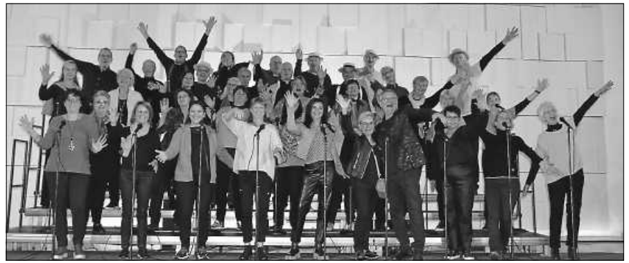
Salt o vocale in Partylaune vor dem Jubiläumskonzert.