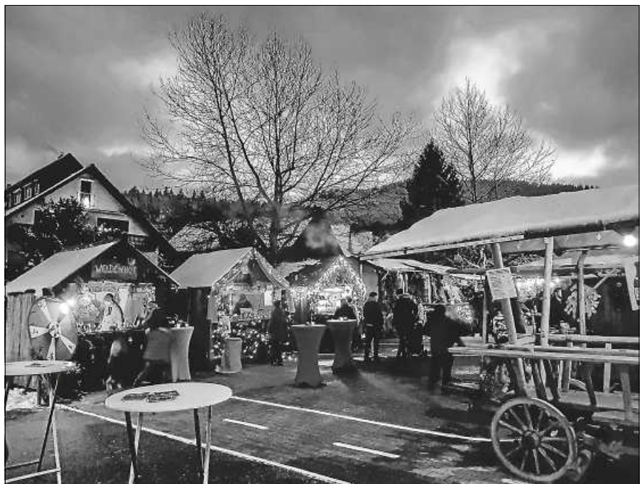
Auf dem Weihnachtsmarkt gibt es allerlei zu kaufen.