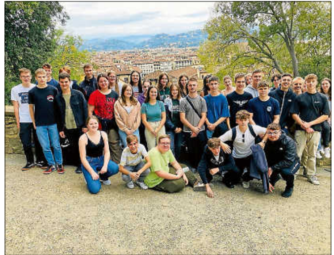
Blick auf Florenz.

fahrer kehrten mit einer Fülle an Erfahrungen nach Hause zurück. Und selbst wenn das Leben manchmal genauso schief sein kann wie der Turm von Pisa, ist klar: Aus solchen Erlebnissen werden häufig die nachhaltigsten Erinnerungen. Die zweite, ebenfalls erfolgreiche Studienfahrt des Gymnasiums, ging mit einer kleineren Gruppe nach Dublin. ■