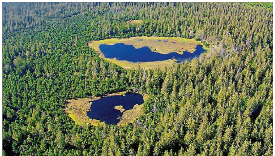
Die Moore auf dem Kaltenbronn.

intakt sein und weiter wachsen. Die Veranstaltung ist kostenfrei und wird online veranstaltet. Die Teilnehmenden erhalten nach Anmeldung unter www.infozentrum-kaltenbronn.de/kalender einen Zugangslink. ■