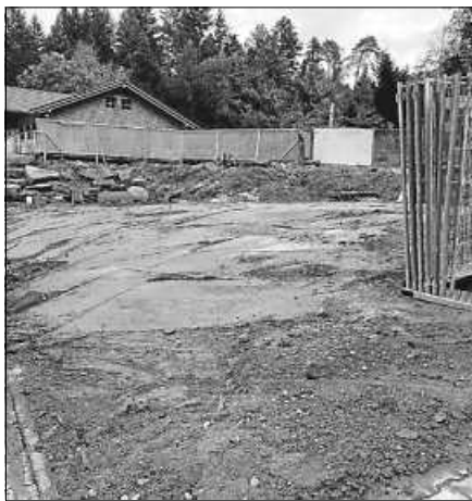
Das alte SVS-Clubhaus ist Geschichte!

Was in den 1970er Jahren von zahl- reichen und ehrenhaften Mitgliedern durch mühevollen Handarbeit erschaffen wurde - hat in der letzten Woche eine einzige Baggerschaufel binnen weniger Tage zunichtegemacht! Nach ziemlich genau 50 Jahre ist das alte Clubhaus des SVS nun Geschichte. Kein Stein steht mehr, was bleibt ist etwas Wehmut und die Erinnerung an 5 bewegende Jahrzehnte. Fotos und Erzählungen werden in die Historie eingehen. So mancher Staufenberger Sportler hat nun 3 Clubhäuser erleben können, die mit einer Holzbaracke ihren Anfang in den 50/60er Jahren nahm und nun mit der Auwiesenhütte als neue sportliche Heimstätte die Zukunft weiter schreiben wird - und das im 100-jährigen Jubilä- umsjahr!