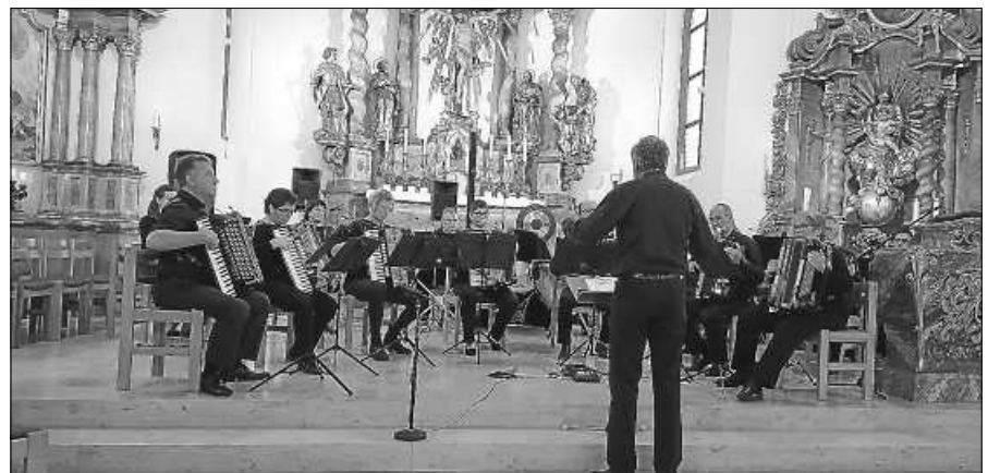
Wunderschöne Musik in einer grandiosen Kulisse.